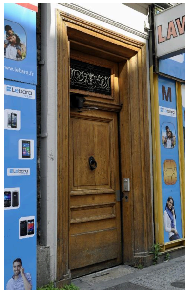
Elévation sur la rue de Marseille : porte piétonne IVR82_20156901080NUCA