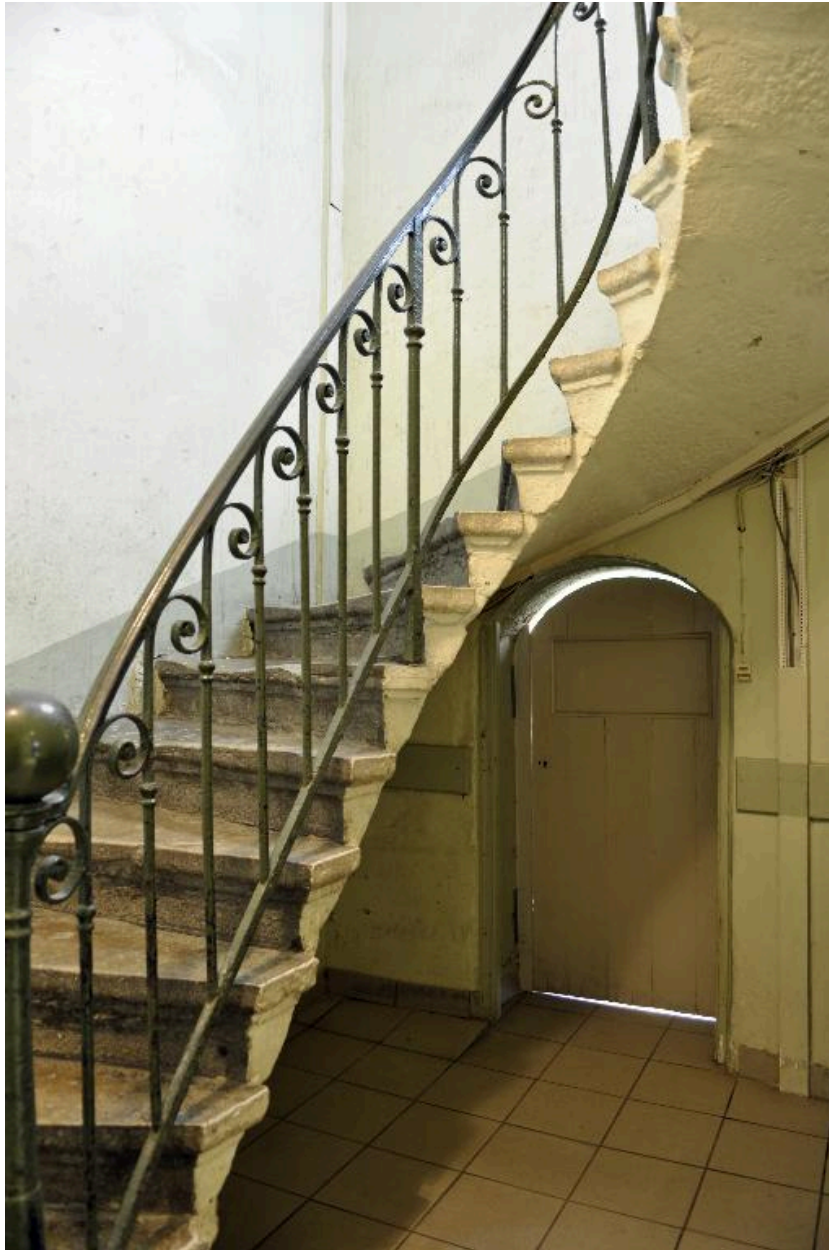
Vue intérieure : l'escalier et la porte de la cour