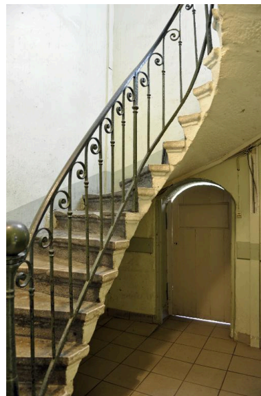
Vue intérieure : l'escalier et la porte de la cour IVR82_20156901083NUCA