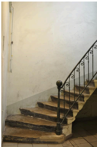
Vue intérieure : le départ de l'escalier