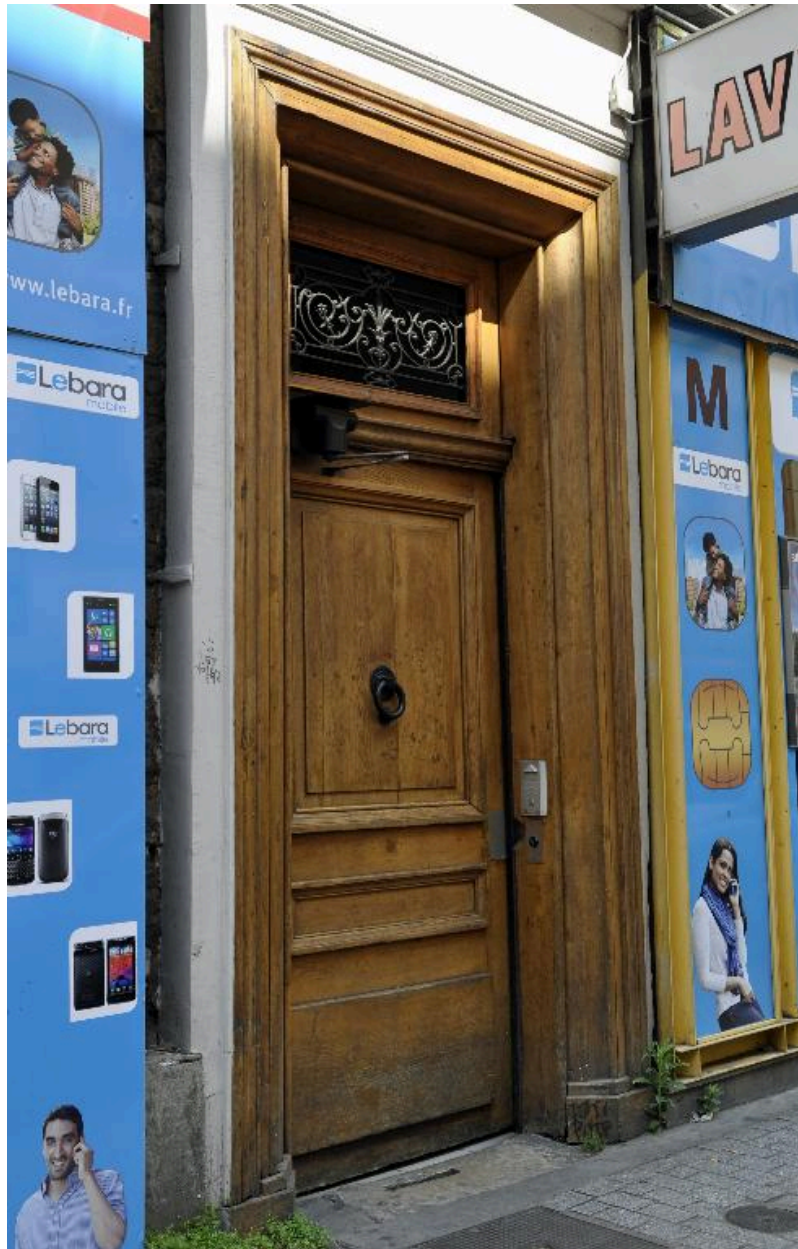
Elévation sur la rue de Marseille : porte piétonne