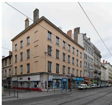
Vue d'ensemble IVR84_20166901416NUCA