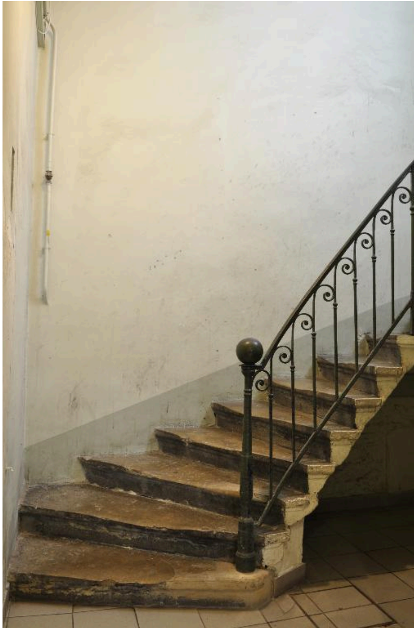
Vue intérieure : le départ de l'escalier