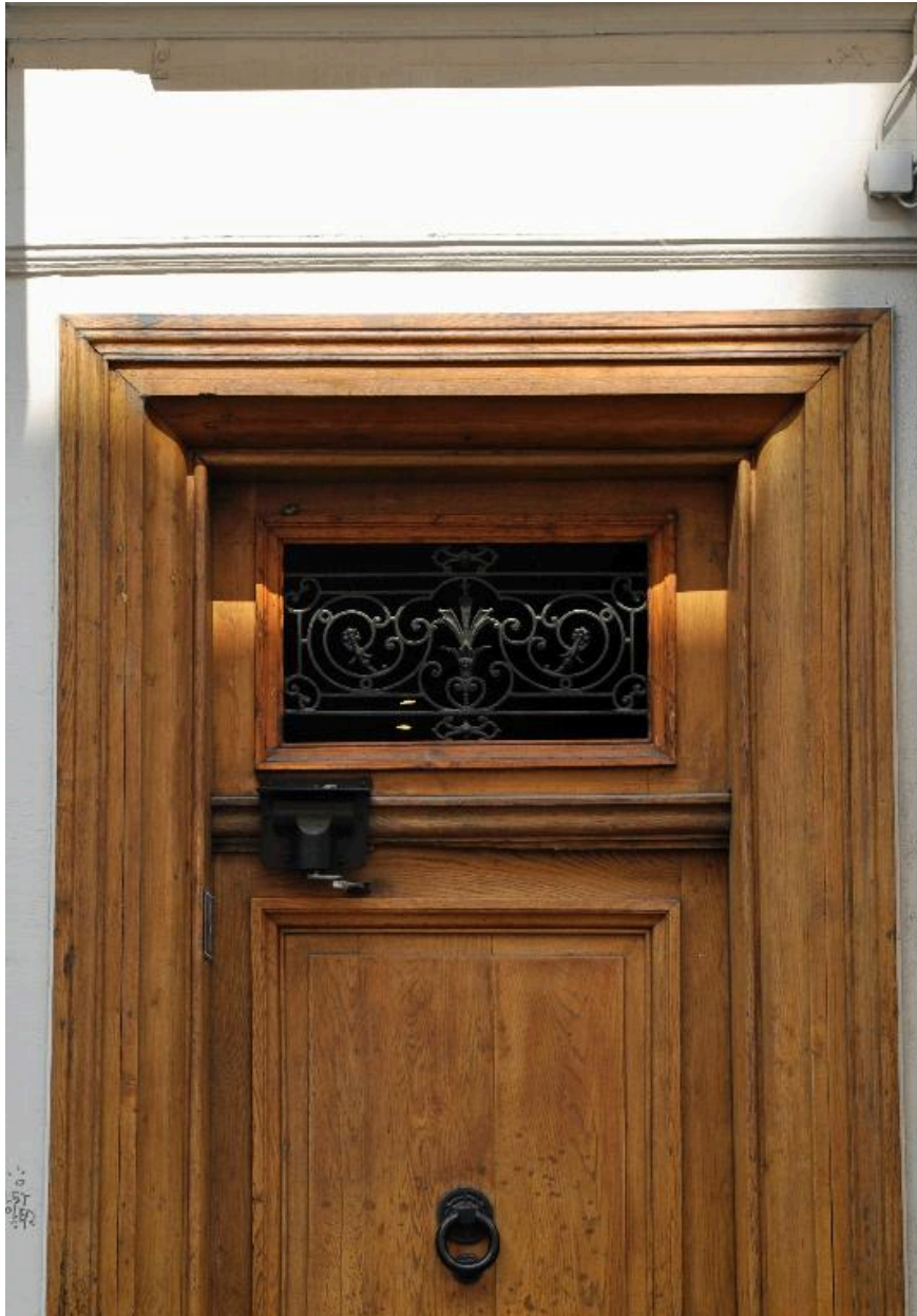
Détail de la porte : imposte en ferronnerie