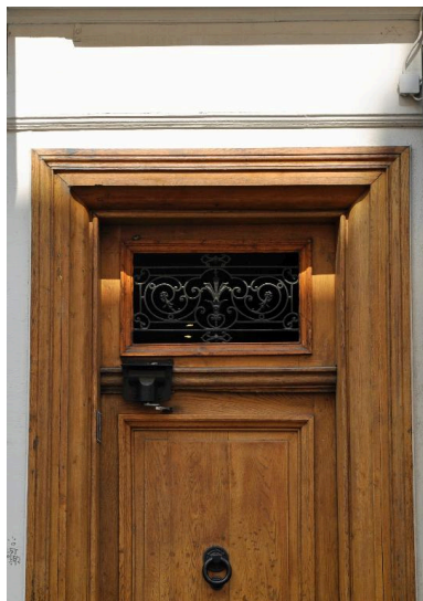
Détail de la porte : imposte en ferronnerie