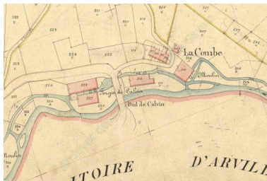
Premier cadastre français, Presle, 1892, Section A, feuille 1 (FR.AD073, 3P 7204). IVR82_20147302885NUCA