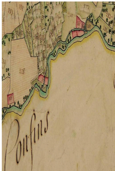
Cadastre de 1728, Presle, 1732 254, Vue 11 (FR.AD073, C3685). IVR82_20147302884NUCA