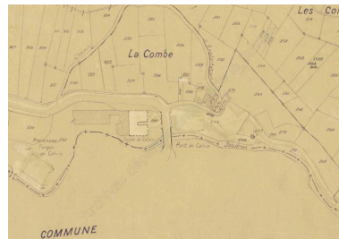
Cadastre rénové, Presle, 1935/1988, Section A, feuille 1 (FR.AD073, 3P 7205). IVR82_20147302886NUCA