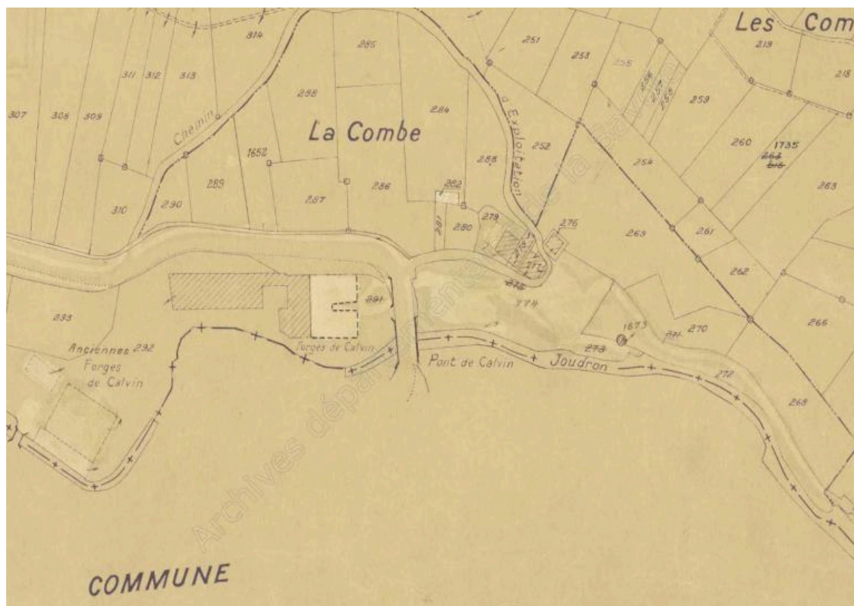
Cadastre rénové, Presle, 1935/1988, Section A, feuille 1 (FR.AD073, 3P 7205).