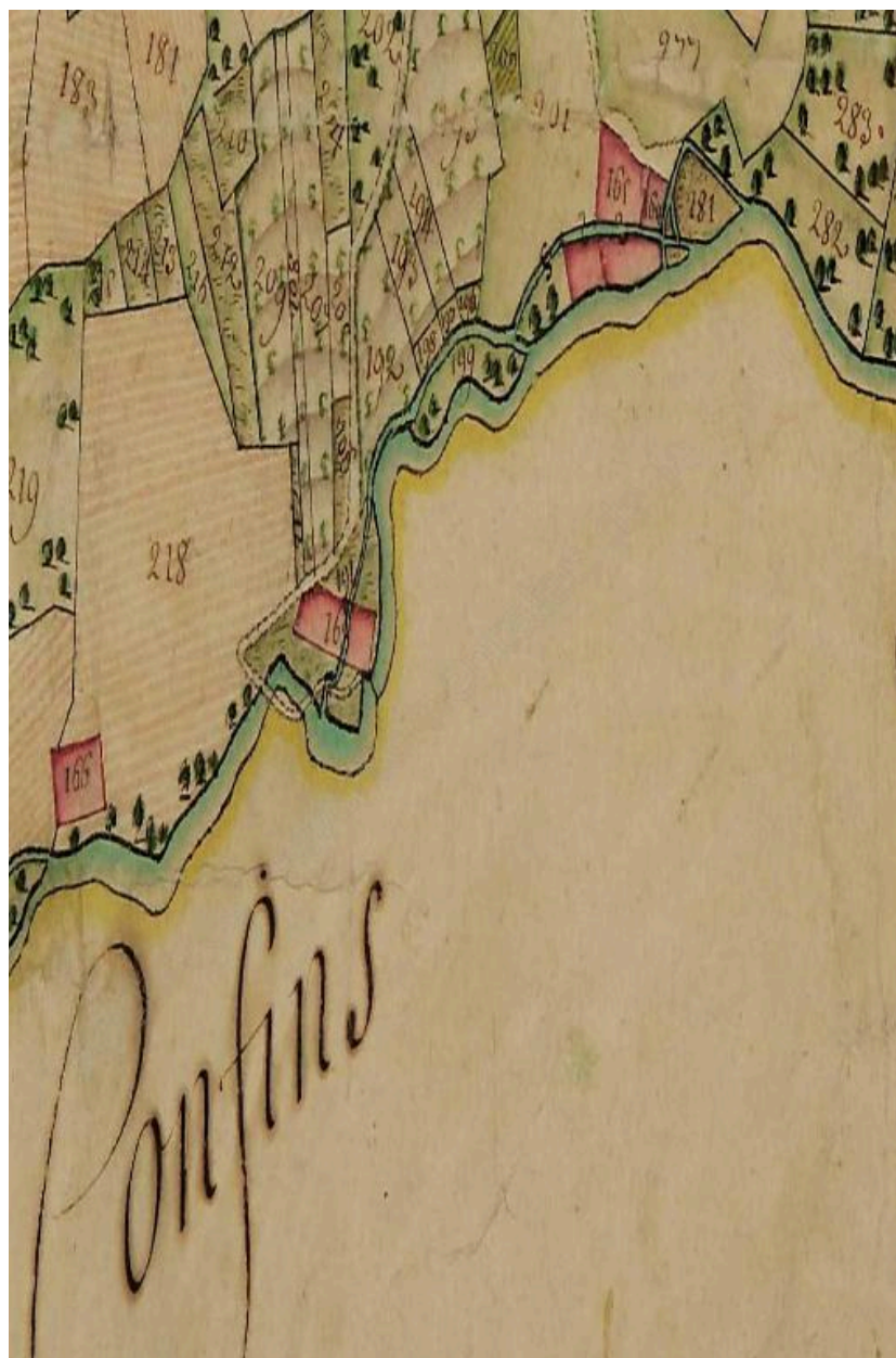
Cadastre de 1728, Presle, 1732 254, Vue 11 (FR.AD073, C3685).