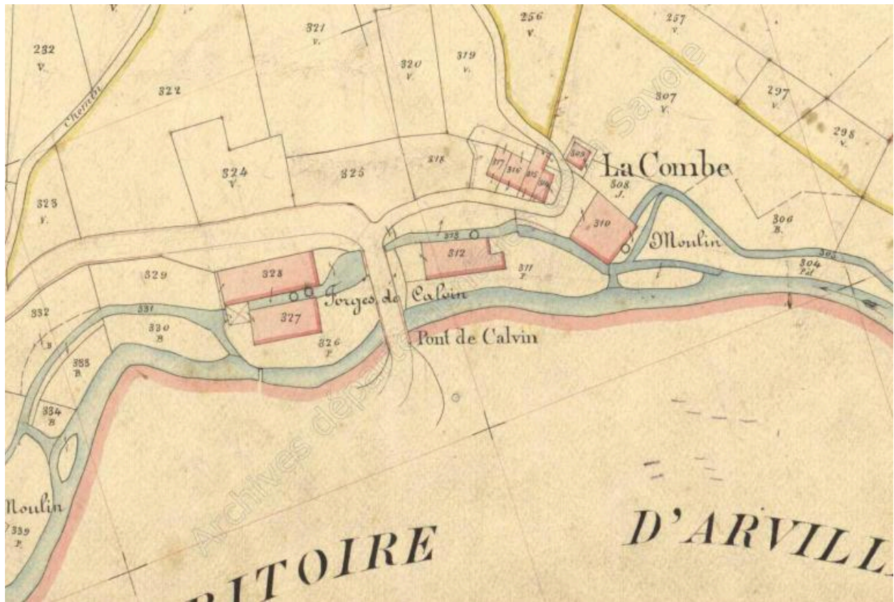
Premier cadastre français, Presle, 1892, Section A, feuille 1 (FR.AD073, 3P 7204).