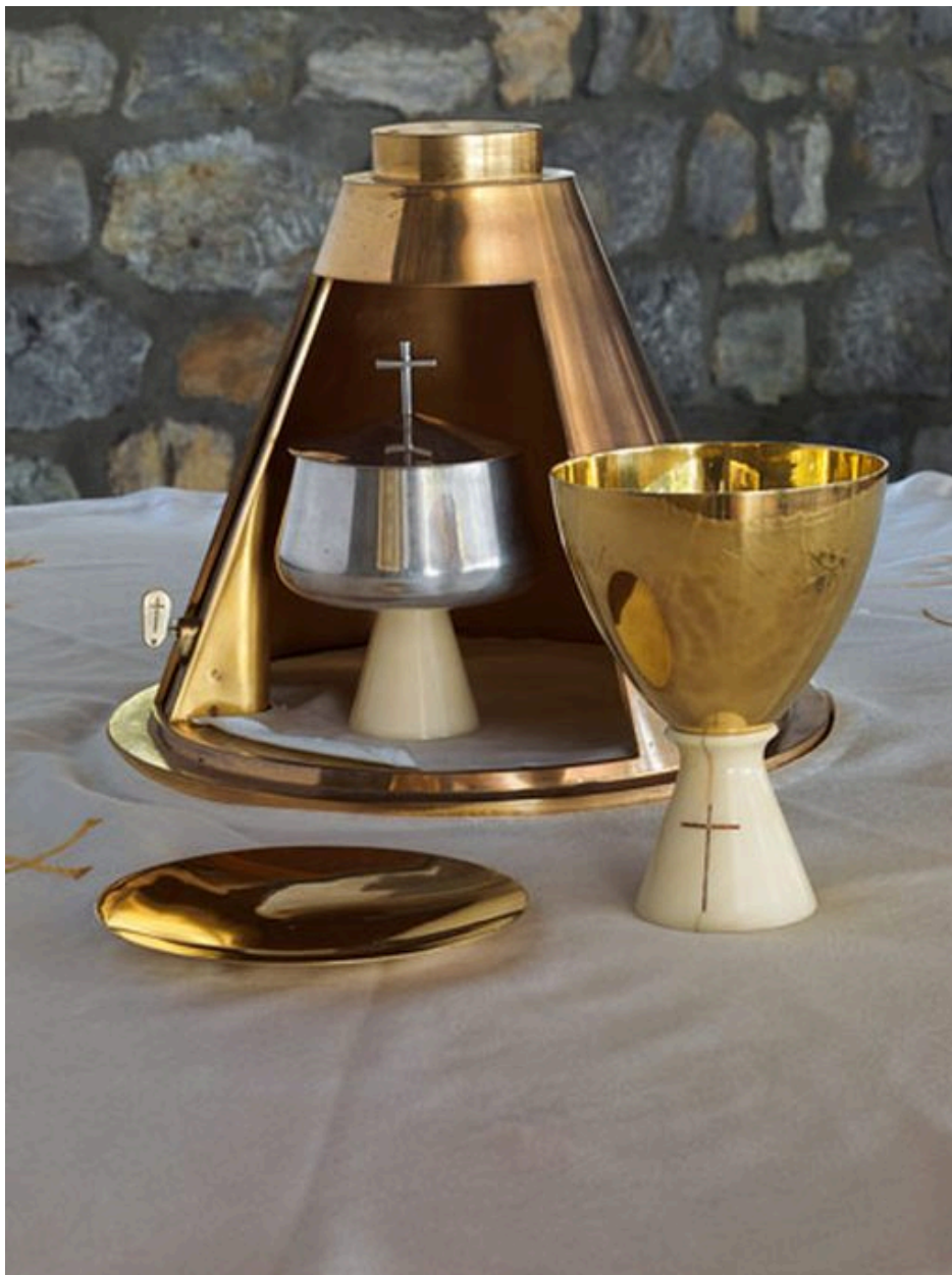
Le tabernacle ouvert vu de 3/4