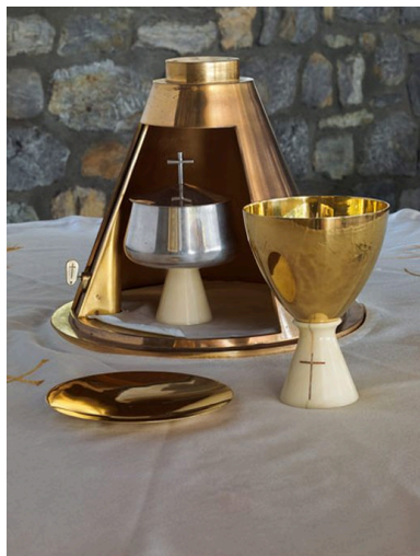
Le tabernacle ouvert vu de 3/4 IVR82_20107304973NUCA