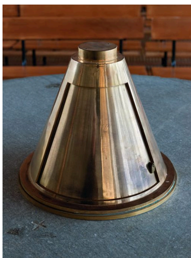
Le tabernacle fermé