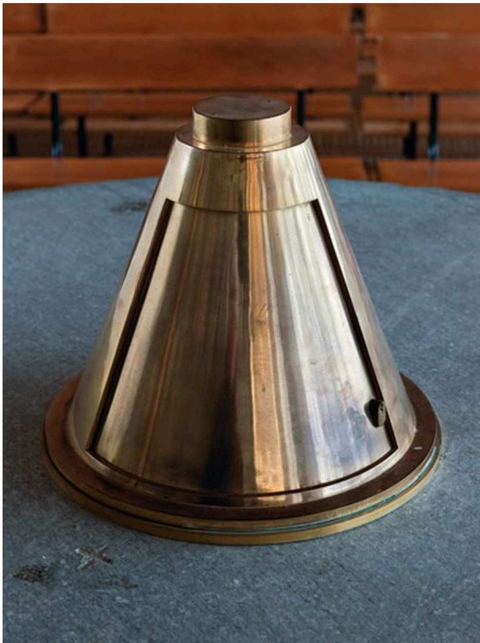
Le tabernacle fermé