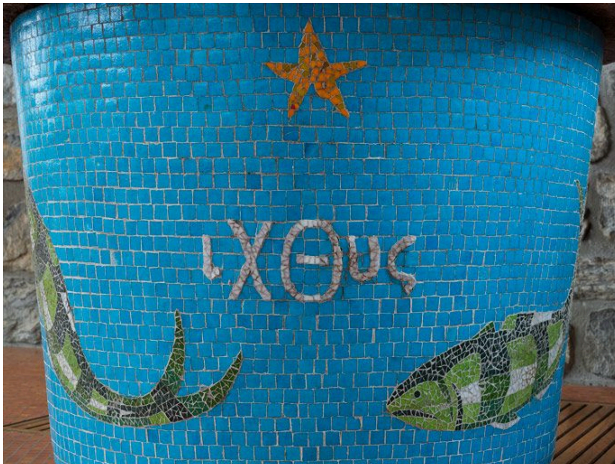
Détail de la mosaïque de l'autel