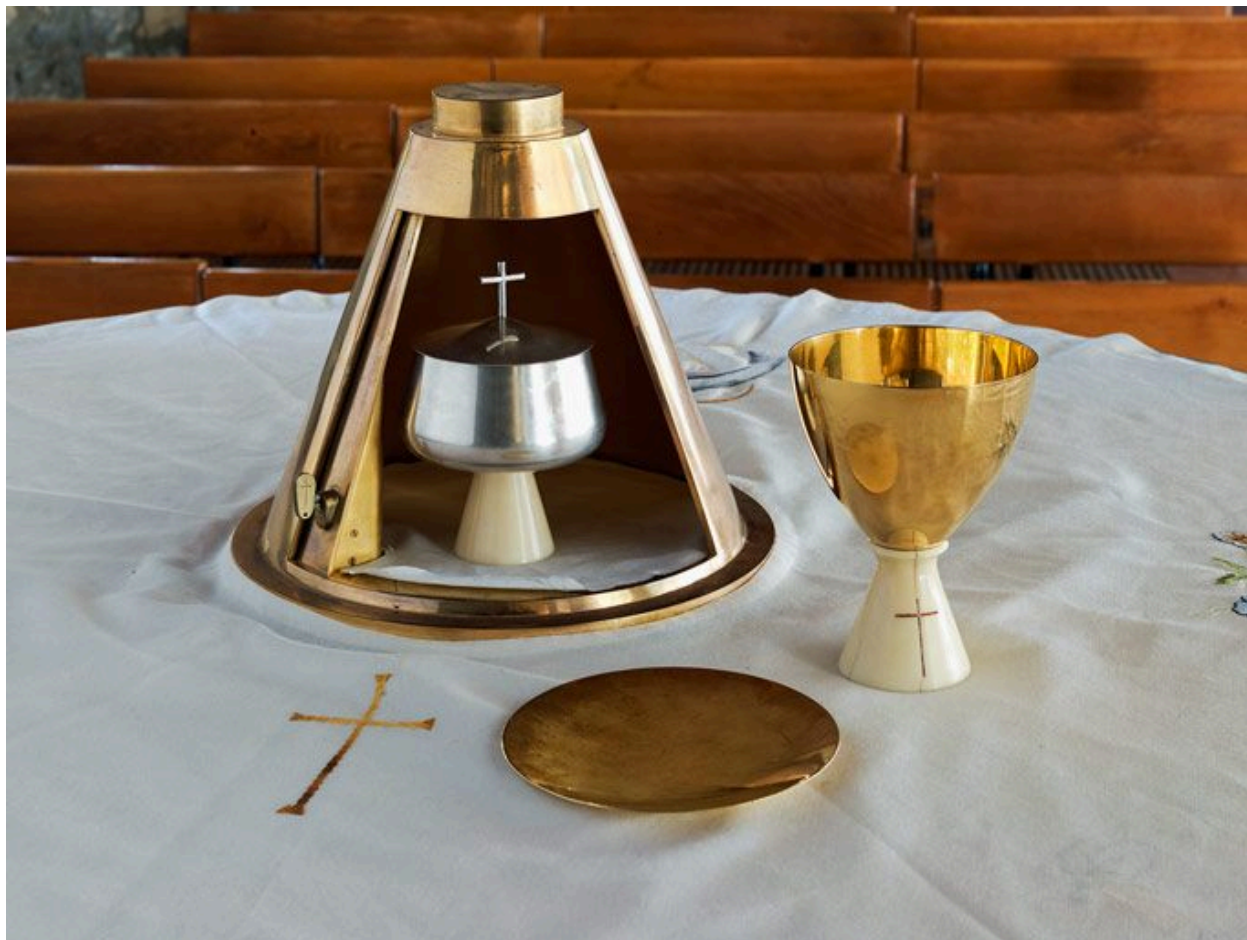
Le tabernacle ouvert