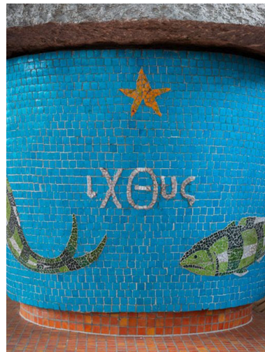
Détail de la mosaïque de l'autel