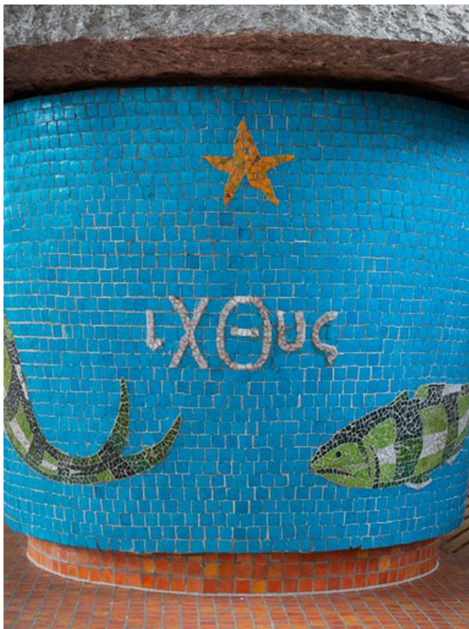
Détail de la mosaïque de l'autel