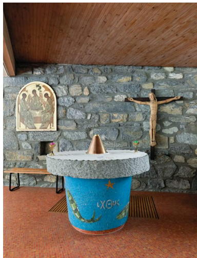
Vue générale IVR82_20107303852NUCA