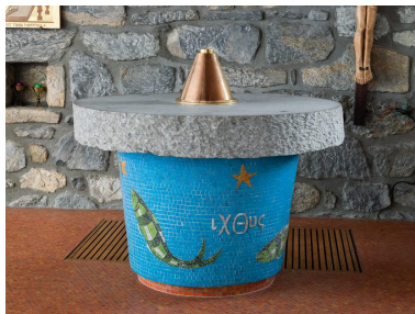
L'autel