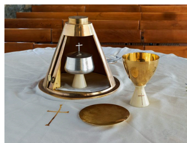
Le tabernacle ouvert