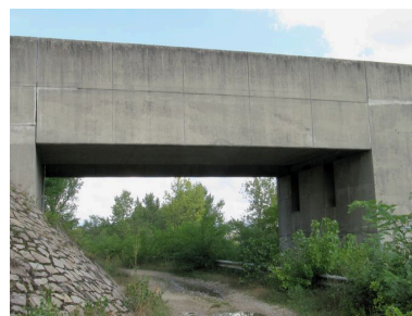
Pont-cadre, formant culée passante, rive droite, face aval IVR82_20103800059NUCA