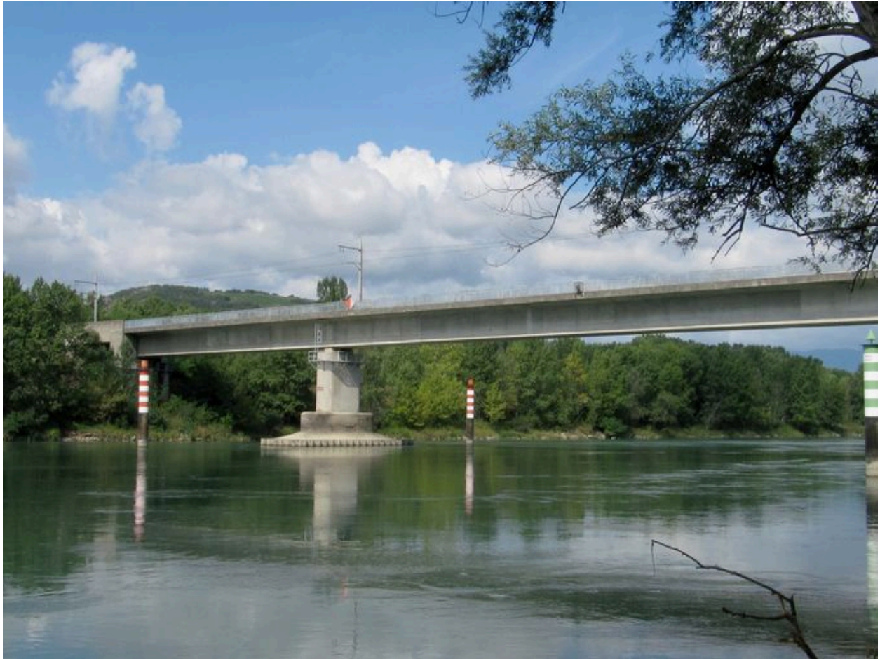
Vue générale, face aval (depuis la rive gauche)