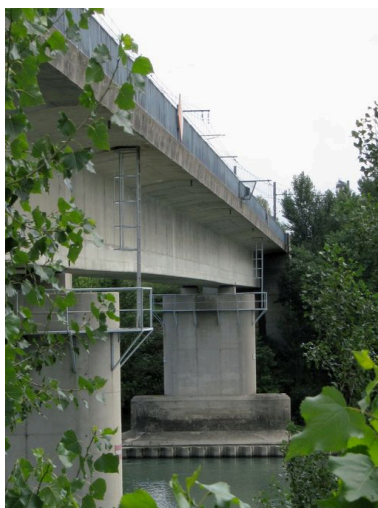
Tablier, vue partielle (depuis la rive droite, face aval) IVR82_20103800060NUCA