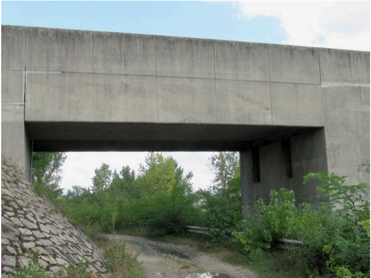
Pont-cadre, formant culée passante, rive droite, face aval