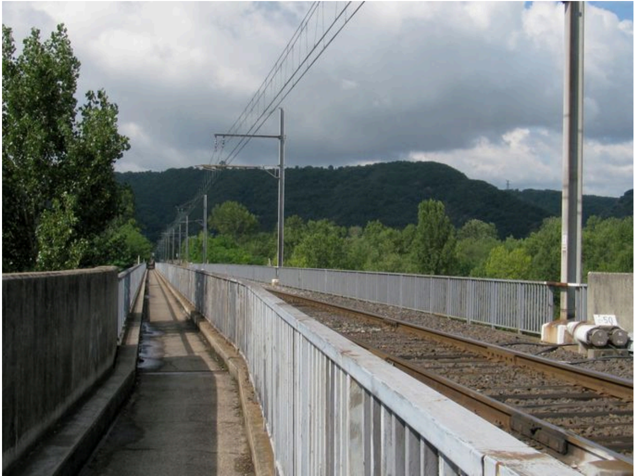
Voie piétonne et voie ferroviaire (depuis la rive gauche)