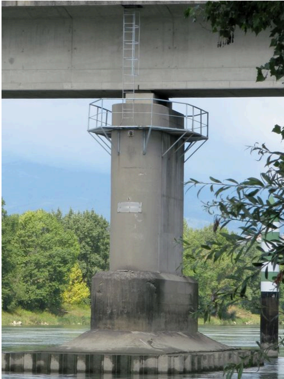
Pile, face aval (depuis la rive gauche)