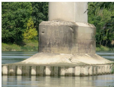
Soubassement d'une pile (depuis la rive gauche, face aval) IVR82_20103800064NUCA