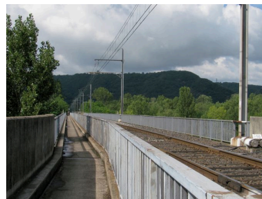
Voie piétonne et voie ferroviaire (depuis la rive gauche)