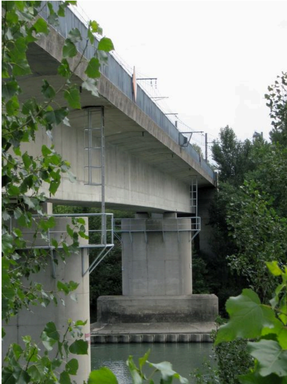
Tablier, vue partielle (depuis la rive droite, face aval)