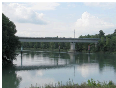
Vue générale, face amont (depuis la rive gauche) IVR82_20103800061NUCA