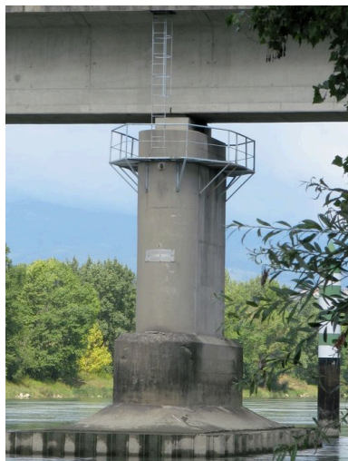
Pile, face aval (depuis la rive gauche) IVR82_20103800063NUCA