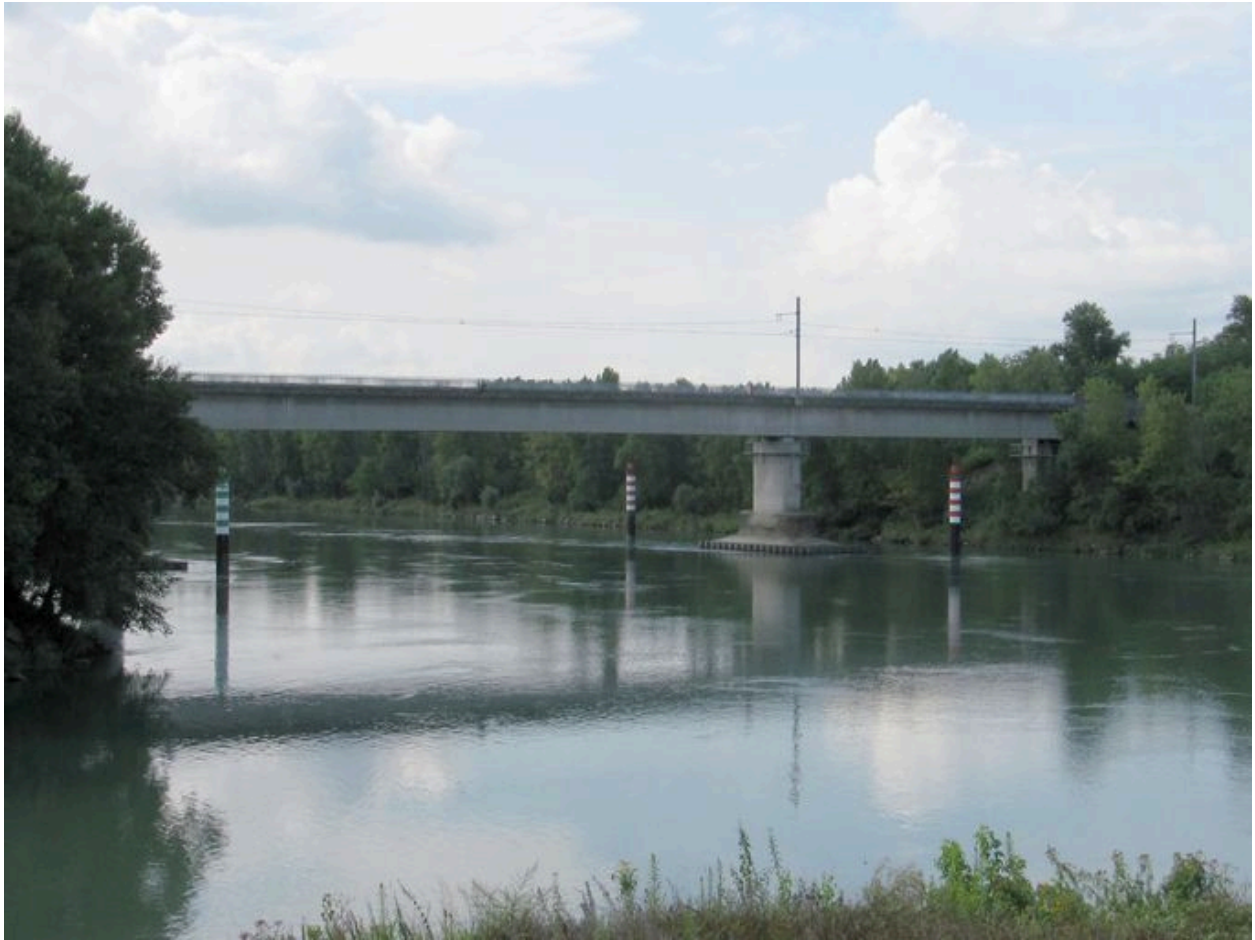
Vue générale, face amont (depuis la rive gauche)