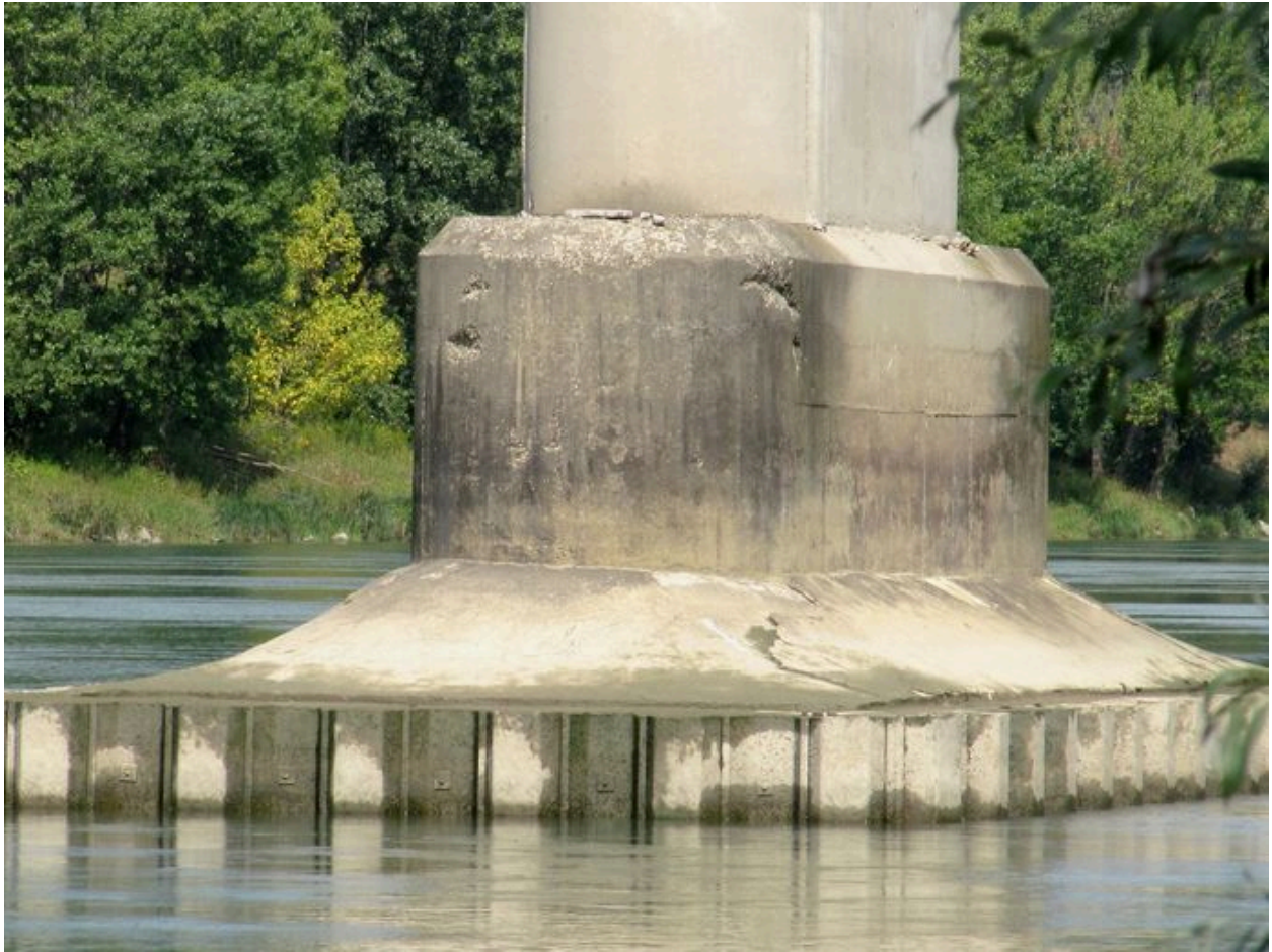
Soubassement d'une pile (depuis la rive gauche, face aval)