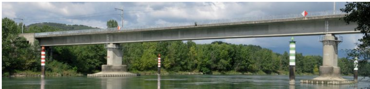
Vue panoramique, face aval (depuis la rive gauche)