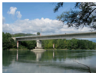
Vue générale, face aval (depuis la rive gauche) IVR82_20103800062NUCA