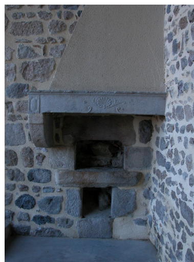
Vue de la cheminée avec four à pain. IVR82_20124202265NUCA