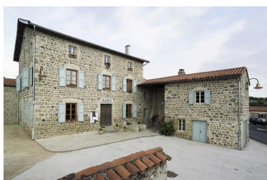
Vue générale. IVR82_20074200127NUCAQ