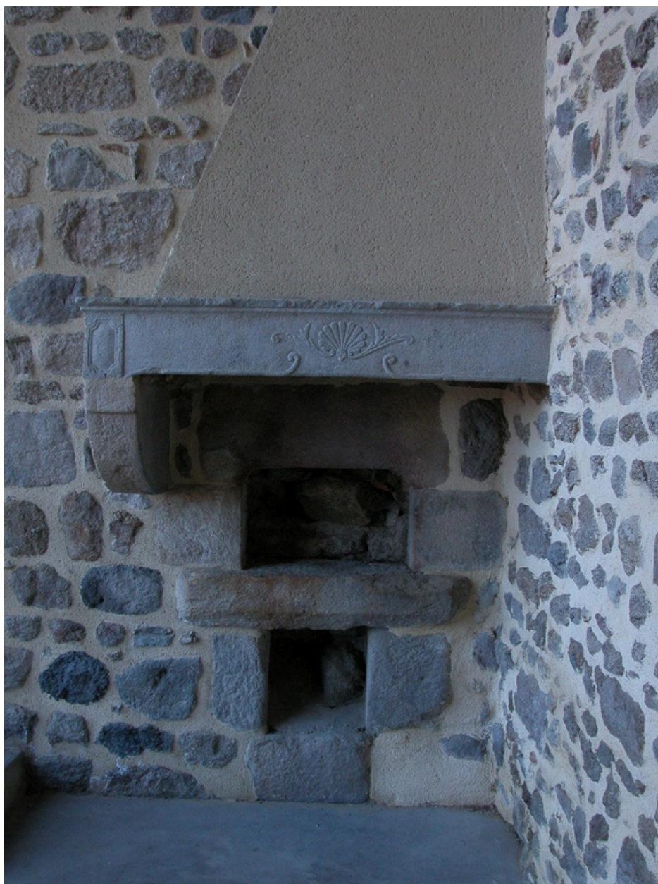
Vue de la cheminée avec four à pain.