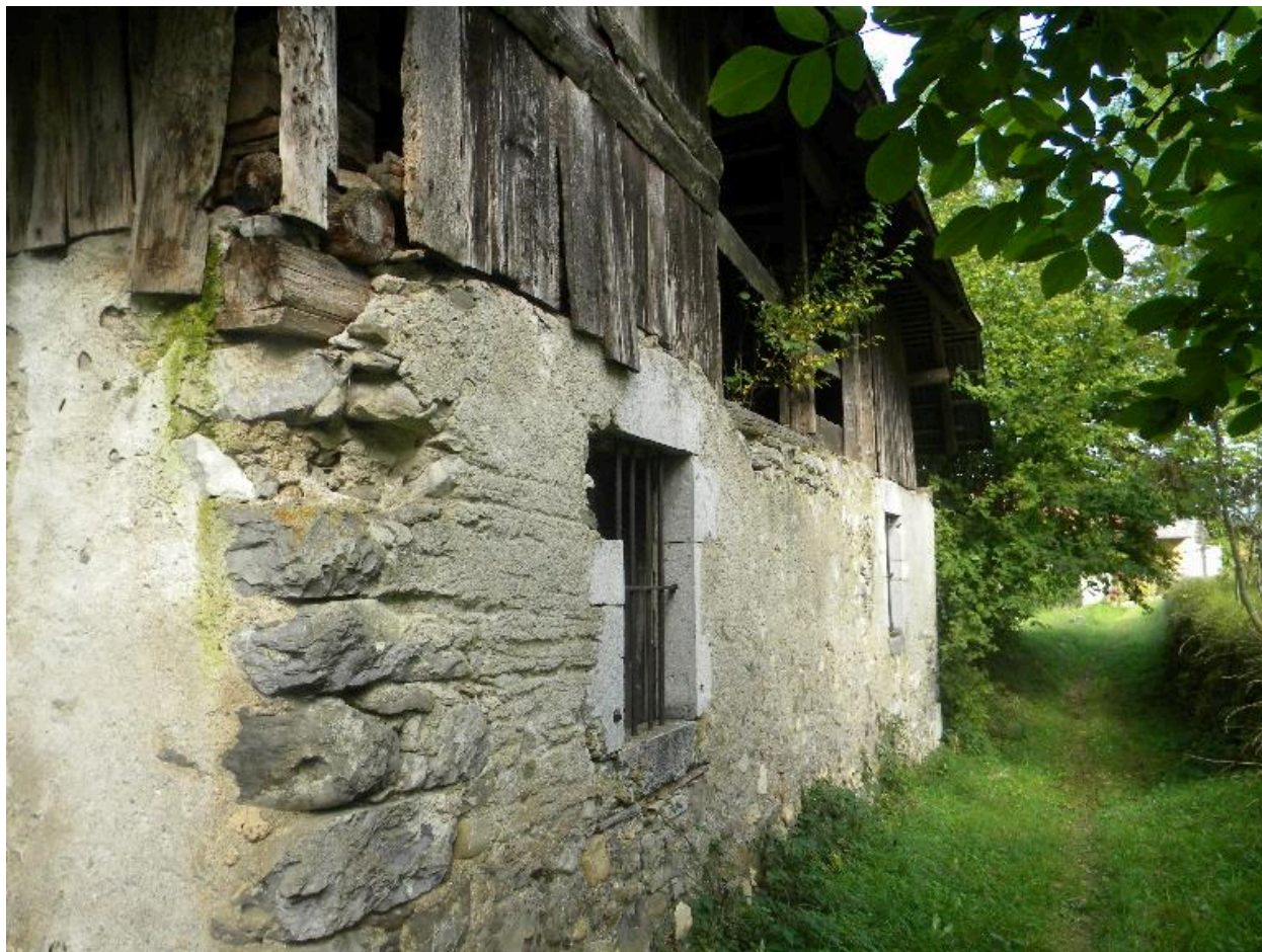
Vue du pignon est.