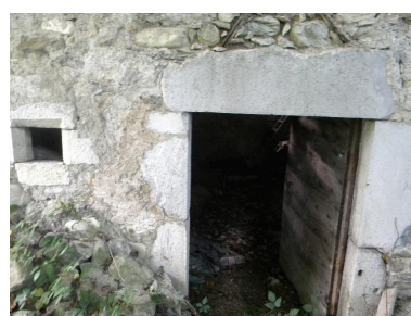
Vue d'une porte de cave en contrebas du chemin. IVR82_20157401764NUCA