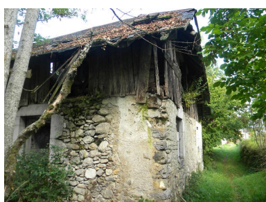
Vue d'ensemble. IVR82_20157401763NUCA