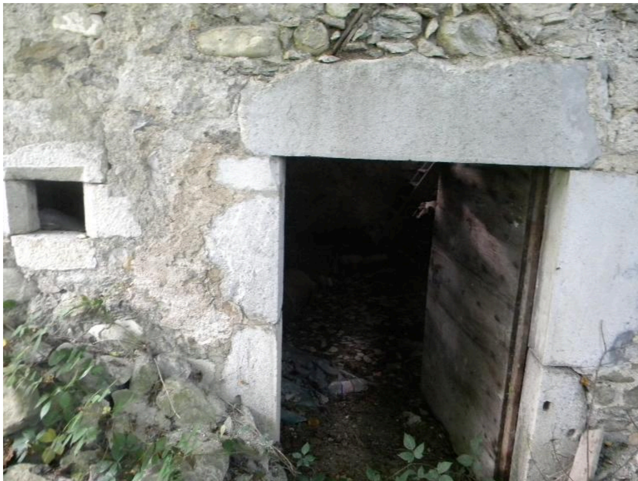
Vue d'une porte de cave en contreas du chemin.