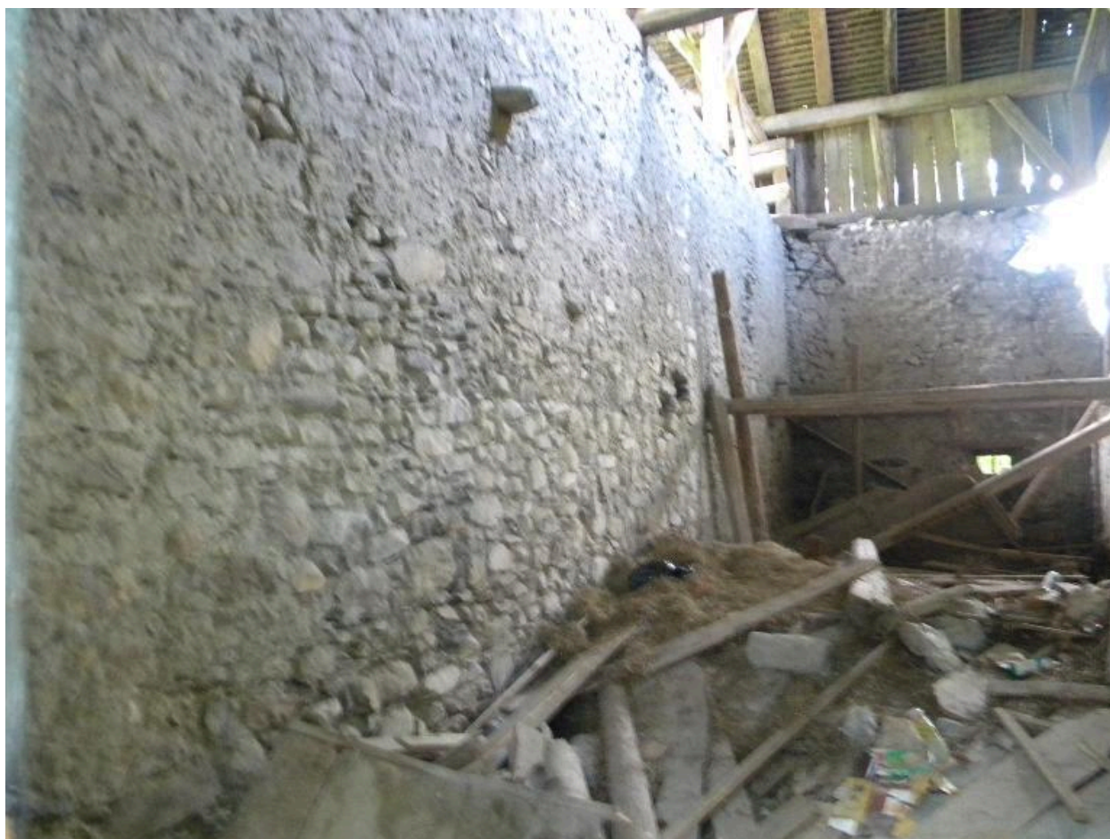
Vue d'une pièce intérieure