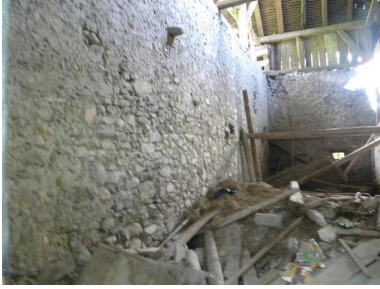
Vue d'une pièce intérieure IVR82_20157401765NUCA