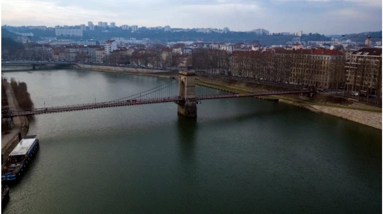
Vue d'ensemble nord-est du pont Masaryk (drône)