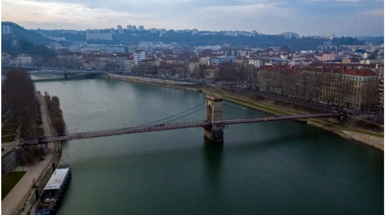
Vue d'ensemble nord-est du pont Masaryk (drône)