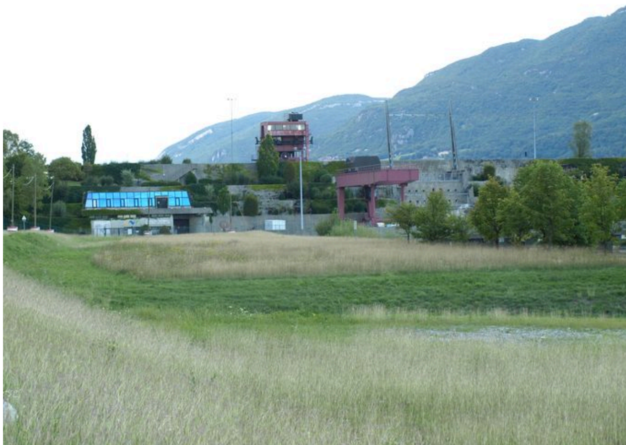
Vue générale, face amont