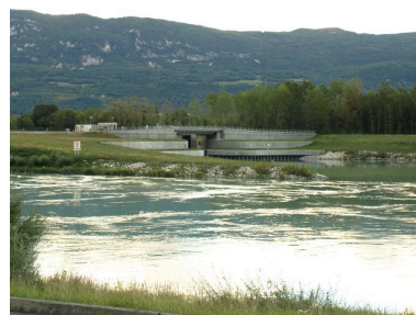
Vue générale, face aval