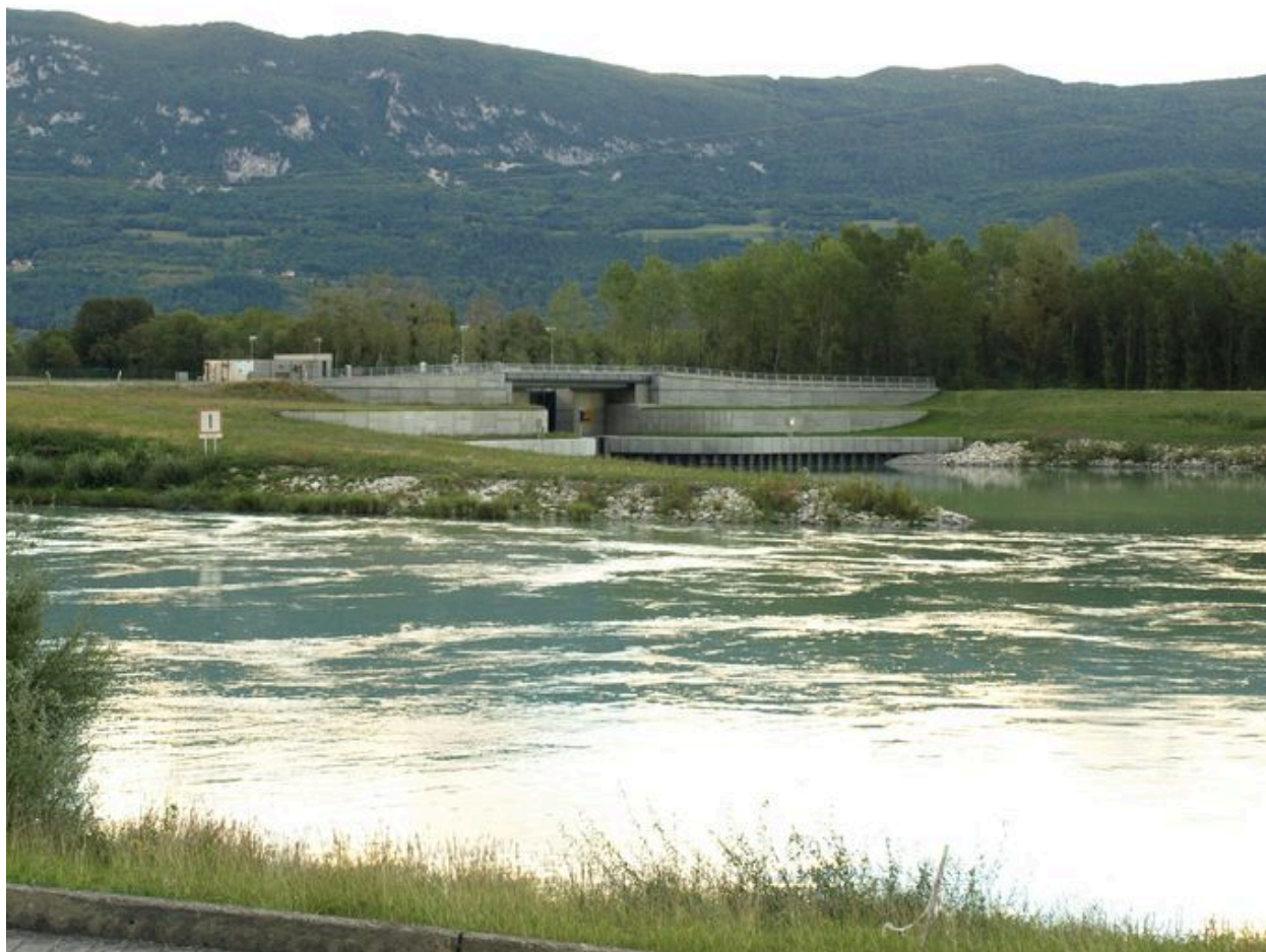
Vue générale, face aval