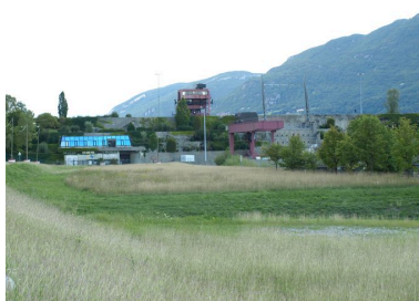
Vue générale, face amont IVR82_20100100157NUCA