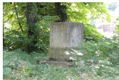
Vestiges conservés : faces nord et est du socle.