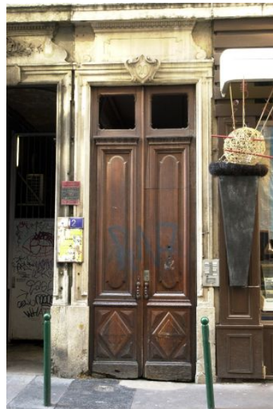
Façade sur rue, détail de la porte IVR82_20046900307NUCA