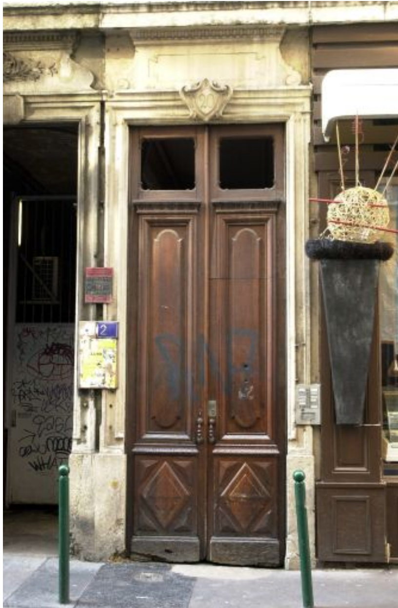
Façade sur rue, détail de la porte