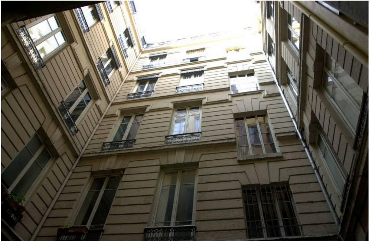
Cour, vue générale des façades