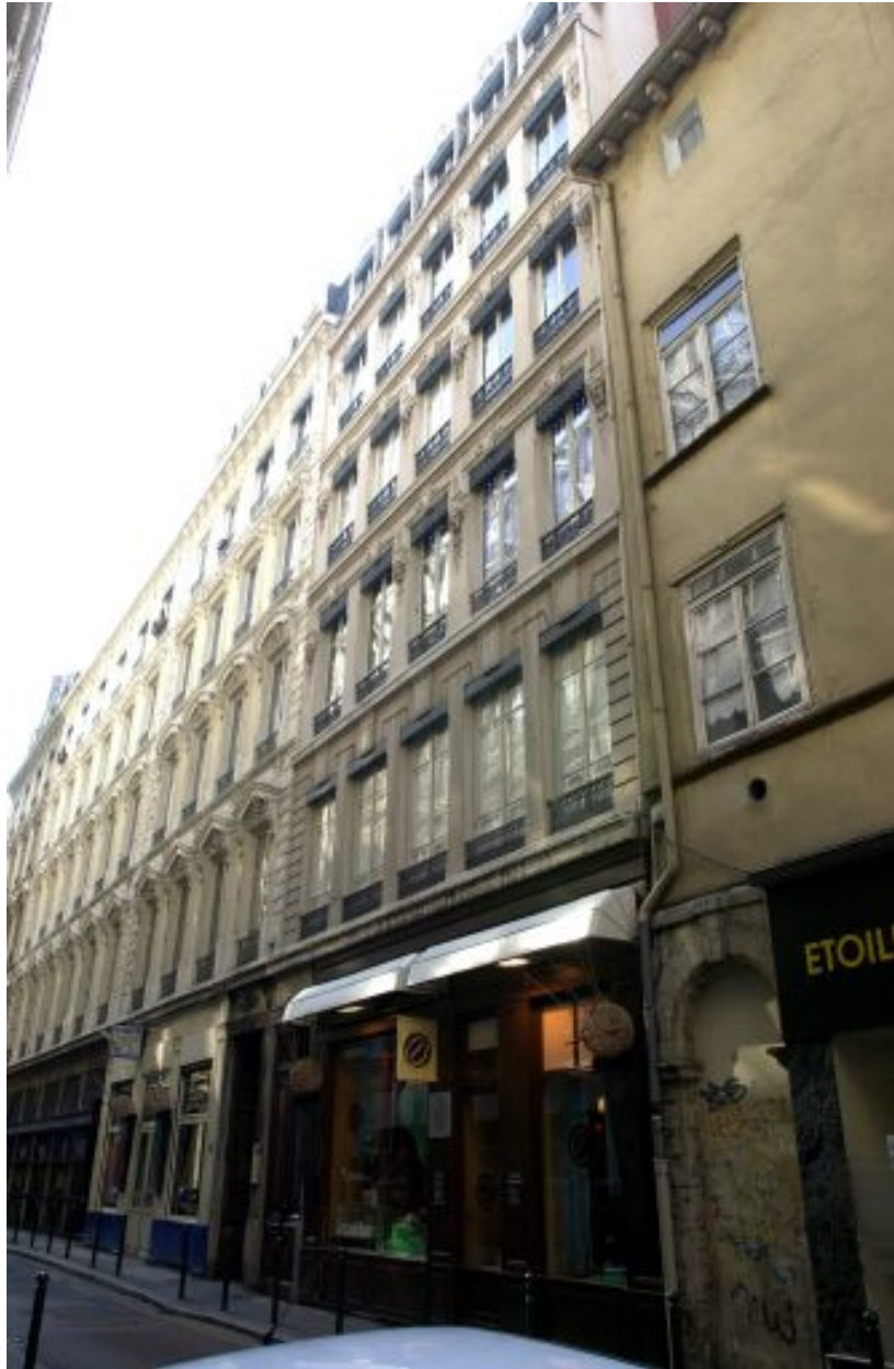
Vue générale de la façade sur rue