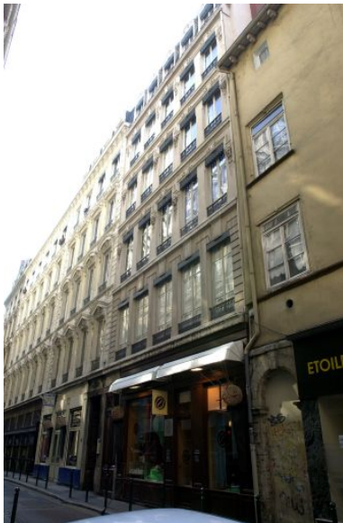
Vue générale de la façade sur rue IVR82_20046900305NUCA