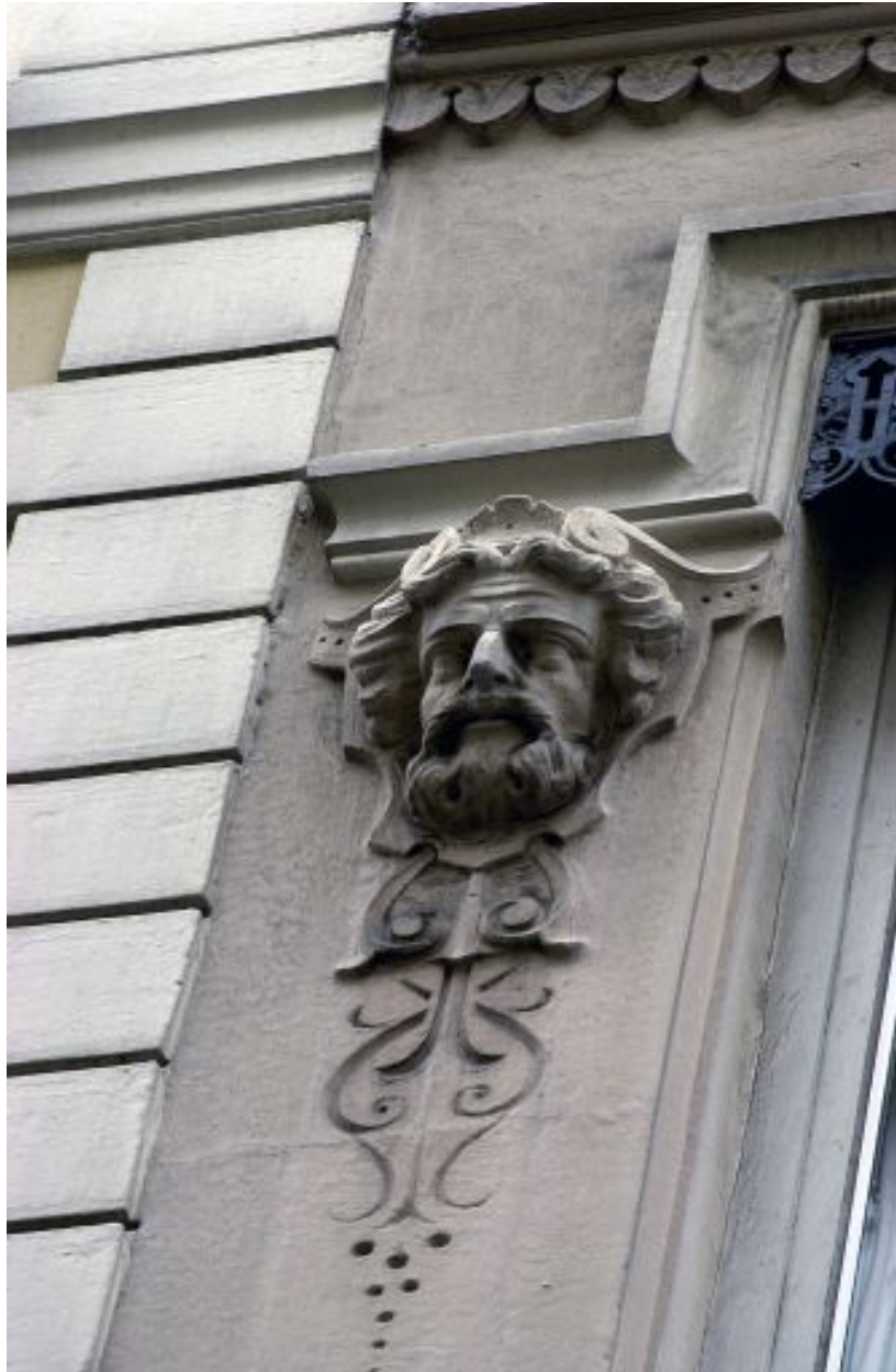
Façade sur rue, 2e étage, détail du premier mascaron en partant de la gauche