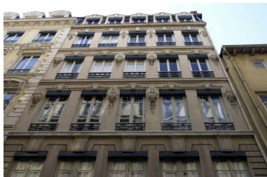
Façade sur rue, vue générale des étages carrés IVR82_20046900306NUCA