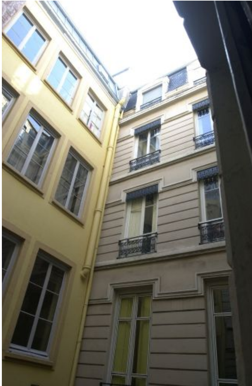
Façade en fond de cour