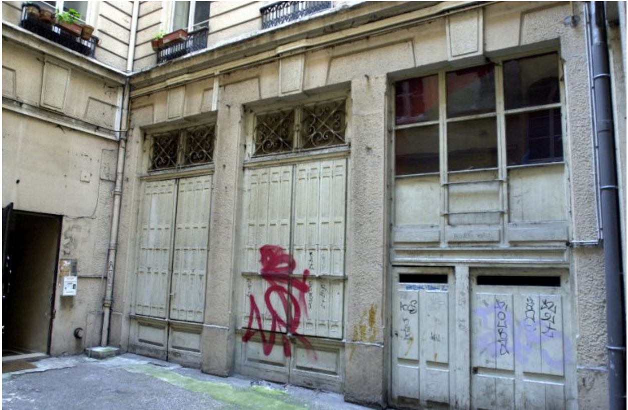
Cour, 1er niveau vu depuis le débouché de l'allée