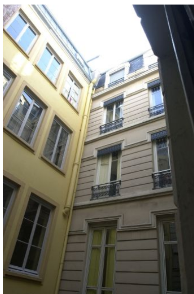
Façade en fond de cour