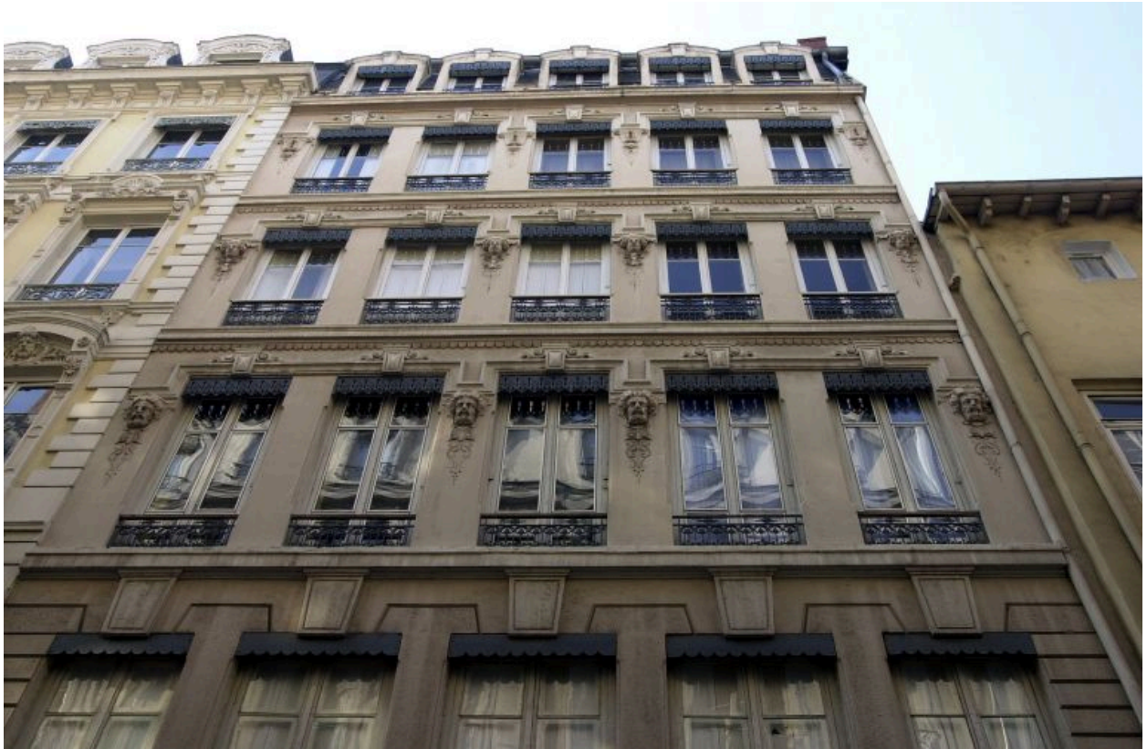
Façade sur rue, vue générale des étages carrés