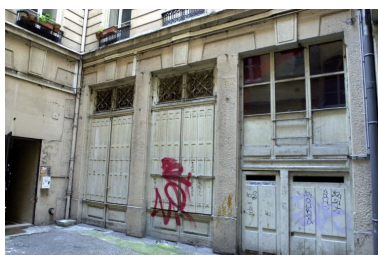
Cour, 1er niveau vu depuis le débouché de l'allée IVR82_20046900312NUCA