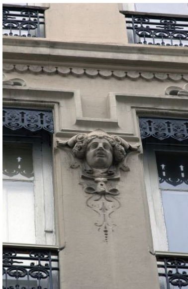
Façade sur rue, 3e étage, détail du 3e mascarone en partant de la gauche IVR82_20046900309NUCA