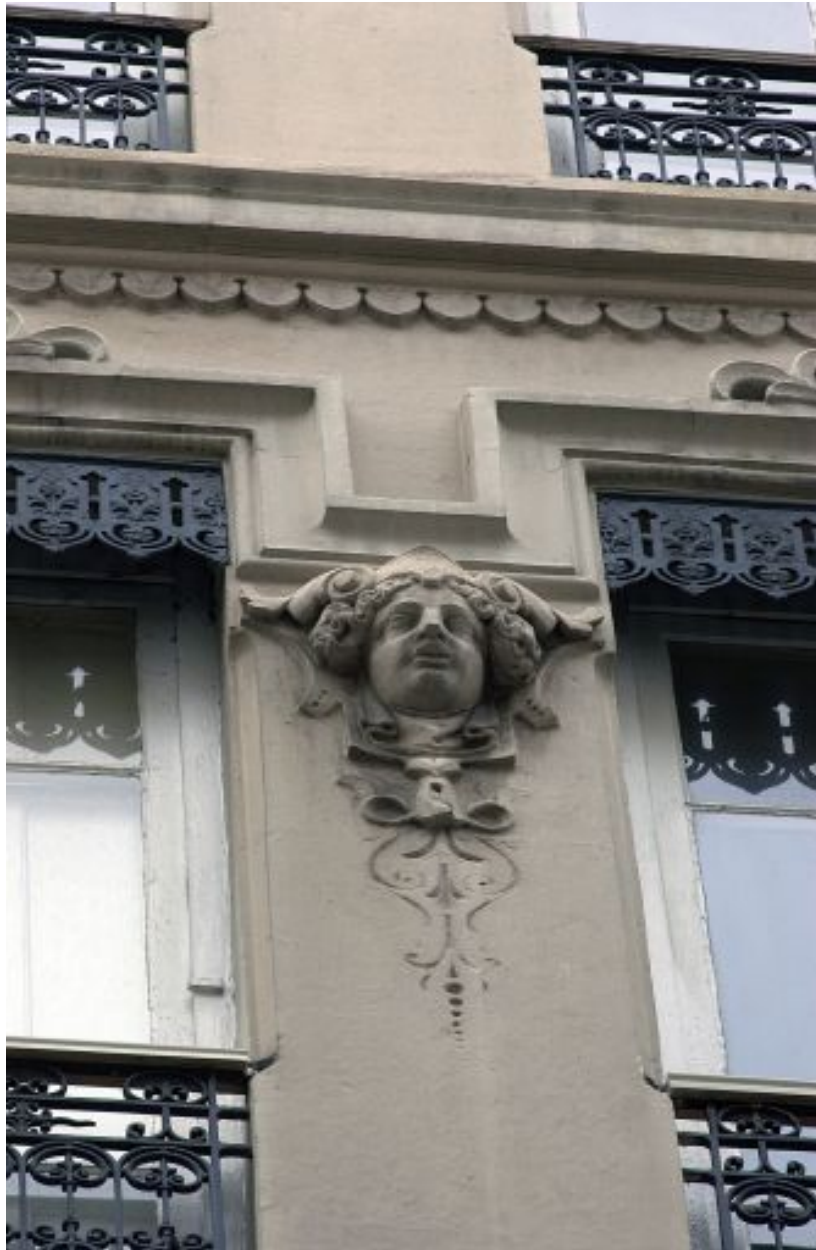
Façade sur rue, 3e étage, détail du 3e mascaron en partant de la gauche