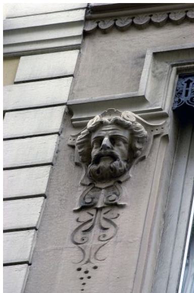
Façade sur rue, 2e étage, détail du premier mascarone en partant de la gauche IVR82_20046900308NUCA