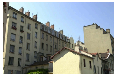
Elévation postérieure IVR82_20016902318NUCA