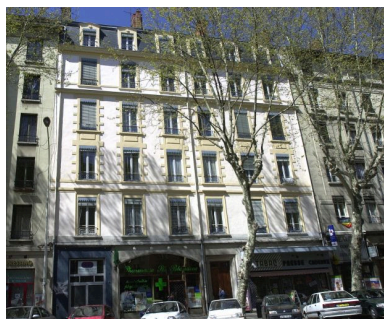
Elévation principale IVR82_20036900362NUCA