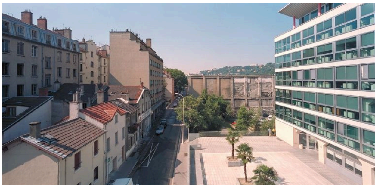
Elévation postérieure depuis le toit du collège Jean-Monnet