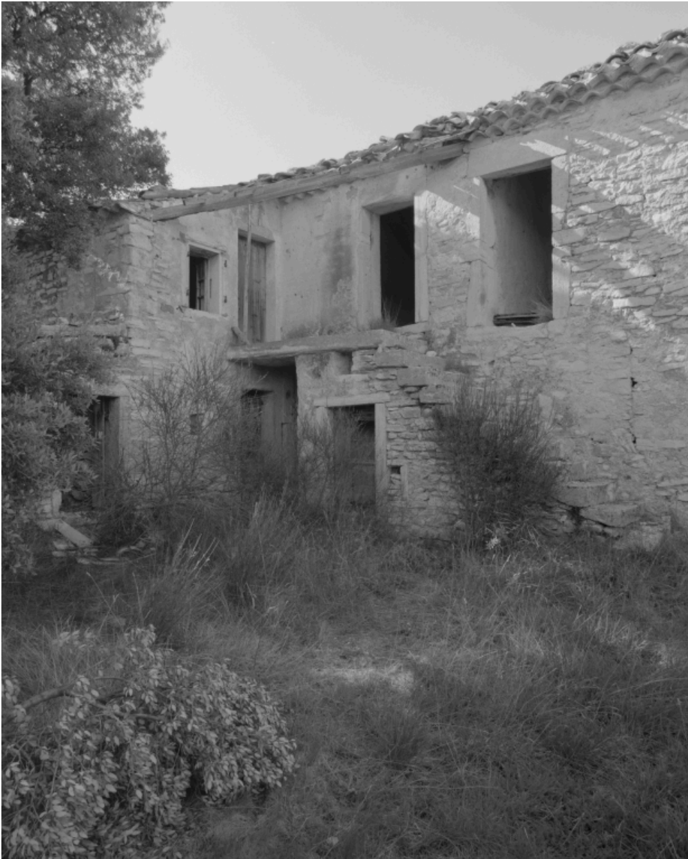
Vue partielle des dépendances agricoles donnant sur cour.