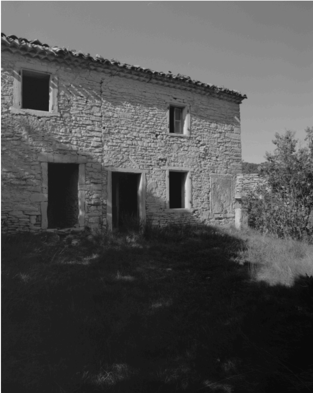
Façade principale du logis et vue partielle des dépendances agricoles accolées.