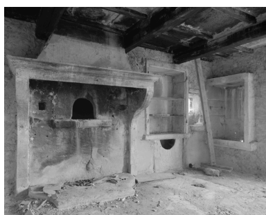
Pièce principale du logis : détail de la cheminée, du four à pain, du potager et de la souillarde.