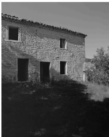
Façade principale du logis et vue partielle des dépendances agricoles accolées.