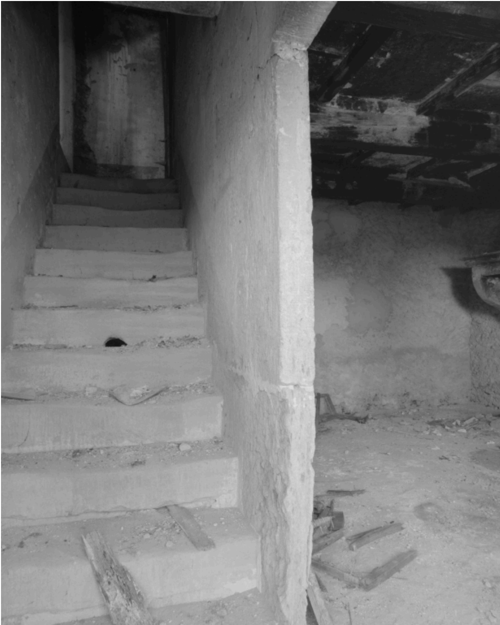
Détail de l'escalier en pierre menant au grenier et du mur de séparation de l'escalier de la pièce principale.