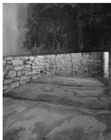
Vue intérieure d'une étable : couverture horizontale et séparation verticale en dalle de pierre.