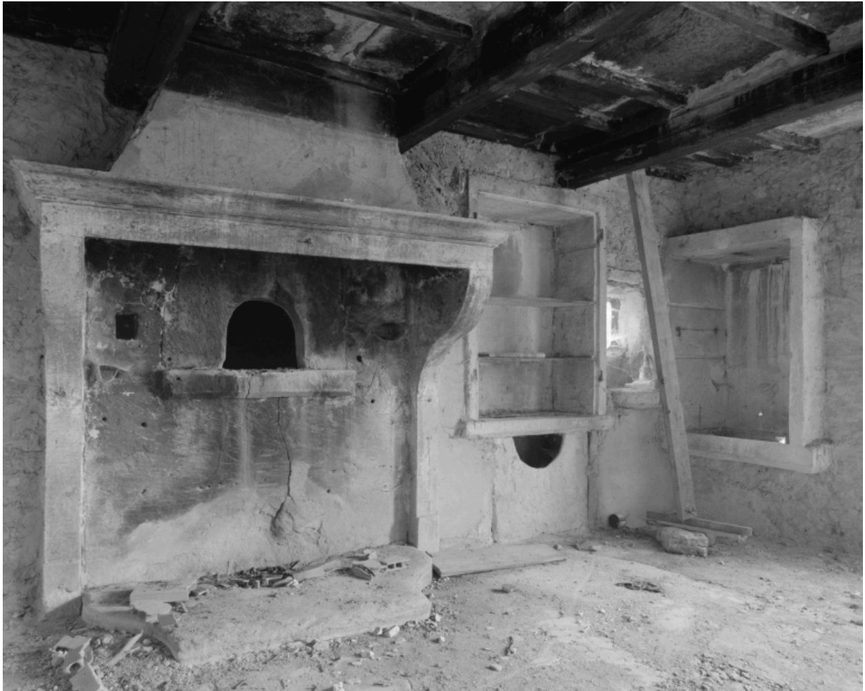
Pièce principale du logis : détail de la cheminée, du four à pain, du potager et de la souillarde.