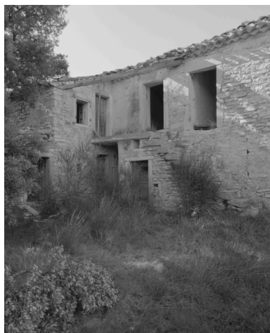
Vue partielle des dépendances agricoles donnant sur cour. IVR82_20002600357X