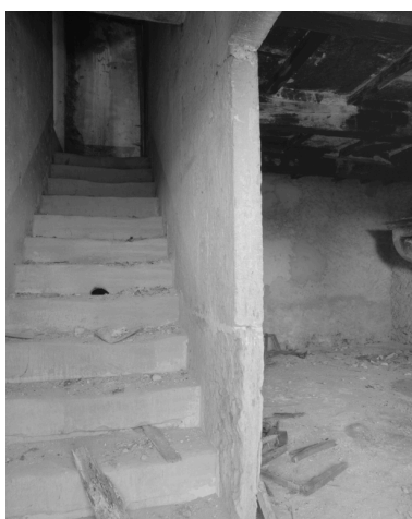
Détail de l'escalier en pierre menant au grenier et du mur de séparation de l'escalier de la pièce principale.