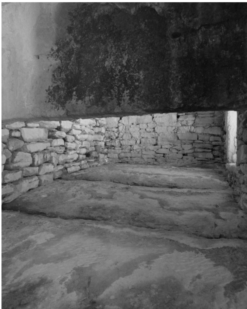
Vue intérieure d'une étable : couverture horizontale et séparation verticale en dalle de pierre.