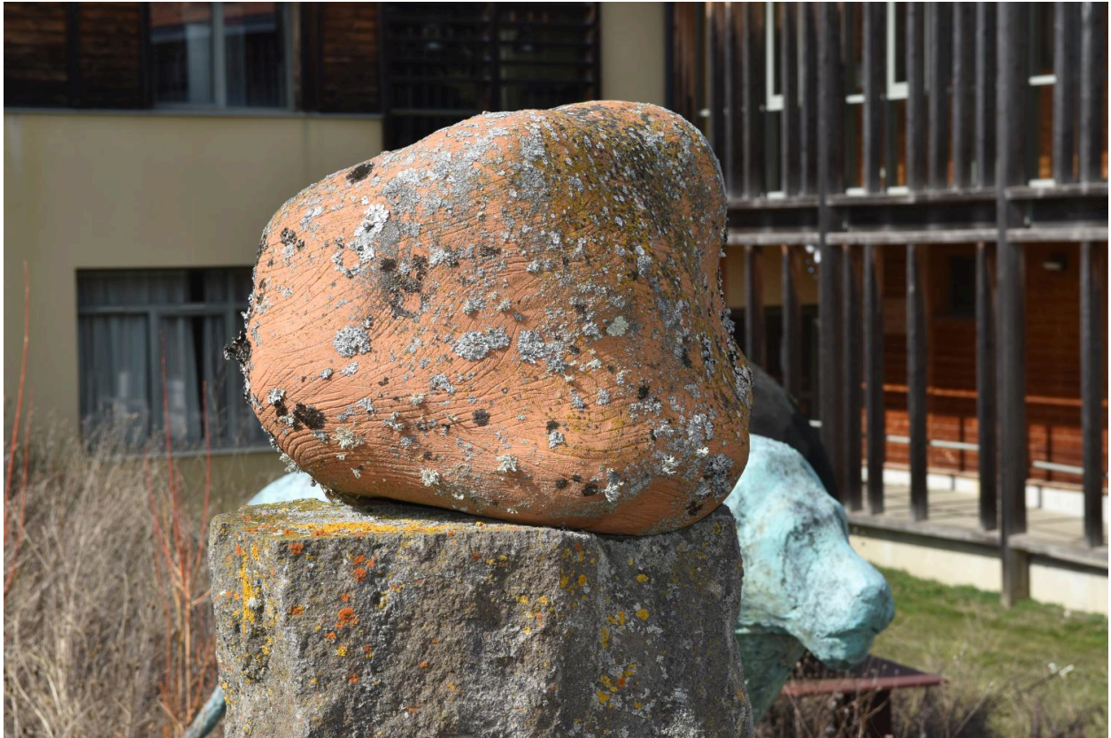
Rocher : détail