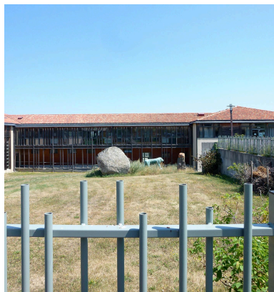
Vue de l'installation dans son environnement, depuis la rue