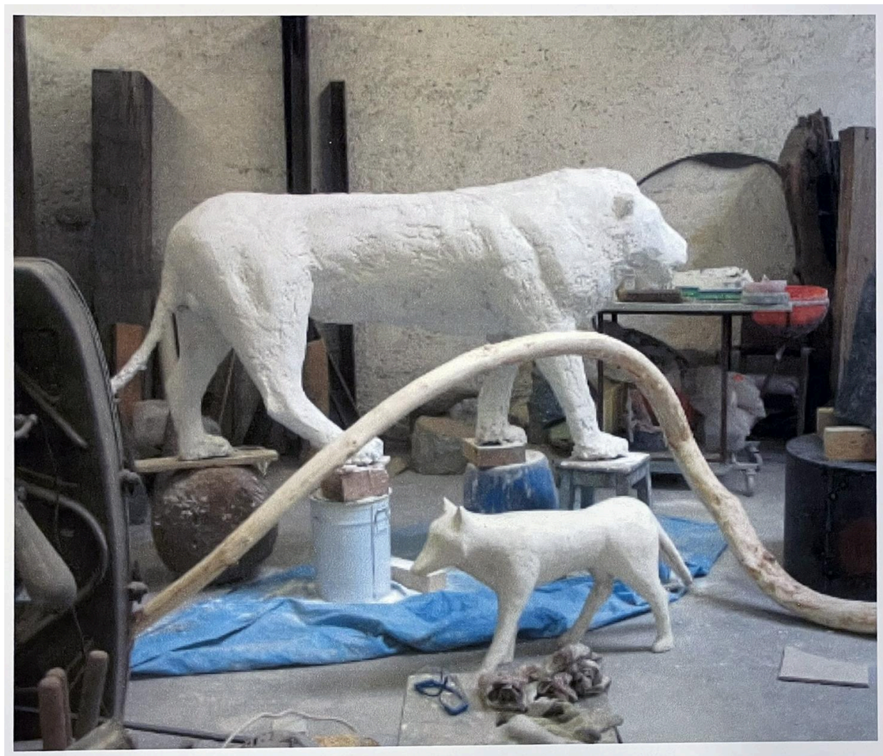
Plâtre du lion à la fonderie Fusion en mars 2008 : vue de profil droit