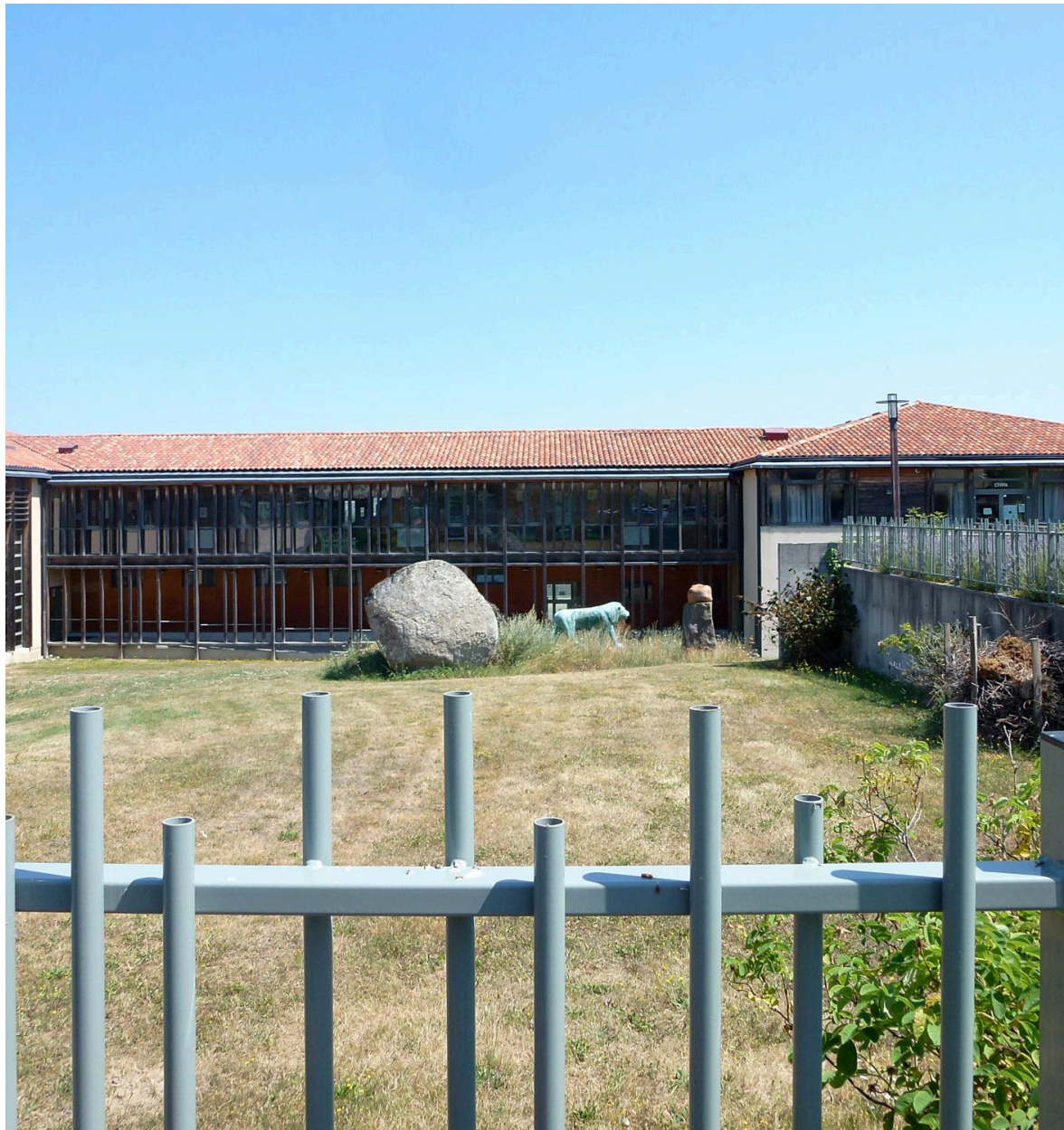
Vue de l'installation dans son environnement, depuis la rue