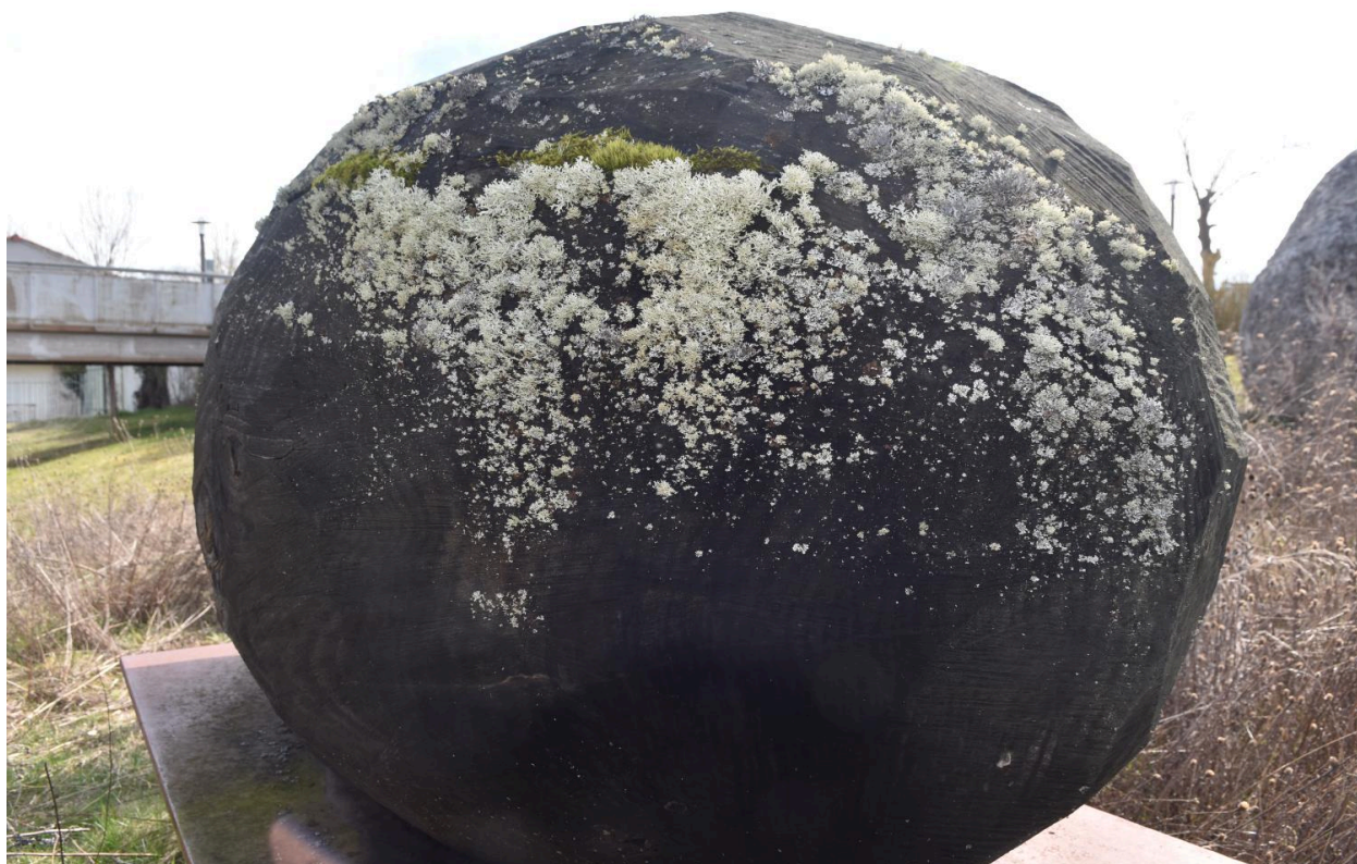
Météorite : détail des altérations (lichens, mousses)