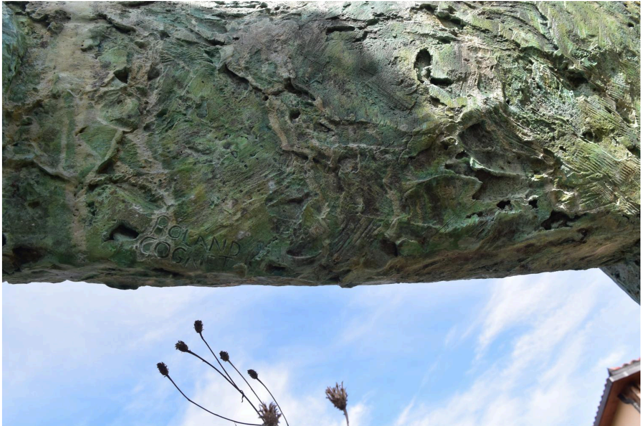
Le lion : détail de la signature de l'artiste, sous le flanc droit