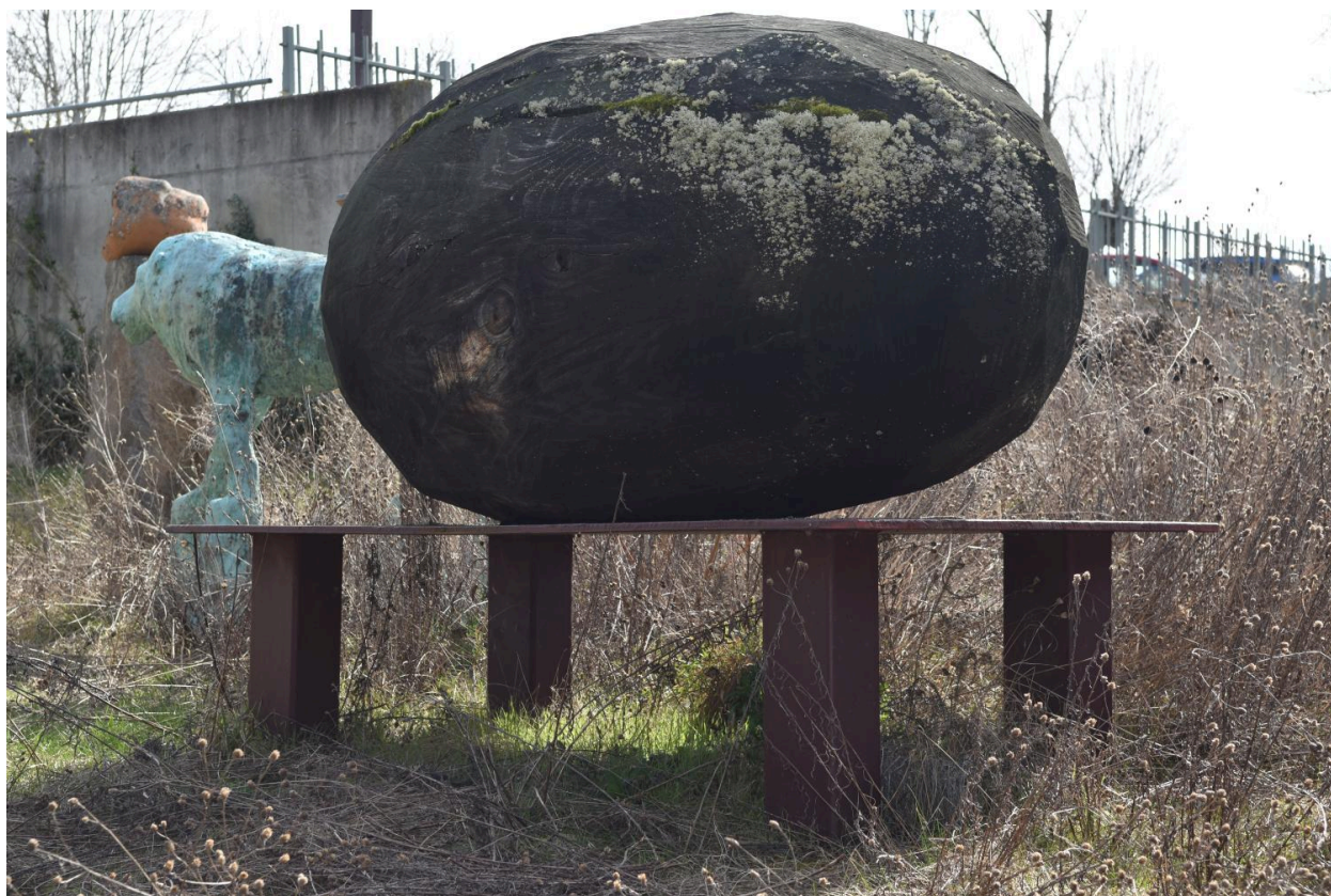
Météorite : vue d'ensemble