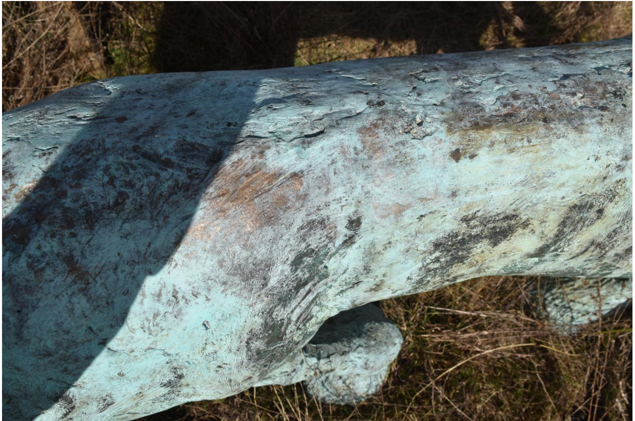
Le lion : détail du traitement de surface et traces d'érosion de la patine du bronze