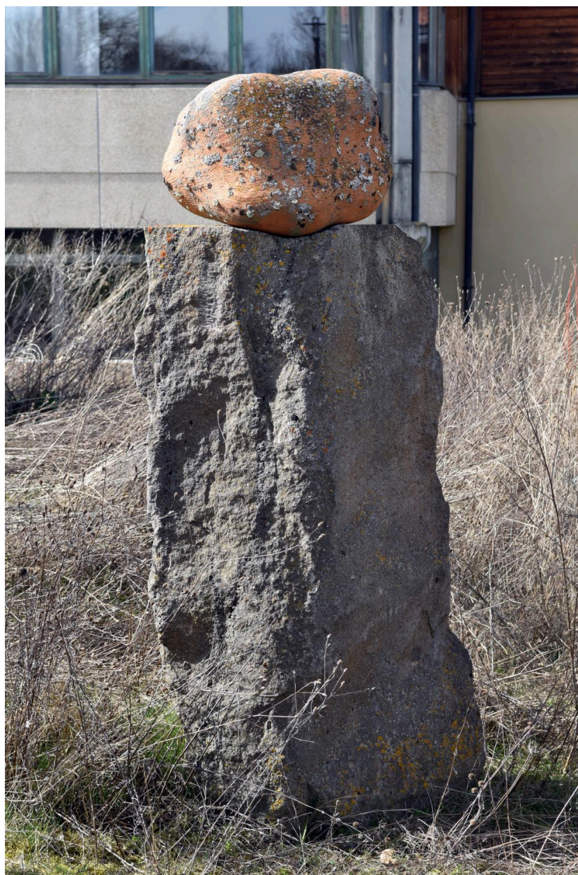
Rocher : vue d'ensemble