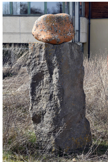
Rocher : vue d'ensemble IVR84_20241500150NUCA