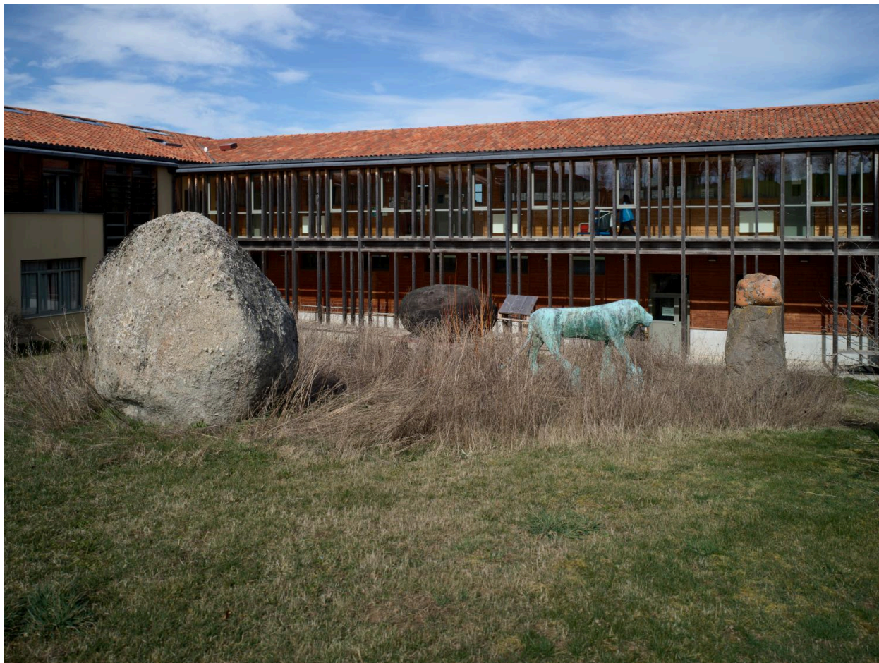
Vue de l'installation dans son environnement, depuis le sud