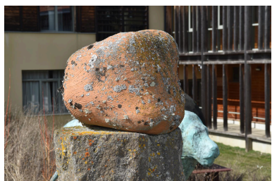
Rocher : détail