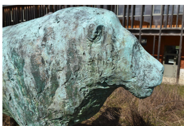
Le lion : détail de la tête