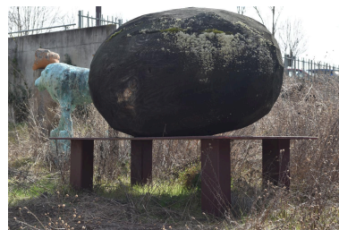
Météorite : vue d'ensemble IVR84_20241500148NUCA