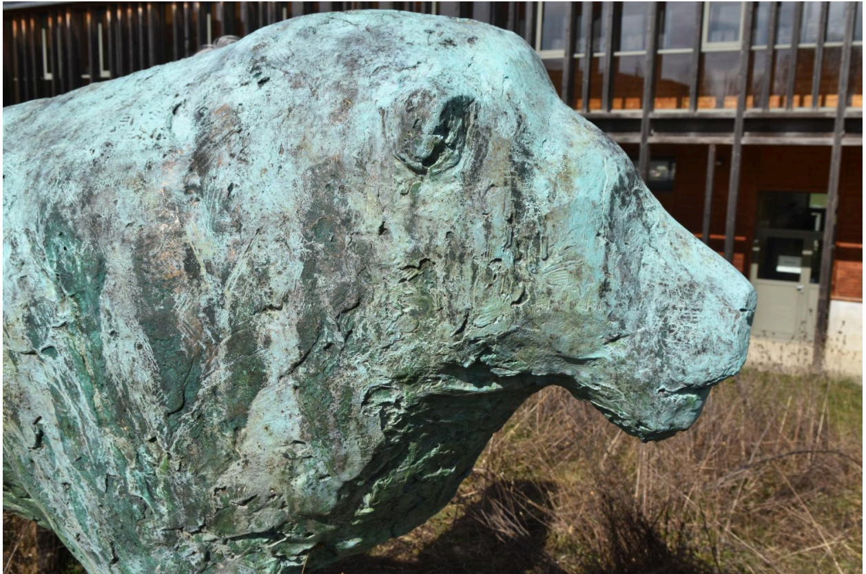
Le lion : détail de la tête