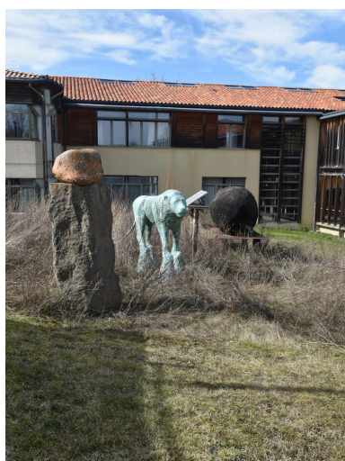
Autre vue d'ensemble, depuis l'est IVR84_20241500149NUCA