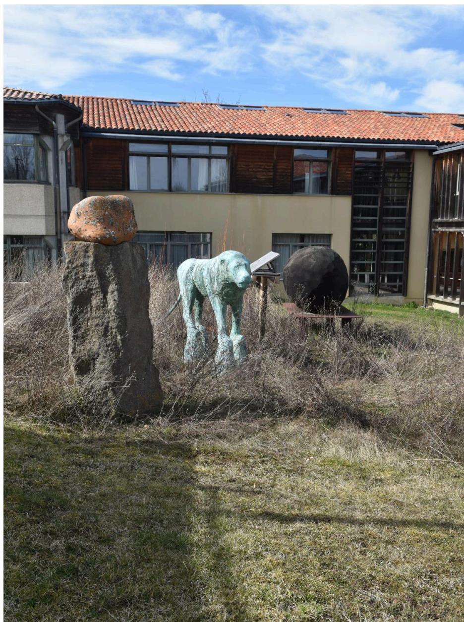
Autre vue d'ensemble, depuis l'est