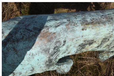
Le lion : détail du traitement de surface et traces d'érosion de la patine du bronze