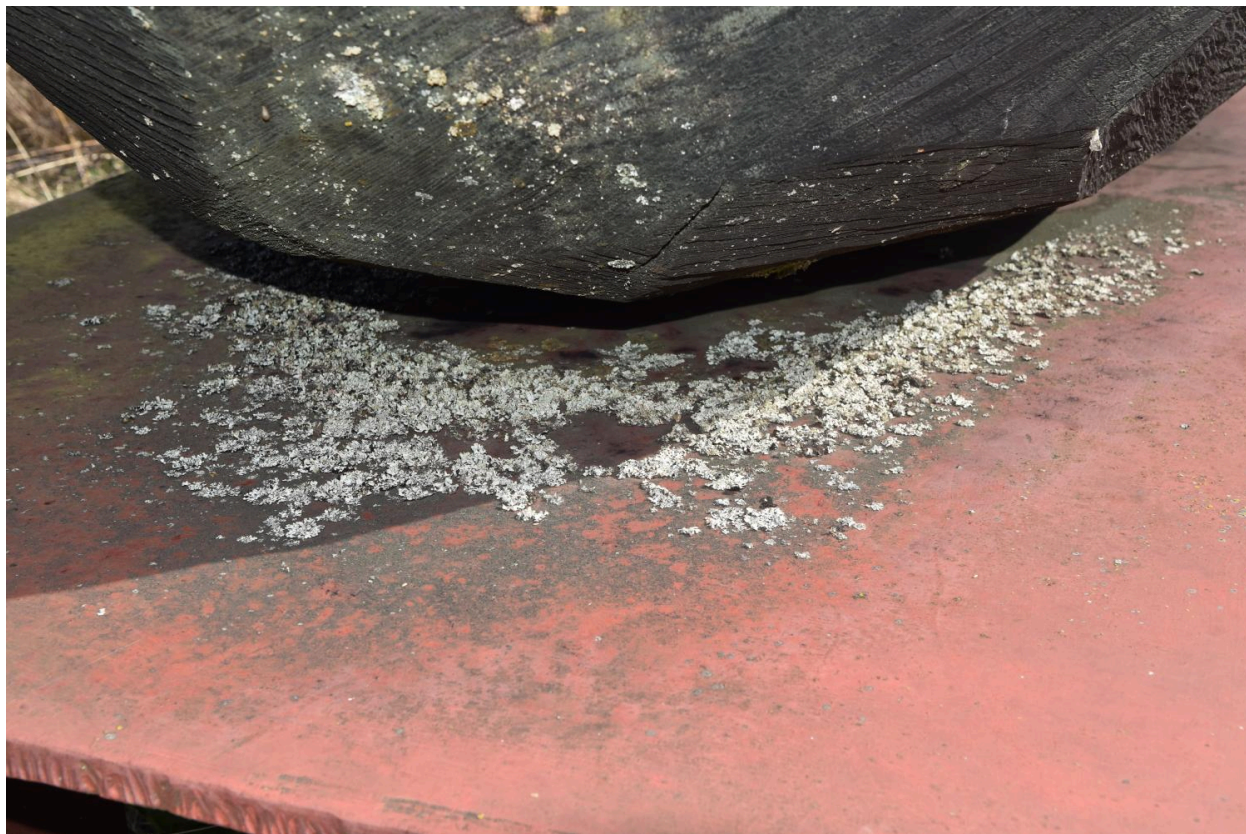
Météorite : détail des altérations du socle