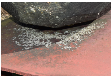
Météorite : détail des altérations du socle