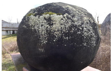
Météorite : détail des altérations (lichens, mousses) IVR84_20241500146NUCA