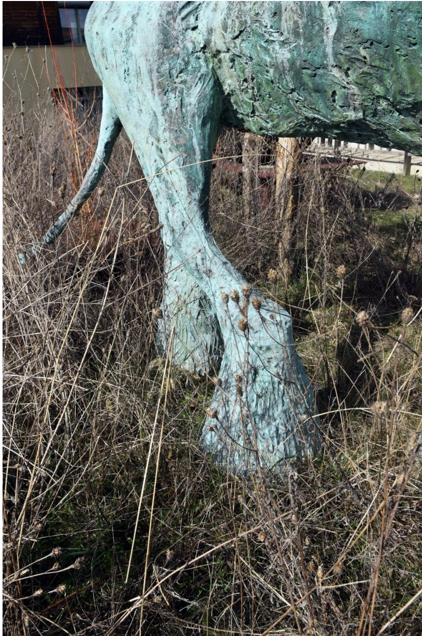
Le lion : détail des pattes sur piétement