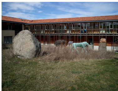
Vue de l'installation dans son environnement, depuis le sud IVR84_20241500125NUCA