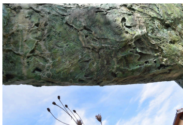
Le lion : détail de la signature de l'artiste, sous le flanc droit IVR84_20241500151NUCA