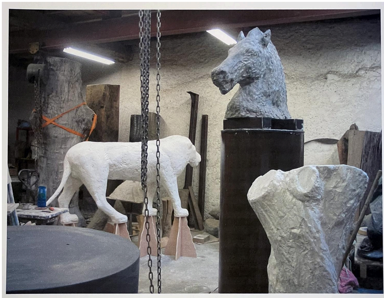
Plâtre du lion à la fonderie Fusion en mars 2008 : vue d'ensemble