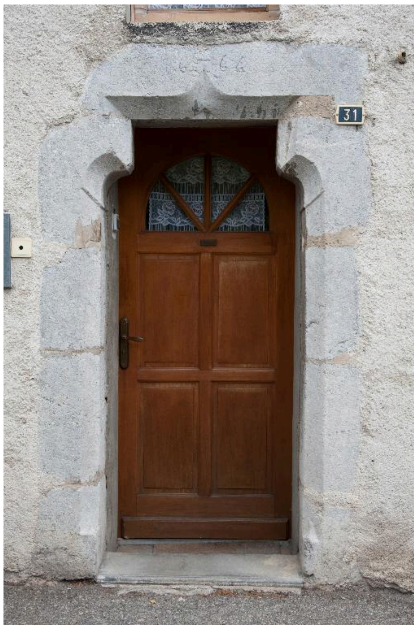
Vue d'un encadrement chanfreiné avec piédroits à congés et linteau en accolade sur coussinets