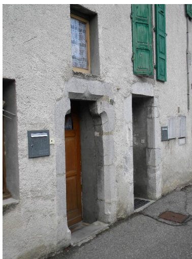
Vue d'encadrements de portes sur la façade est.