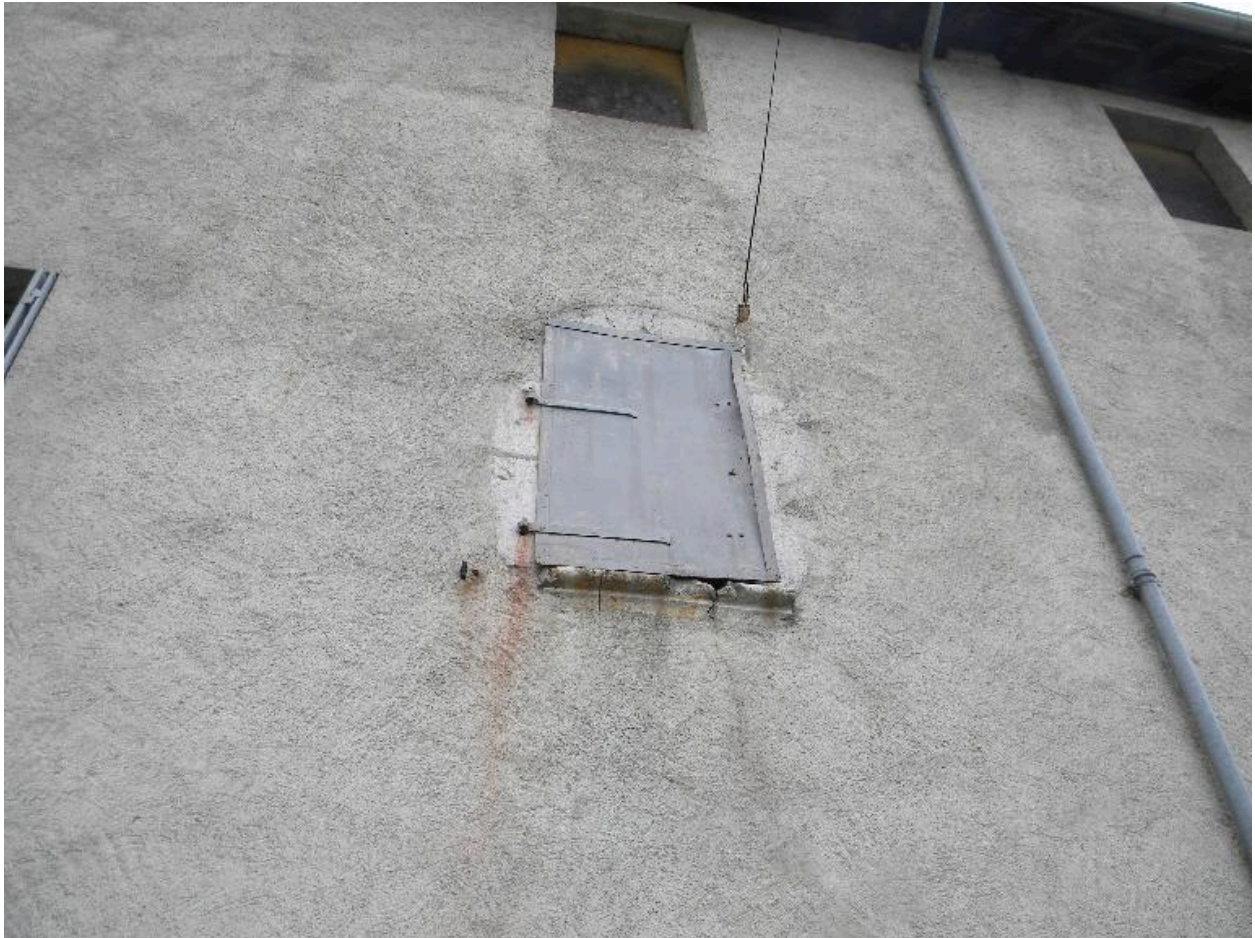
Vue d'une fenêtre à accolade en façade nord.