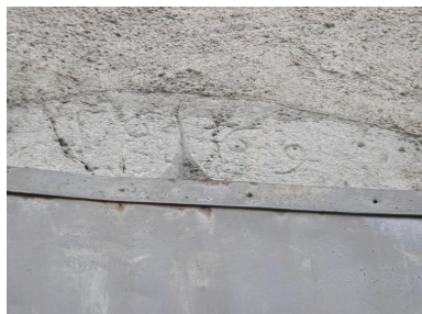
Linteau de fenêtre à accolade portant la date de 1669 IVR82_20137400924NUCA