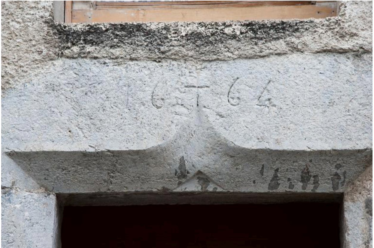
Vue d'un linteau en accolade portant la date de 1664