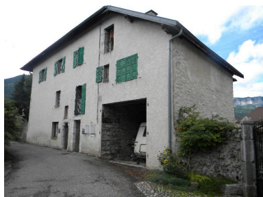
Vue de la façade est.