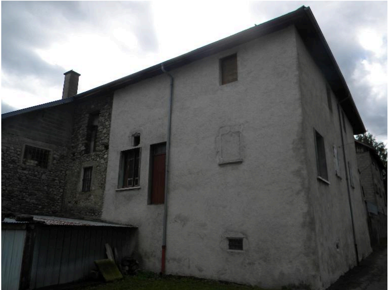
Vue des façades nord et ouest