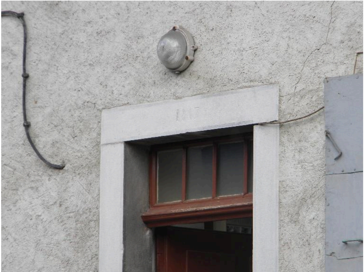
Détail d'un encadrement de porte aménagé au XIXe siècle sur la façade principale