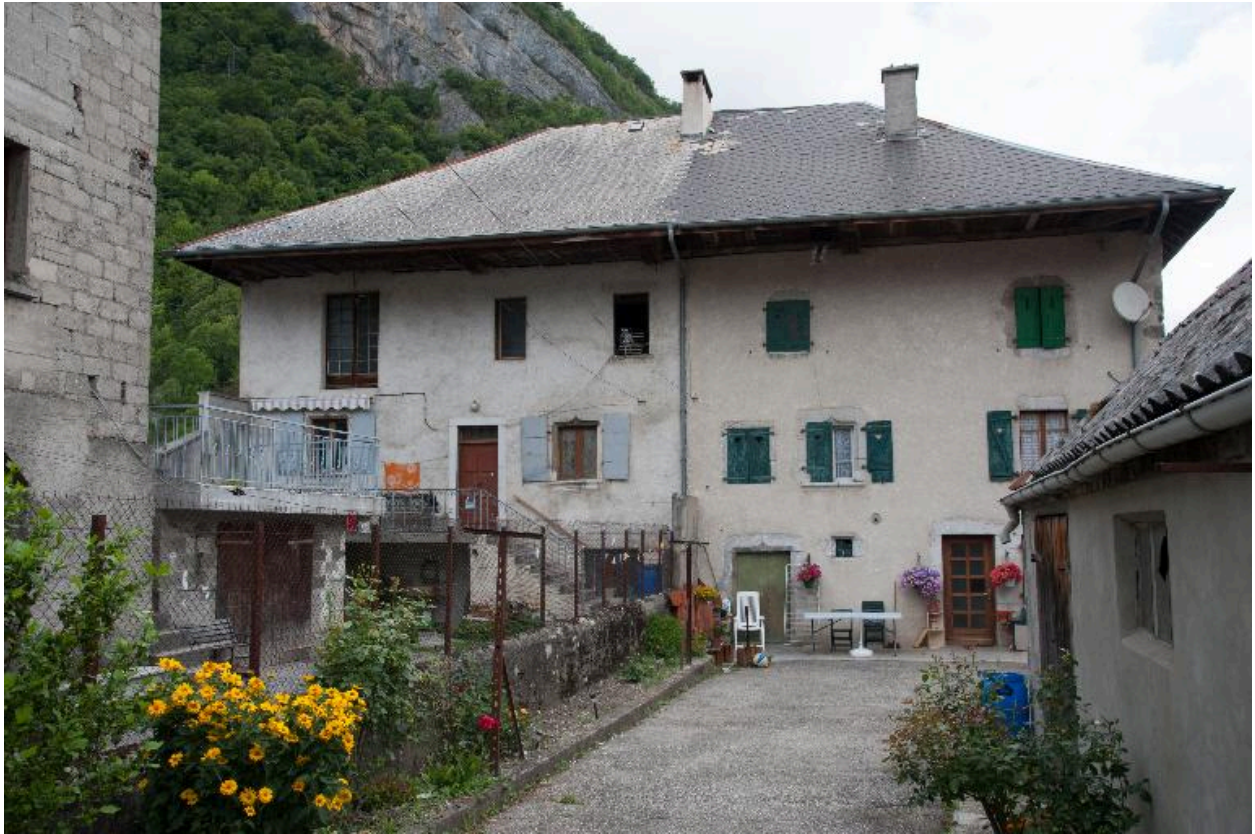
Vue de la façade principale depuis la route de Viuz