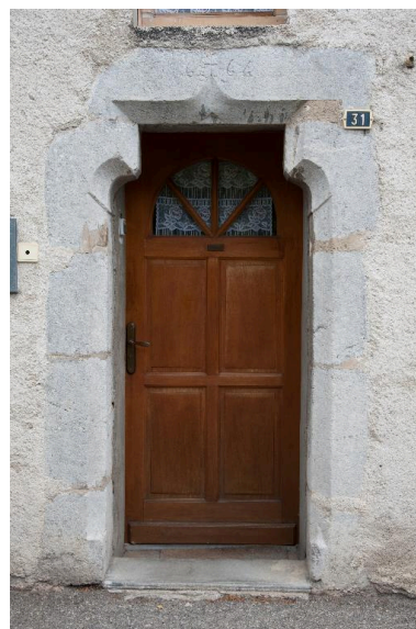
Vue d'un encadrement chanfreiné avec piédroits à congés et linteau en accolade sur coussinets