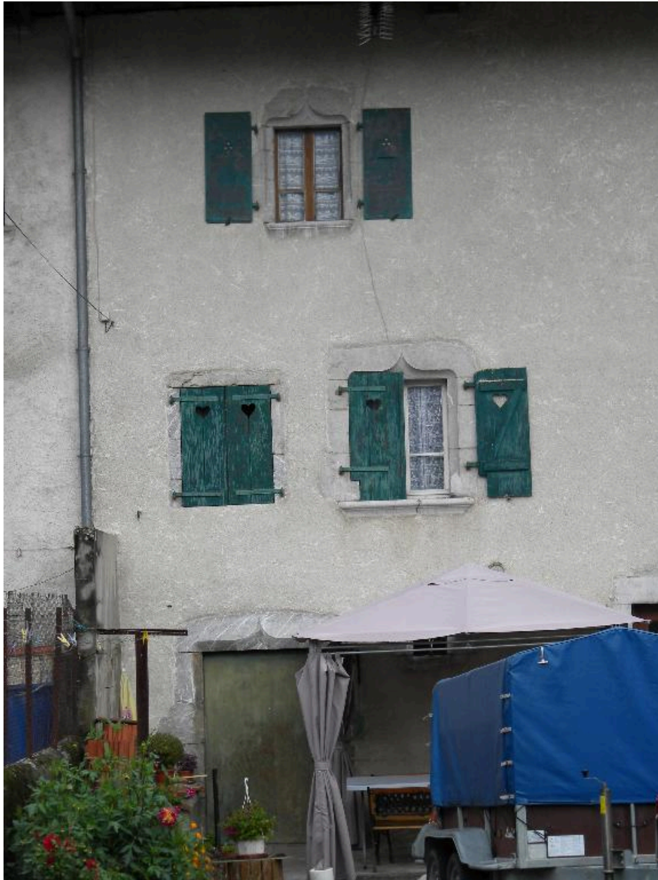
Détails d'encadrement sur la façade principale.