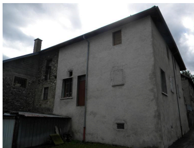
Vue des façades nord et ouest