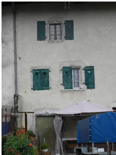
Détails d'encadrement sur la façade principale. IVR82_20137400918NUCA