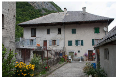
Vue de la façade principale depuis la route de Viuz IVR82_20137400826NUCA