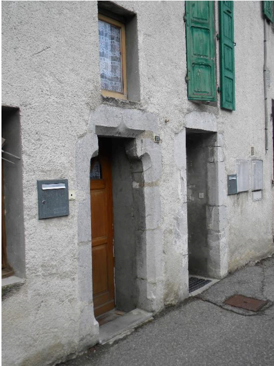
Vue d'encadrements de portes sur la façade est.