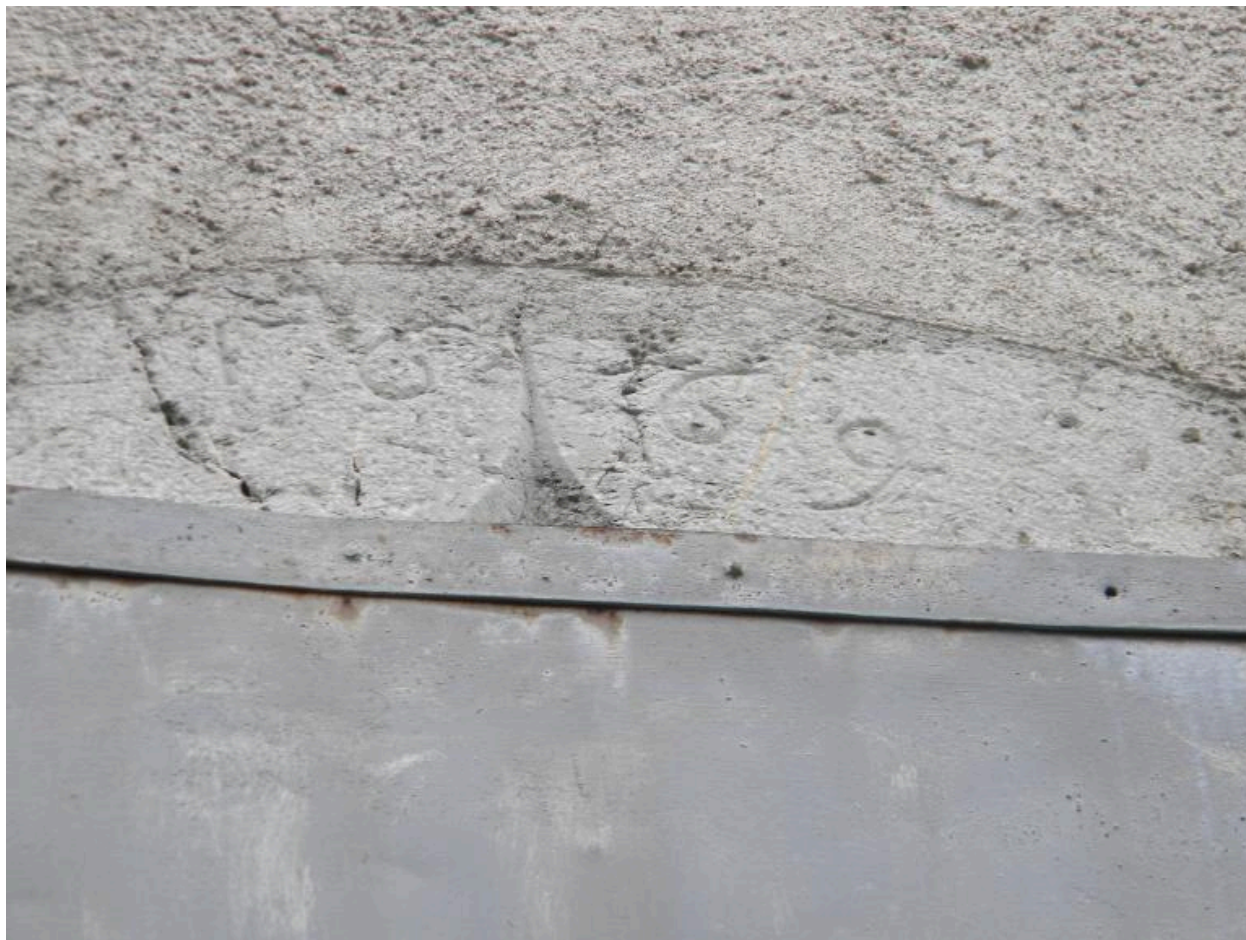
Linteau de fenêtre à accolade portant la date de 1669