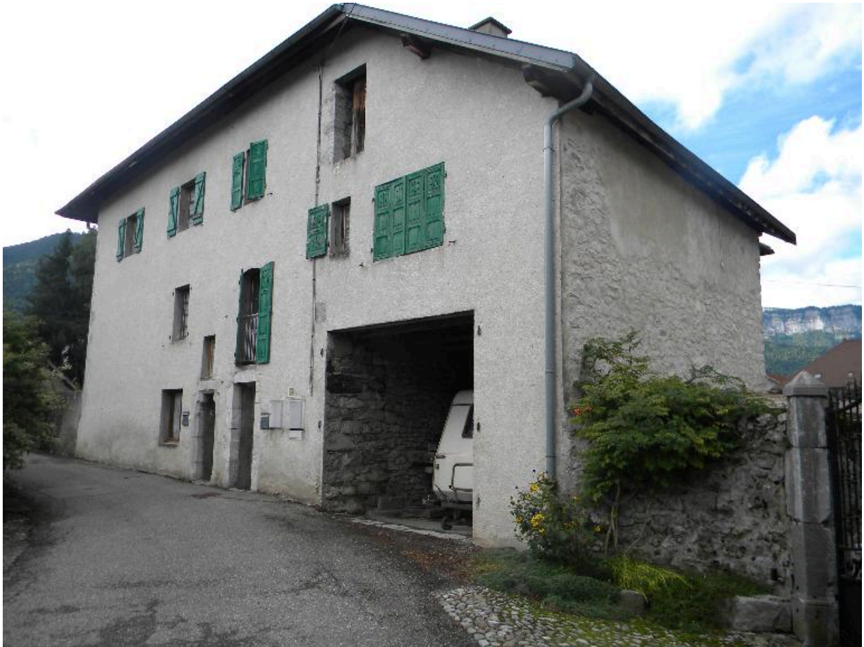
Vue de la façade est.