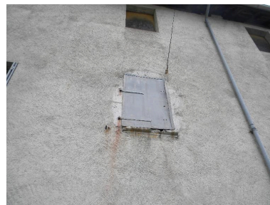
Vue d'une fenêtre à accolade en façade nord. IVR82_20137400923NUCA