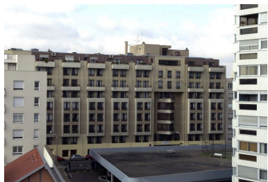
Elévation antérieure, vue partielle IVR82_20116904157NUCA