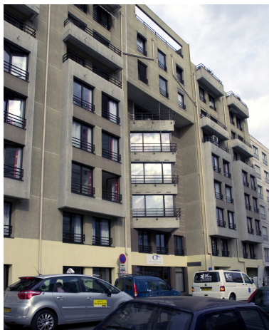
Elévation antérieure, vue partielle depuis le sud-est