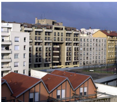
Vue générale depuis le sud-est