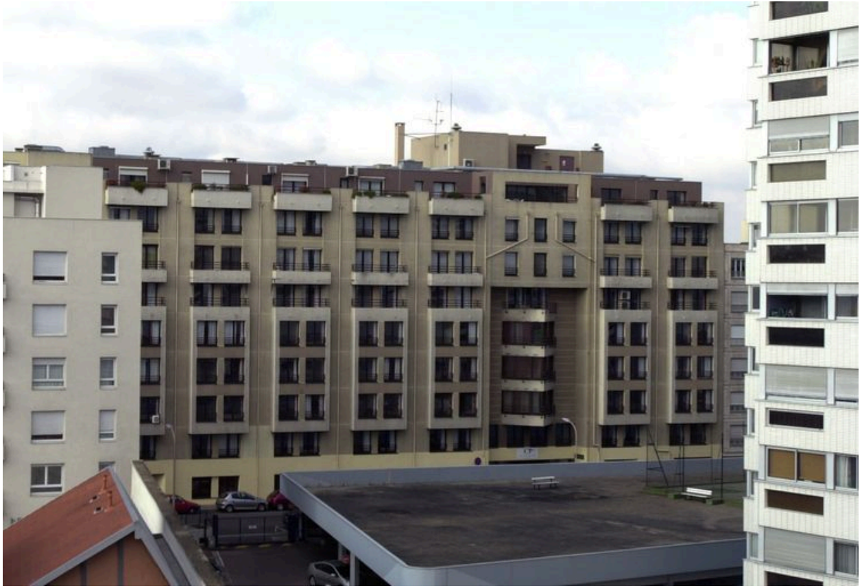
Elévation antérieure, vue partielle