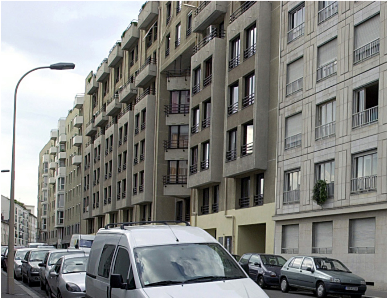
Elévation antérieure, vue d'ensemble depuis le nord