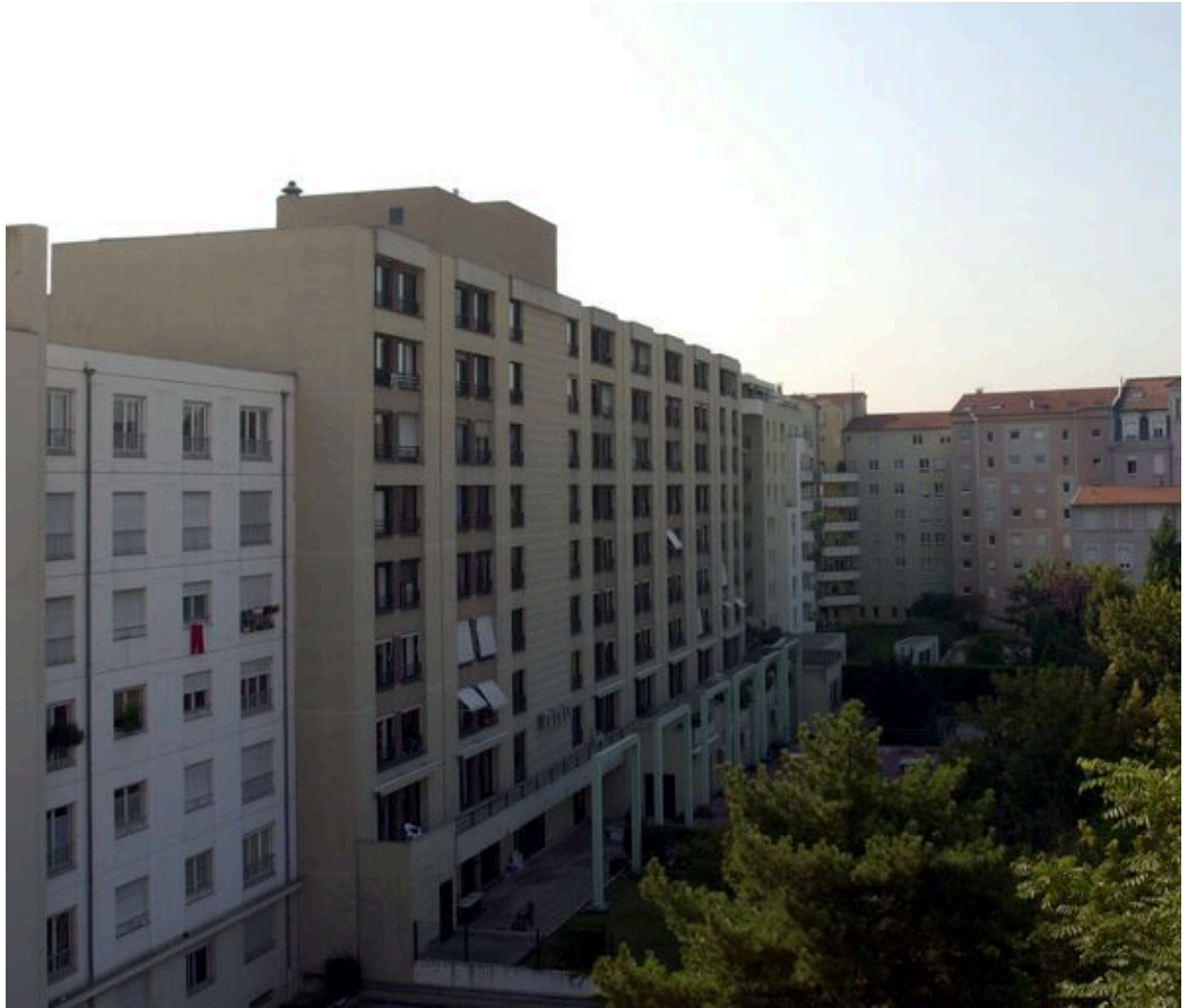
Elévation postérieure, depuis le nord