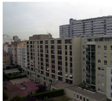
Elévation postérieure, depuis le sud-ouest IVR82_20126902468NUC