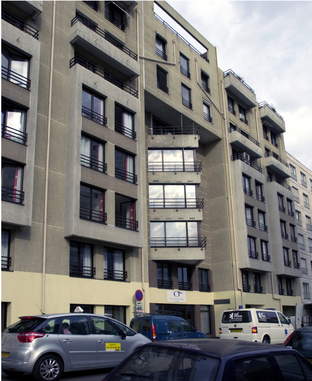
Elévation antérieure, vue partielle depuis le sud-est