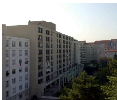
Elévation postérieure, depuis le nord IVR82_20116904153NUCA