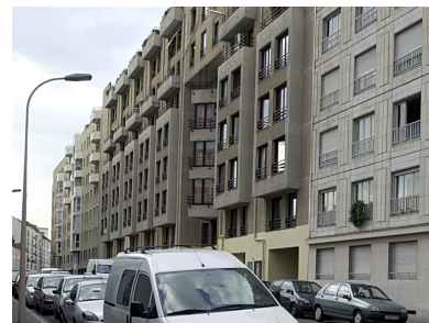
Elévation antérieure, vue d'ensemble depuis le nord