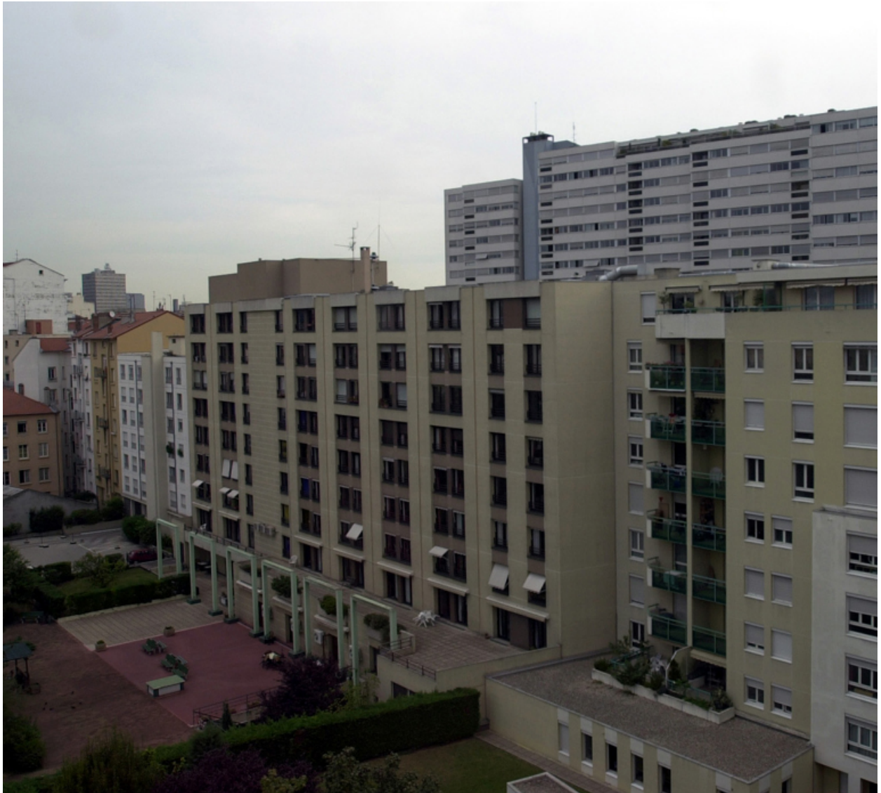
Elévation postérieure, depuis le sud-ouest