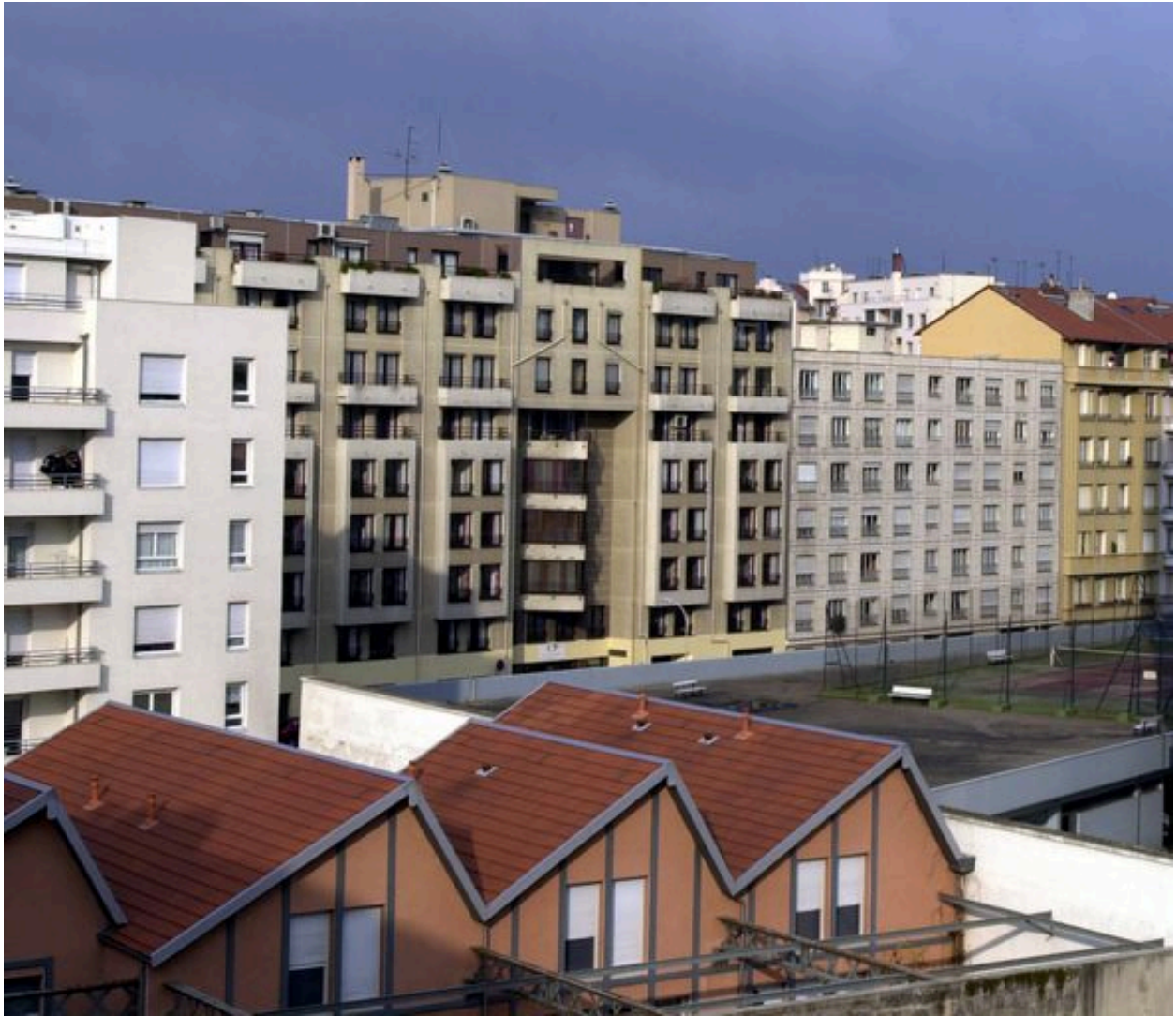
Vue générale depuis le sud-est