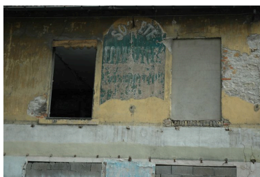
Façade sur la rue Béchevelin, détail de l'enseigne après enlèvement du panneau d'information IVR82_20076900182NUCA