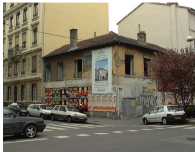
Vue générale IVR82_20016900938NUCA