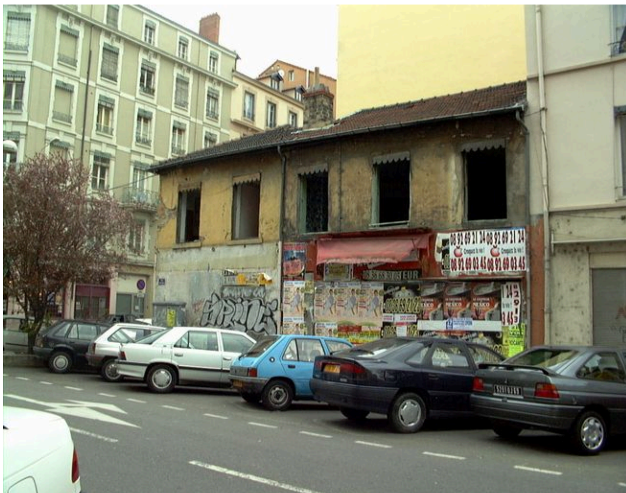
Vue de la façade rue Béchevelin