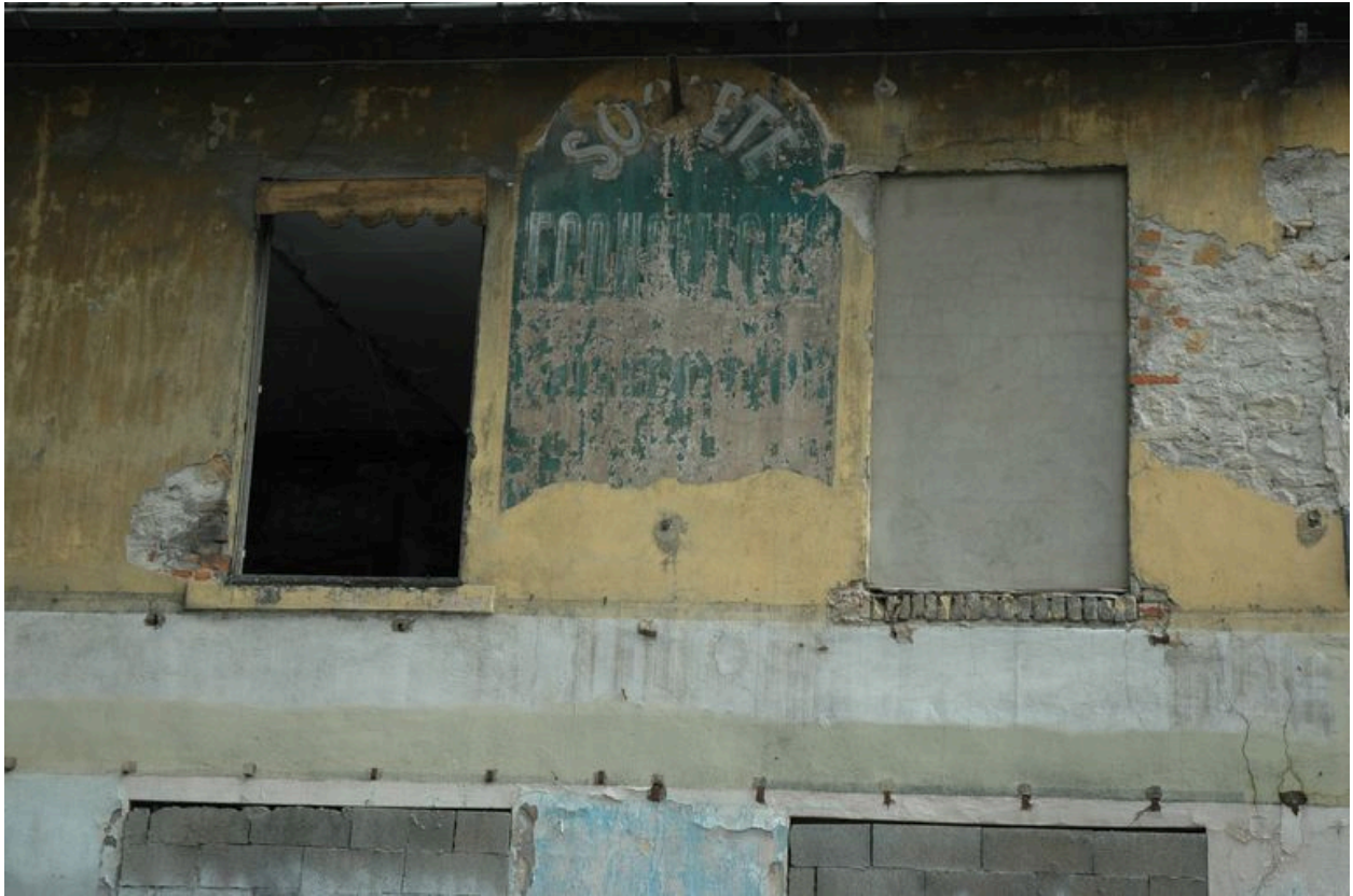
Façade sur la rue Béchevelin, détail de l'enseigne après enlèvement du panneau d'information