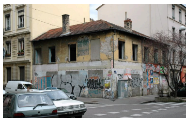
Vue générale en mars 2007