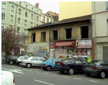
Vue de la façade rue Béchevelin IVR82_20016900939NUCA