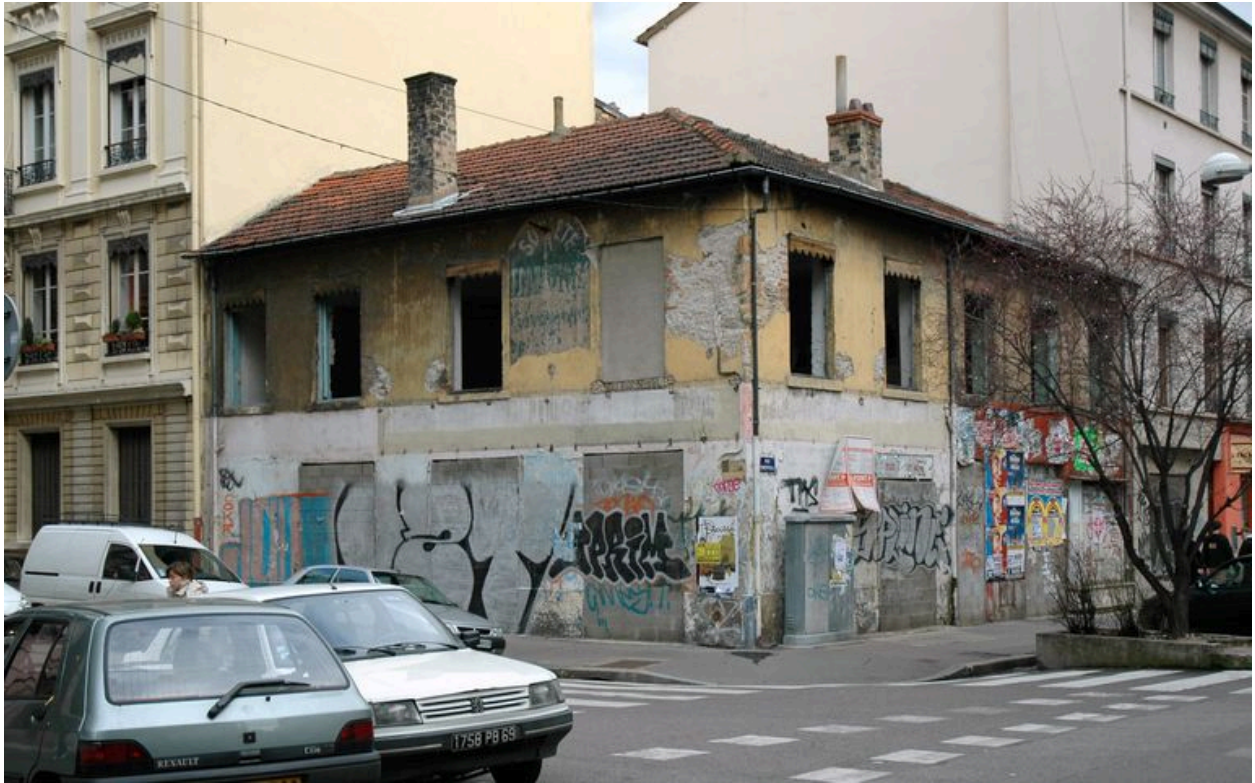
Vue générale en mars 2007