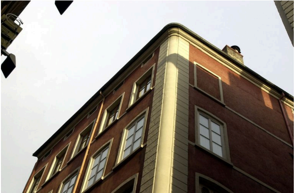
Vue des derniers étages depuis l'angle des rues Confort et David-Girin