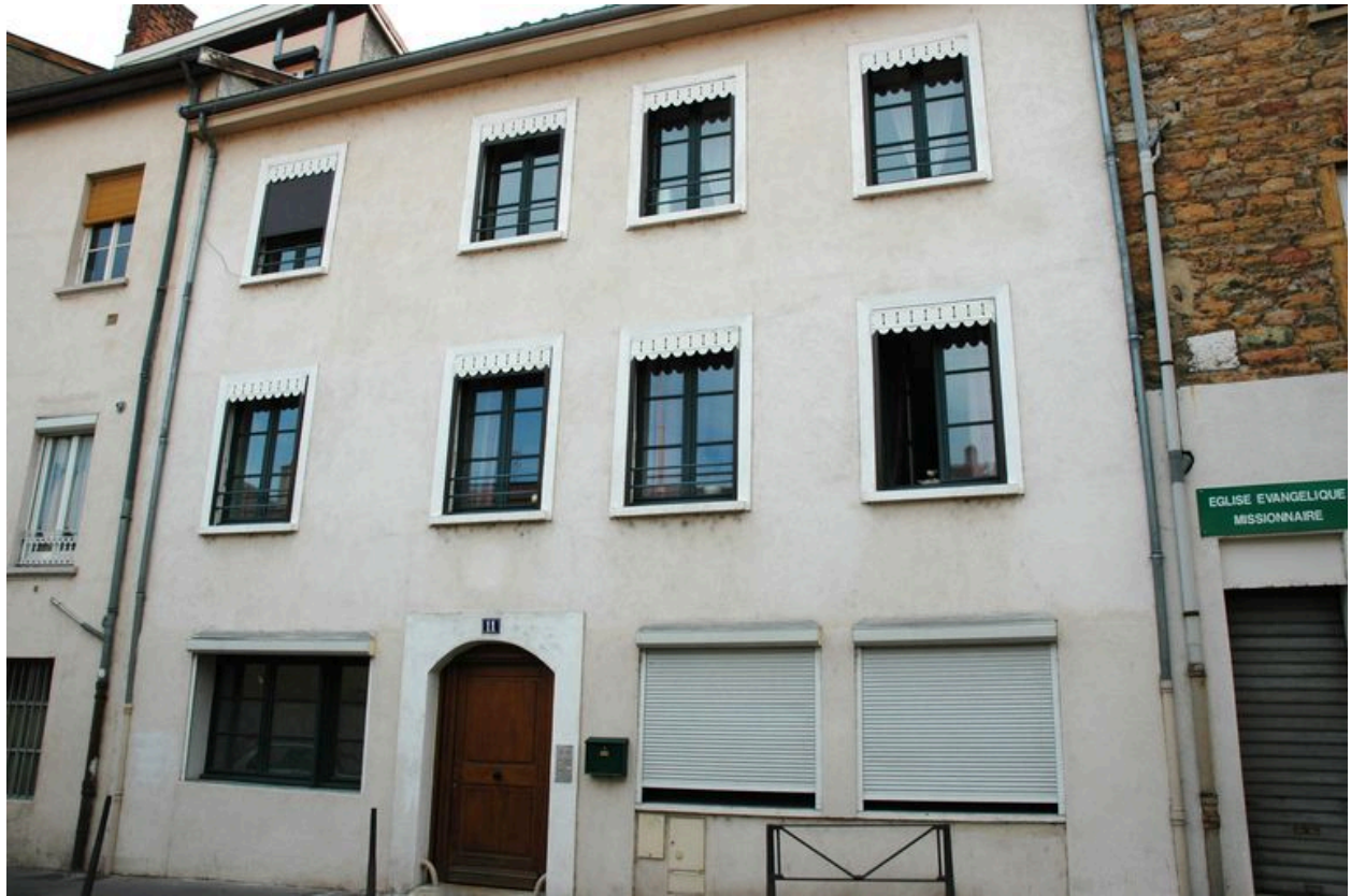
Façade ouest sur rue