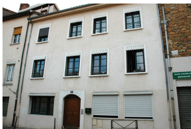
Façade ouest sur rue