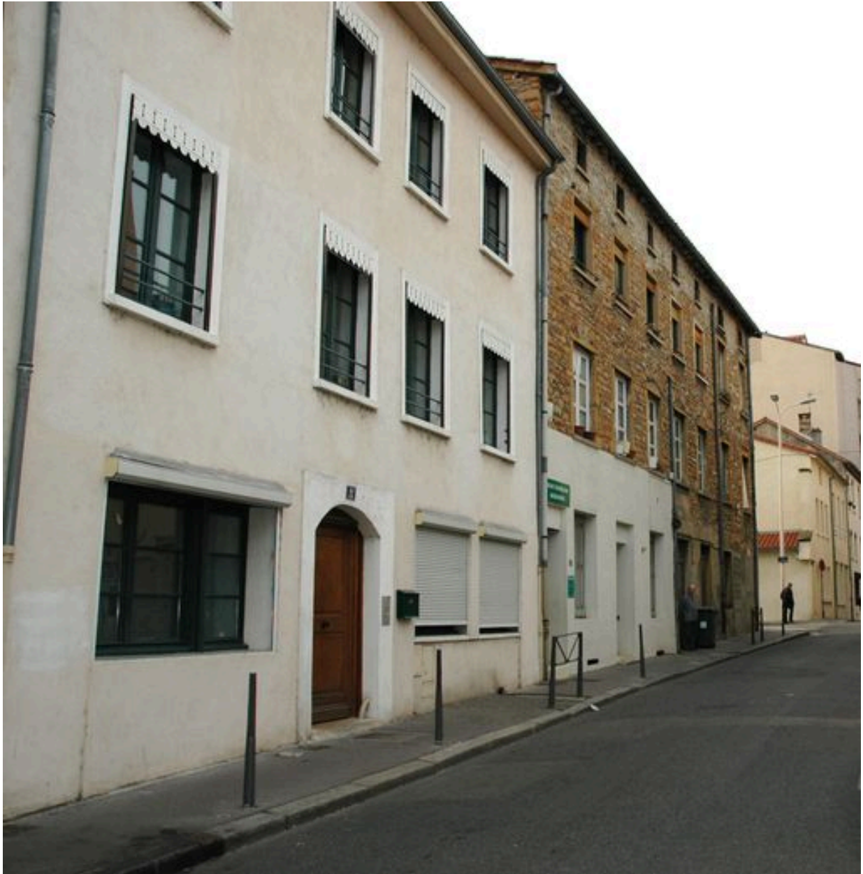
11 et 13 rue Claude-Boyer, façade sur rue