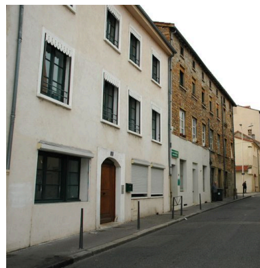
11 et 13 rue Claude-Boyer, façade sur rue IVR82_20066901346NUCA