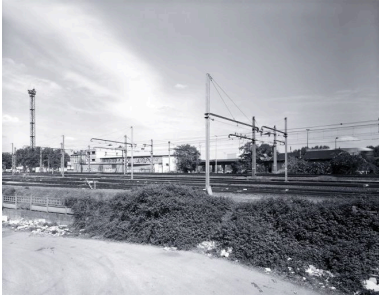
Elévation postérieure depuis la voie ferrée IVR82_20026903547V