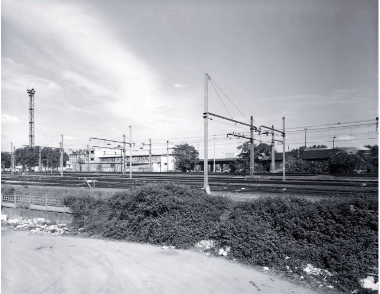
Elévation postérieure depuis la voie ferrée