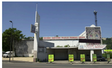
Vue d'ensemble depuis l'est IVR82_20016901882NUCA