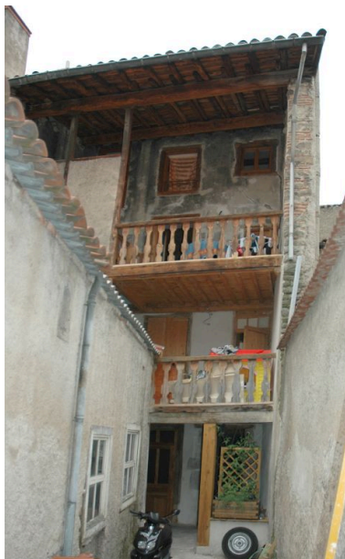
Elévation sur cour. IVR82_20124201346NUCA