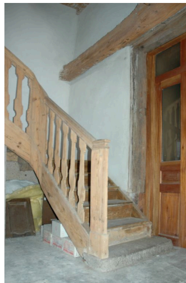
Départ de l'escalier en bois. IVR82_20124201347NUCA