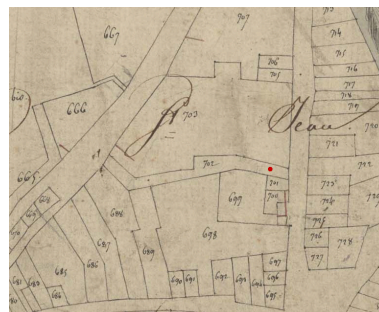
Extrait du plan cadastral de 1809, parcelle E 702.