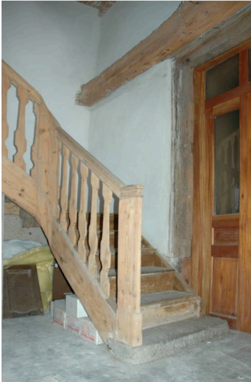
Départ de l'escalier en bois.