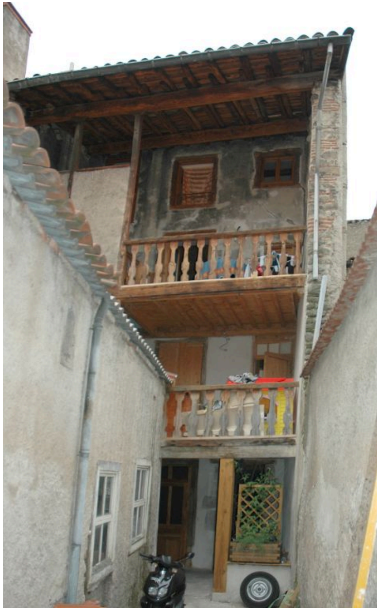
Elévation sur cour.