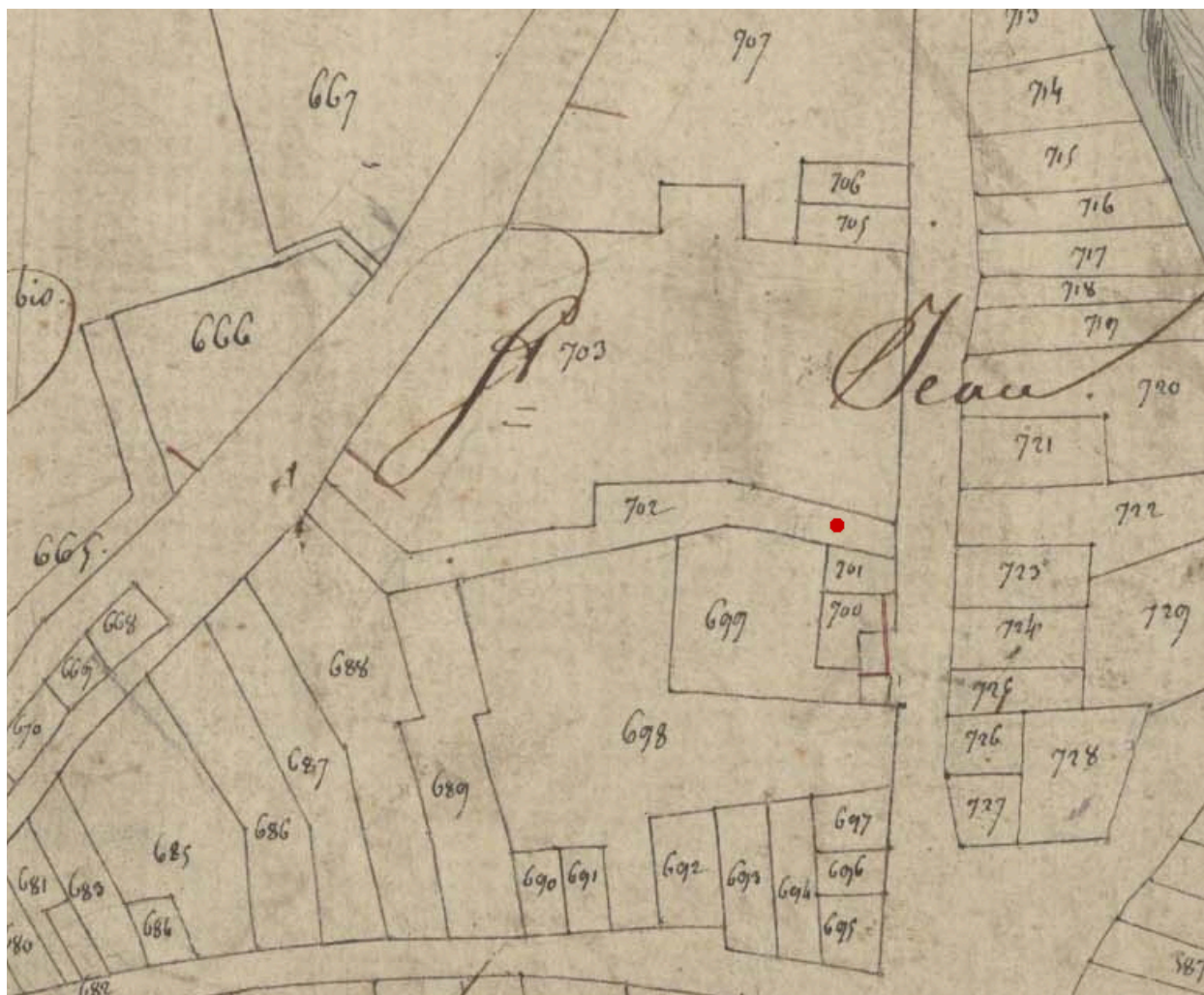
Extrait du plan cadastral de 1809, parcelle E 702.