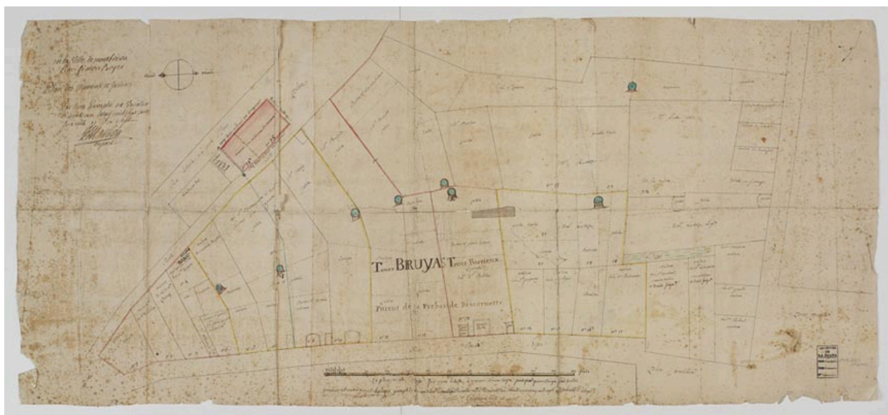
Plan des maisons et jardins, rue Simon Boyer en 1777. (A. Diana, Montbrison). Plan, 1777 B Diana Montbrison. C géo 149 (1)