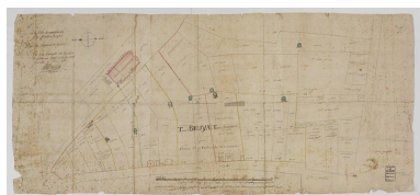
Plan des maisons et jardins, rue Simon Boyer en 1777. (A. Diana, Montbrison). Plan, 1777 B Diana Montbrison. C géo 149 (1) IVR82_20064200857NUCA