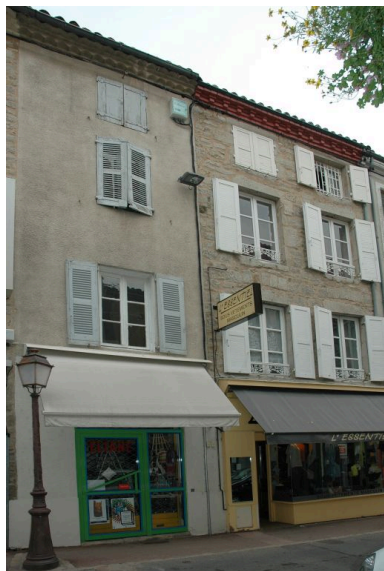
Vue de situation (maison de droite).