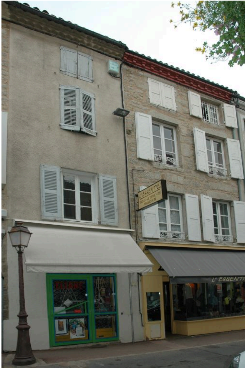
Vue de situation (maison de droite).