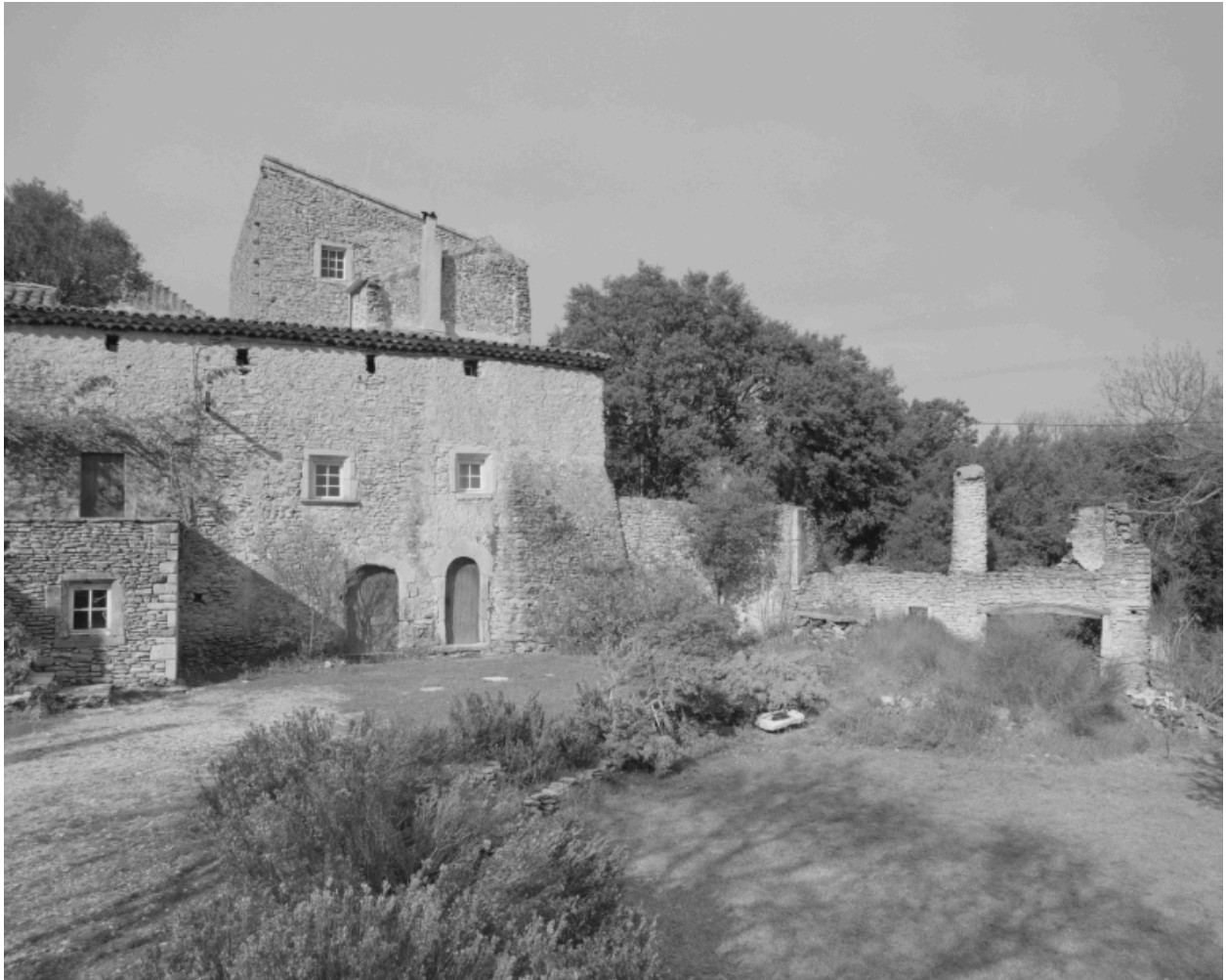
Vue partielle depuis le sud.