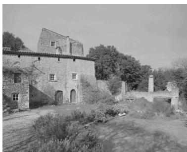
Vue partielle depuis le sud.