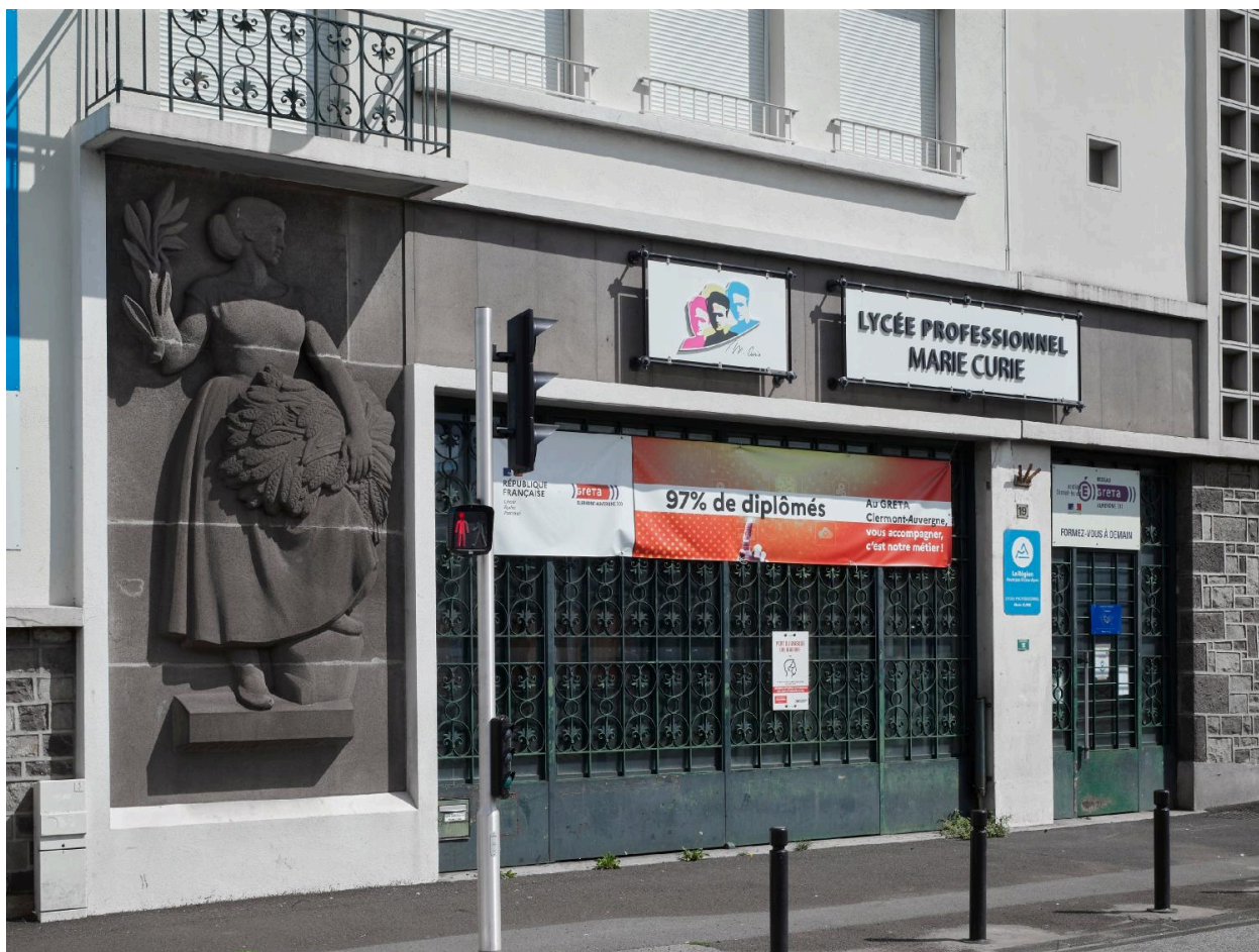
Façade principale sur le boulevard. Personnification de l'Abondance, par Raymond Coulon, non signée.