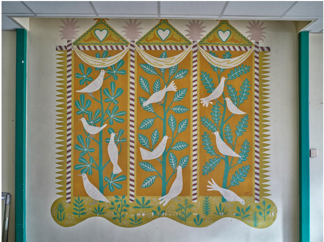
Peinture murale du parloir.