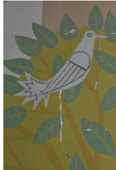
Peinture murale de la cantine, détail : un des volatiles. IVR84_20226301757NUCA