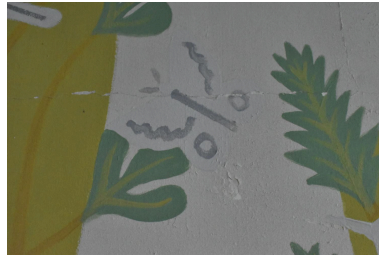
Peinture murale de la cantine, détail : le papillon.