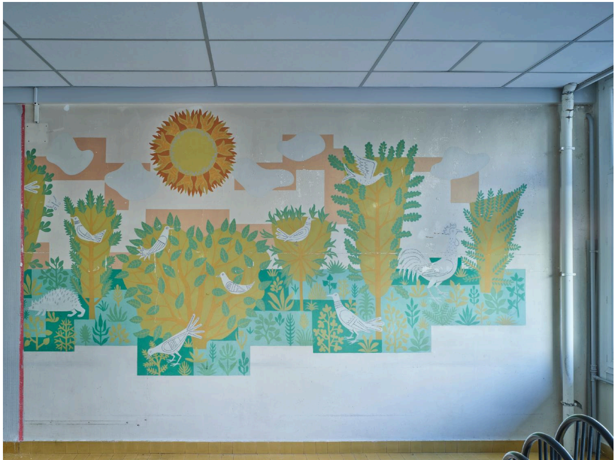
Peinture murale par Louis Dussour, cantine, pan sud, signée.