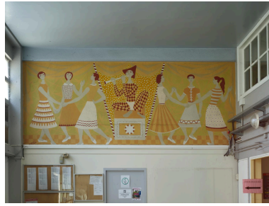
Peinture murale du préau. IVR84_20226301703NUCA