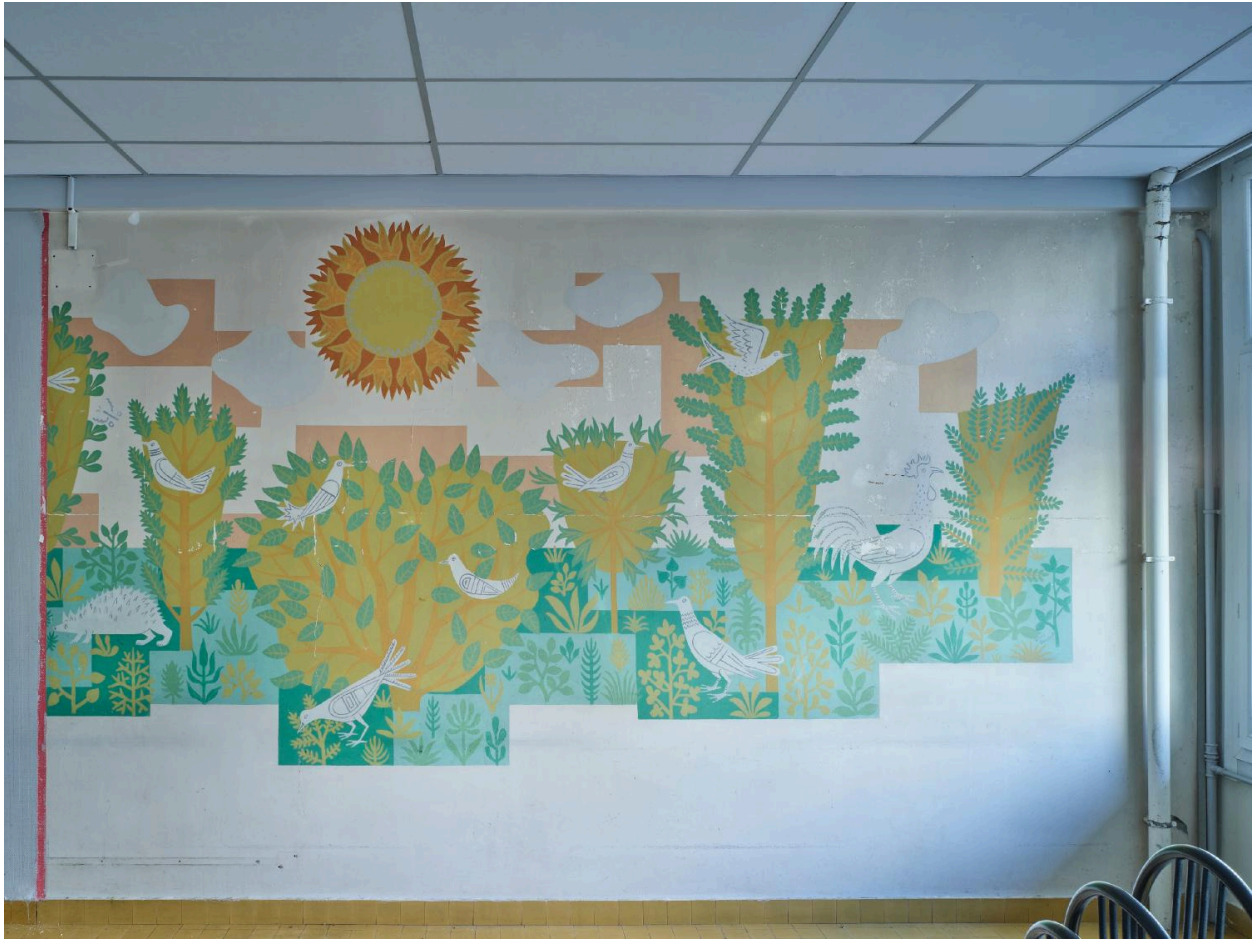
Peinture murale par Louis Dussour, cantine, pan sud, signée.