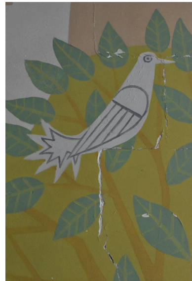
Peinture murale de la cantine, détail : un des volatiles. IVR84_20226301757NUCA