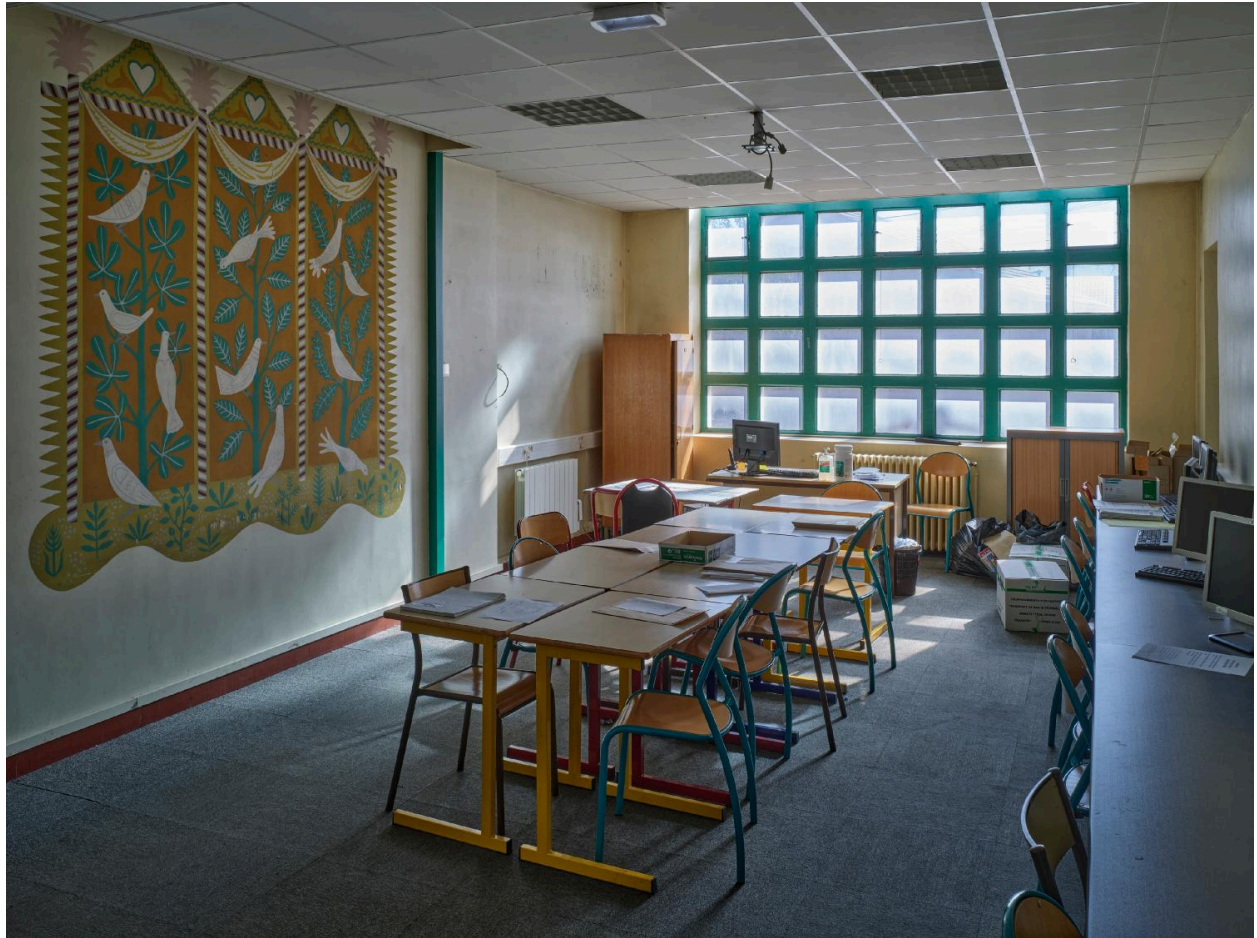
Vue générale du parloir. Le faux-plafond a été exécuté en tenant compte de la peinture murale.