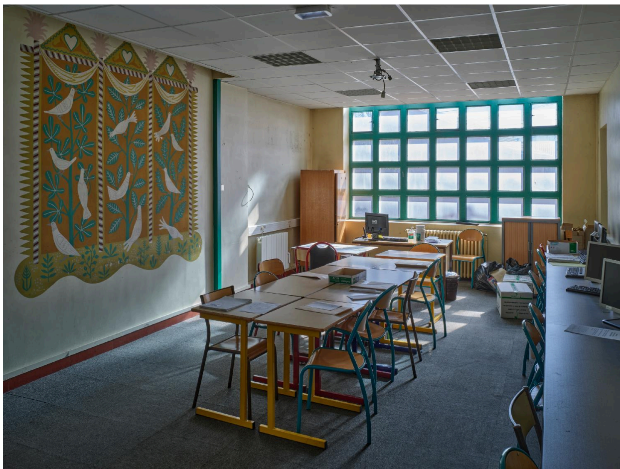
Vue générale du parloir. Le faux-plafond a été exécuté en tenant compte de la peinture murale.