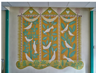
Peinture murale du parloir. IVR84_20226301696NUCA