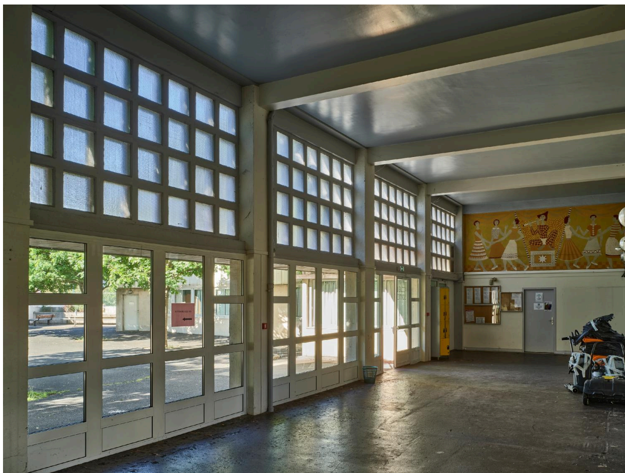
Vue générale de la salle haute dite préau, avec peinture murale côté ouest.