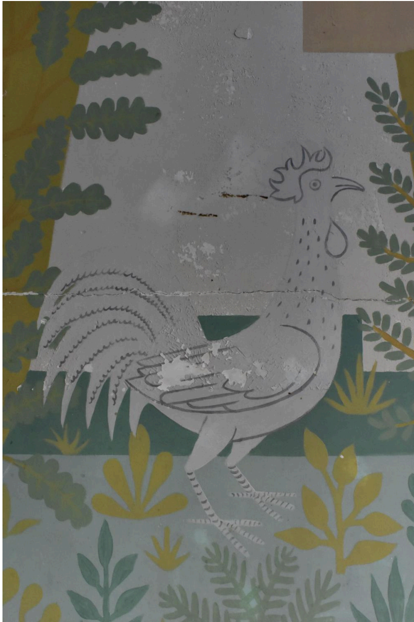
Peinture murale de la cantine, détail : le coq.