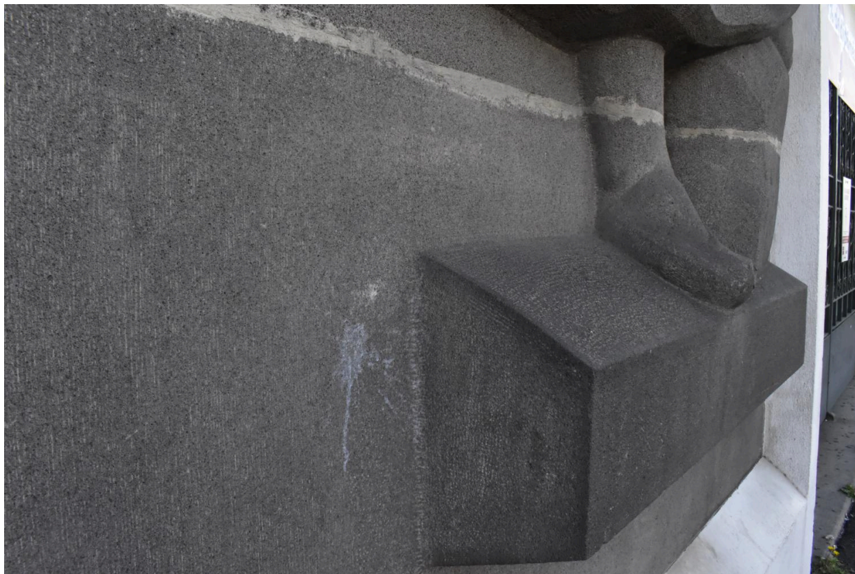
Détail du haut-relief représentant l'Abondance. Traces de bouchardage et layures (ou hachures).