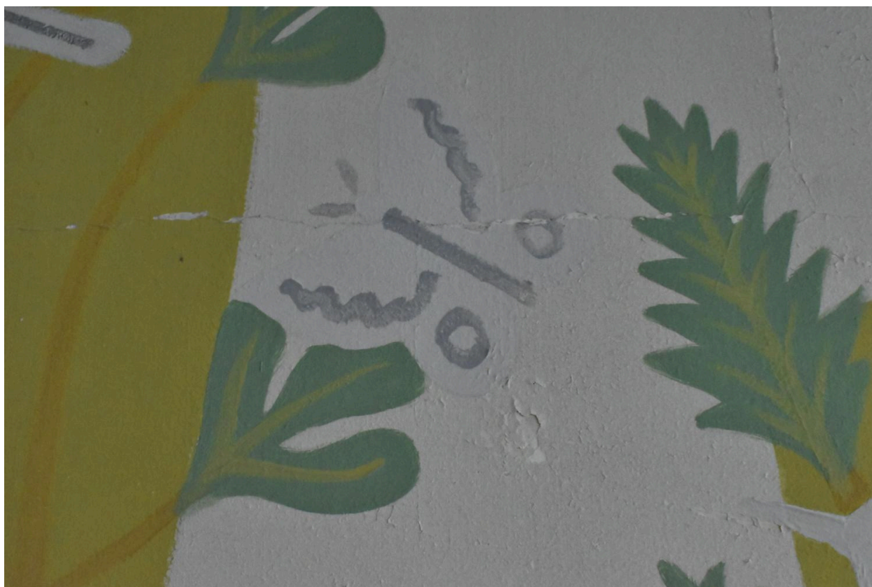
Peinture murale de la cantine, détail : le papillon.