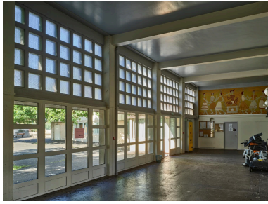
Vue générale de la salle haute dite préau, avec peinture murale côté ouest.