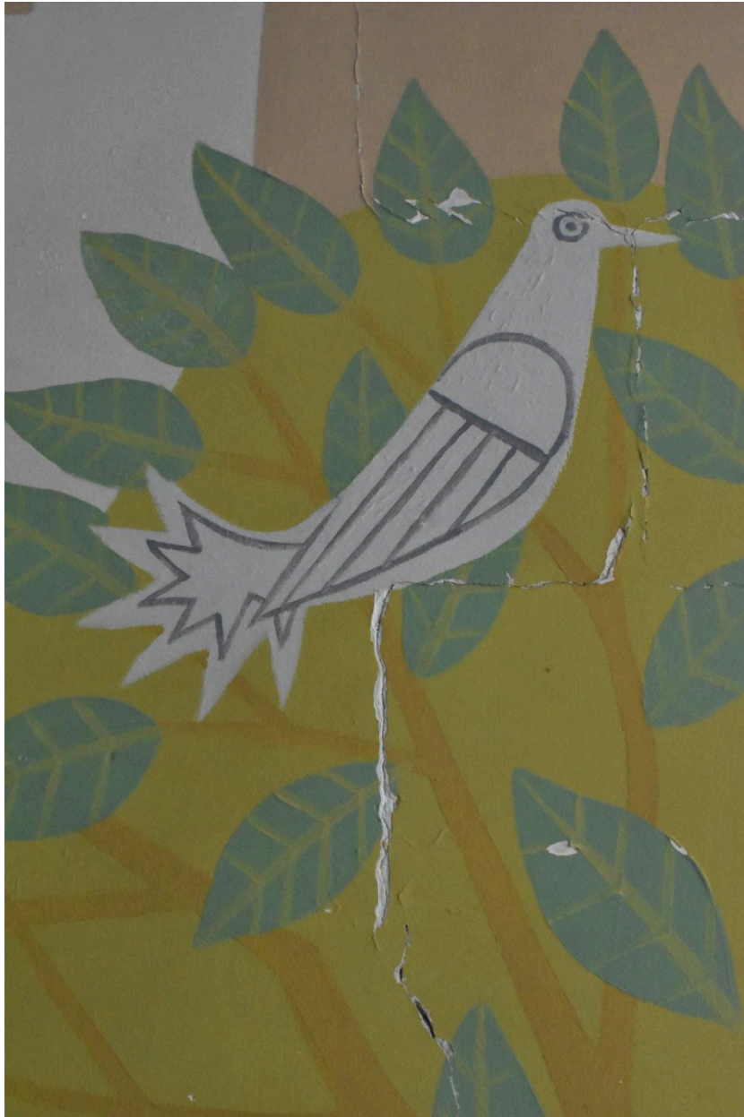
Peinture murale de la cantine, détail : un des volatiles.