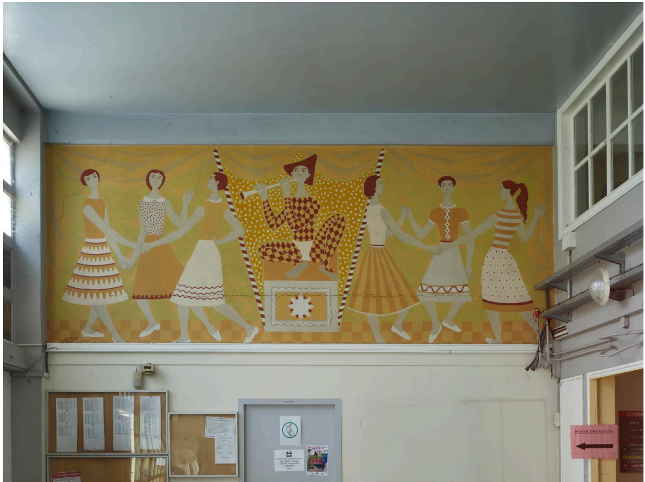
Peinture murale du préau.