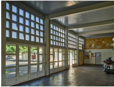
Vue générale de la salle haute dite préau, avec peinture murale côté ouest.