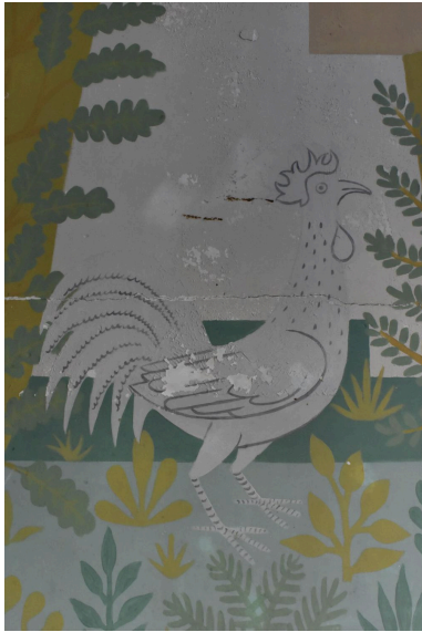
Peinture murale de la cantine, détail : le coq.