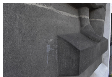
Détail du haut-relief représentant l'Abondance. Traces de bouchardage et layures (ou hachures). IVR84_20226301749NUCA