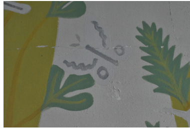
Peinture murale de la cantine, détail : le papillon. IVR84_20226301759NUCA