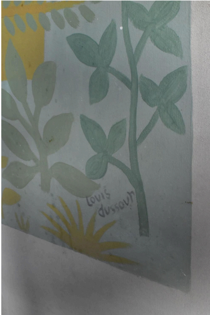
Peinture murale de la cantine, détail : la signature de Louis Dussour, dans l'angle en bas à droite.