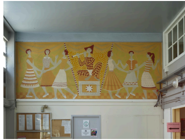
Peinture murale du préau.