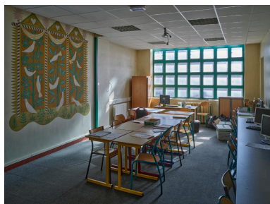
Vue générale du parloir. Le faux-plafond a été exécuté en tenant compte de la peinture murale.