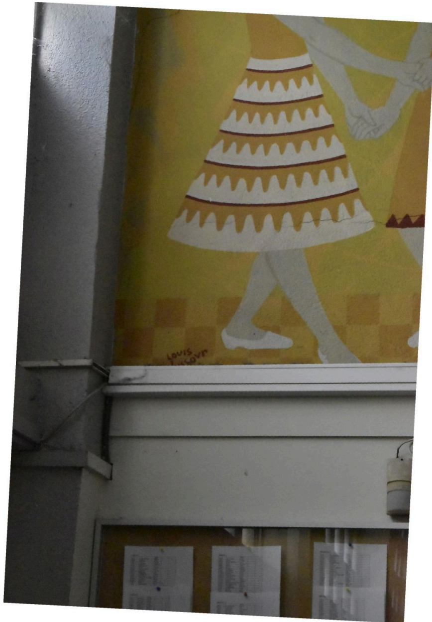
Détail de la signature de Louis Dussour sur le mur ouest du préau couvert.