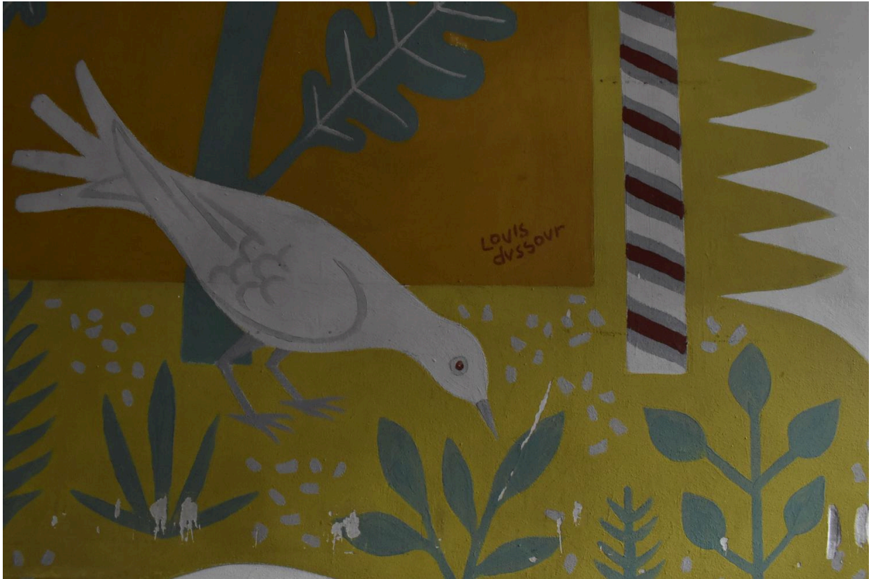
Signature du peintre, Louis Dussour, dans l'angle de la peinture murale située dans le parloir.