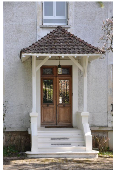
Détail sur le porche d'entrée IVR82_20137300036NUCA