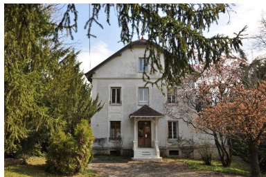
Vue d'ensemble depuis le chemin de Bellevue IVR82_20137300034NUCA