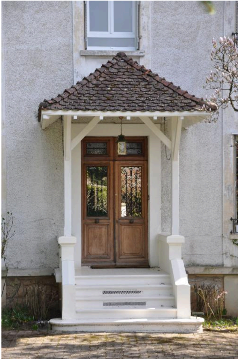
Détail sur le porche d'entrée