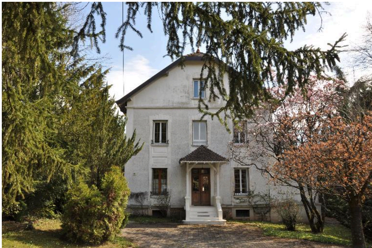
Vue d'ensemble depuis le chemin de Bellevue