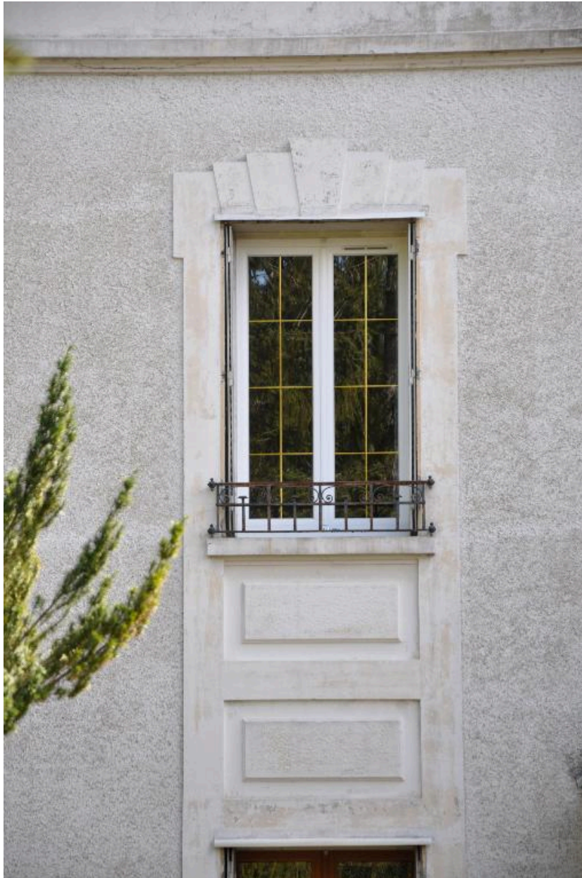
Détail sur une travée de baies à encadrement architecturalé