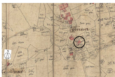
Plan de situation, d'après le cadastre de 1809, section A, échelle originale 1:2500.

Dess. Thierry Monnet IVR82_20124200654NUD