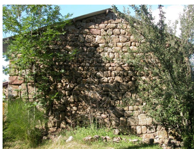
Vue d'ensemble du mur pignon sud de la ferme.

IVR82_20124200651NUCA