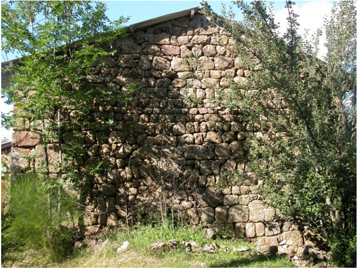
Vue d'ensemble du mur pignon sud de la ferme.