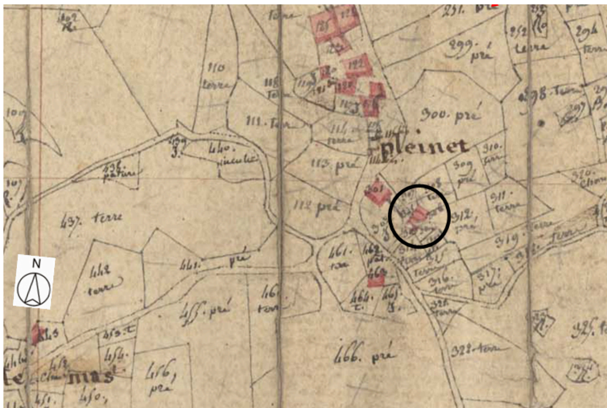
Plan de situation, d'après le cadastre de 1809, section A, échelle originale 1:2500.