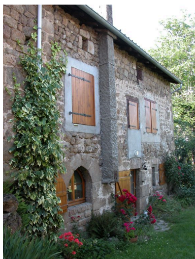
Vue d'ensemble de la ferme mitoyenne avec la travée comportant le portail de type ogival.

Phot. Thierry Monnet IVR82_20124200651NUCA