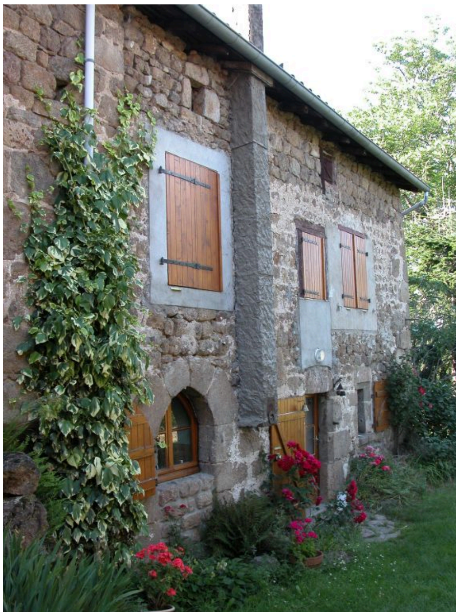
Vue d'ensemble de la ferme mitoyenne avec la travée comportant le portail de type ogival.