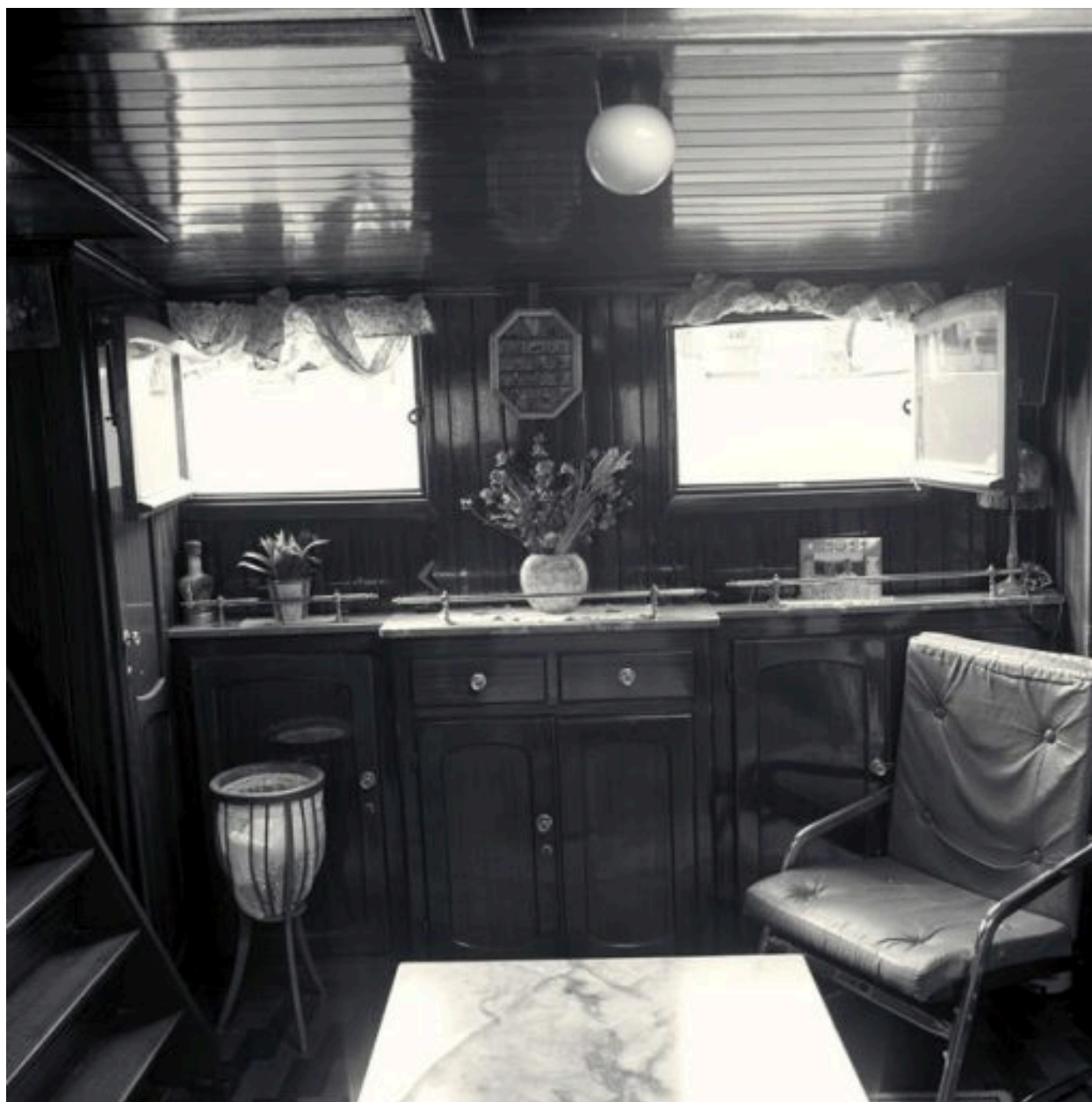
La pièce à vivre : vue de face des meubles de rangement