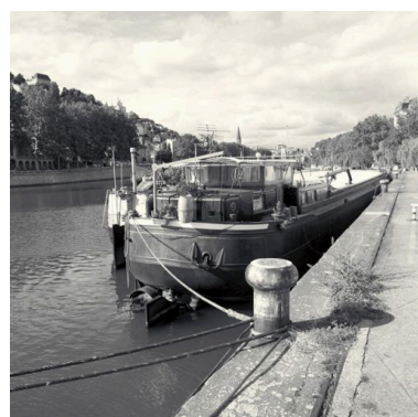
Vue d'ensemble depuis l'arrière IVR82_20026903690X