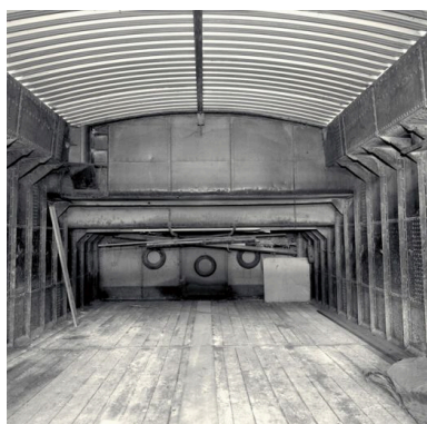
Vue d'ensemble de la cale