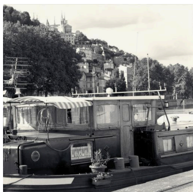
Vue d'ensemble de la cabine IVR82_20026903691X