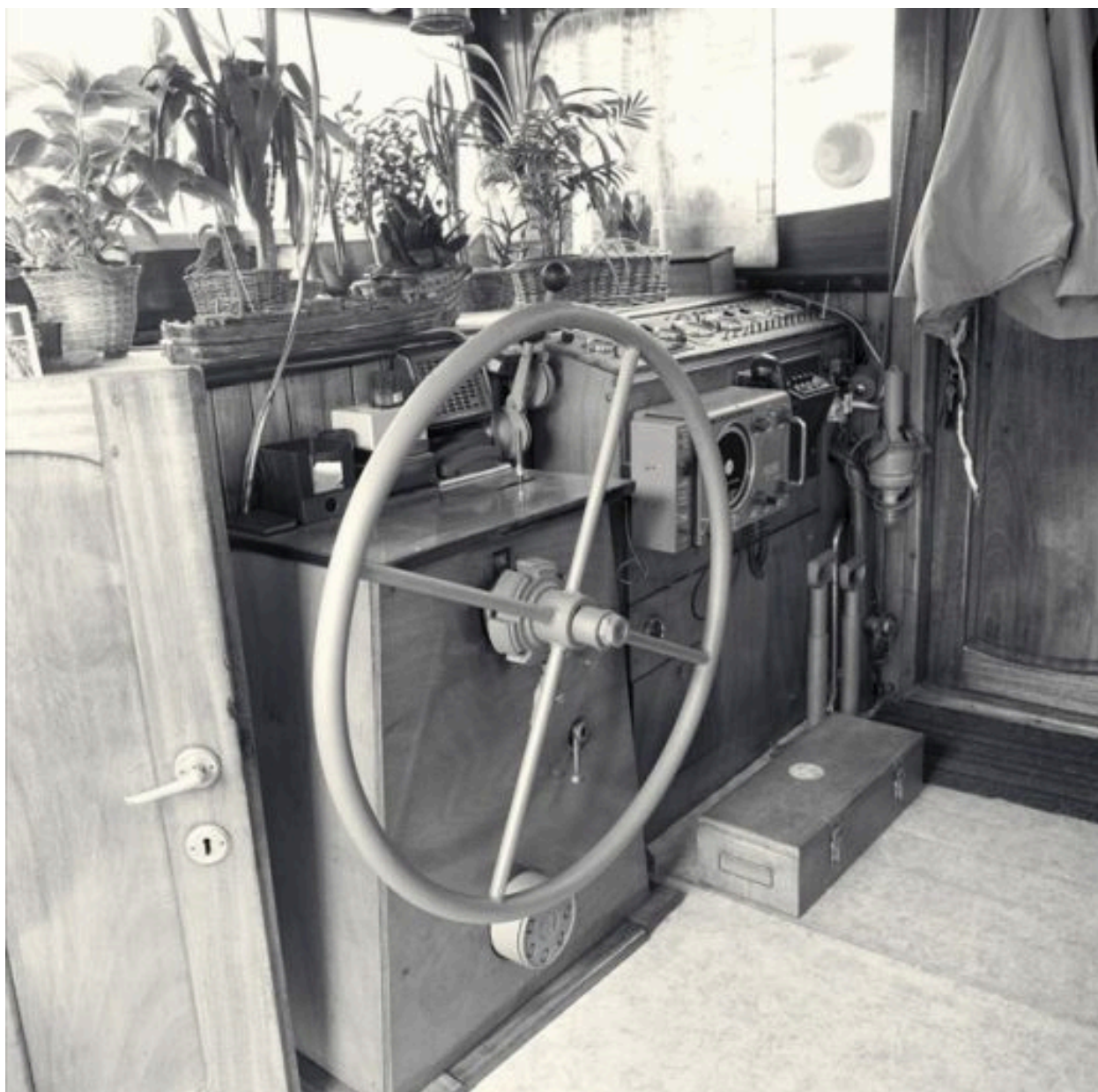
Vue de la timonerie