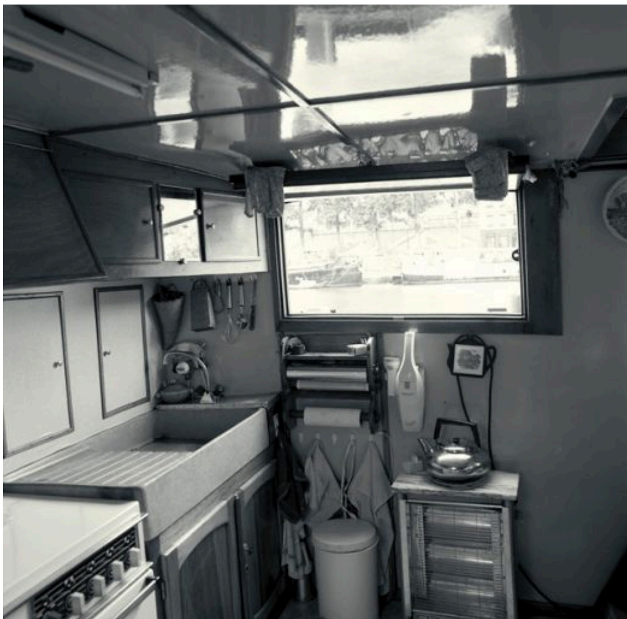
Vue de la cuisine