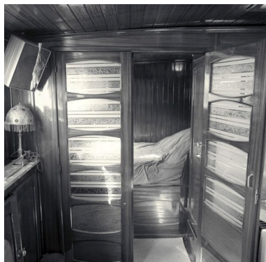
Une des chambre-alcôve IVR82_20026903695X