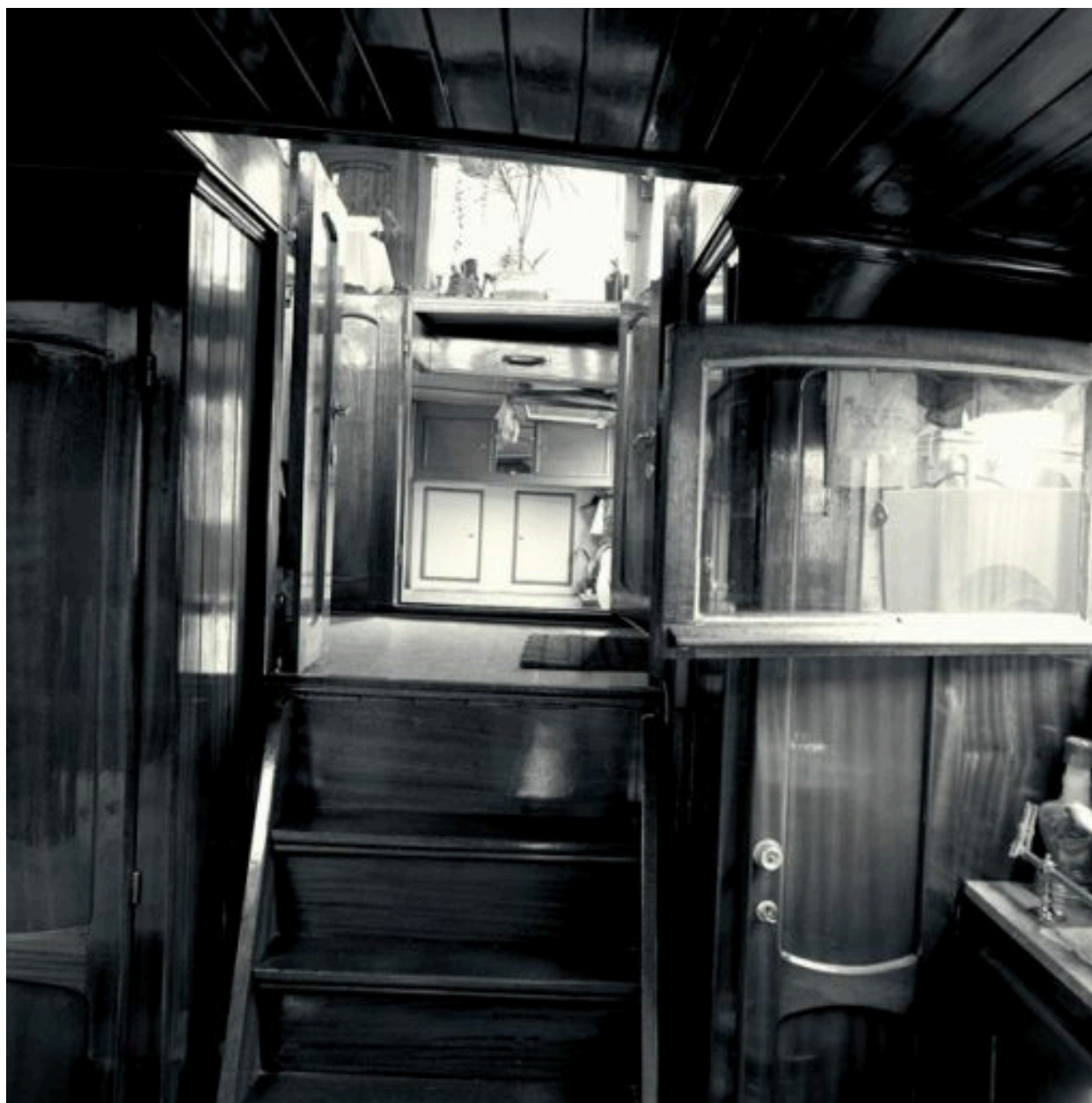
Echelle entre la timonerie et la pièce à vivre