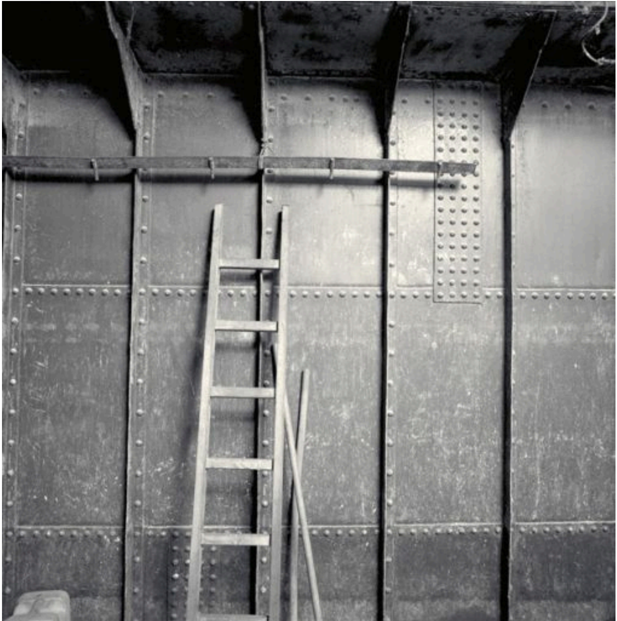
Détail de l'assemblage des parois de la cale