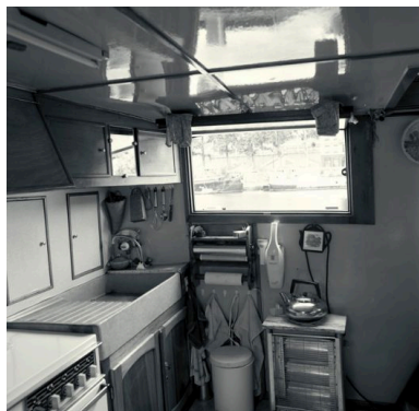
Vue de la cuisine