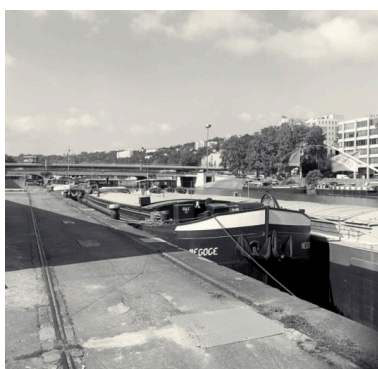
Vue d'ensemble depuis l'avant IVR82_20026903689X