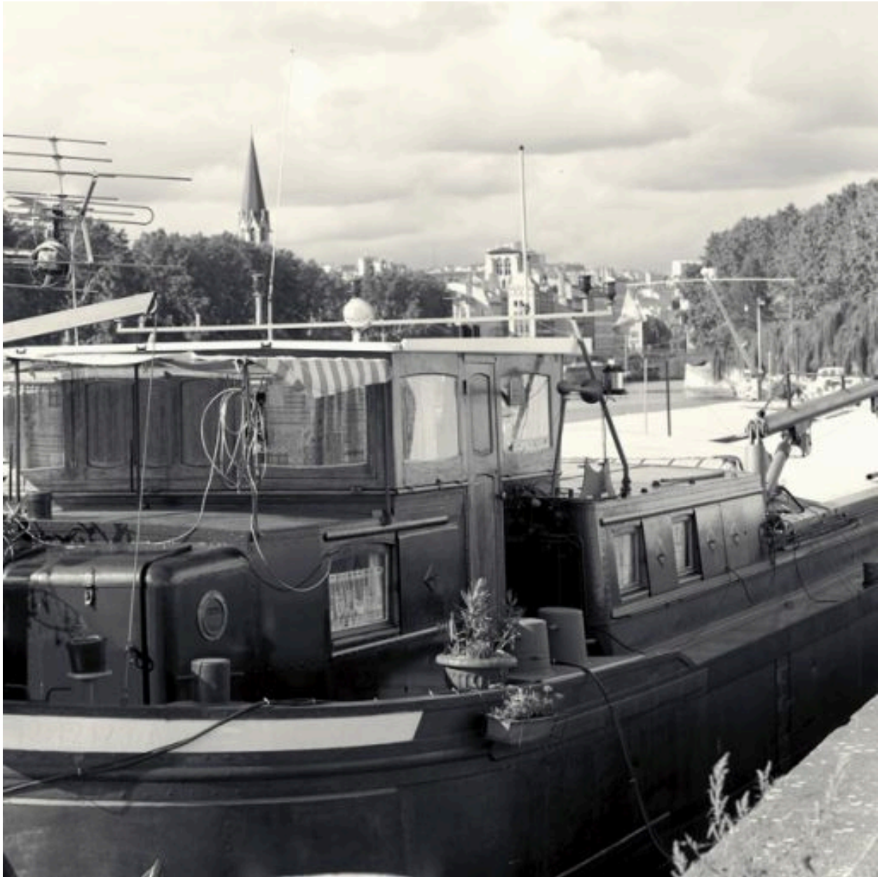
La cabine de pilotage