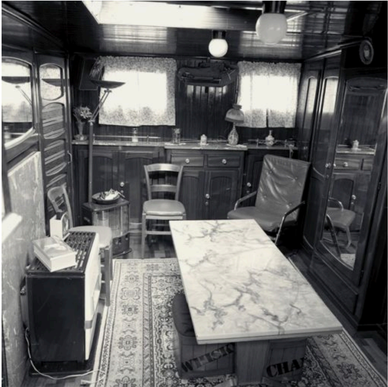
Vue de la pièce à vivre