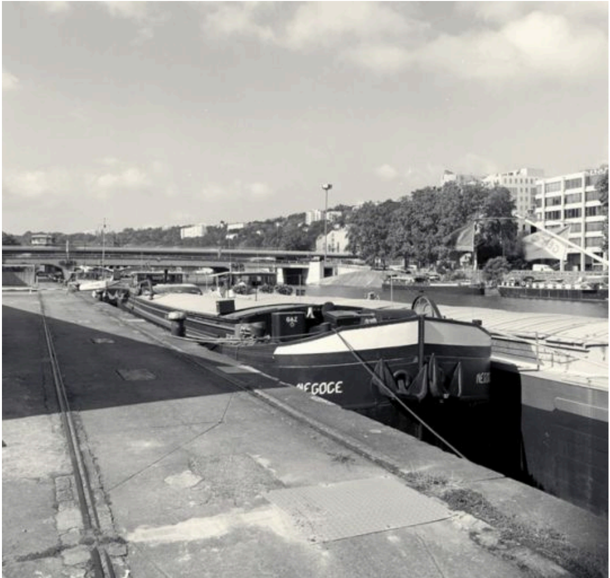
Vue d'ensemble depuis l'avant