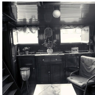
La pièce à vivre : vue de face des meubles de rangement IVR82_20026903697X