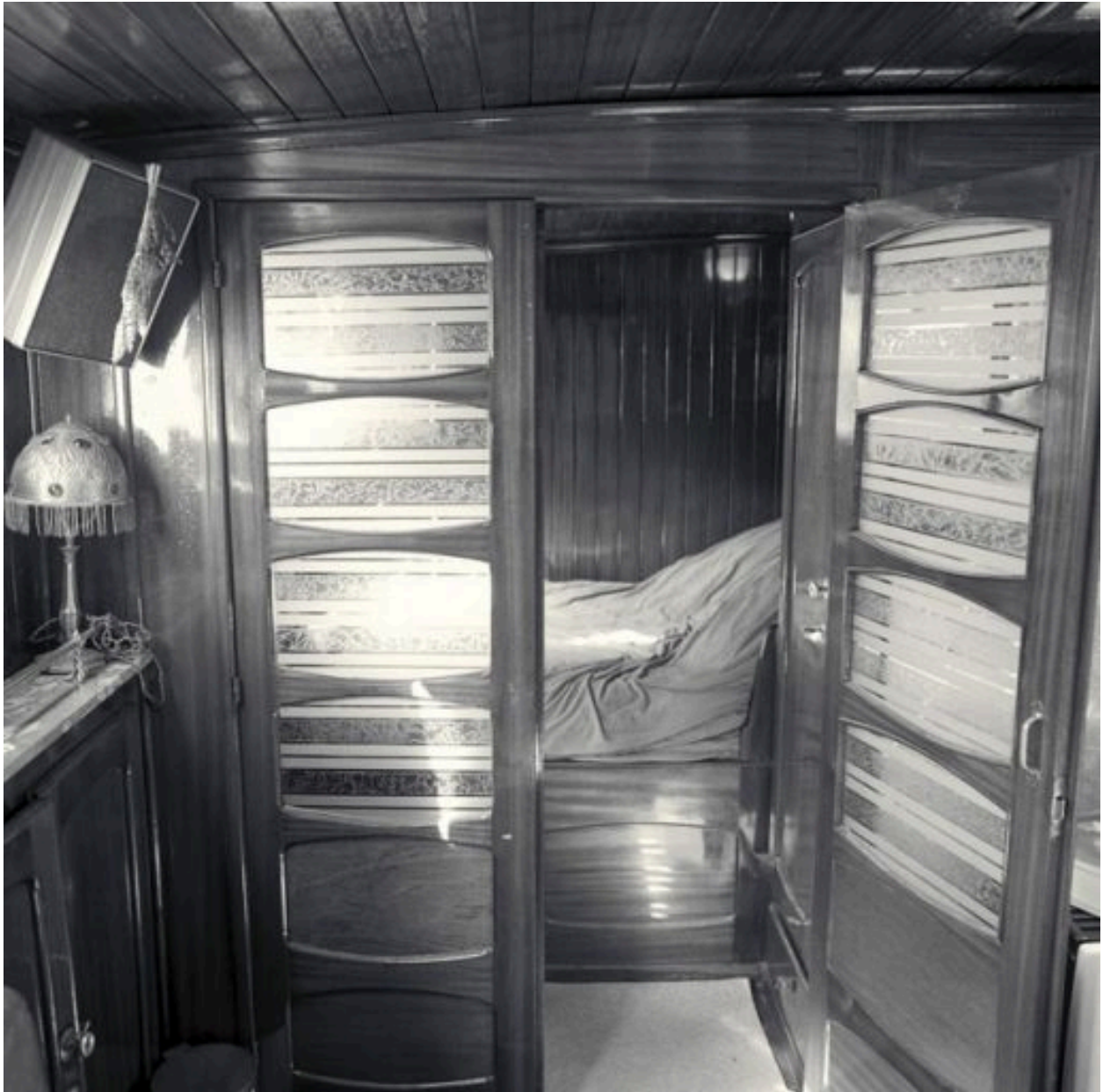
Une des chambre-alcôve