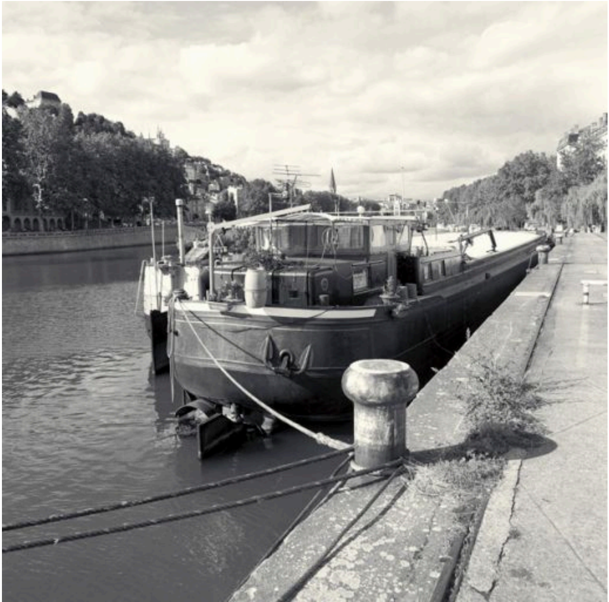
Vue d'ensemble depuis l'arrière