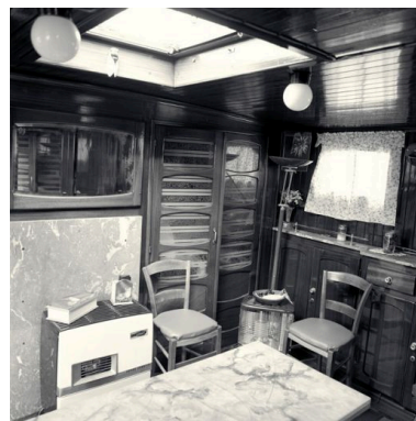
Vue de la pièce à vivre, avec les portes d'une des chambre-alcôve