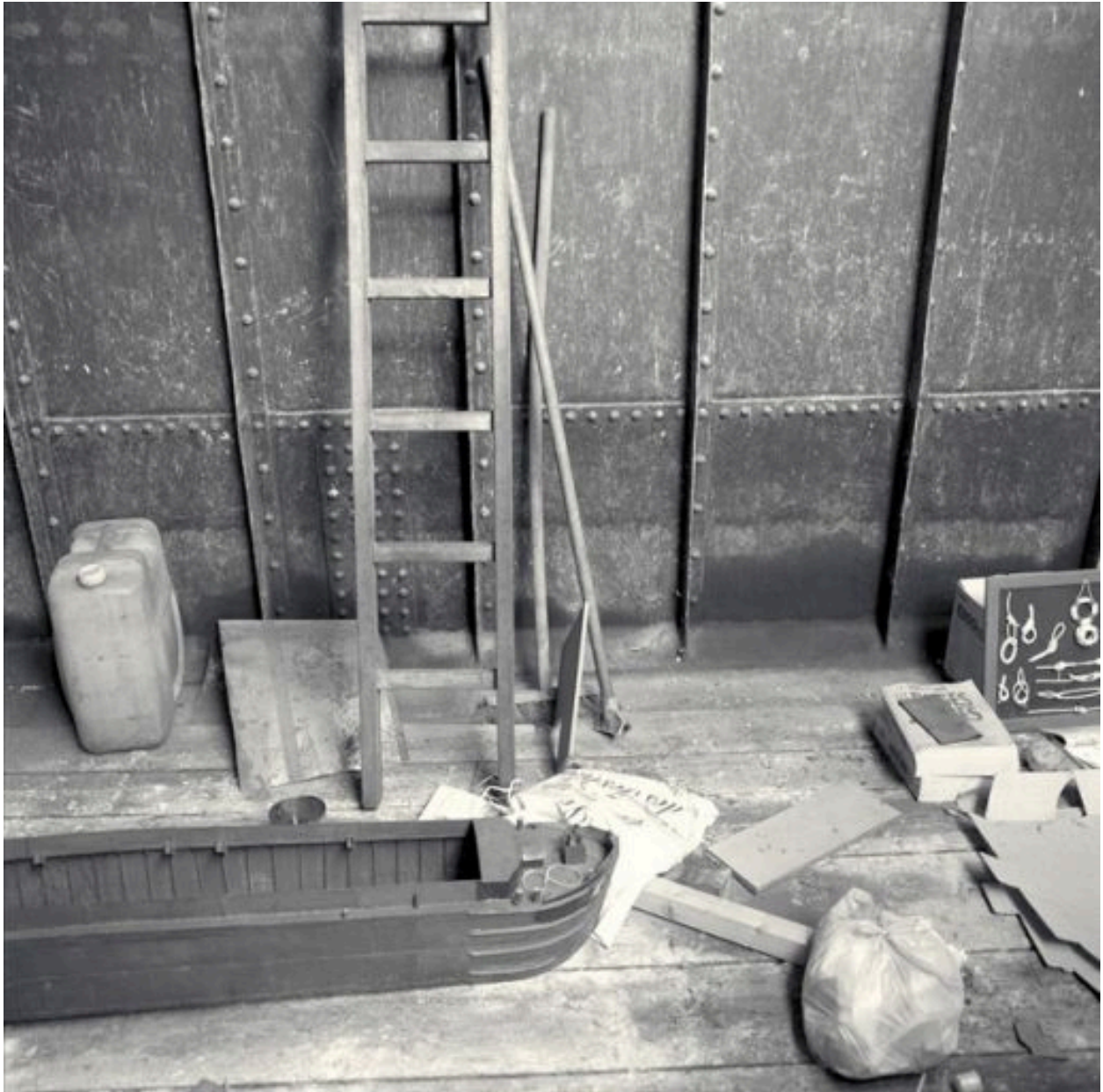
La cale : détail de l'échelle et des parois