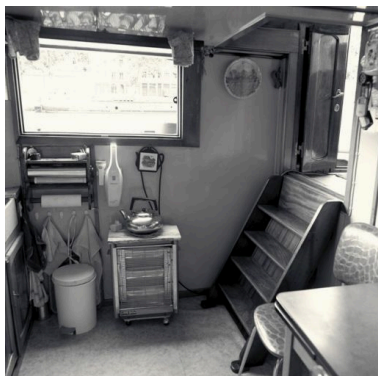
Vue vers la fenêtre de la cuisine