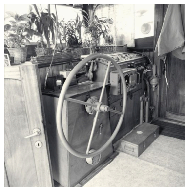
Vue de la timonerie