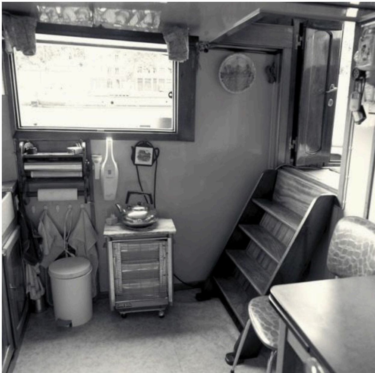
Vue vers la fenêtre de la cuisine