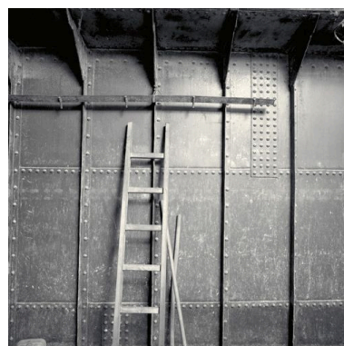
Détail de l'assemblage des parois de la cale