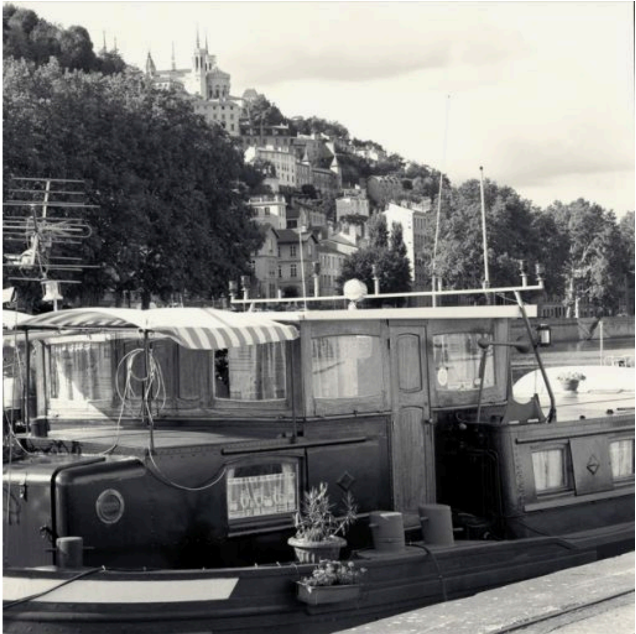
Vue d'ensemble de la cabine