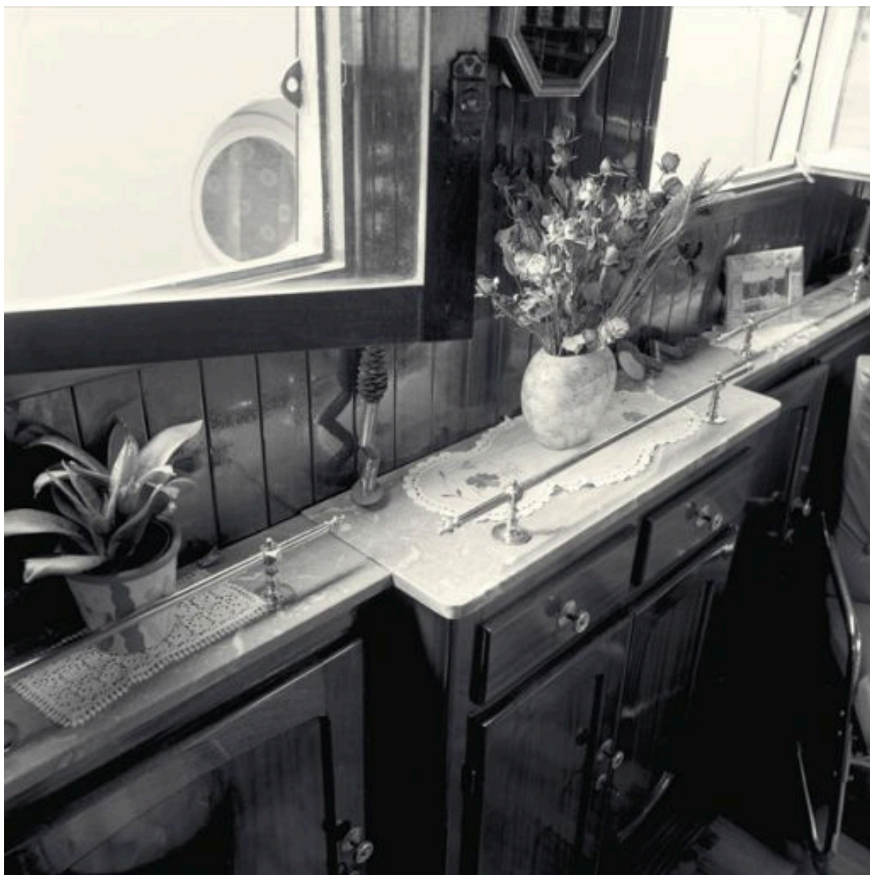
La pièce à vivre : vue de trois-quart des meubles de rangement