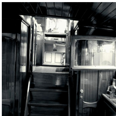
Echelle entre la timonerie et la pièce à vivre