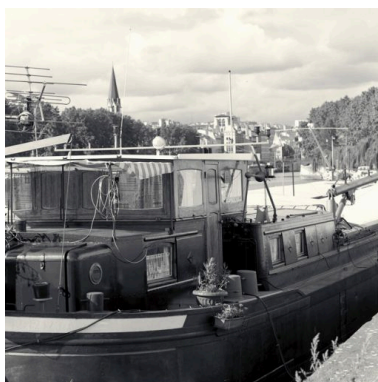
La cabine de pilotage