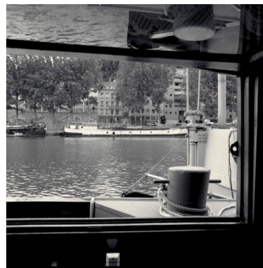
Vue vers la Saône depuis la fenêtre de la cuisine IVR82_20026903649X