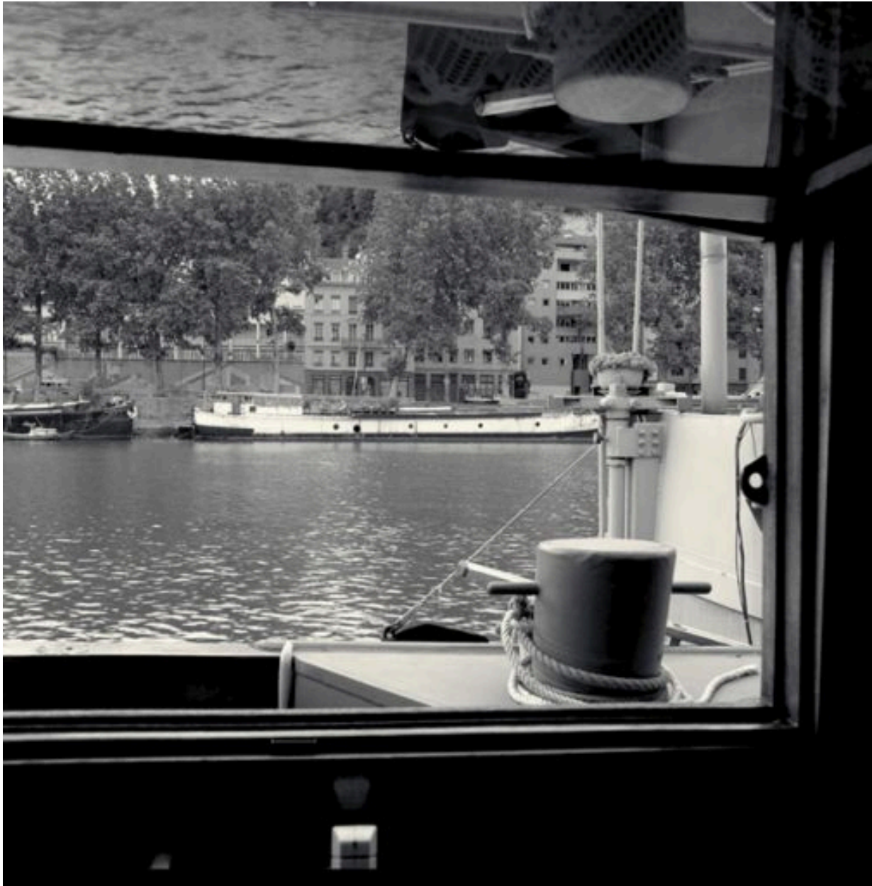
Vue vers la Saône depuis la fenêtre de la cuisine