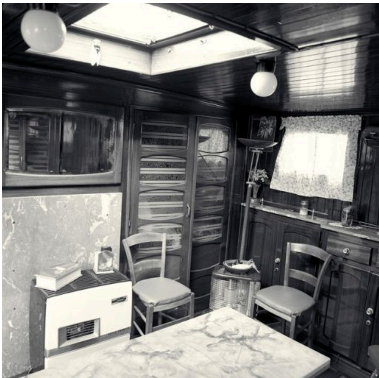
Vue de la pièce à vivre, avec les portes d'une des chambre-alcôve