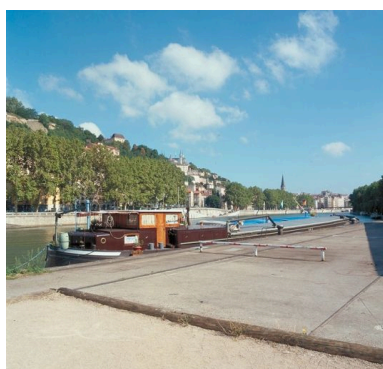
Vue générale IVR82_20026903644XA