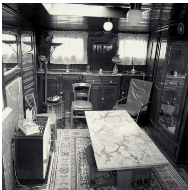
Vue de la pièce à vivre IVR82_20026903646X