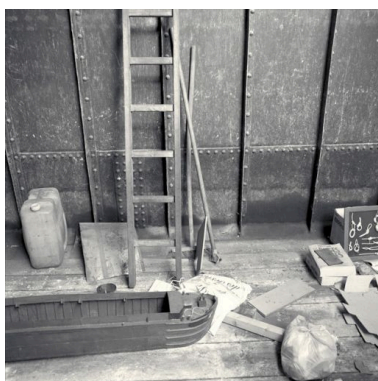
La cale : détail de l'échelle et des parois