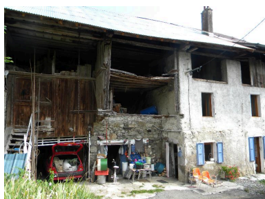
Vue de la façade principale.