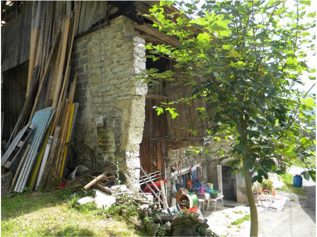
Vue de trois-quarts depuis l'amont.