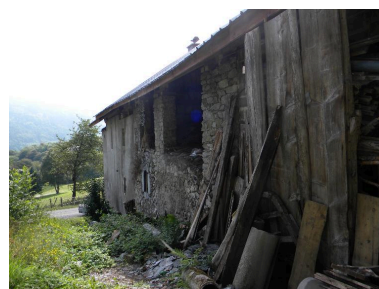
Vue de la façade arrière IVR82_20137401899NUCA