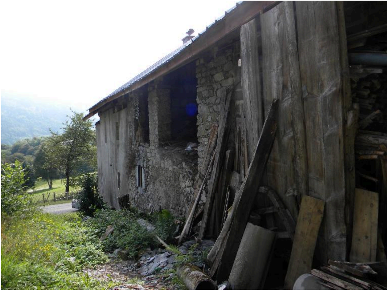
Vue de la façade arrière