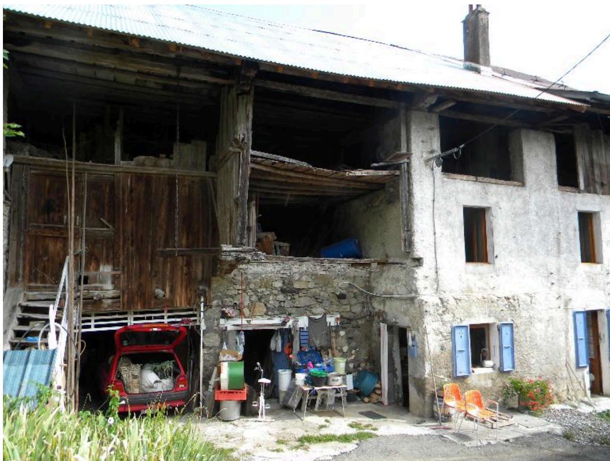
Vue de la façade principale.