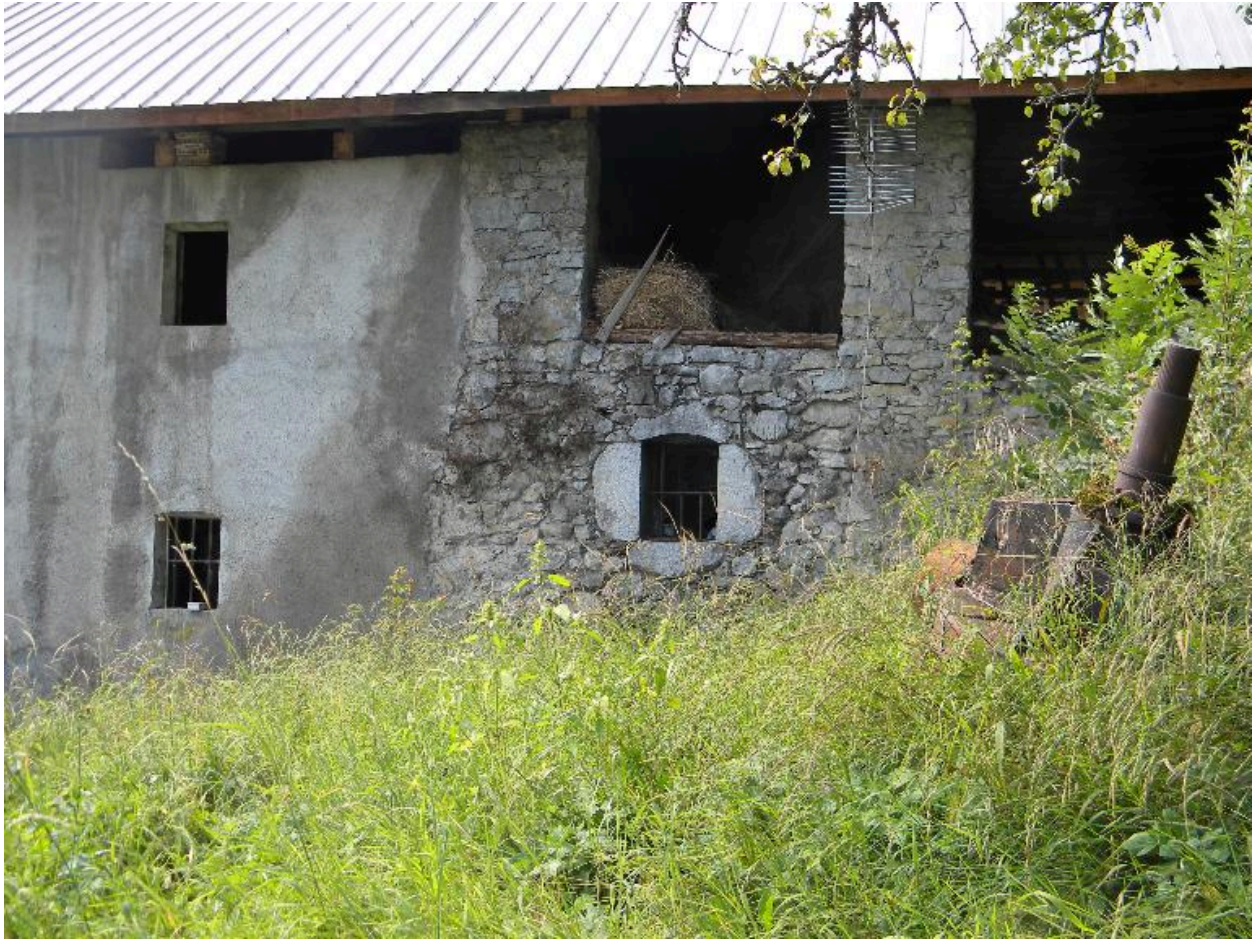
Façade arrière avec une fenêtre au linteau délardé.