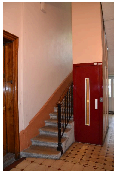
Départ escalier IVR82_20156900094NUCA