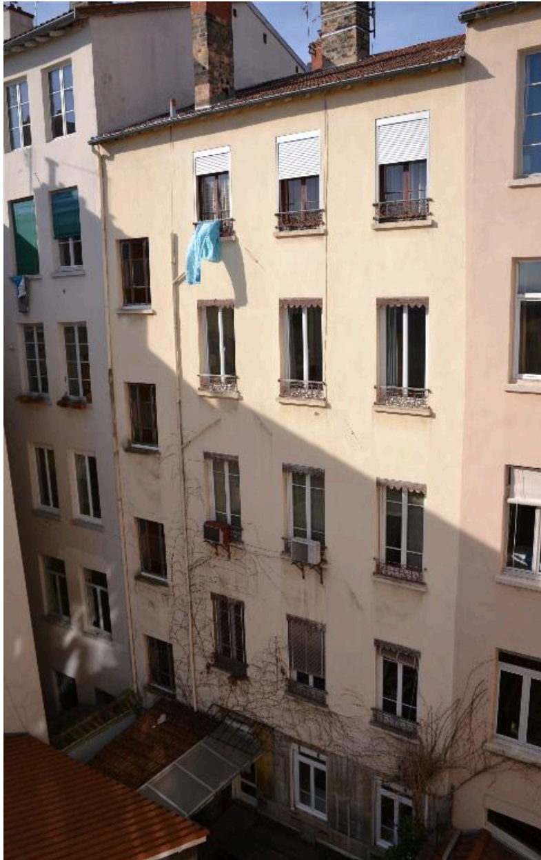
Vue d'ensemble façade est