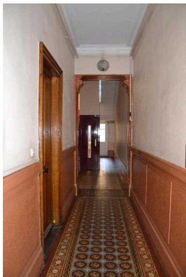
Entrée IVR82_20156900216NUCA