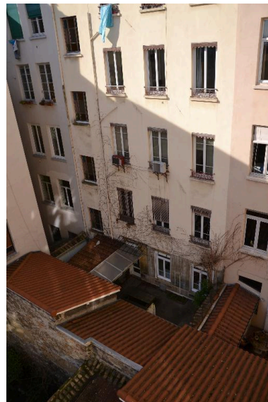
Vue d'ensemble cour