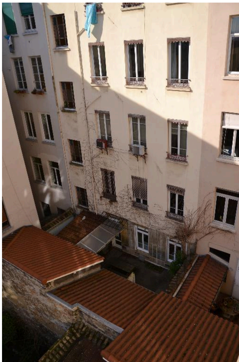
Vue d'ensemble cour