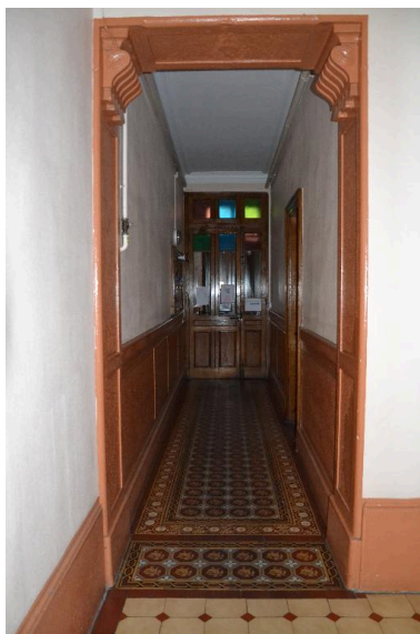
Allée IVR82_20156900221NUCA