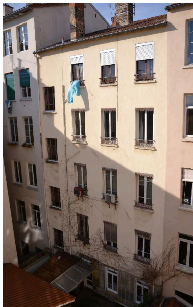
Vue d'ensemble façade est IVR82_20156900259NUCA