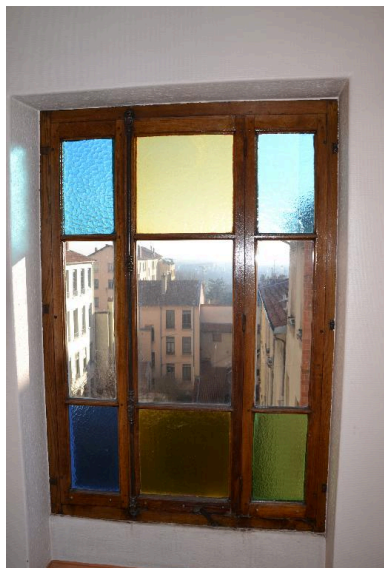
Fenêtre escalier IVR82_20156900218NUCA