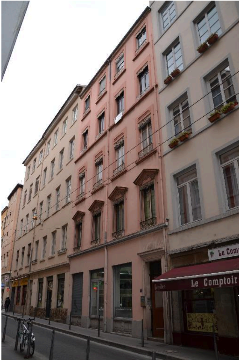
Vue d'ensemble façade ouest