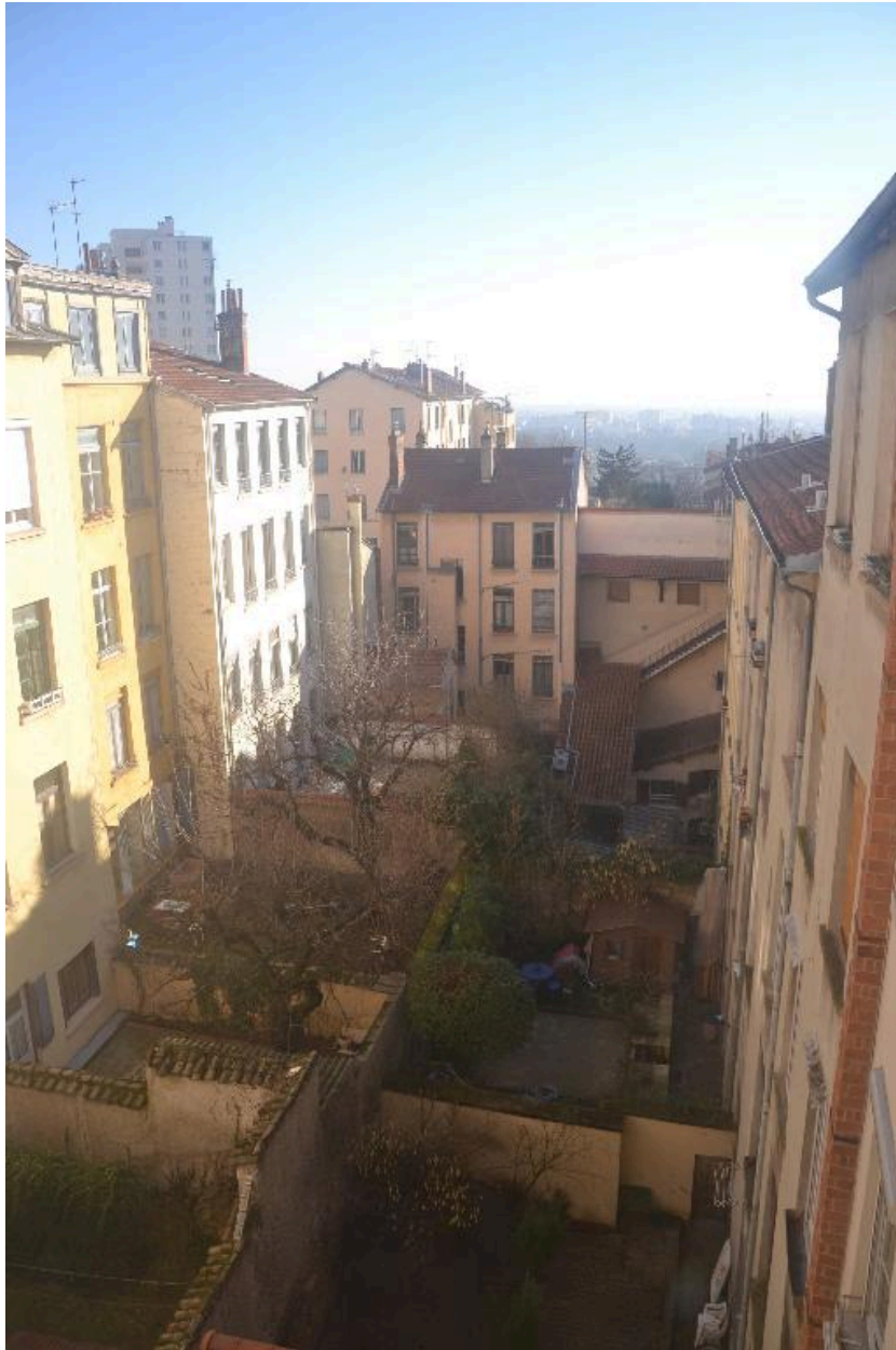
Vue depuis l'immeuble