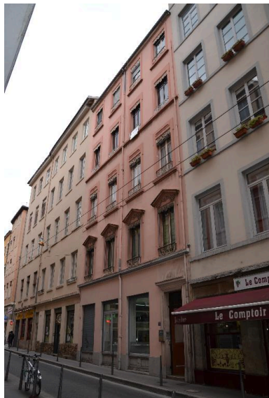
Vue d'ensemble façade ouest IVR82_20156900095NUCA