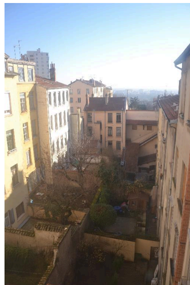
Vue depuis l'immeuble IVR82_20156900219NUCA