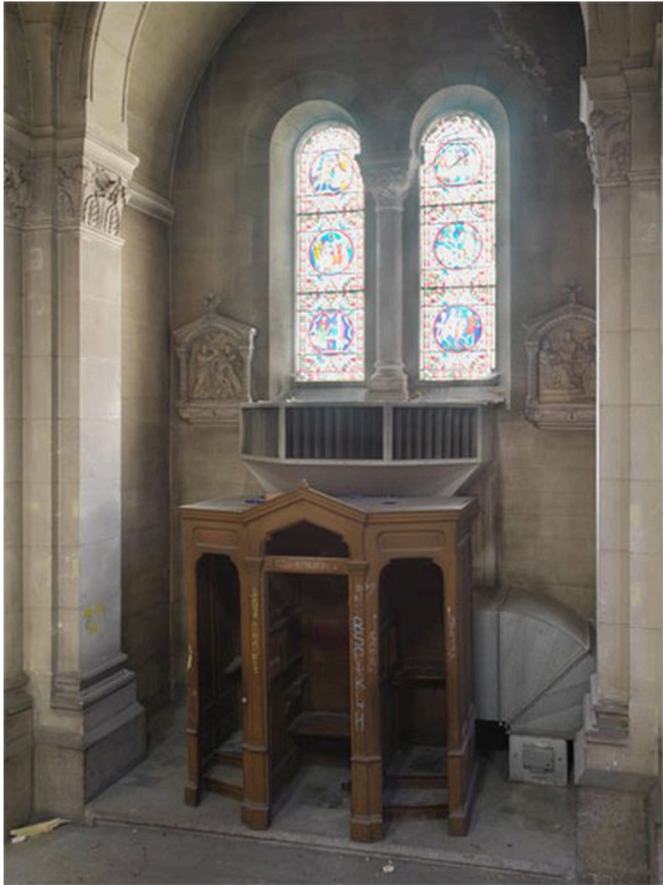
Vue d'un confessionnal.