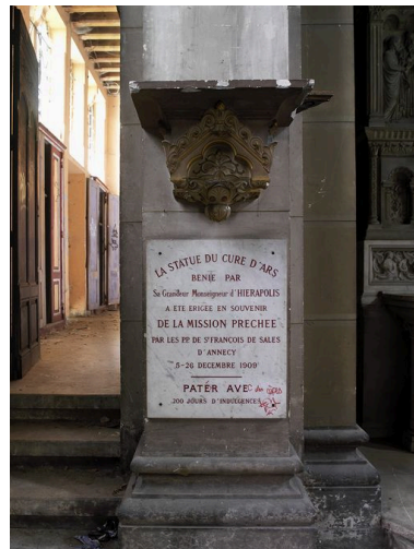
Détail de la plaque commémorative posée en 1909 lors de la mise en place de la statue du curé d'Ars.