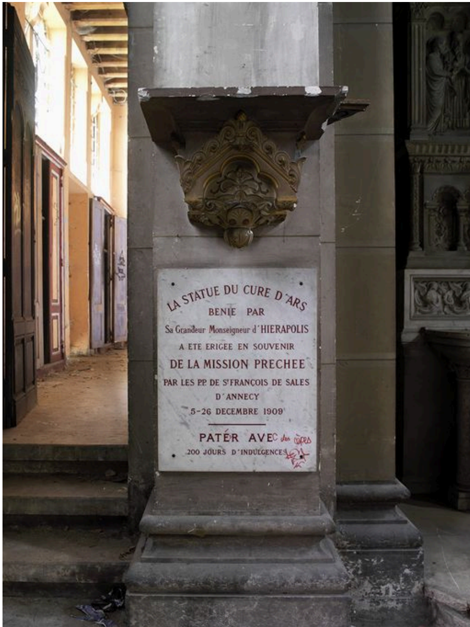
Détail de la plaque commémorative posée en 1909 lors de la mise en place de la statue du curé d'Ars.