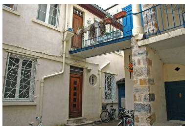
Façade ouest sur cour depuis l'angle nord-ouest de la cour IVR82_20066901308NUCA

Vue du mur pignon sud depuis une cour voisine au sud IVR82_20146900802NUCA