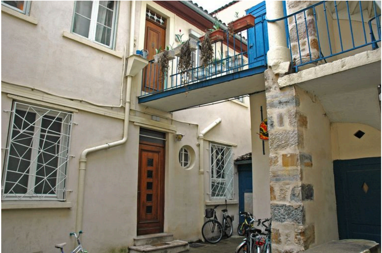
Façade ouest sur cour depuis l'angle nord-ouest de la cour