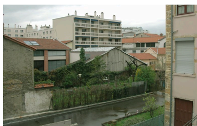
Jardin vu depuis une cage d'escalier voisine nord ouest IVR82_20066901304NUCA

Vue du mur pignon sud depuis une cour voisine au sud IVR82_20146900802NUCA