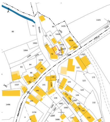
Cadastre actuel, 2007 IVR82_20107300566NUCA