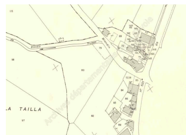
Cadastre rénové, 1975-1988. Cadastre de 1975-1988 AD Savoie. 3P 7237 IVR82_20107300565NUCA