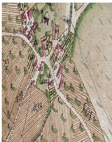
Cadastre de 1732. Cadastre de 1728 AD Savoie. C 3972 IVR82_20107300563NUCA