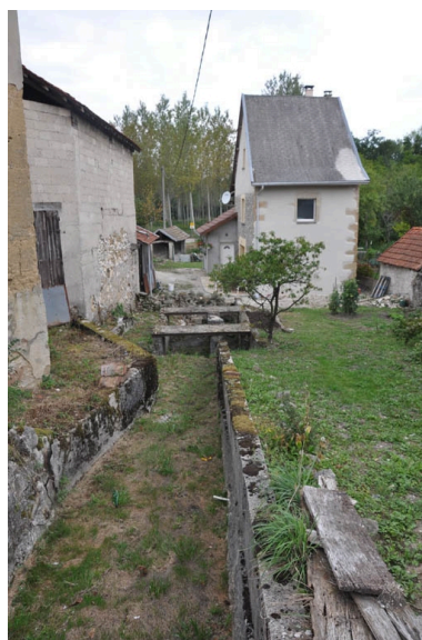
Vue générale sud de l'emplacement de l'ancien moulin à foulon IVR82_20107300567NUCA