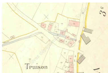
Premier cadastre français, 1914. Cadastre de 1914 AD Savoie. 3P 7236 IVR82_20107300564NUCA