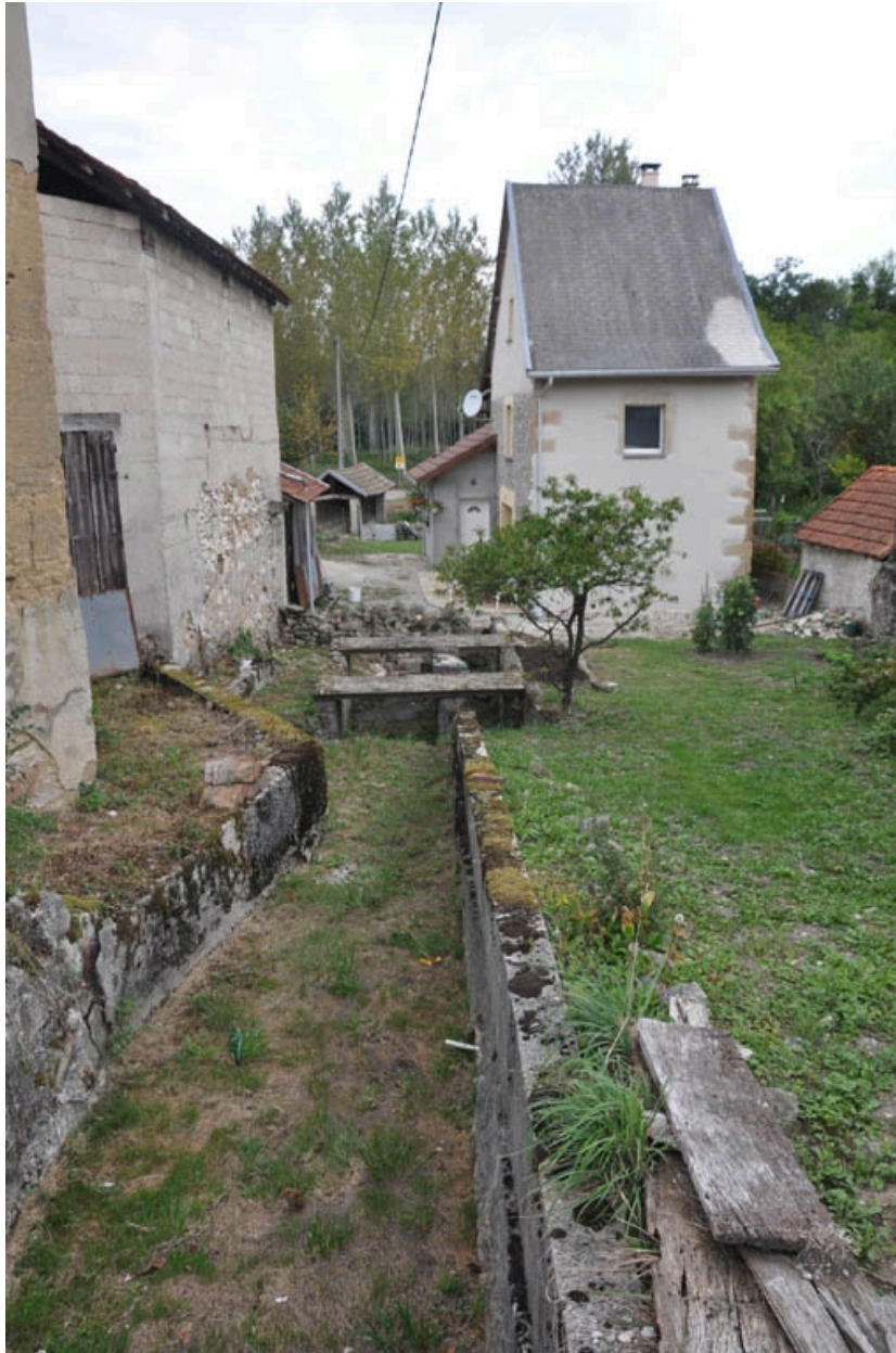
Vue générale sud de l'emplacement de l'ancien moulin à foulon