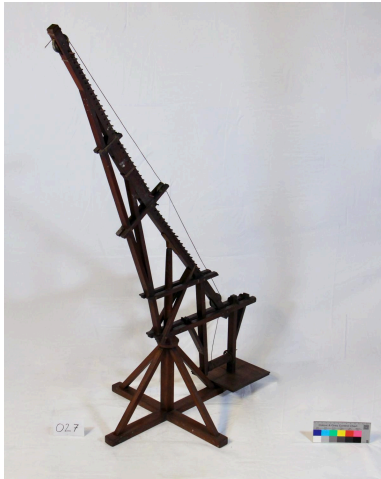
IVR84_20256901006NUCA