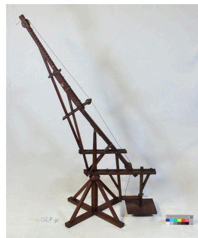
IVR84_20256901005NUCA