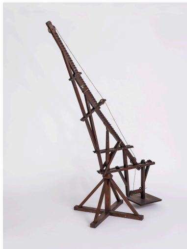
Vue d'ensemble IVR84_20246900122NUCA