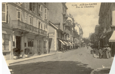
Vue prise du sud IVR82_20077300441NUCB