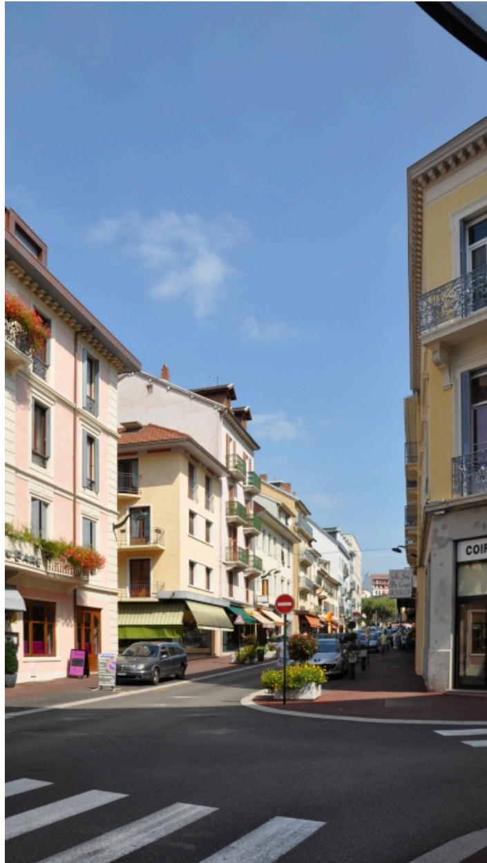
Vue prise de l'avenue de Marlioz