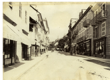
Vue depuis le sud, 1890