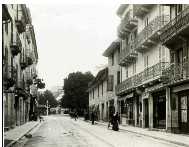
Vue en direction du nord, avant 1905