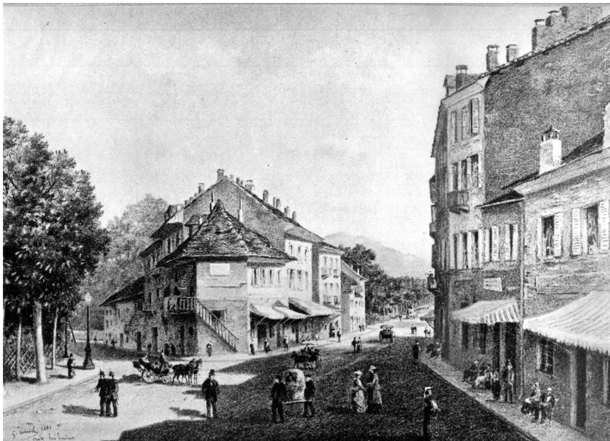
Jonction des rues de Chambéry et Victor-Hugo, 1881