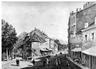
Jonction des rues de Chambéry et Victor-Hugo, 1881 IVR82_20117300901NUCB