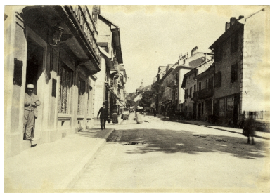
Vue depuis le sud, 1890 IVR82_20127301033NUCB