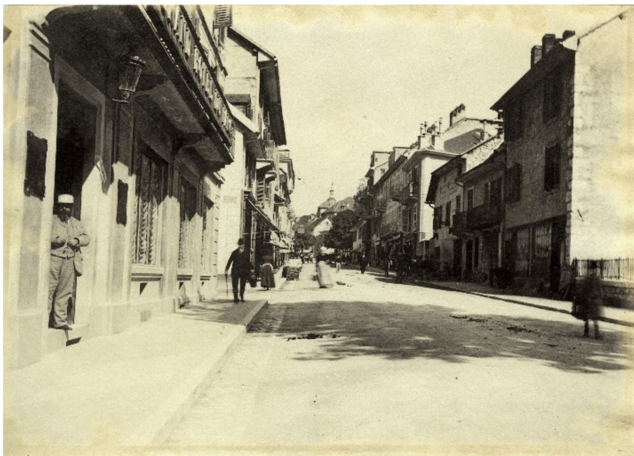
Vue depuis le sud, 1890