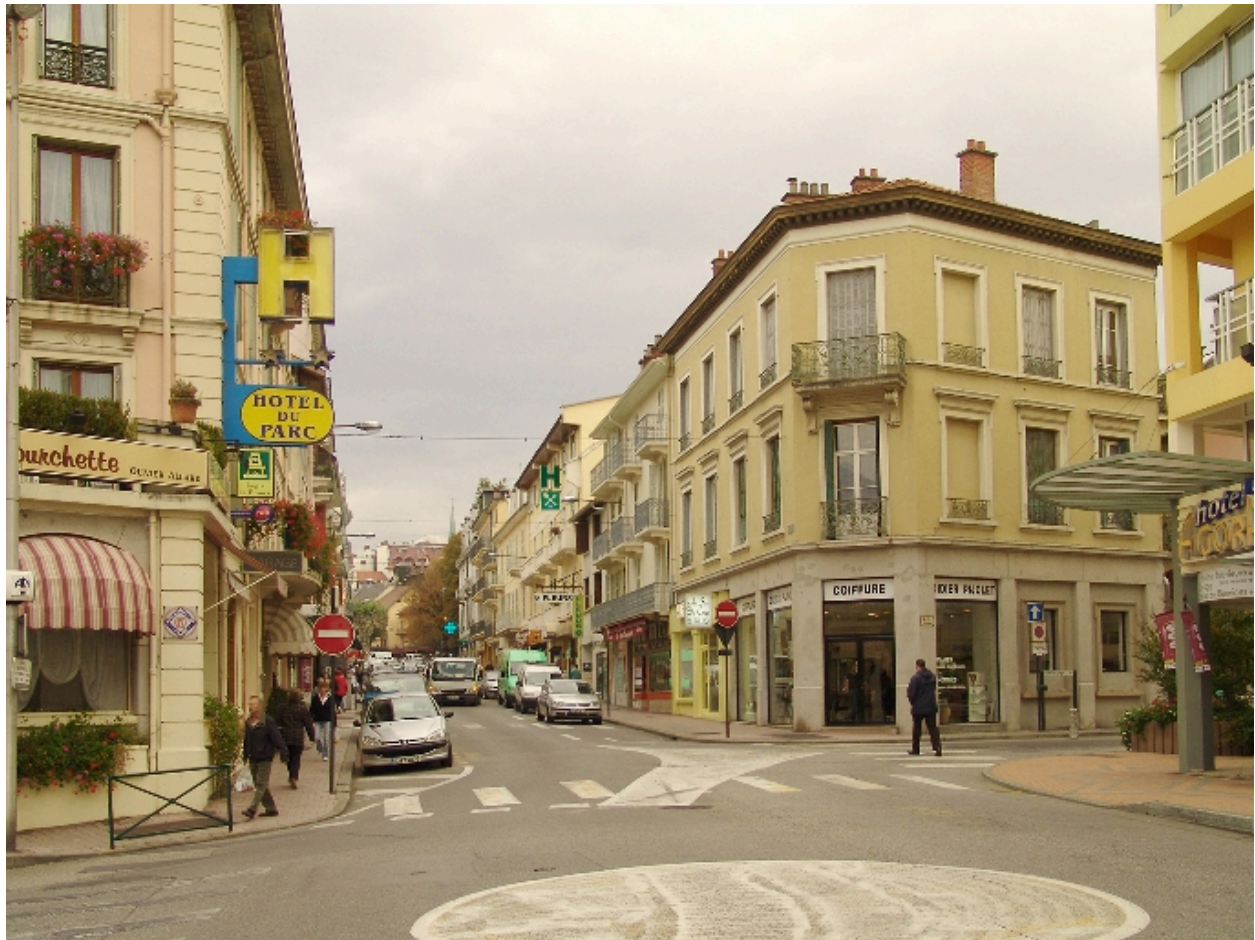
Vue prise du sud