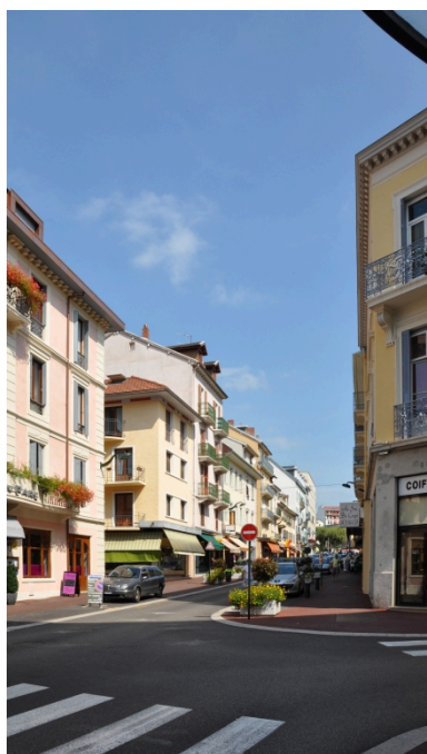
Vue prise de l'avenue de Marlioz