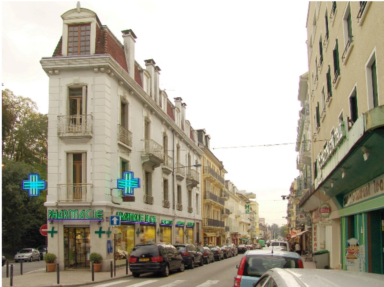
Vue depuis le nord