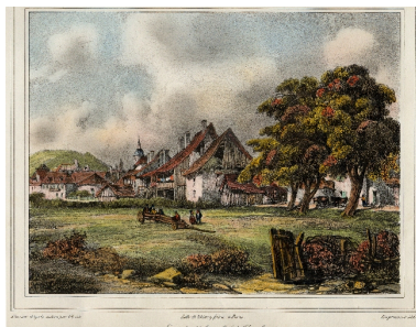
Entrée sud de la ville