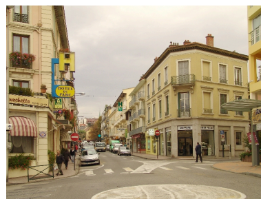
Vue prise du sud