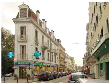
Vue depuis le nord