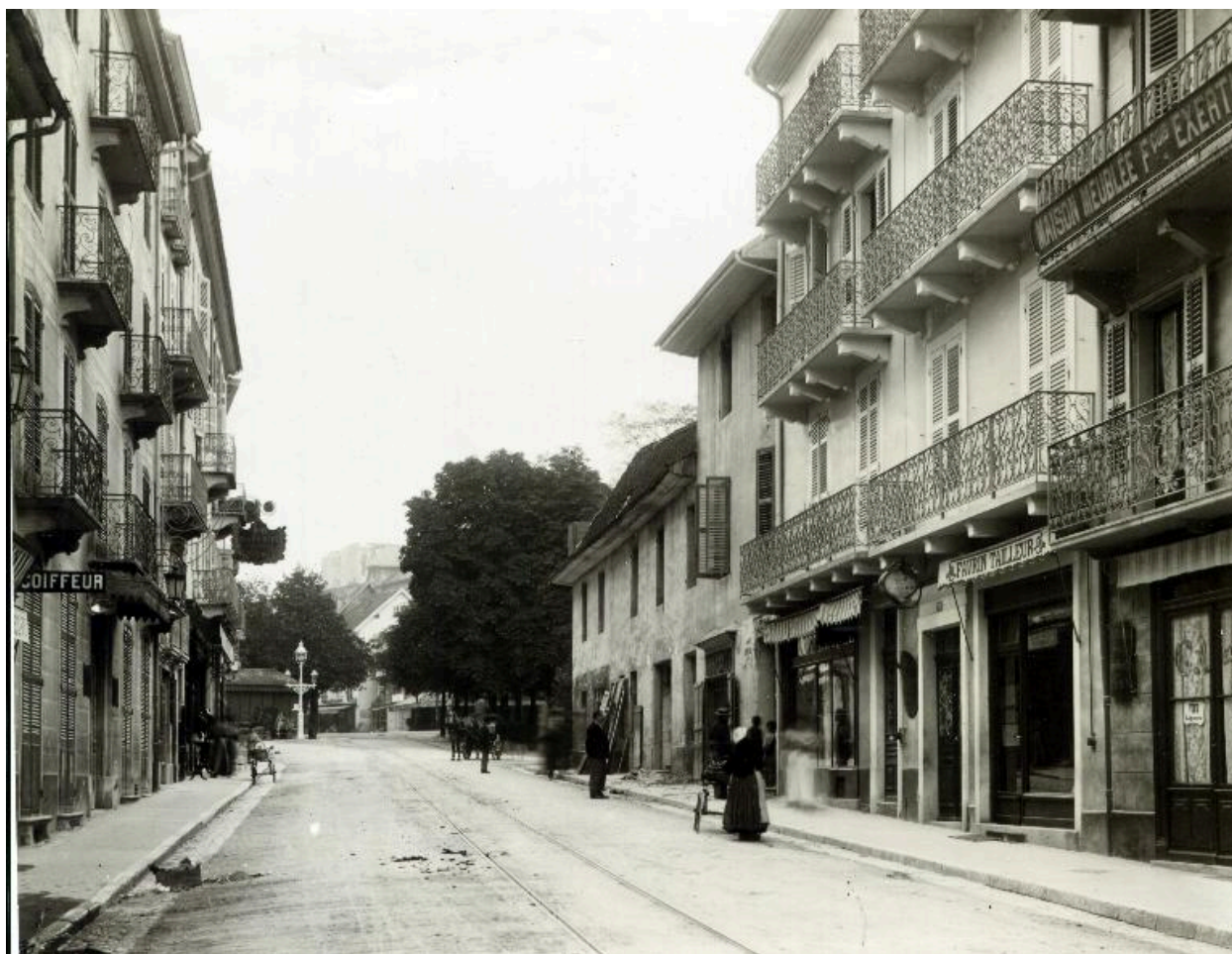
Vue en direction du nord, avant 1905