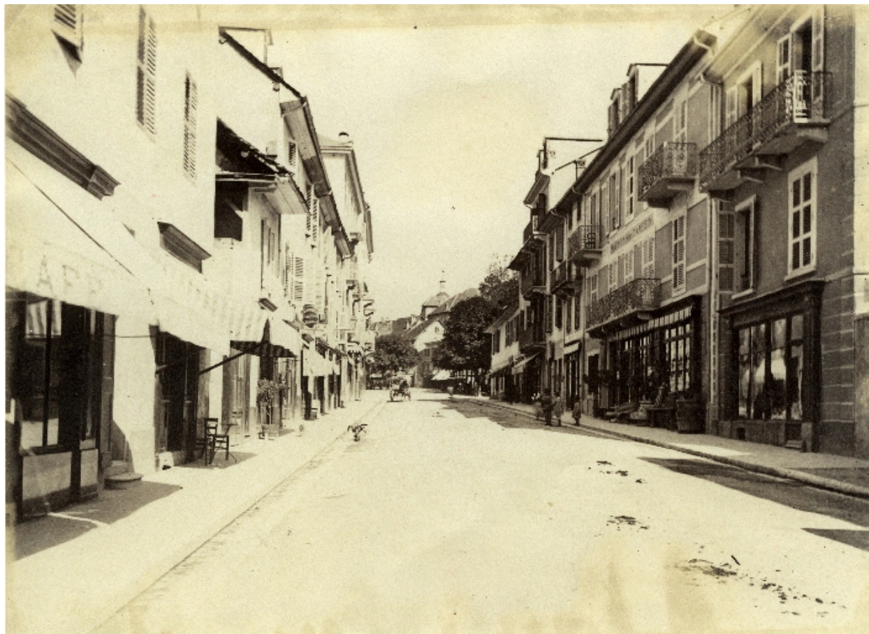
Vue depuis le sud, 1890