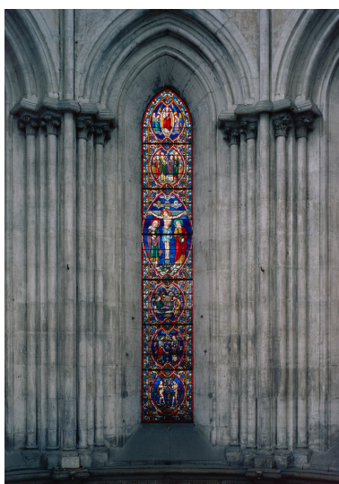
Baie 0 IVR82_19853800005PA