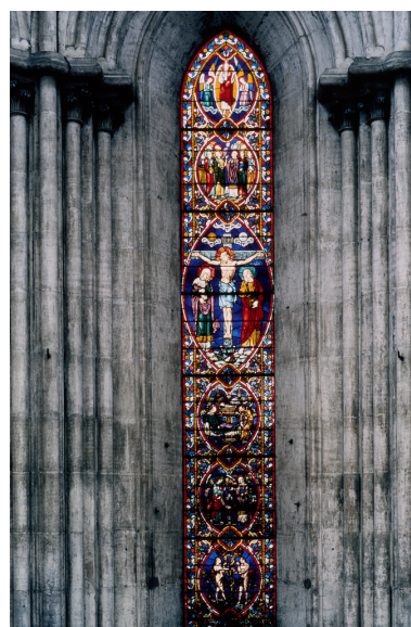
Baie 0 IVR82_19853800026ZA