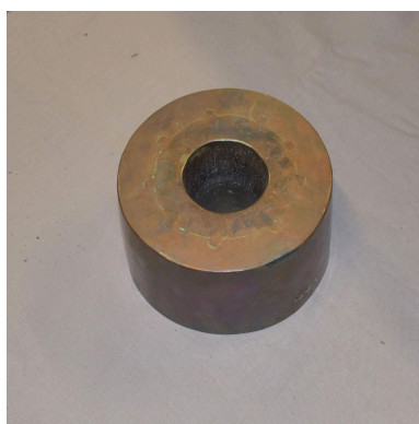
Vue générale IVR84_20226302507NUC4A