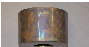
Détail - inscription IVR84_20226302508NUC4A