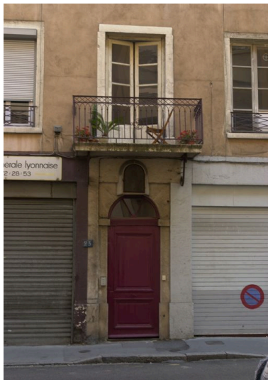
Détail de la travée centrale : porte et balcon IVR82_20046904987NUCA