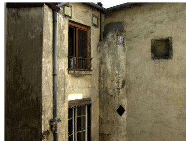
Elévation postérieure IVR82_20046904744NUCA