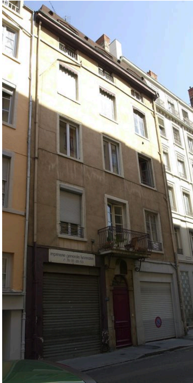
Vue de la façade sur rue