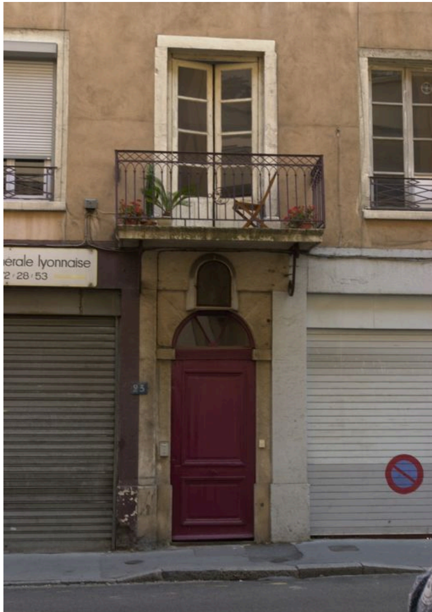
Détail de la travée centrale : porte et balcon