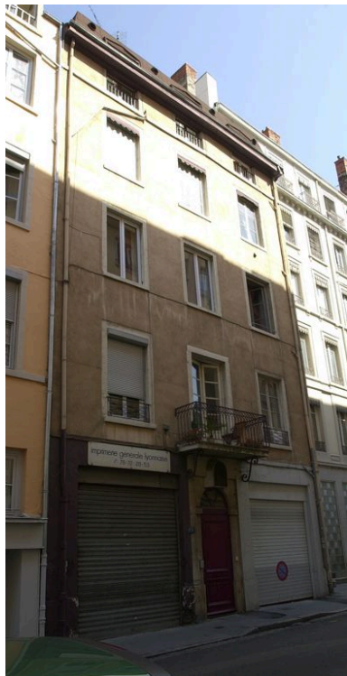
Vue de la façade sur rue IVR82_20046904986NUCA