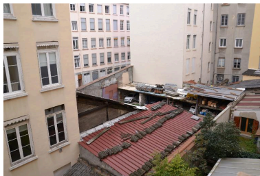
Vue arrière IVR82_20156900560NUCA