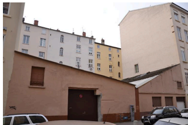
Vue d'ensemble IVR82_20156900450NUCA