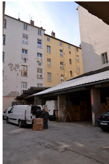
Intérieur IVR82_20156900474NUCA