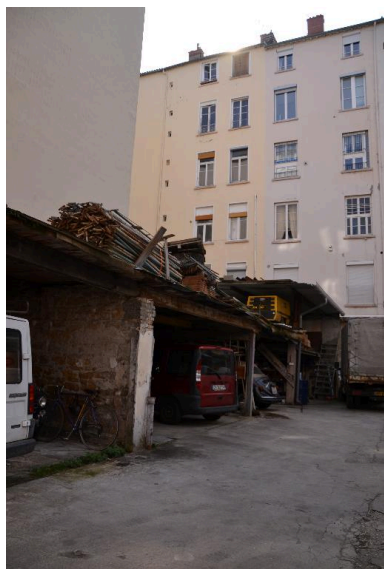
Intérieur IVR82_20156900475NUCA