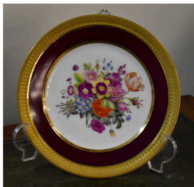
Vue générale IVR84_20256300901NUCA