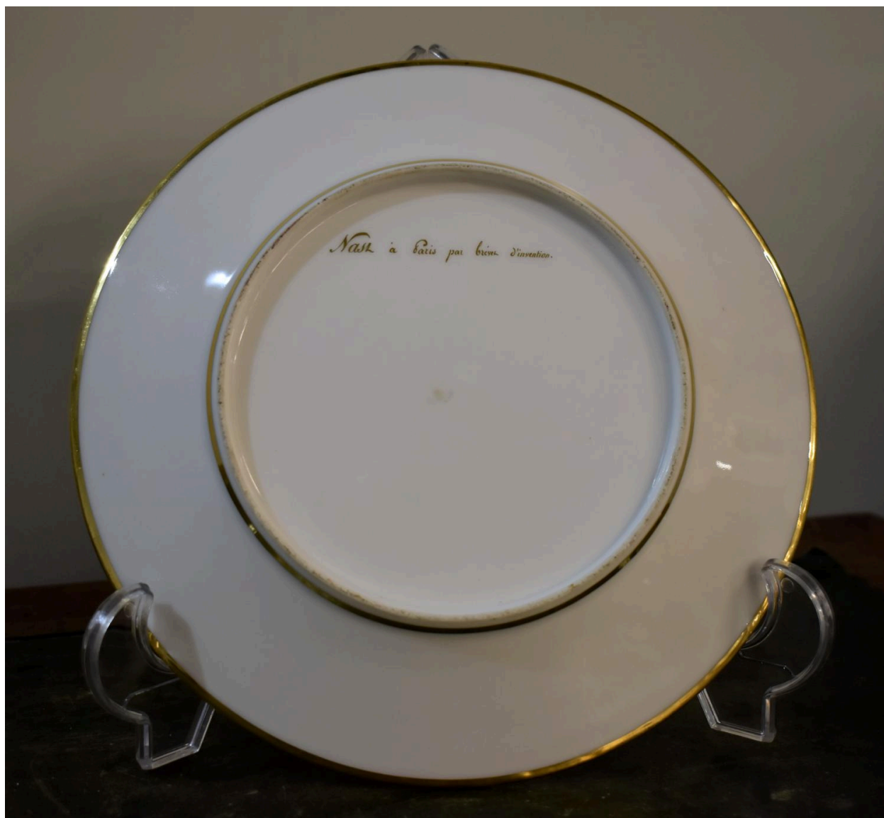
Vue générale du revers