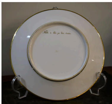
Vue générale du revers IVR84_20256300902NUCA