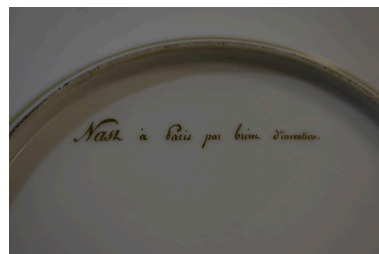
Détail des inscriptions IVR84_20256300903NUCA