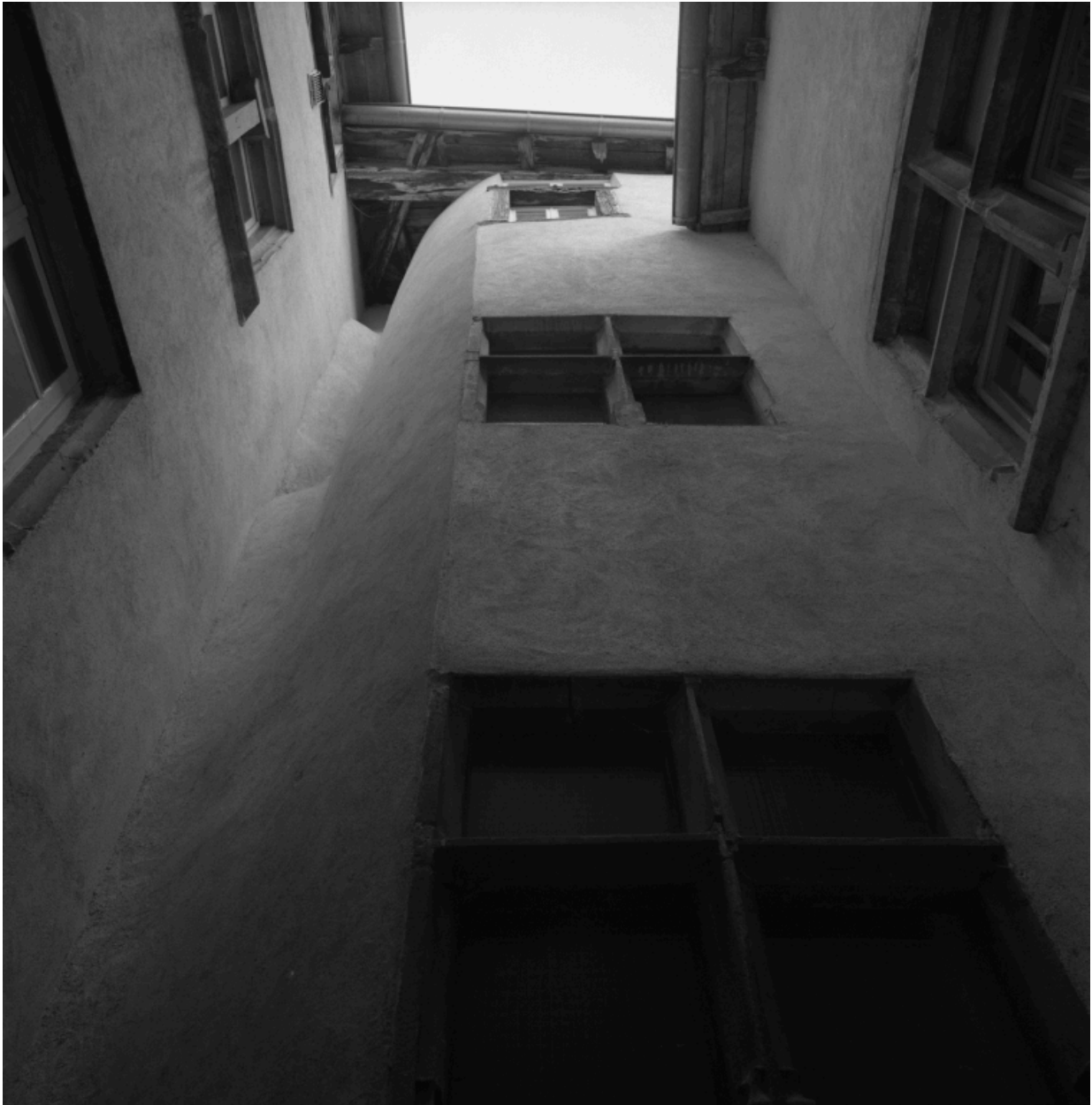
Cour intérieure de l'immeuble, 11 rue du Port, avec cage d'escalier demi-hors-oeuvre.