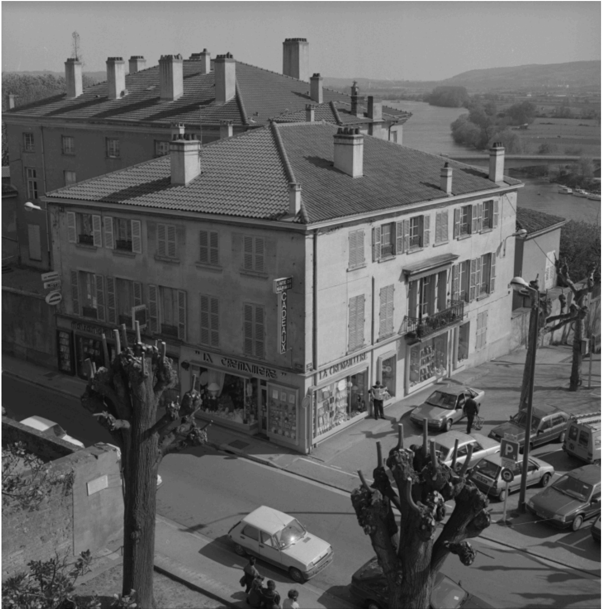
Vue d'ensemble de l'immeuble, 2 rue du Palais-place de la terrasse.