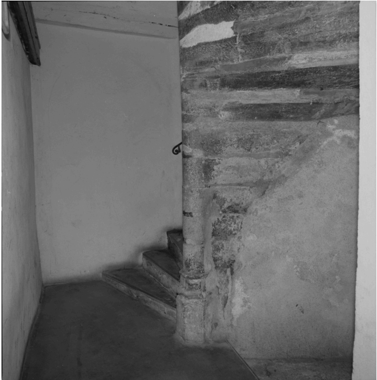
Immeuble, 11 rue du Port, détail de l'escalier en vis, base du noyau à moultures prismatiques.