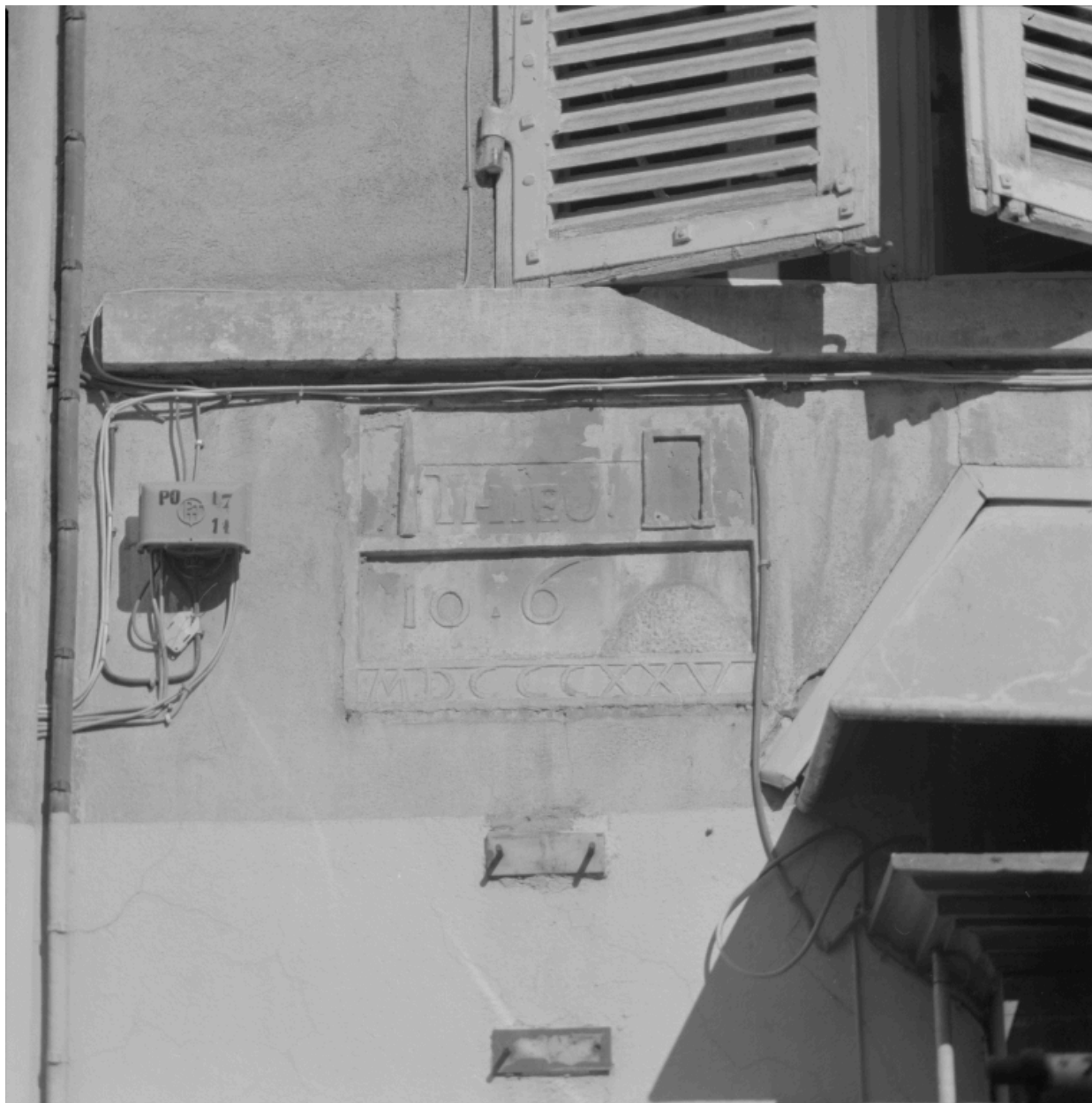
Détail de façade du 9 rue du Palais, rébus en relief méplat, portant le nom du propriétaire et la date de construction de l'immeuble : Mathieu Porte, dit Simon, 1825.