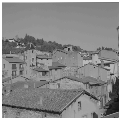
Vue des toits d'un quartier intra-muros, avec les lanternes d'escalier des immeubles.