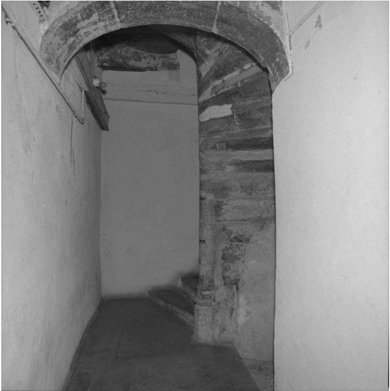
Immeuble, 11 rue du Port, départ de l'escalier en vis.