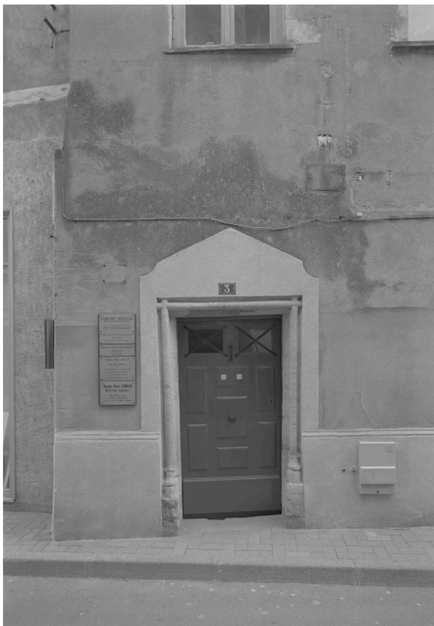
Porte d'entrée du 3 Grande rue, ouvrant sur un escalier en vis.