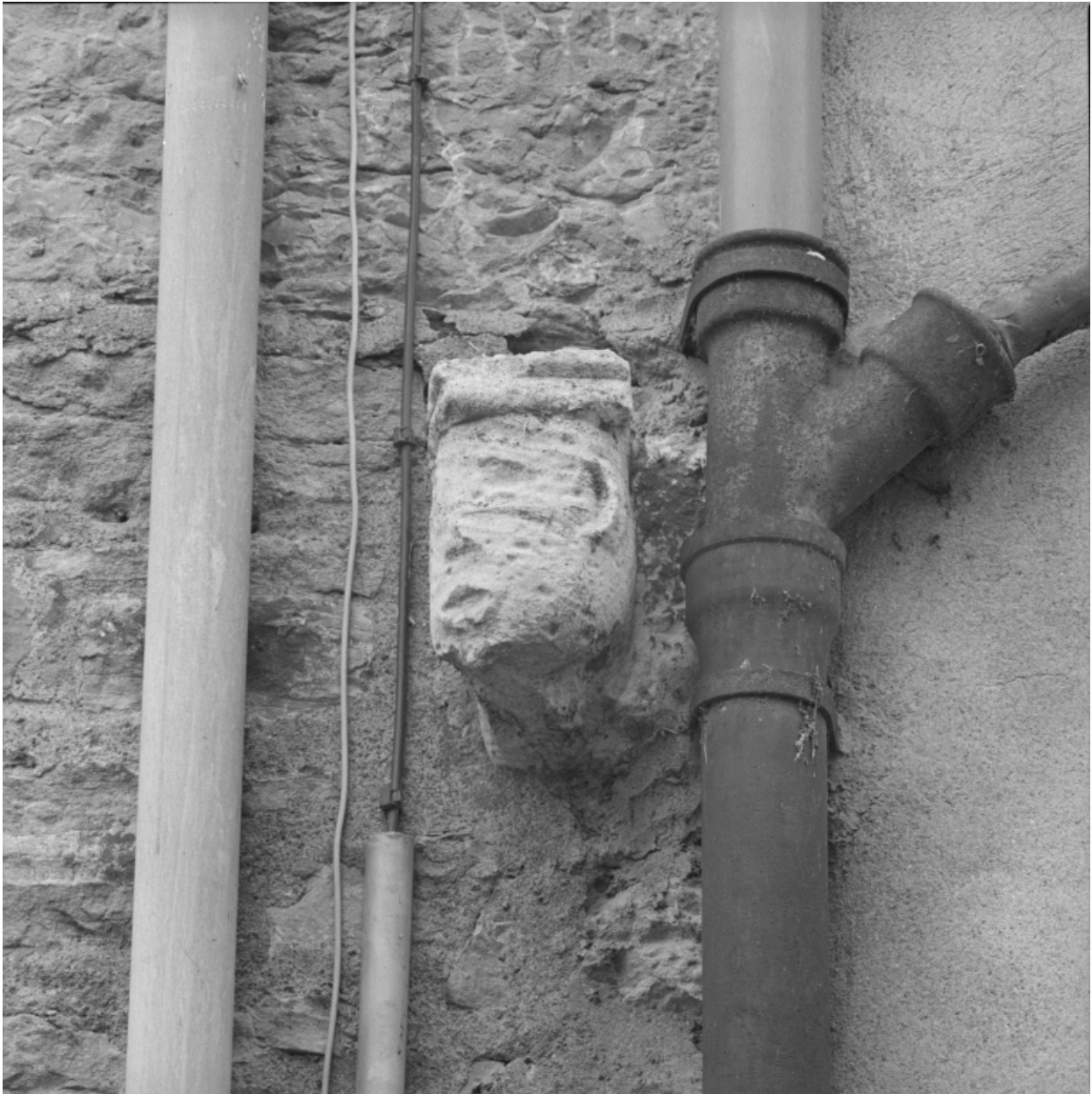
Immeuble 3 Grande rue, rue du Gouvernement : tête sculptée en remploi rue du Gouvernement.