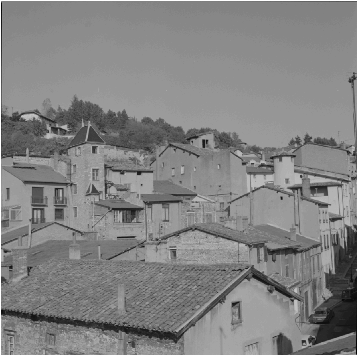
Vue des toits d'un quartier intra-muros, avec les lanternes d'escalier des immeubles.