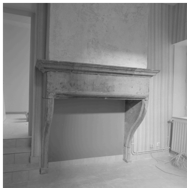
Cheminée d'un appartement, 26 Grande rue. IVR82_19900100473X