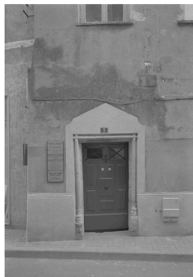
Porte d'entrée du 3 Grande rue, ouvrant sur un escalier en vis.