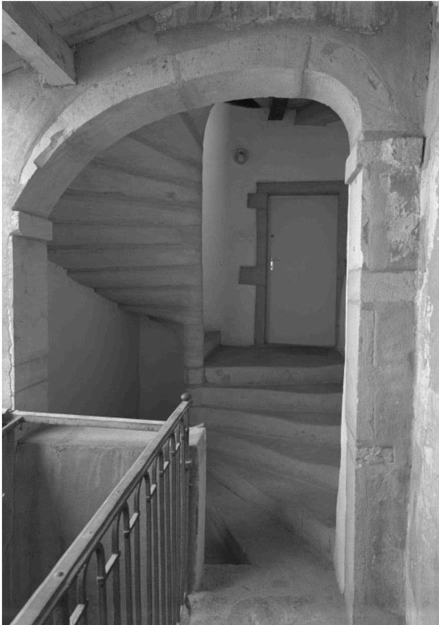
Cage d'escalier du 39 Grande rue, au niveau d'un demi-étage.