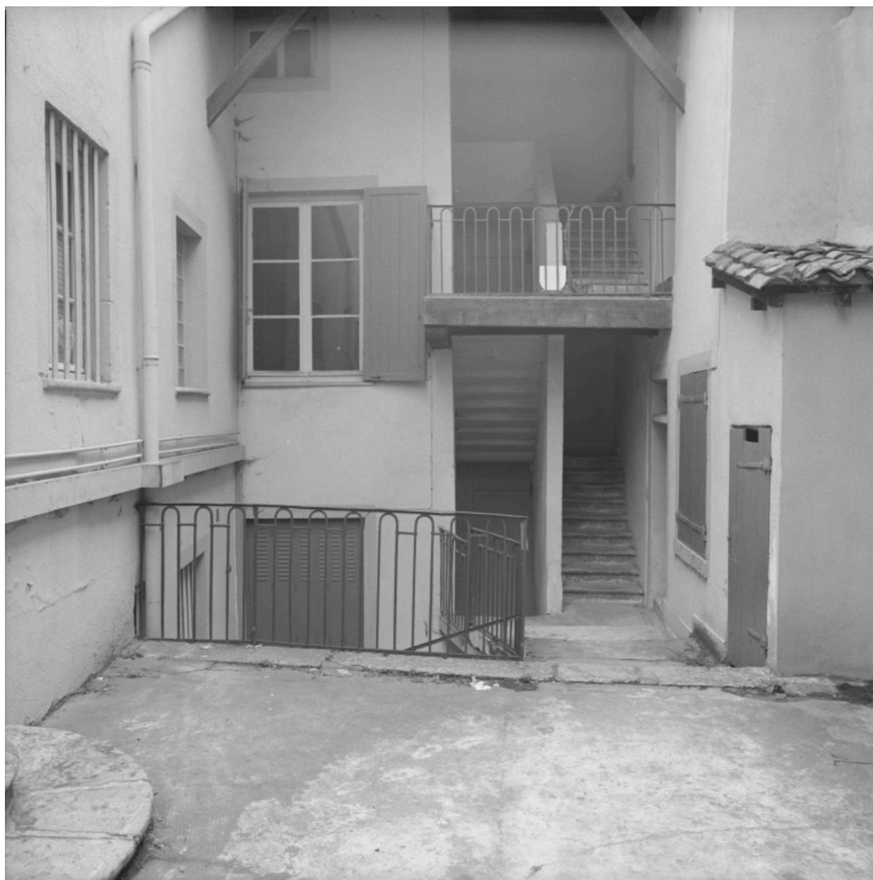
Escalier à cage ouverte sur cour, immeuble 26 Grande rue, parcelle traversante sur rue Montsec.