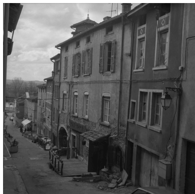
Elévation sur la rue du Port, de l'immeuble au n°4, avec passage couvert dit La Voûte