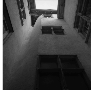
Cour intérieure de l'immeuble, 11 rue du Port, avec cage d'escalier demi-hors-oeuvre. IVR82_19910100382X