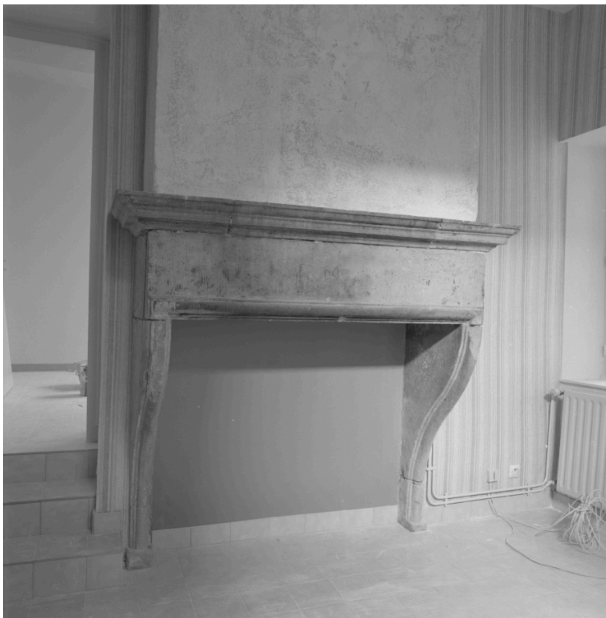
Cheminée d'un appartement, 26 Grande rue.