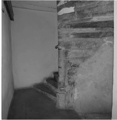
Immeuble, 11 rue du Port, détail de l'escalier en vis, base du noyau à moulures prismatiques. IVR82_19910100381X