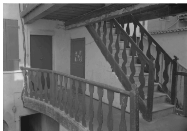
40 Grande rue : cage d'escalier dans la cour.