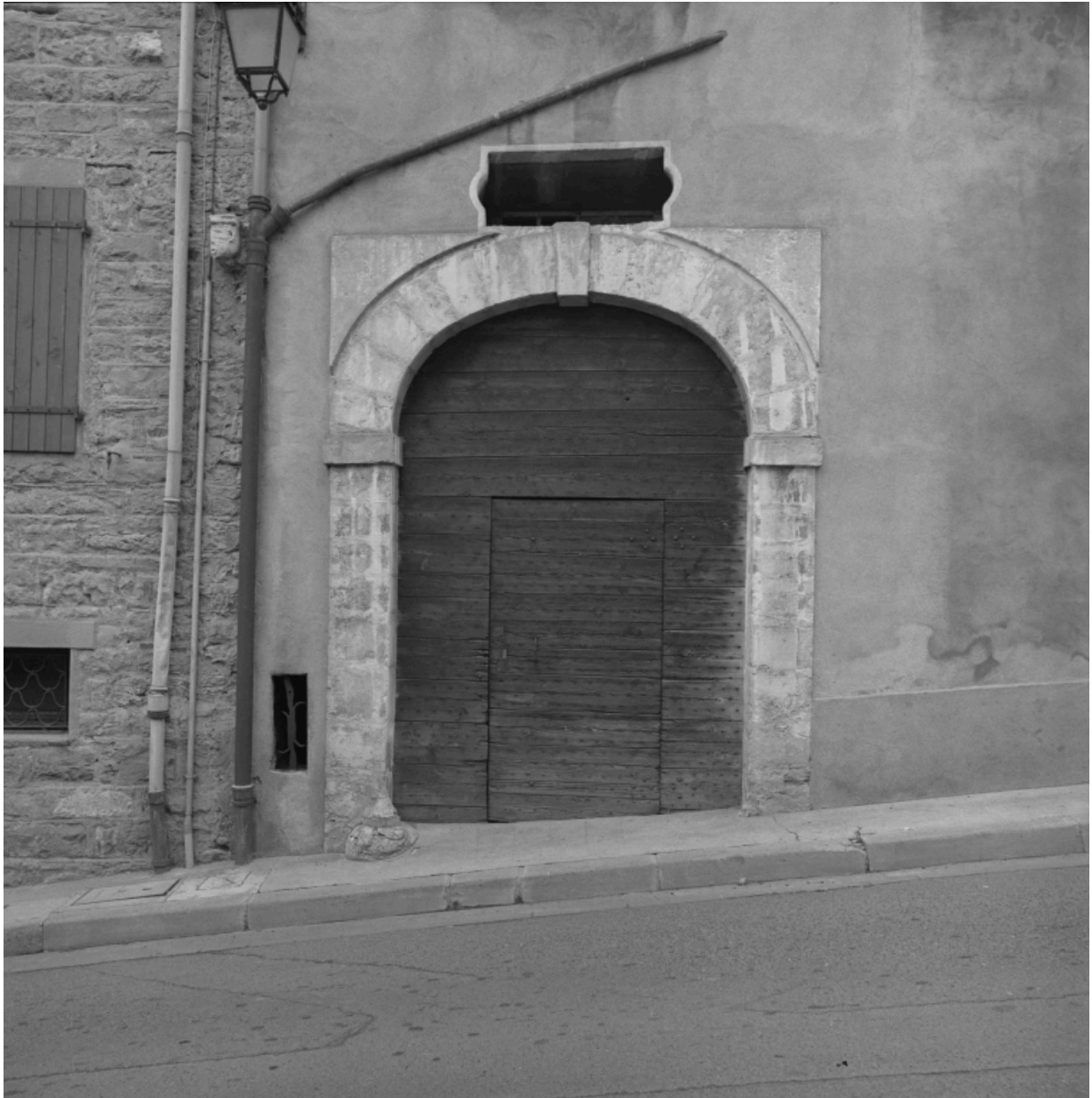
Portail sur rue de Gouvernement, de l'immeuble 3 Grande rue.