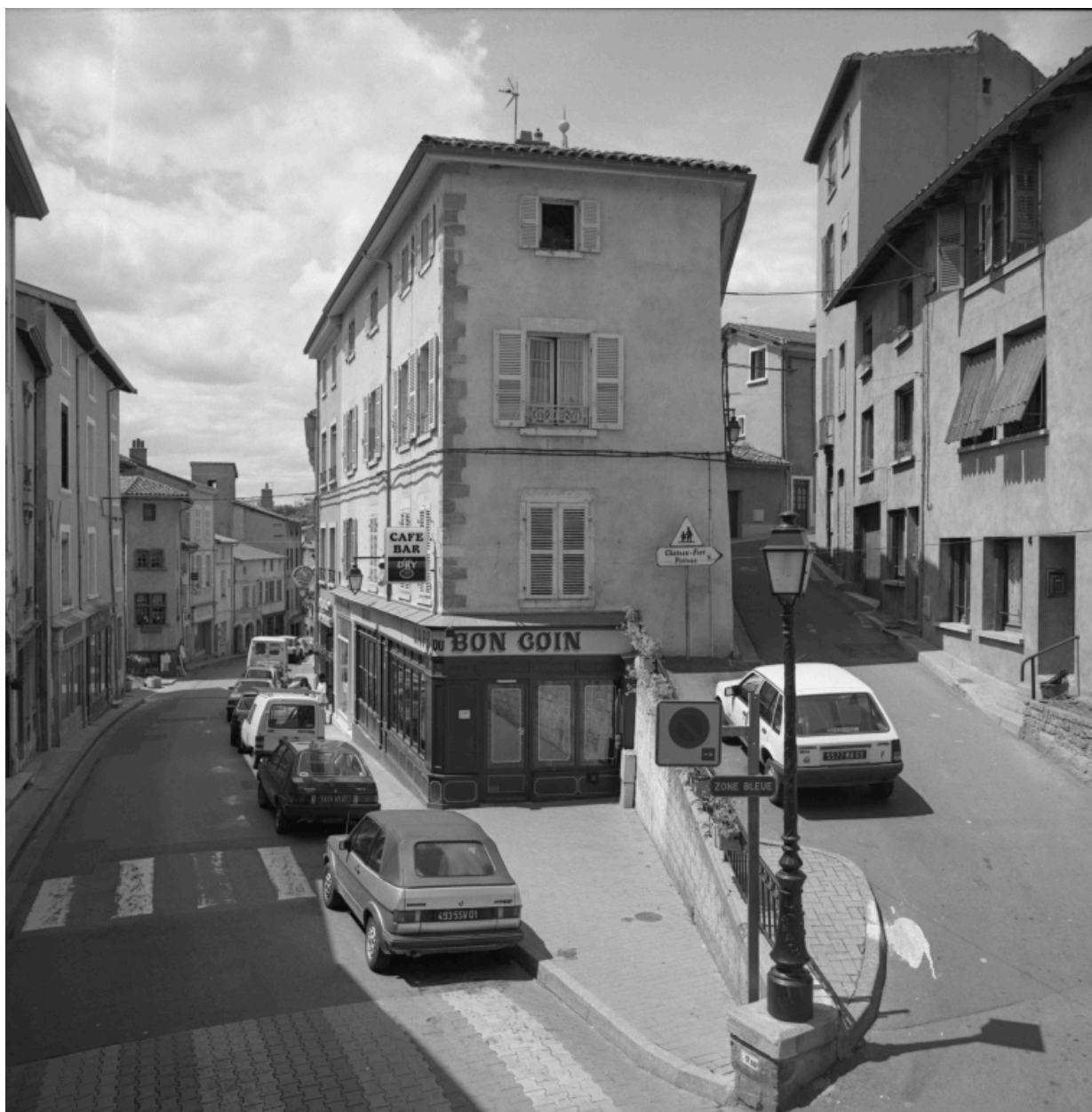
Immeuble d'angle 30 Grande rue-1 rue des Tours, élévation, avec le Café du Bon Coin