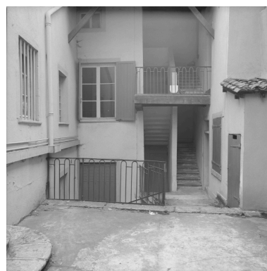
Escalier à cage ouverte sur cour, immeuble 26 Grande rue, parcelle traversante sur rue Montsec. IVR82_19910100592X