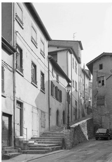
Façade du 6 rue Casse- Cou, et élévation postérieure du 33 Grande rue. IVR82_19910100591P