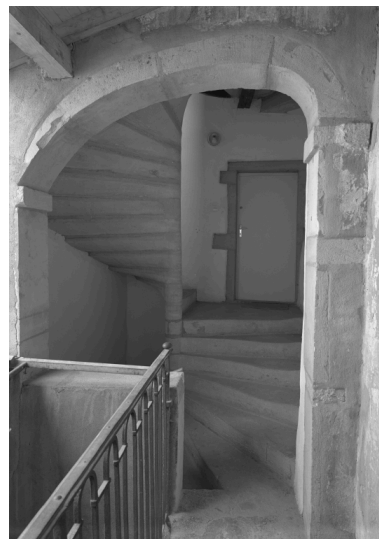
Cage d'escalier du 39 Grande rue, au niveau d'un demi-étage. IVR82_19910100590P