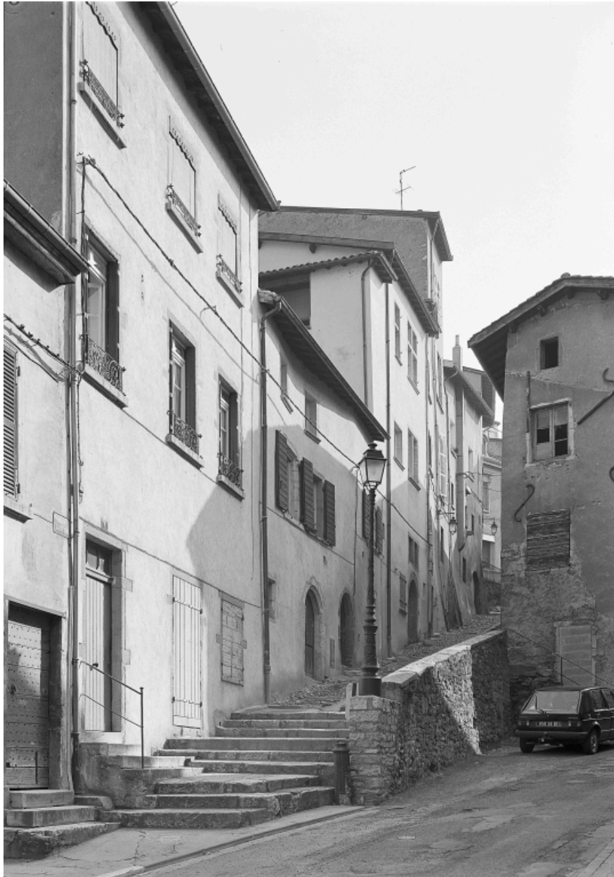
Façade du 6 rue Casse-Cou, et élévation postérieure du 33 Grande rue.