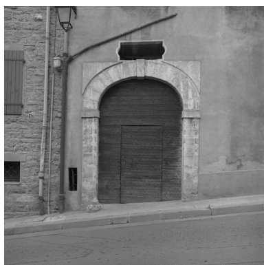
Portail sur rue de Gouvernement, de l'immeuble 3 Grande rue.