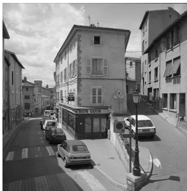
Immeuble d'angle 30 Grande rue-1 rue des Tours, élévation, avec le Café du Bon Coin IVR82_19910100667X