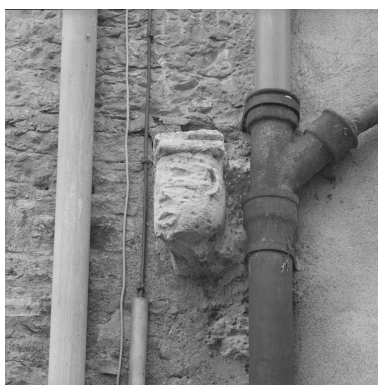
Immeuble 3 Grande rue, rue du Gouvernement : tête sculptée en remploi rue du Gouvernement. IVR82_19910100053X