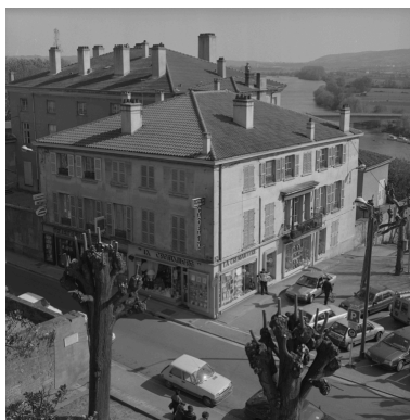
Vue d'ensemble de l'immeuble, 2 rue du Palais-place de la terrasse. IVR82_19910100383X