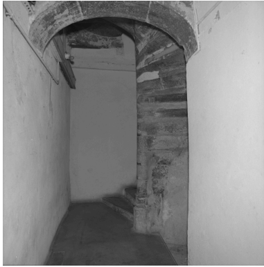
Immeuble, 11 rue du Port, départ de l'escalier en vis. IVR82_19910100380X