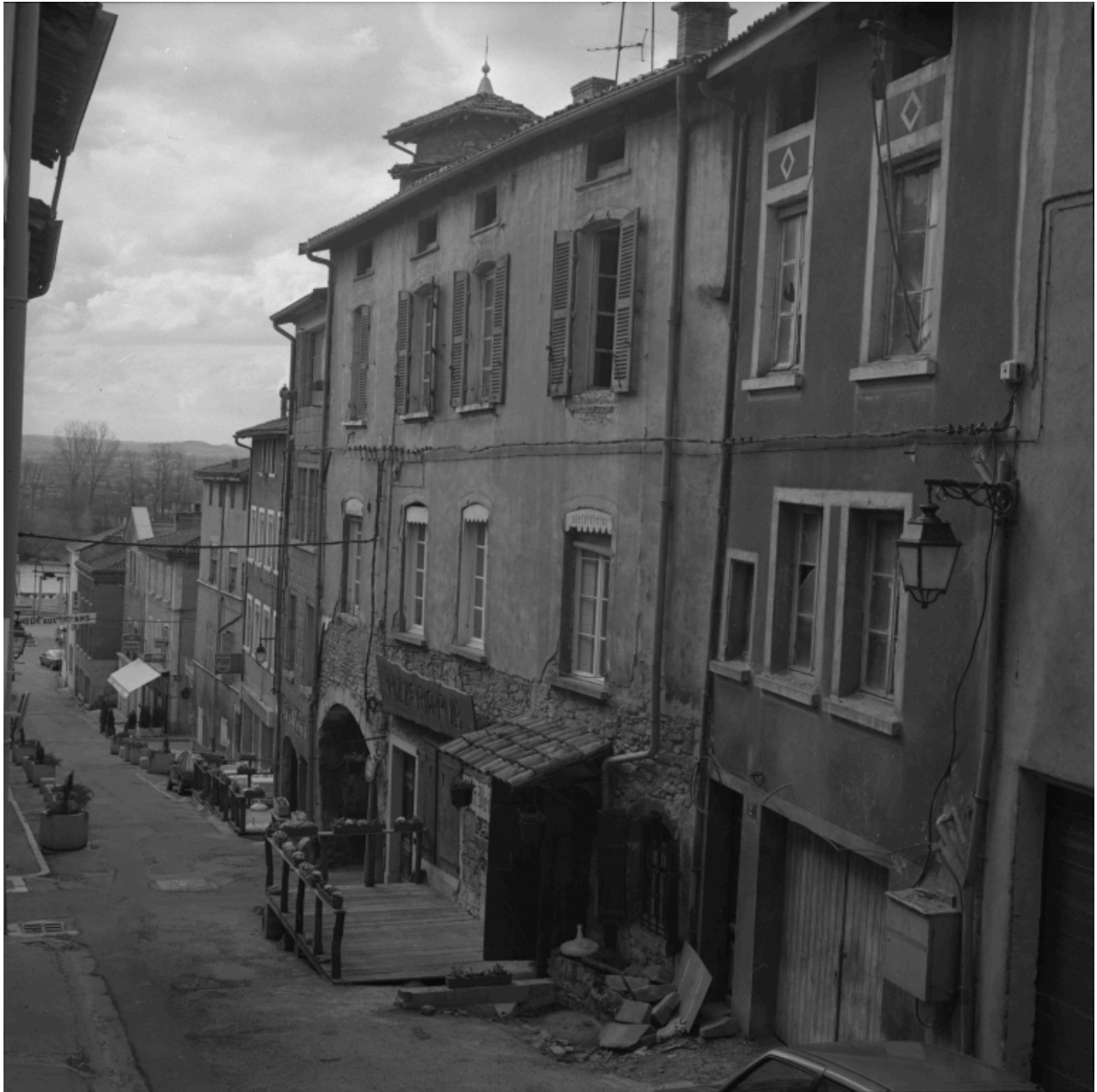
Elévation sur la rue du Port, de l'immeuble au n°4, avec passage couvert dit La Voûte