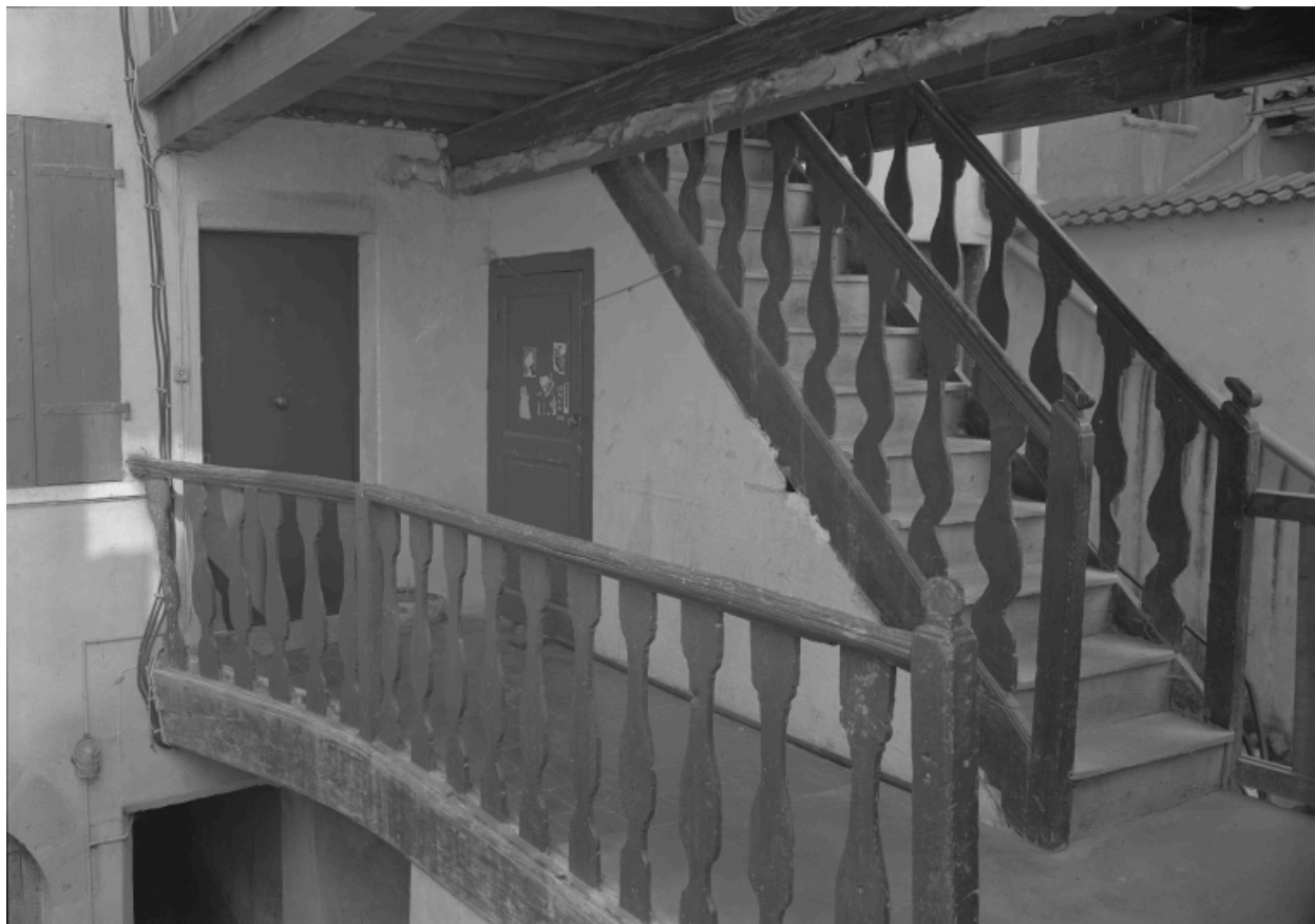
40 Grande rue : cage d'escalier dans la cour.