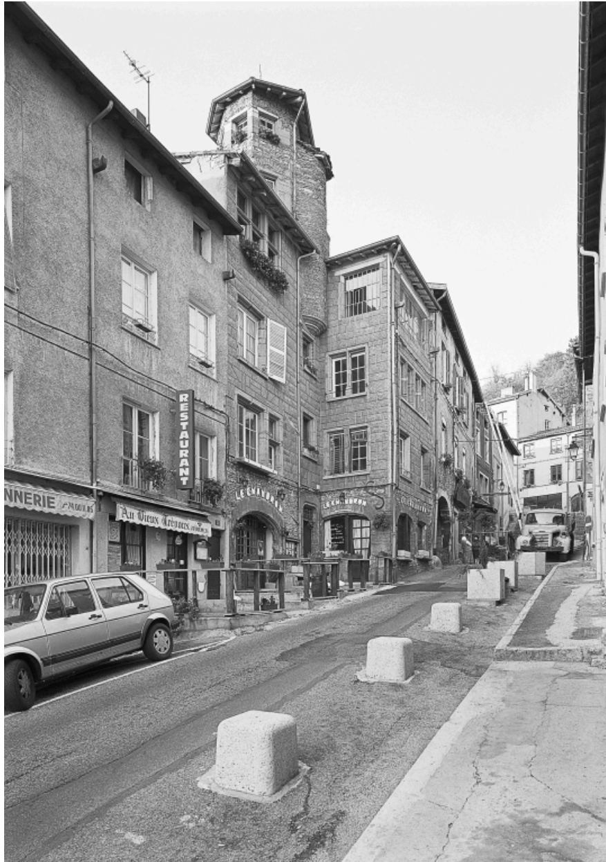
Vue d'ensemble des immeubles 6 et 4 rue du Port