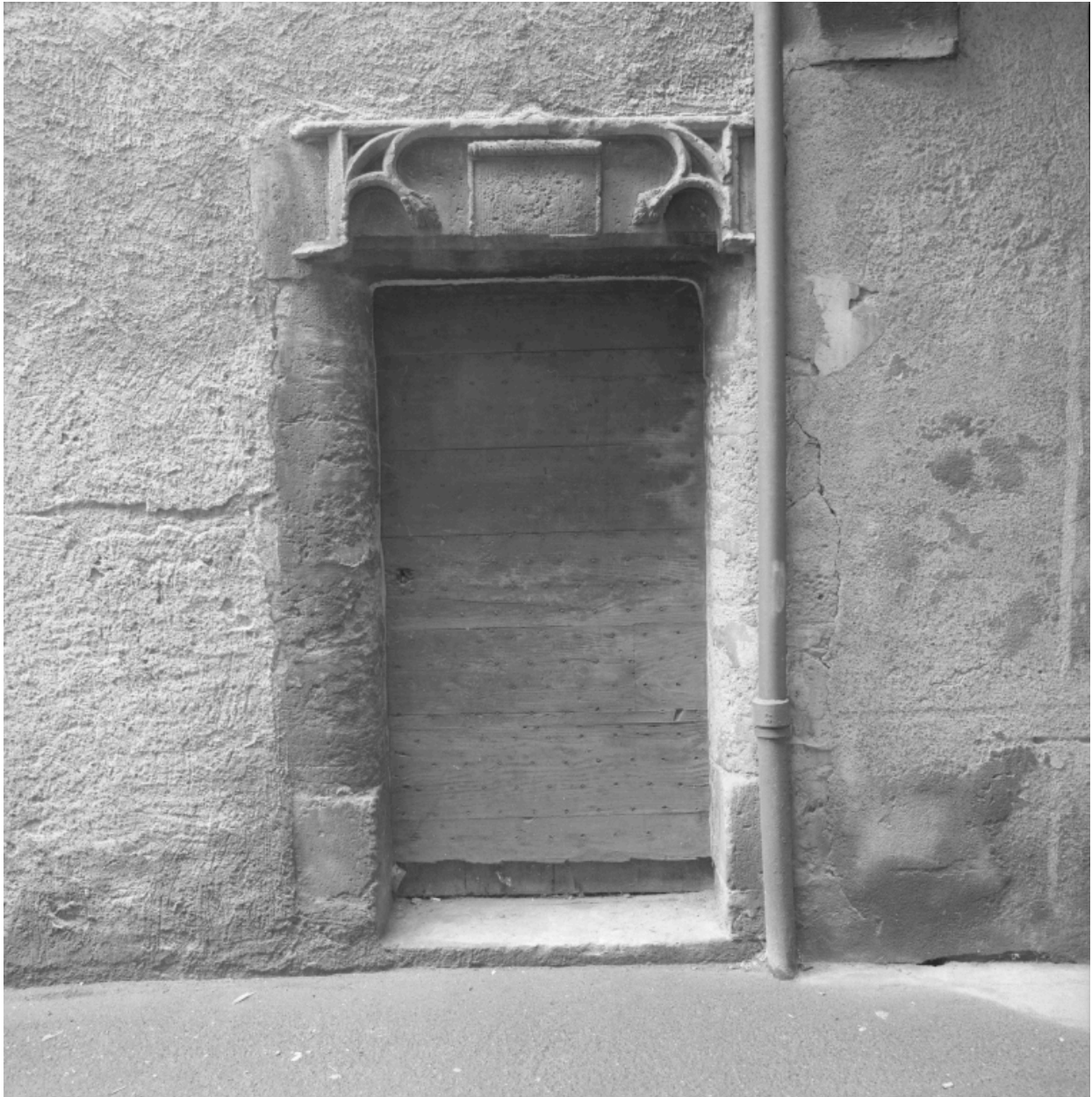
Immeuble, 4 rue du Port : ancienne porte d'entrée, sur la rue de l'Herberie.