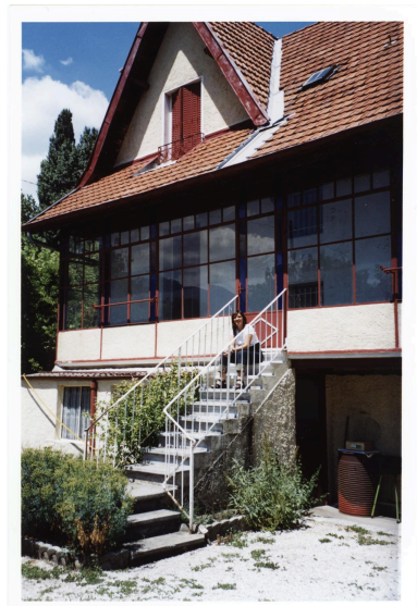
L'escalier et la galerie vitrée de la façade postérieure. Photograph. 2003