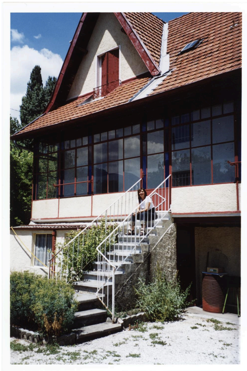
L'escalier et la galerie vitrée de la façade postérieure. Photogr. 2003