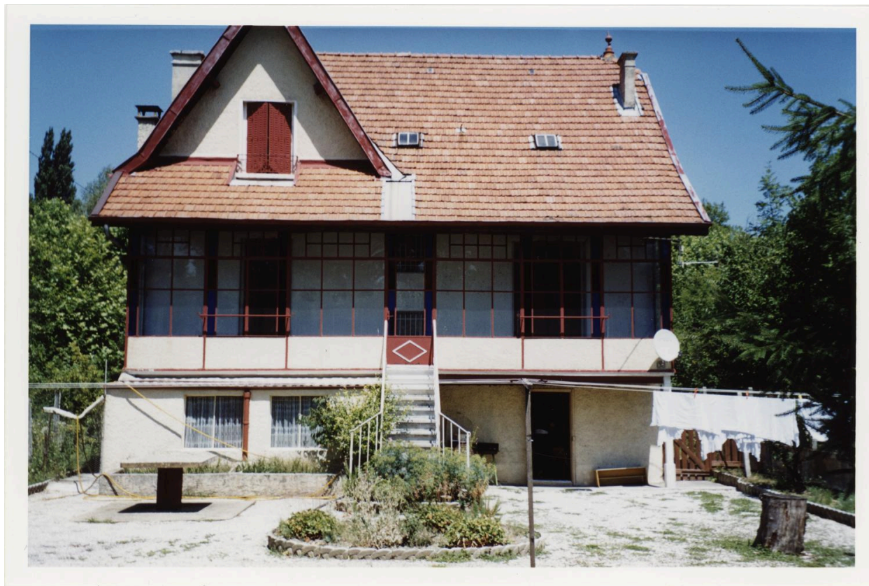
Façade postérieure. Photogr. 2003