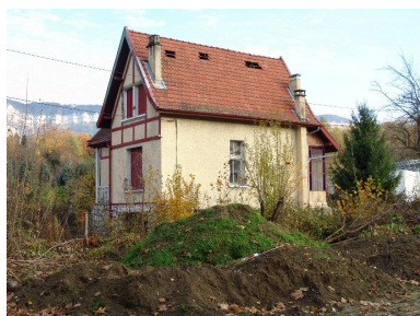
Façade ouest