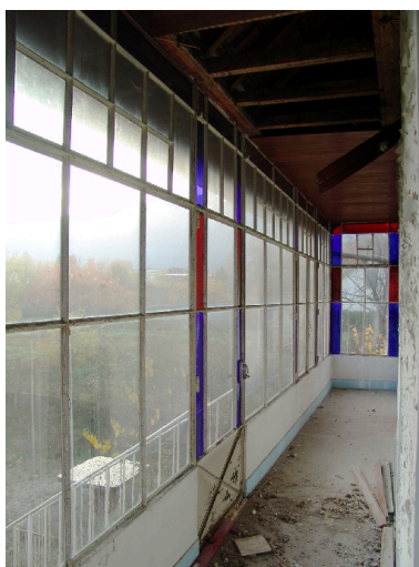
Galerie vitrée au sud