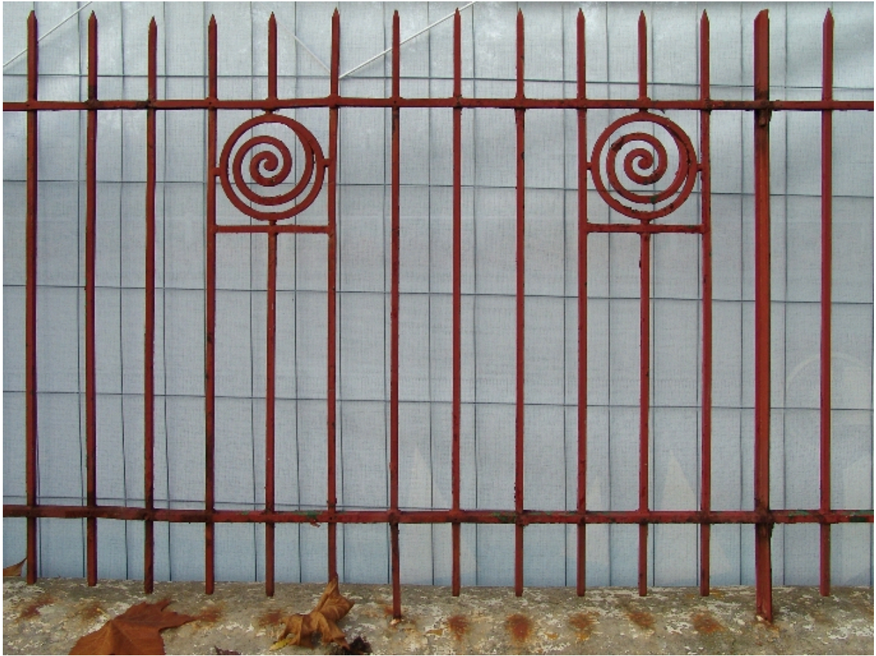
Détail de la grille