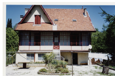
Façade postérieure. Photograph. 2003 IVR84_20177300467NUCB