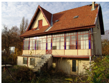
Vue générale IVR82_20077300689NUCA