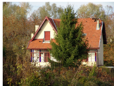
Façade postérieure IVR82_20077300684NUCA