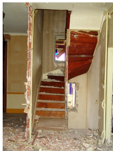
Escalier intérieur IVR82_20077300697NUCA