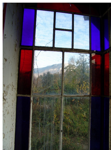
Détail de la verrière IVR82_20077300701NUCA