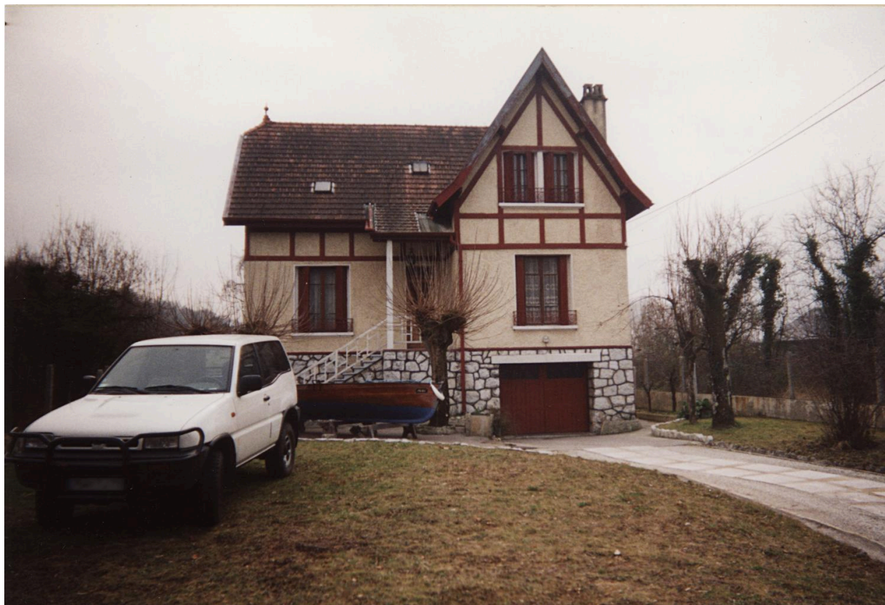
Façade nord. Photogr. 2002