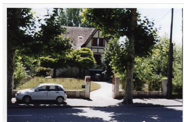
Vue d'ensemble depuis l'avenue du Petit-Port. Photograph. 2003 IVR84_20177300466NUCB