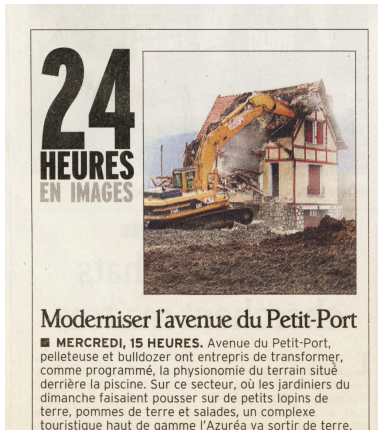
Le Dauphiné Libéré, 1er mars 2007 IVR84_20177300469NUCB