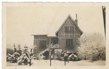
Façade nord. Photograph. milieu XXe siècle IVR84_20177300463NUCB