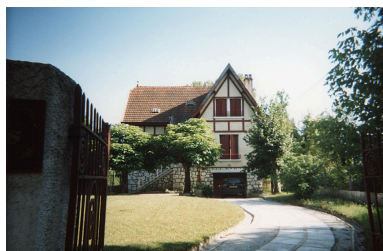
Le portail et l'allée. Photograph. 2002 IVR84_20177300465NUCB