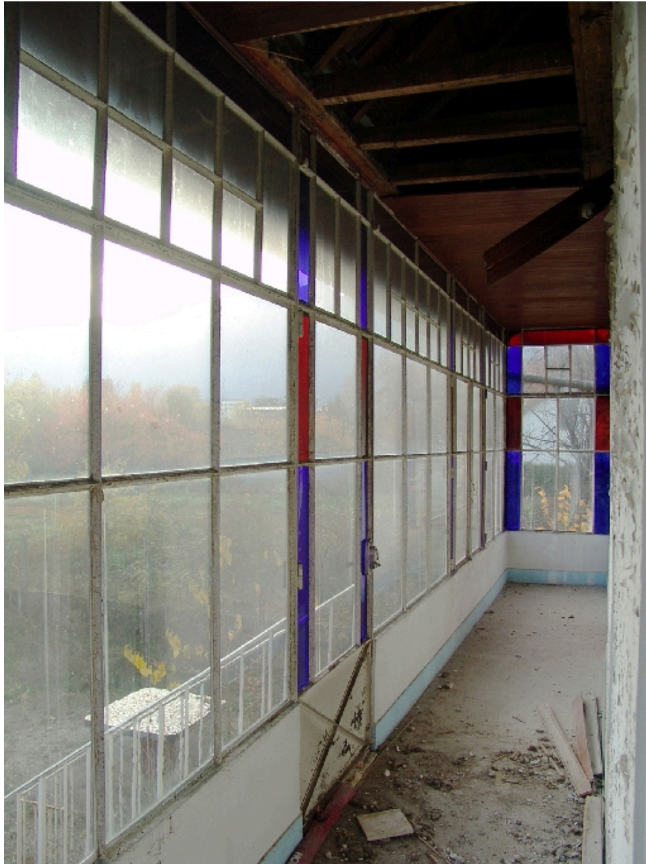
Galerie vitrée au sud