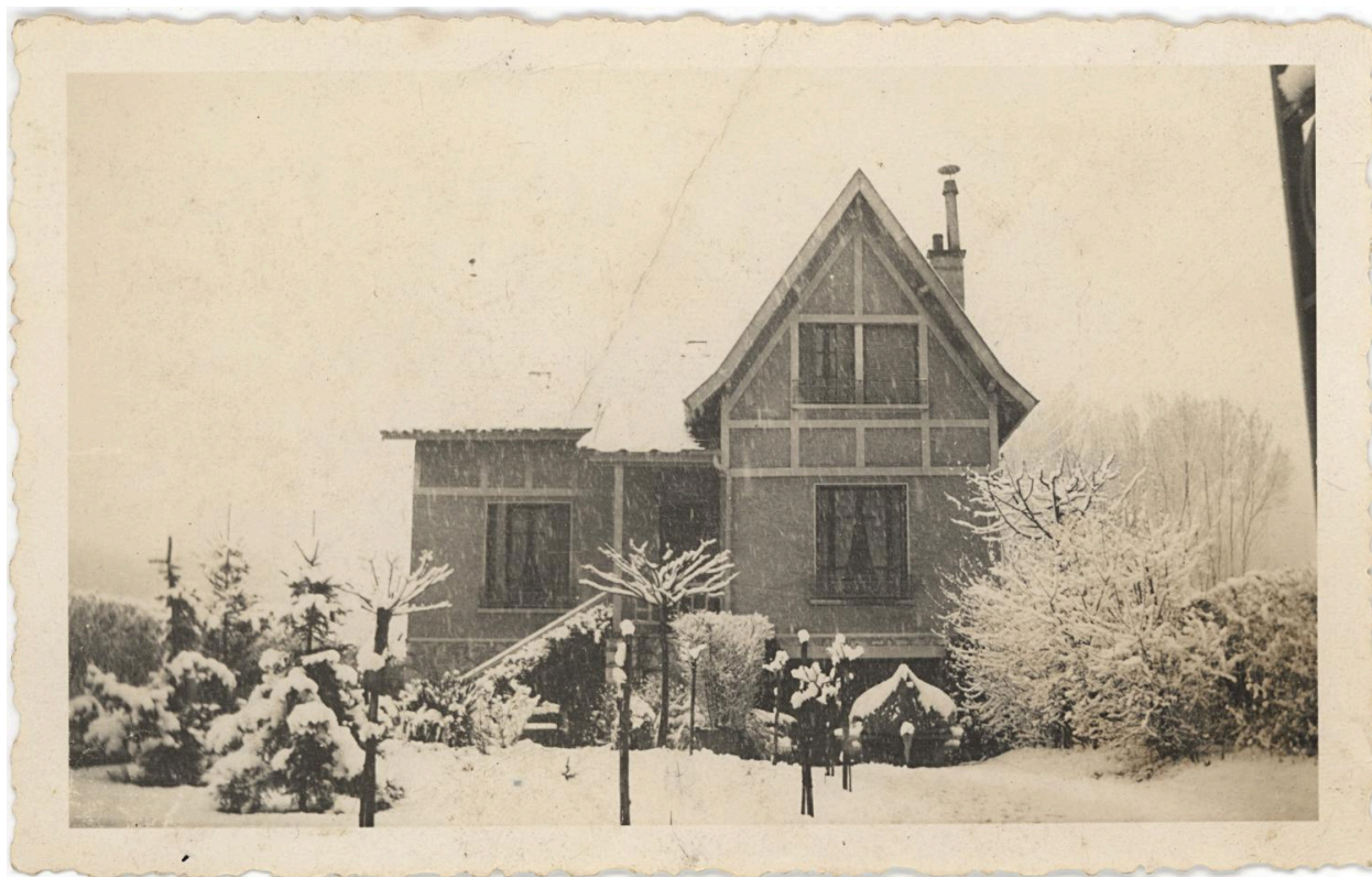
Façade nord. Photogr. milieu XXe siècle