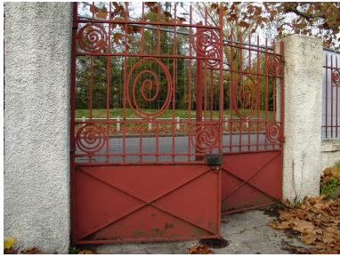
Portail IVR82_20077300703NUCA