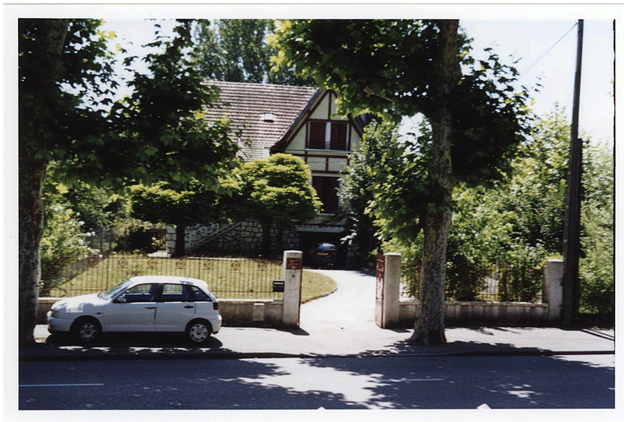
Vue d'ensemble depuis l'avenue du Petit-Port. Photogr. 2003