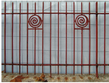
Détail de la grille