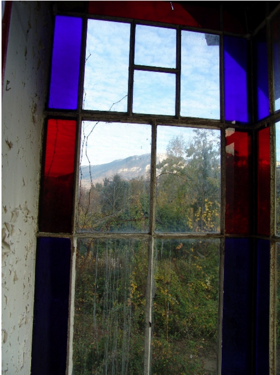
Détail de la verrière