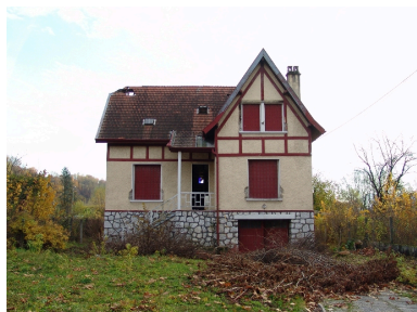
Façade antérieure