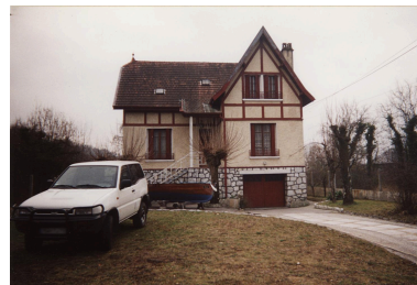
Façade nord. IVR84_20177300464NUCB