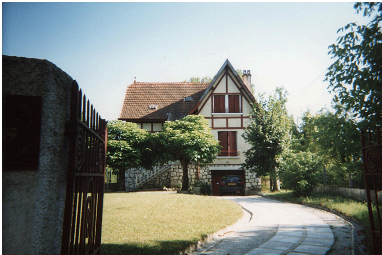
Le portail et l'allée. Photogr. 2002