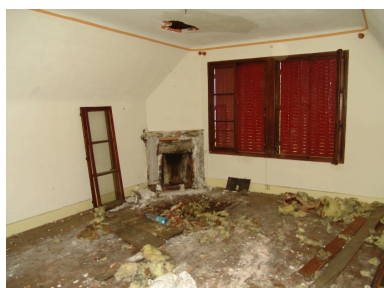
Vue intérieure IVR82_20077300699NUCA