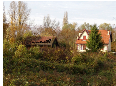
Vue dans le site IVR82_20077300683NUCA