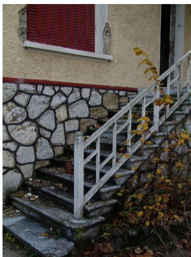
Escalier extérieur IVR82_20077300696NUCA