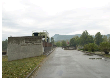
Pont amont : chaussée (depuis la rive gauche)