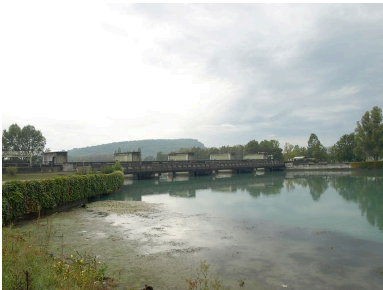
Vue générale, face amont (depuis la rive gauche)