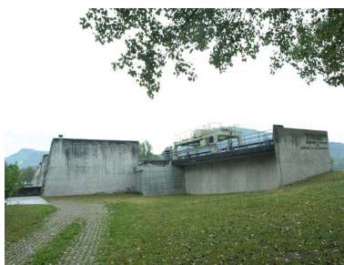
Barrage et palan, face aval (depuis la rive gauche)