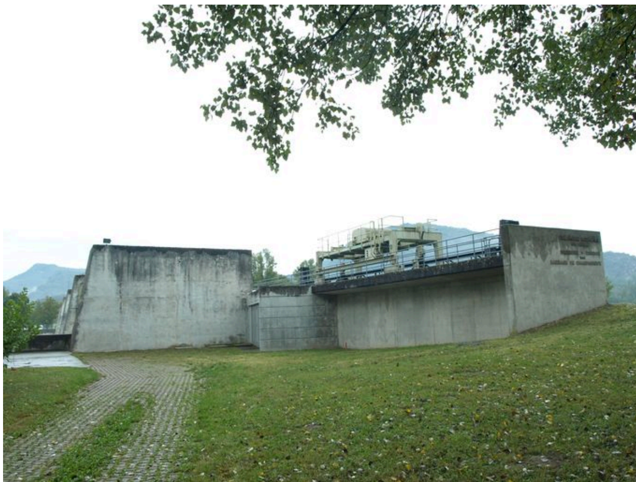
Barrage et palan, face aval (depuis la rive gauche)