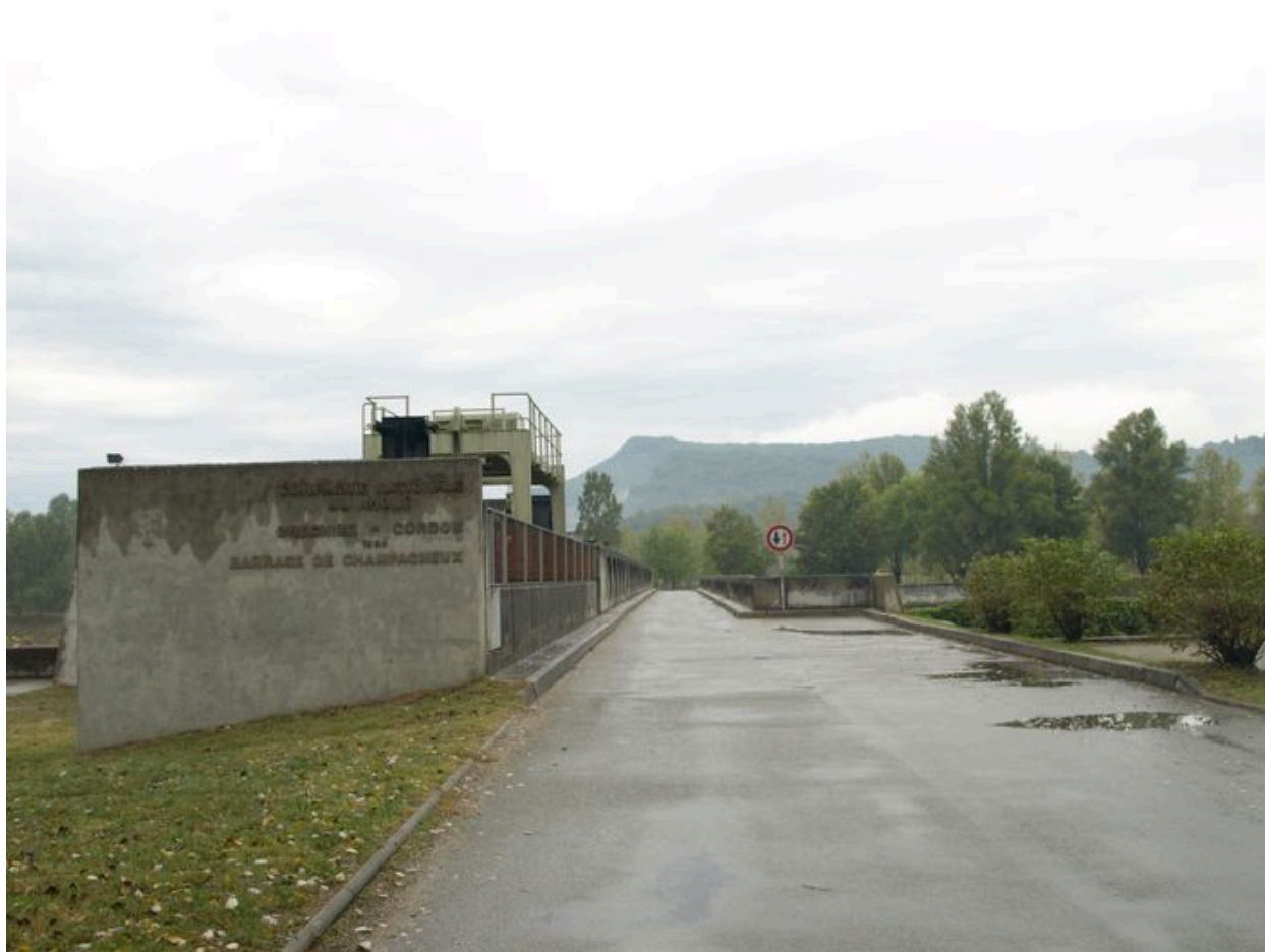
Pont amont : chaussée (depuis la rive gauche)