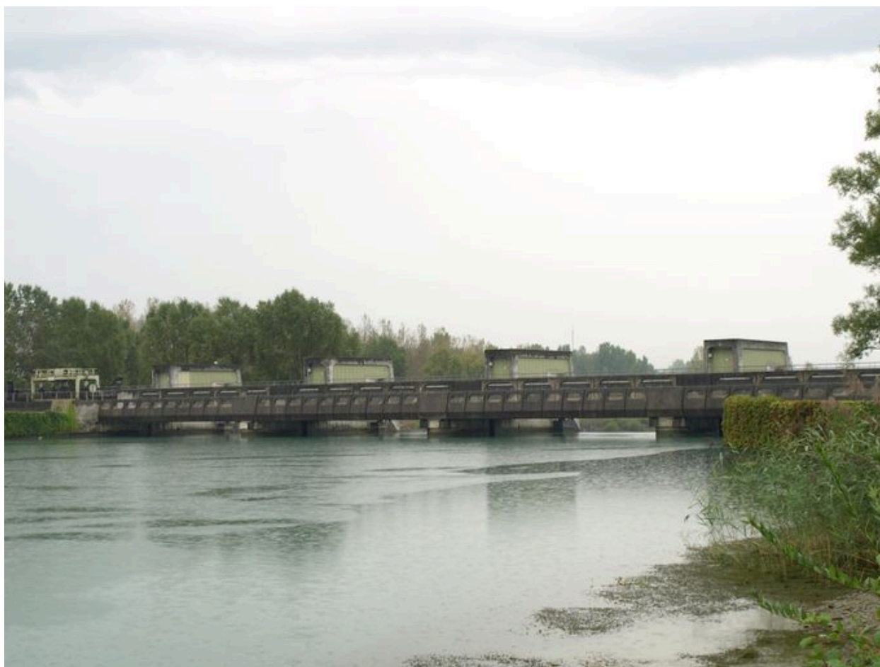
Pont, face amont (depuis la rive droite)