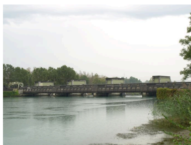
Pont, face amont (depuis la rive droite)