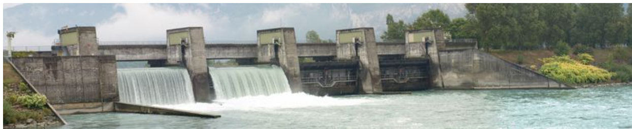
Vue panoramique, face aval (depuis la rive droite)