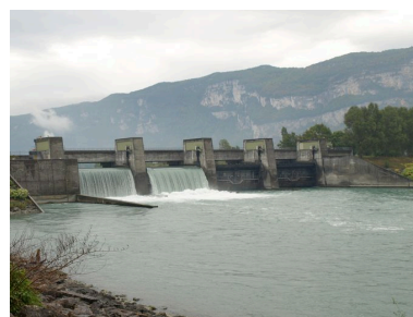
Barrage, face aval (depuis la rive droite)