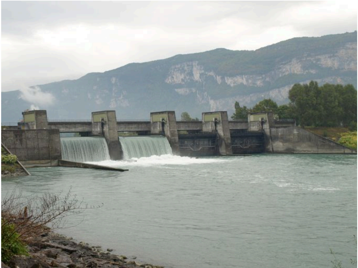
Barrage, face aval (depuis la rive droite)