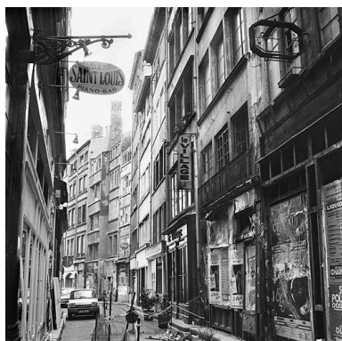
Vue de situation : neuvième immeuble à partir de la droite