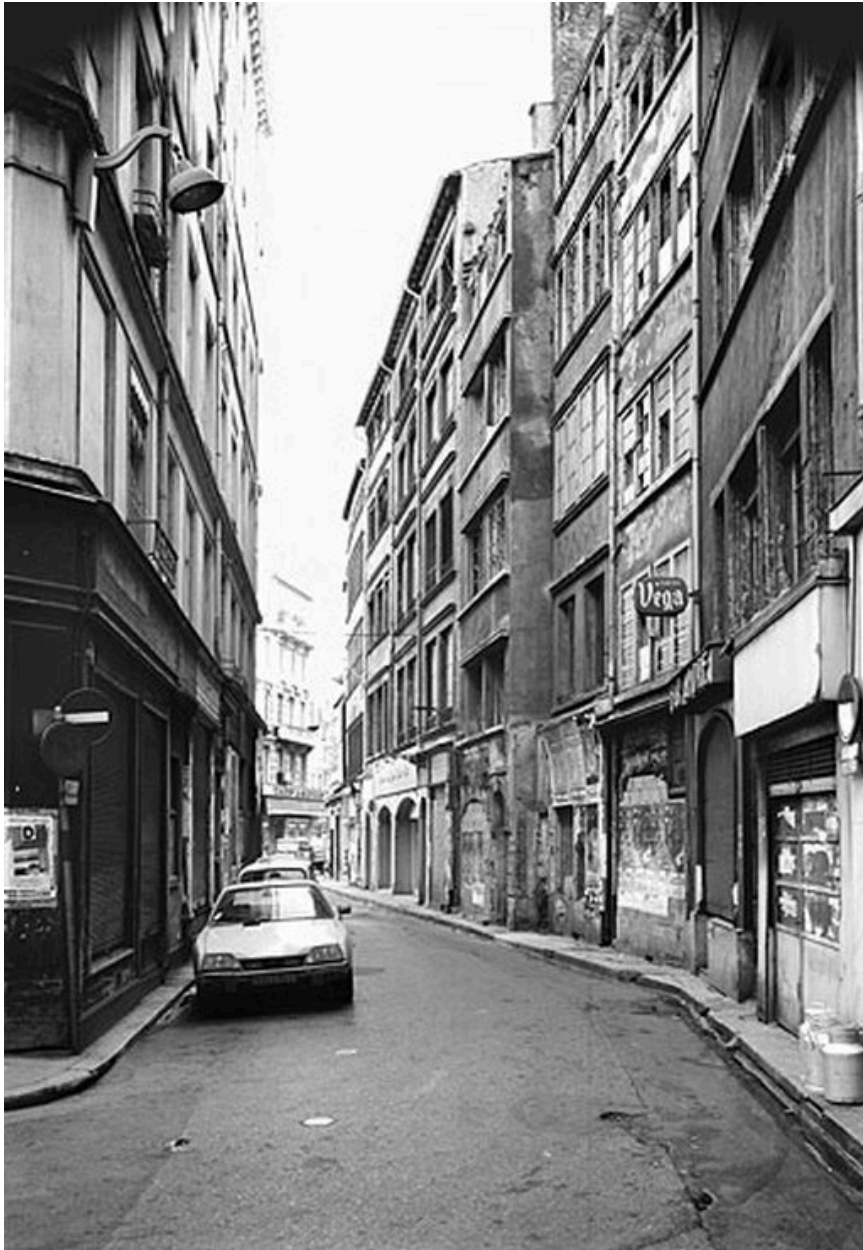
Vue de situation : quatrième immeuble à partir de la droite, en avancée par rapport à l'édifice voisin