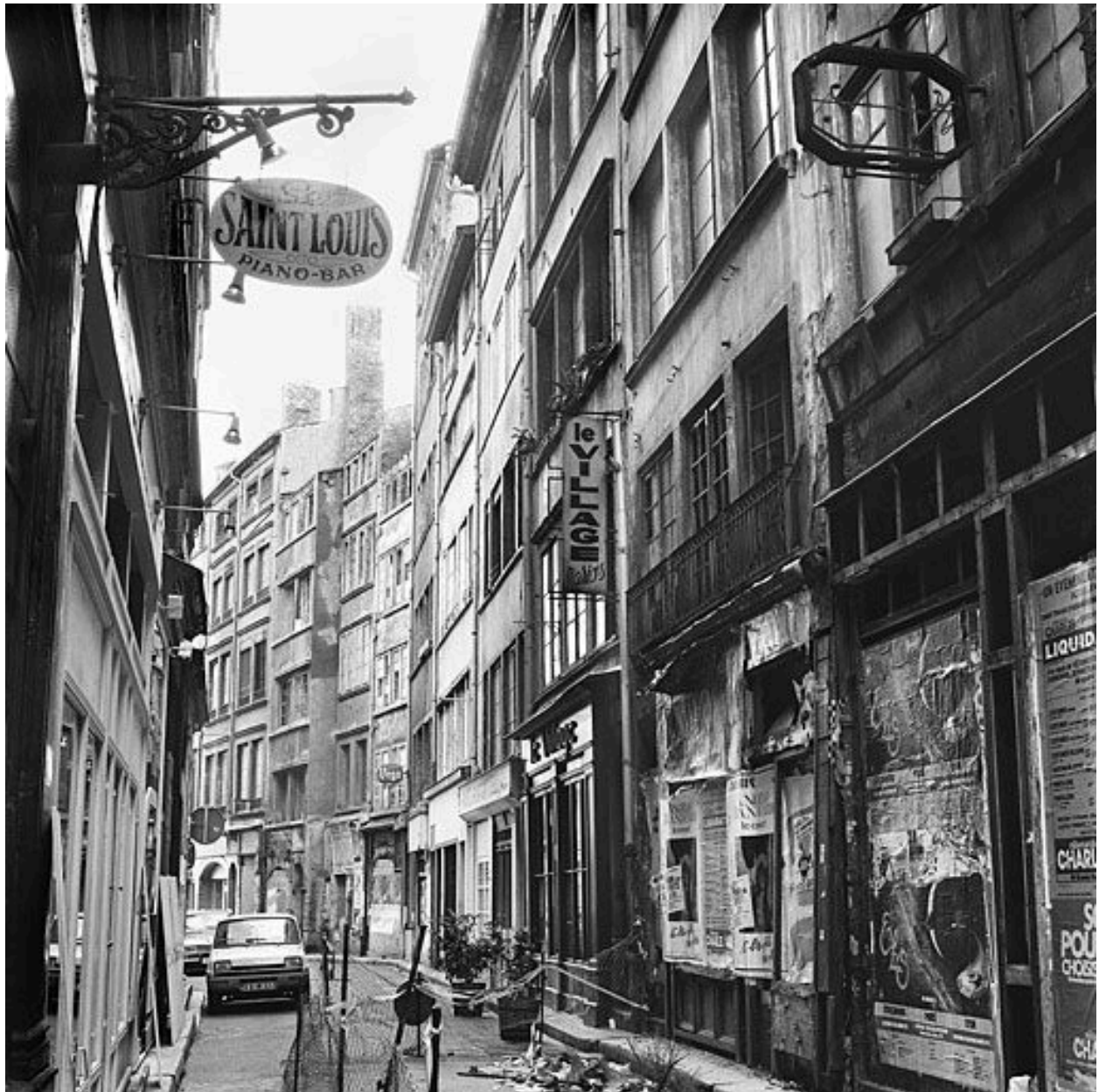
Vue de situation : neuvième immeuble à partir de la droite