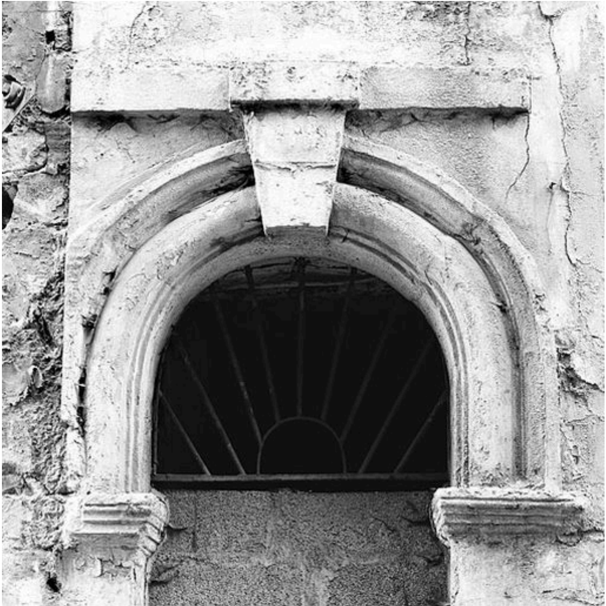
Porte piétonne : arc et tympan de ferronnerie