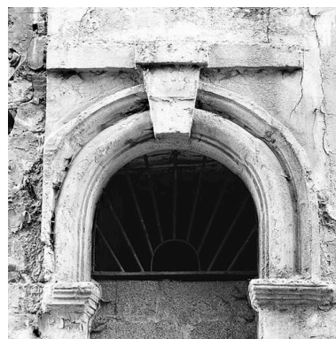
Porte piétonne : arc et tympan de ferronnerie IVR82_19826900009X