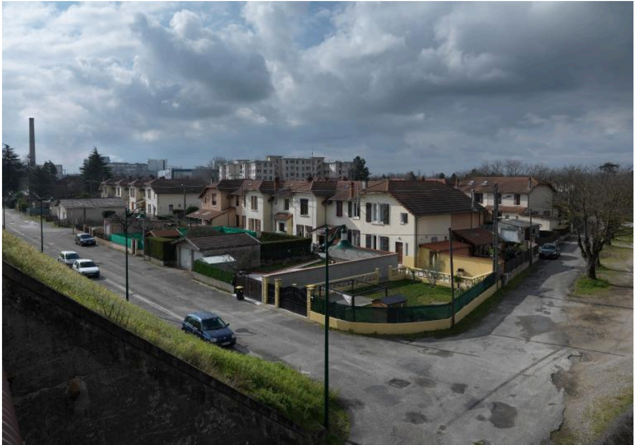
Vue d'ensemble de la cité SLSA