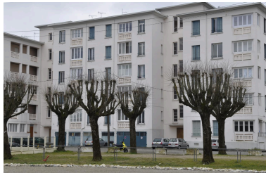
Immeuble des grandes maisons