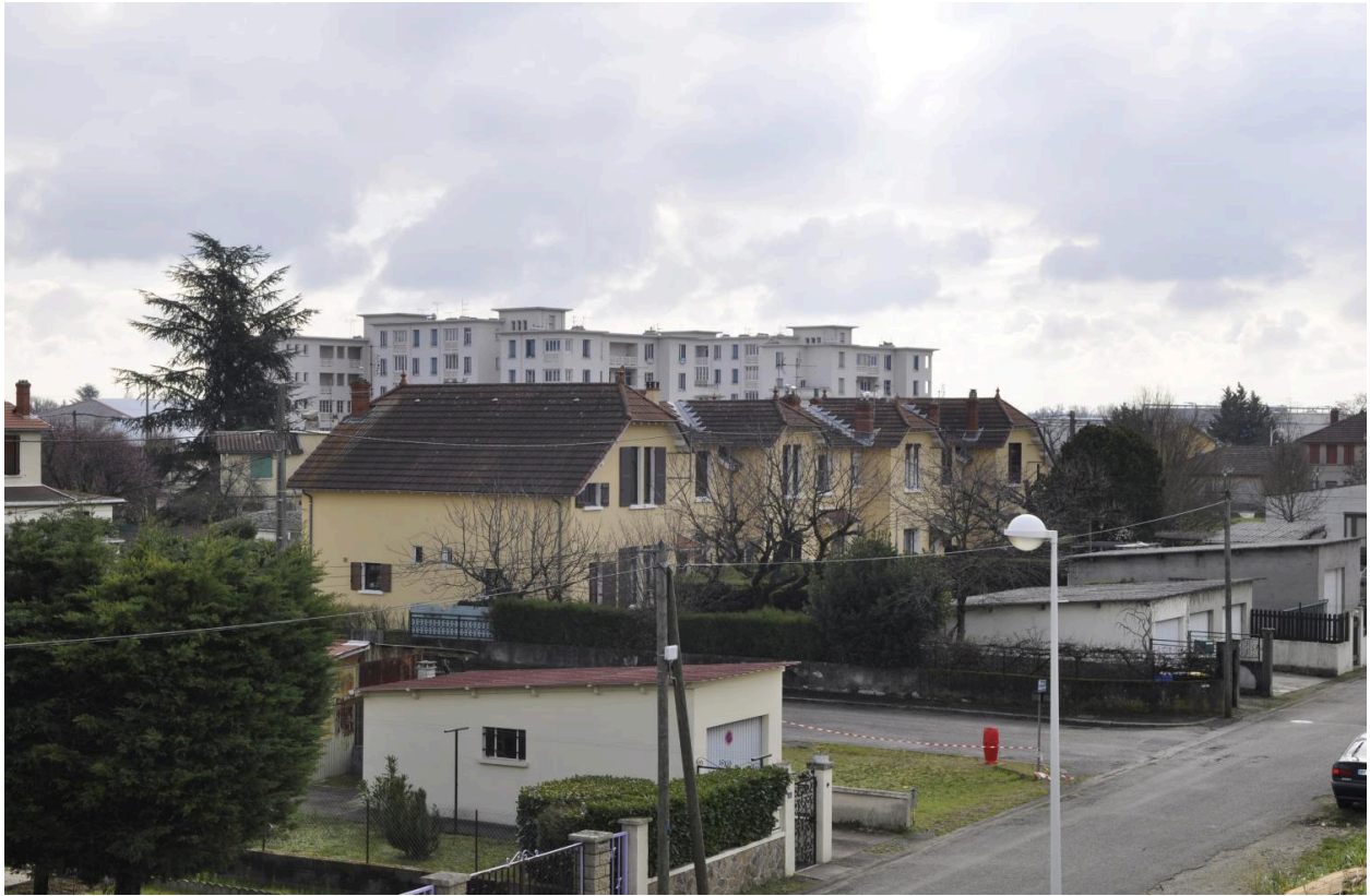
Vue d'ensemble de la cité