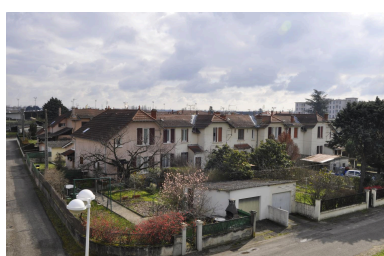
Série de maisons de la cité ouvrière IVR84_20160100107NUCA