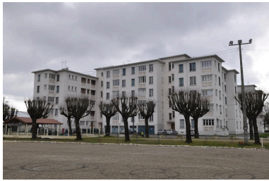
Vue des grandes maisons