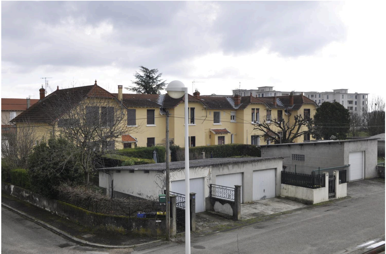
Détail maisons et garages de la cité ouvrière