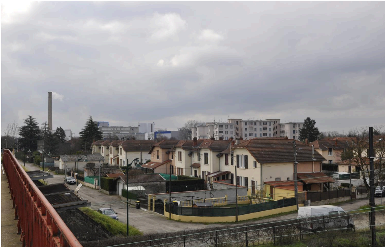
Vue d'ensemble de la cité ouvrière