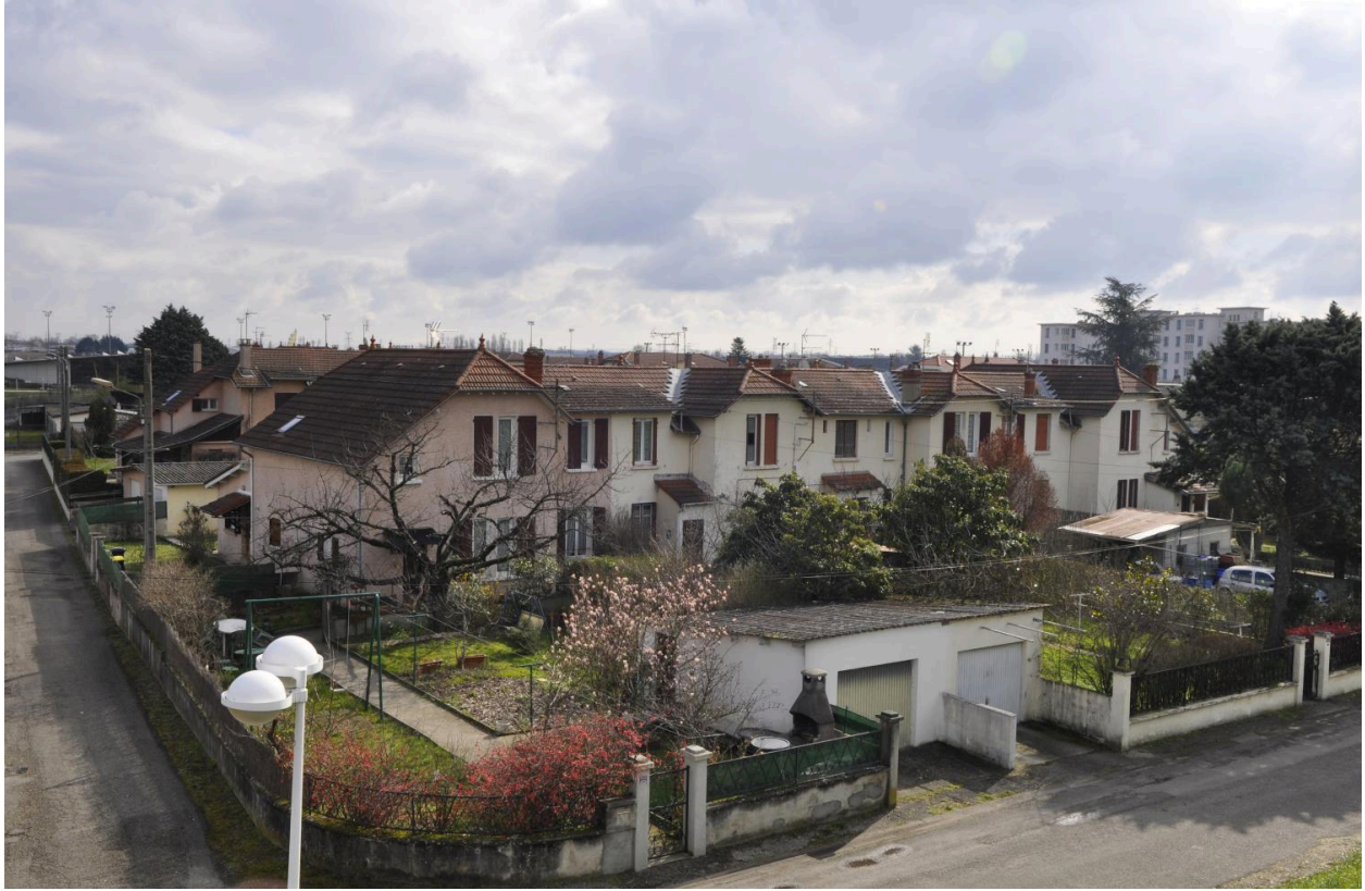
Série de maisons de la cité ouvrière