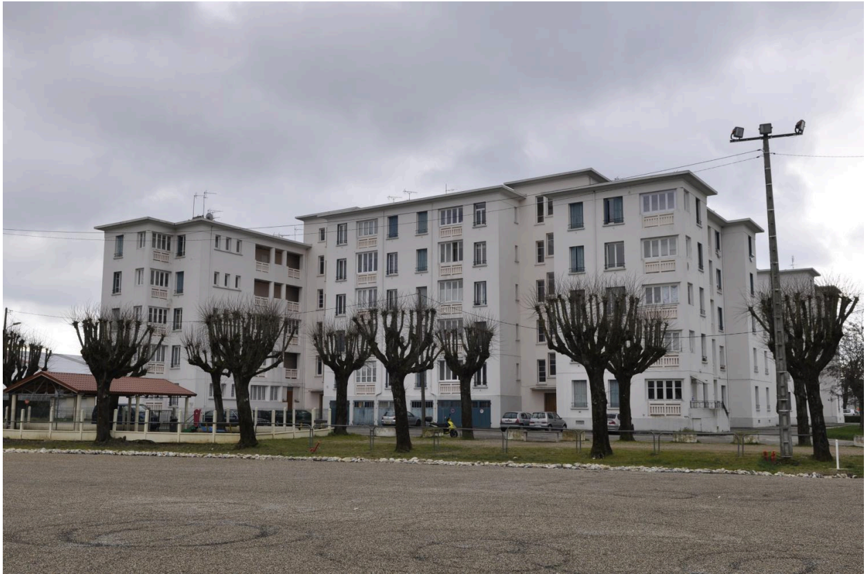
Vue des grandes maisons