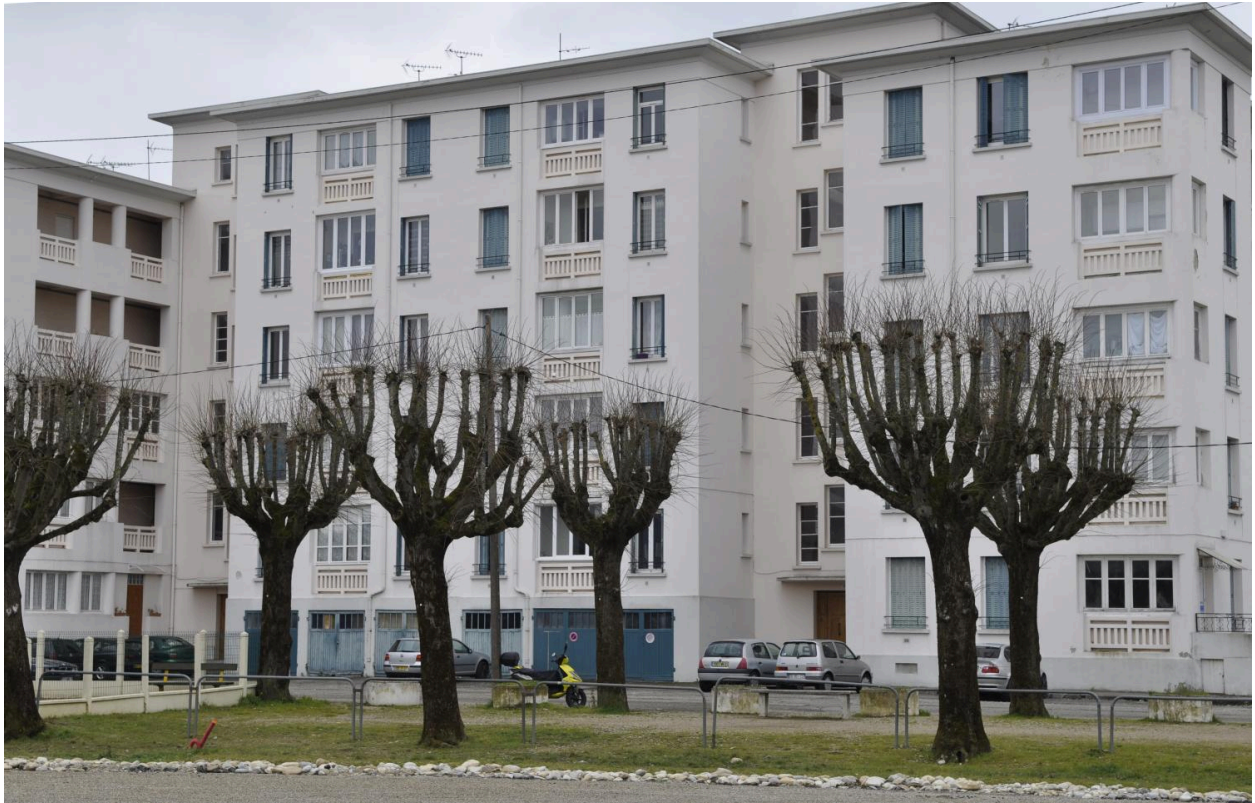
Immeuble des grandes maisons