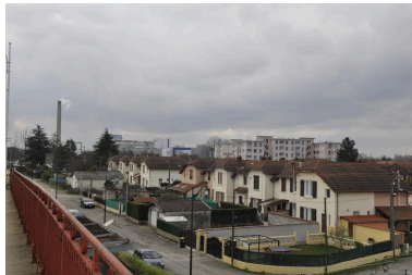
Vue d'ensemble des maisons ouvrières