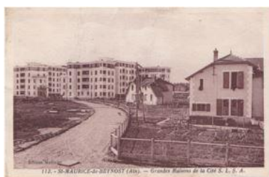
Carte postale, vue des grandes maisons de la cité S.L.S.A. (archive privée)