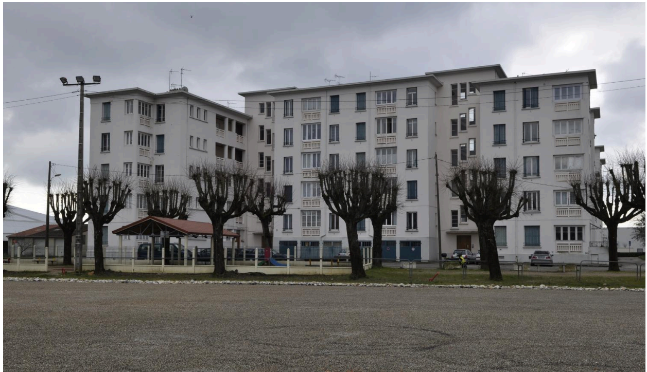
Vue des grandes maisons