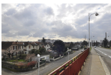
Vue d'ensemble de la cité