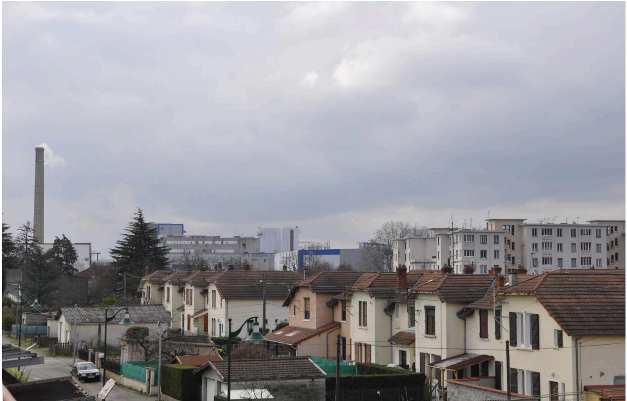
Vue d'ensemble de la cité ouvrière et des grandes maisons