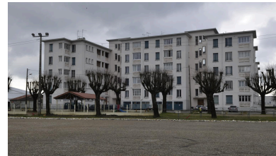
Vue des grandes maisons