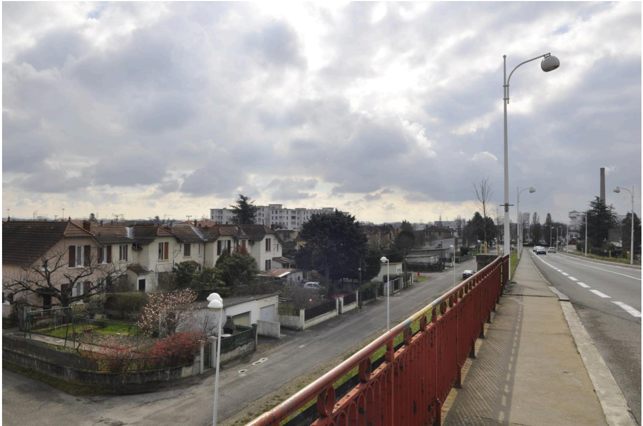
Vue d'ensemble de la cité