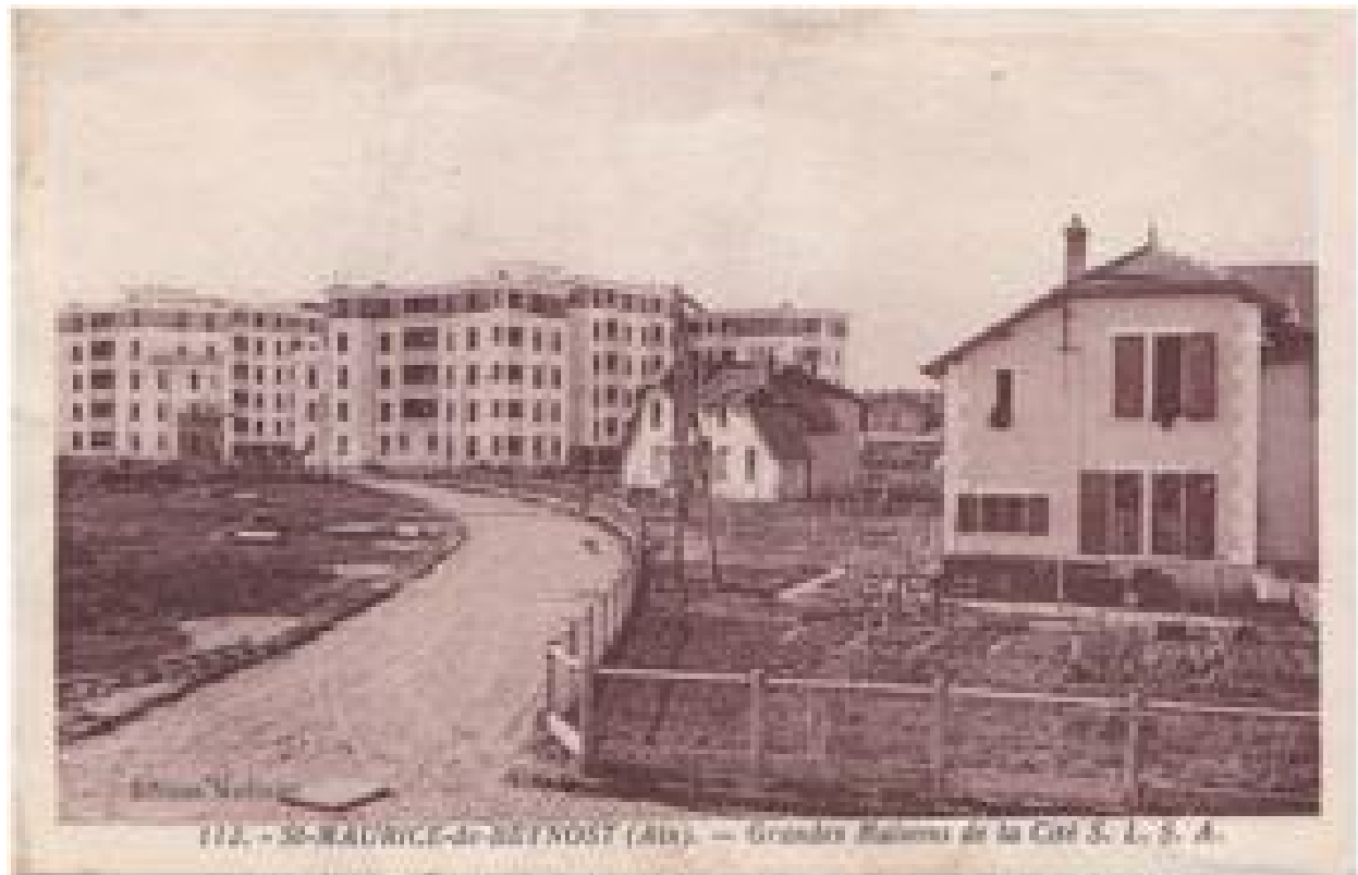
Carte postale, vue des grandes maisons de la cité S.L.S.A.