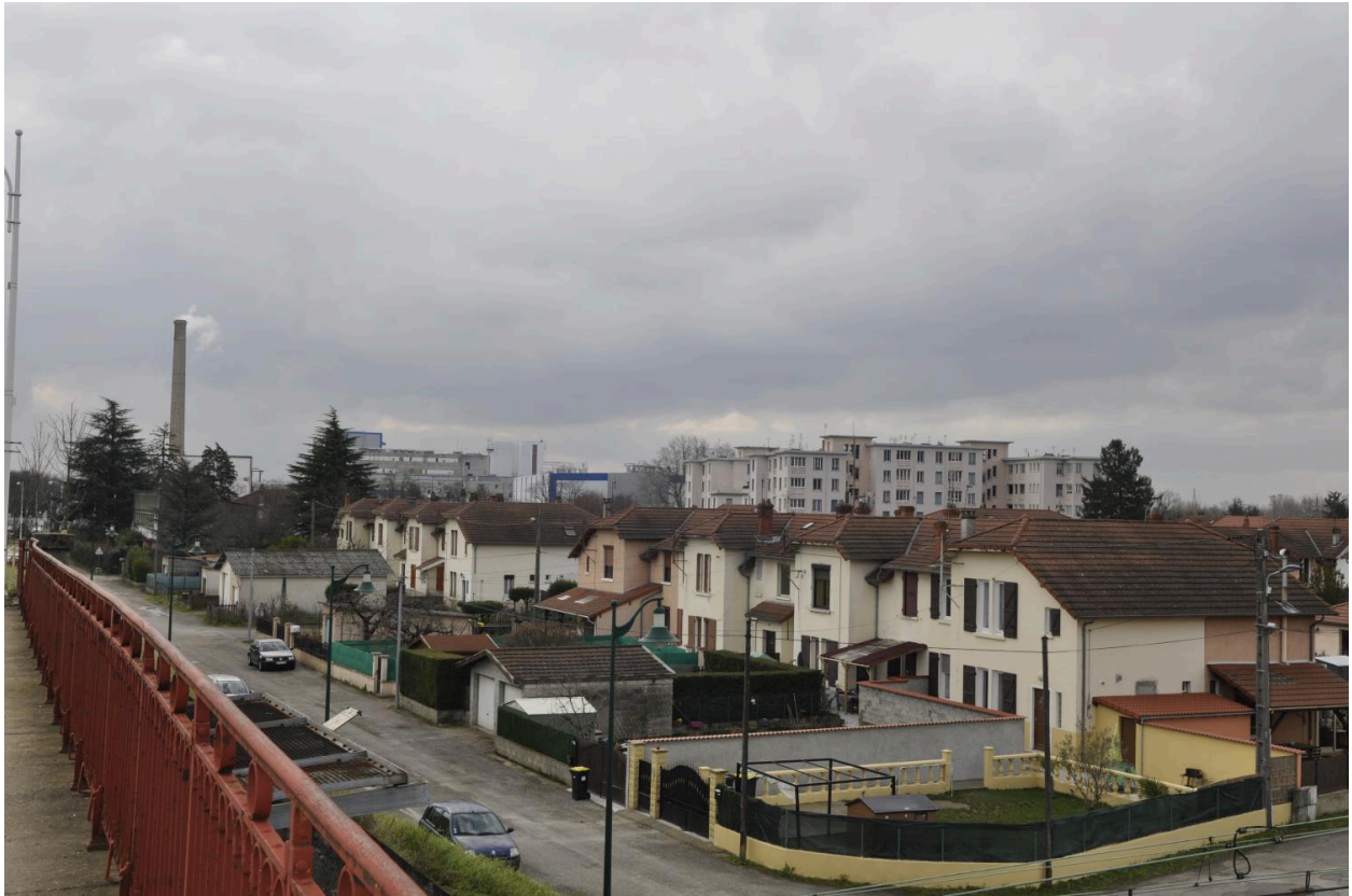
Vue d'ensemble des maisons ouvrières