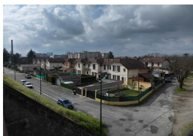
Vue d'ensemble de la cité SLSA