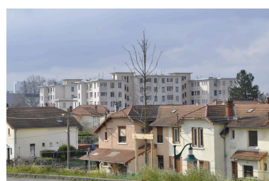
Maisons et grandes maisons de la cité ouvrière