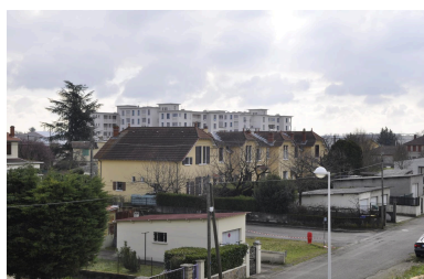
Vue d'ensemble de la cité