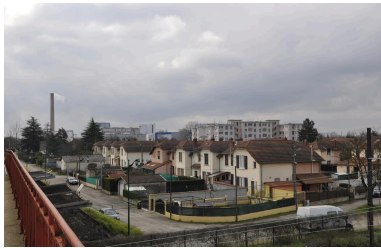
Vue d'ensemble de la cité ouvrière IVR84_20160100125NUCA