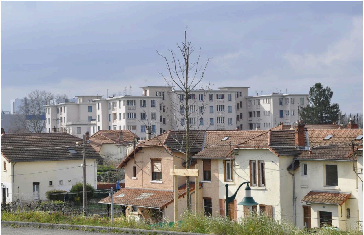
Maisons et grandes maisons de la cité ouvrière