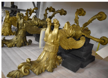
Vue générale IVR84_20226303230NUC4A