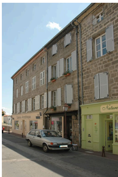
Vue d'ensemble du côté de la rue Saint-Jean.