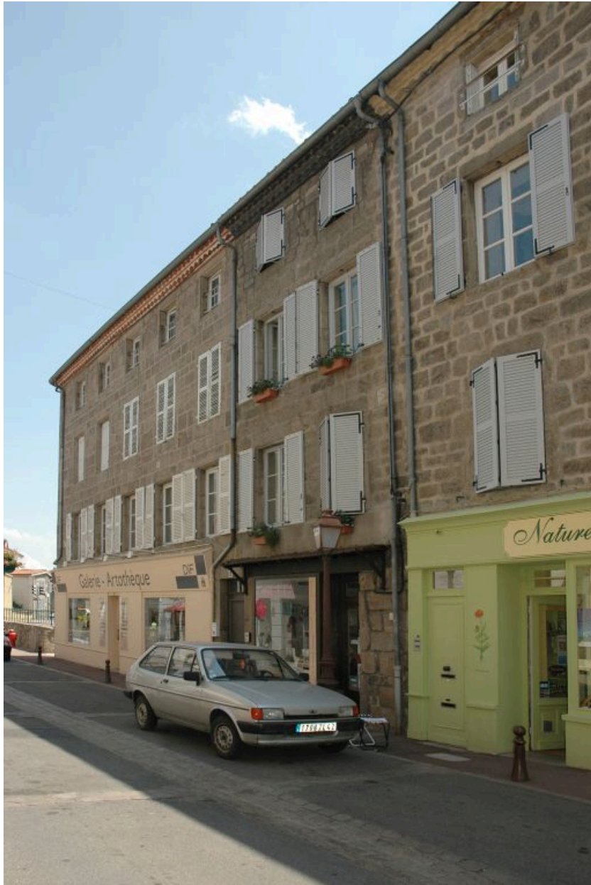
Vue d'ensemble du côté de la rue Saint-Jean.