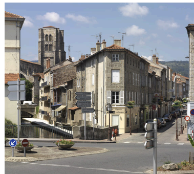
Vue de situation. IVR82_20064202567NUCA