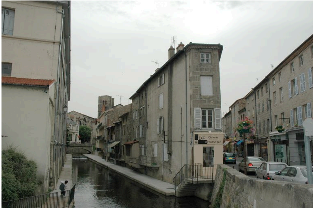
Vue d'ensemble du côté du Vizézy.