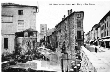
112. Montbrison (Loire)- Le Vizézy et rue St-Jean. Carte postale, [début 20e siècle]. IVR82_20054201776NUCB