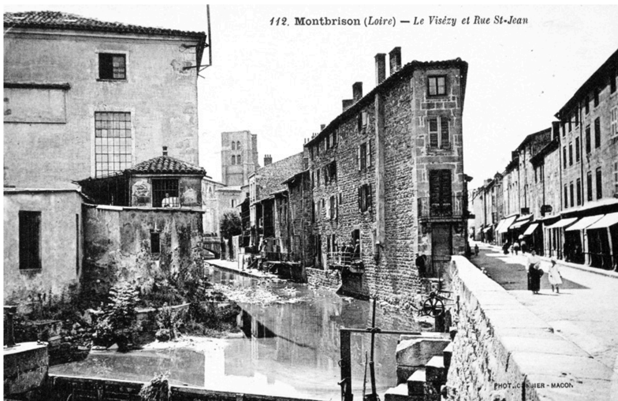
112. Montbrison (Loire)- Le Vizézy et rue St-Jean. Carte postale [début 20e siècle].