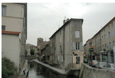
Vue d'ensemble du côté du Vizézy. IVR82_20124201235NUCA