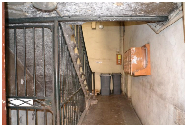
Entrée