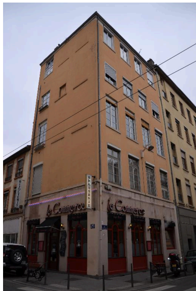
Vue d'ensemble IVR82_20156900559NUCA