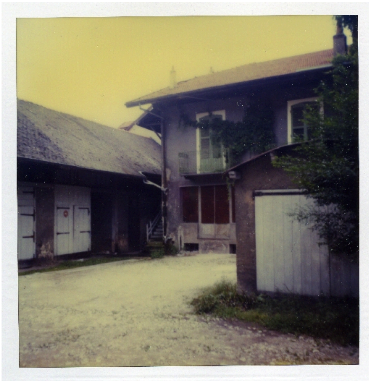
Maison ouest, façade sur cour