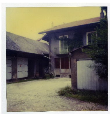
Maison ouest, façade sur cour IVR82_20117300509NUCB