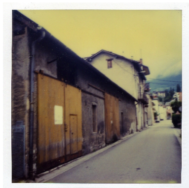
Vue depuis la rue de la Cité