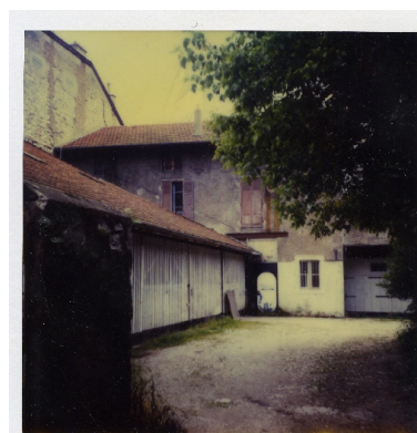
Appentis et habitation sur la cour IVR82_20117300508NUCB