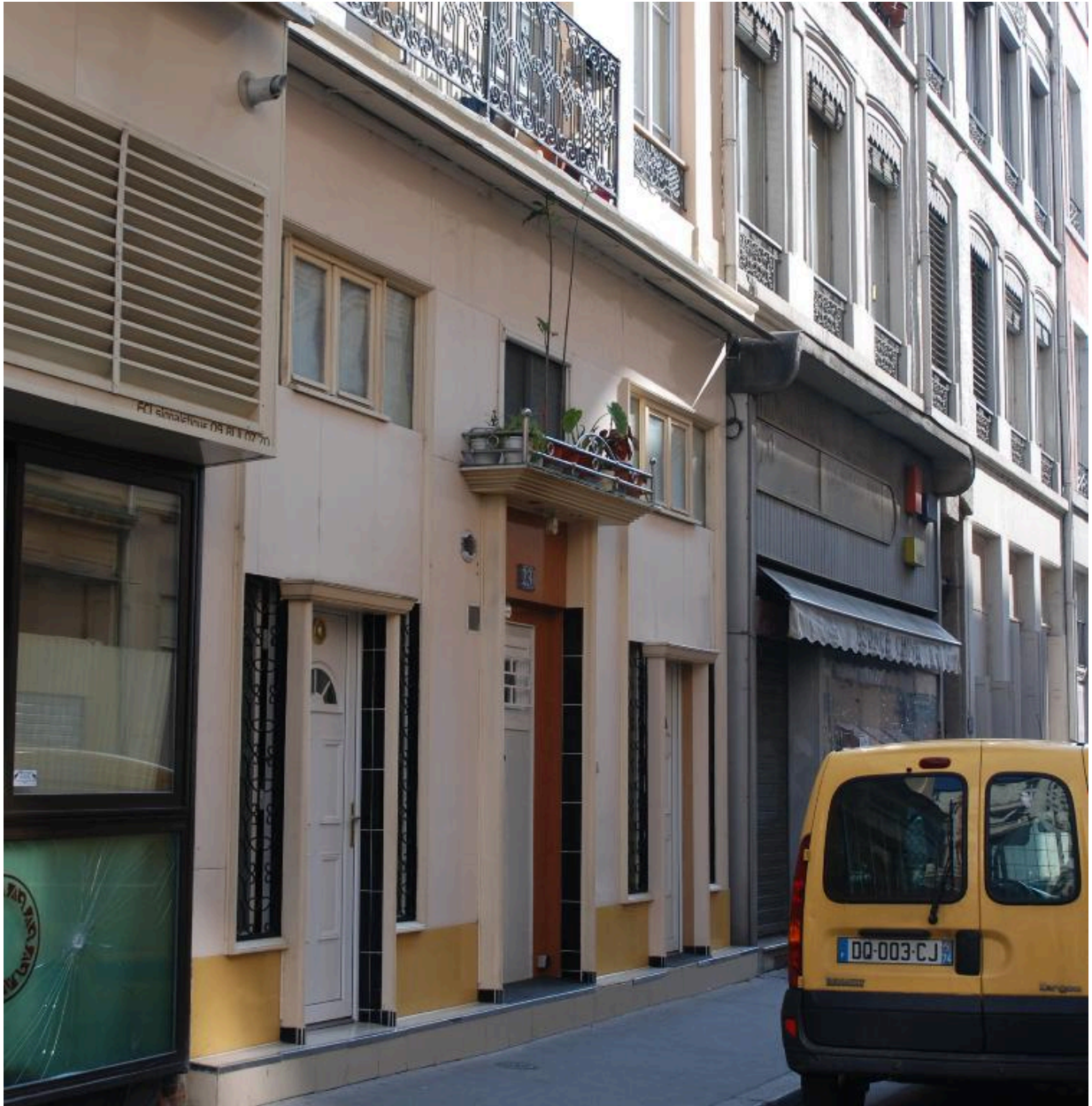
Détail de l'élévation sur rue Montesquieu : logement indépendant en rez-de-chaussée