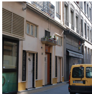
Détail de l'élévation sur rue Montesquieu : logement indépendant en rez-de-chaussée IVR84_20166900532NUCA