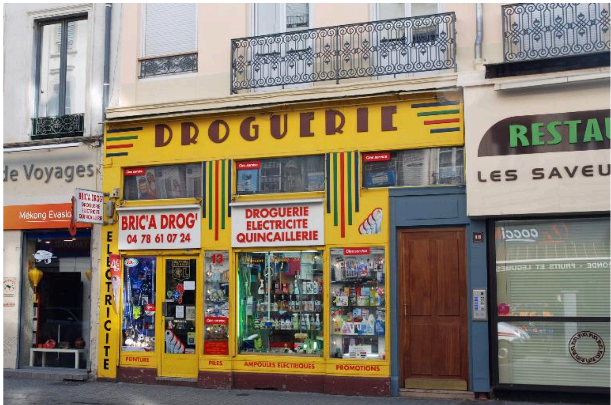
Détail de l'élévation sur rue de Marseille : devanture de droguerie