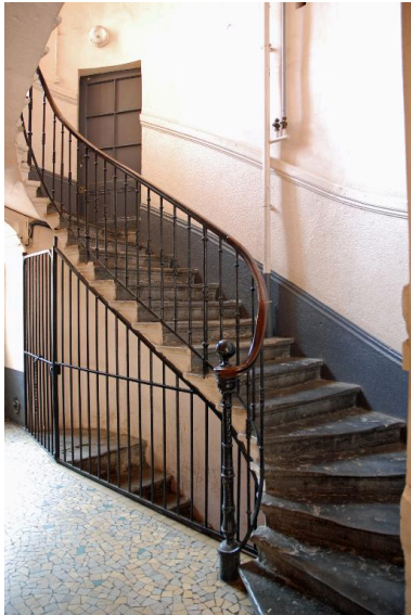
Vue intérieure : le départ de l'escalier