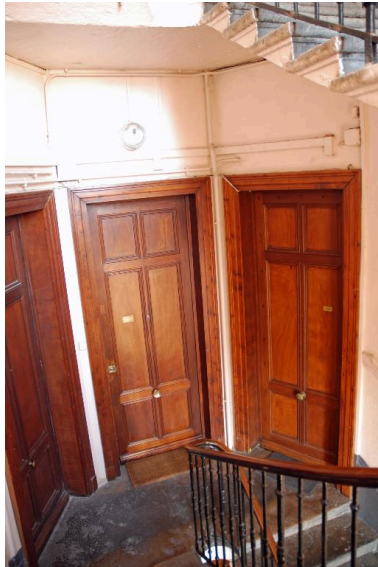
Vue intérieure : un palier de plan trapézoïdal