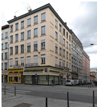
Vue d'ensemble, depuis le sud-ouest IVR84_20166901412NUCA