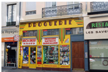
Détail de l'élévation sur rue de Marseille : devanture de droguerie IVR84_20166900530NUCA