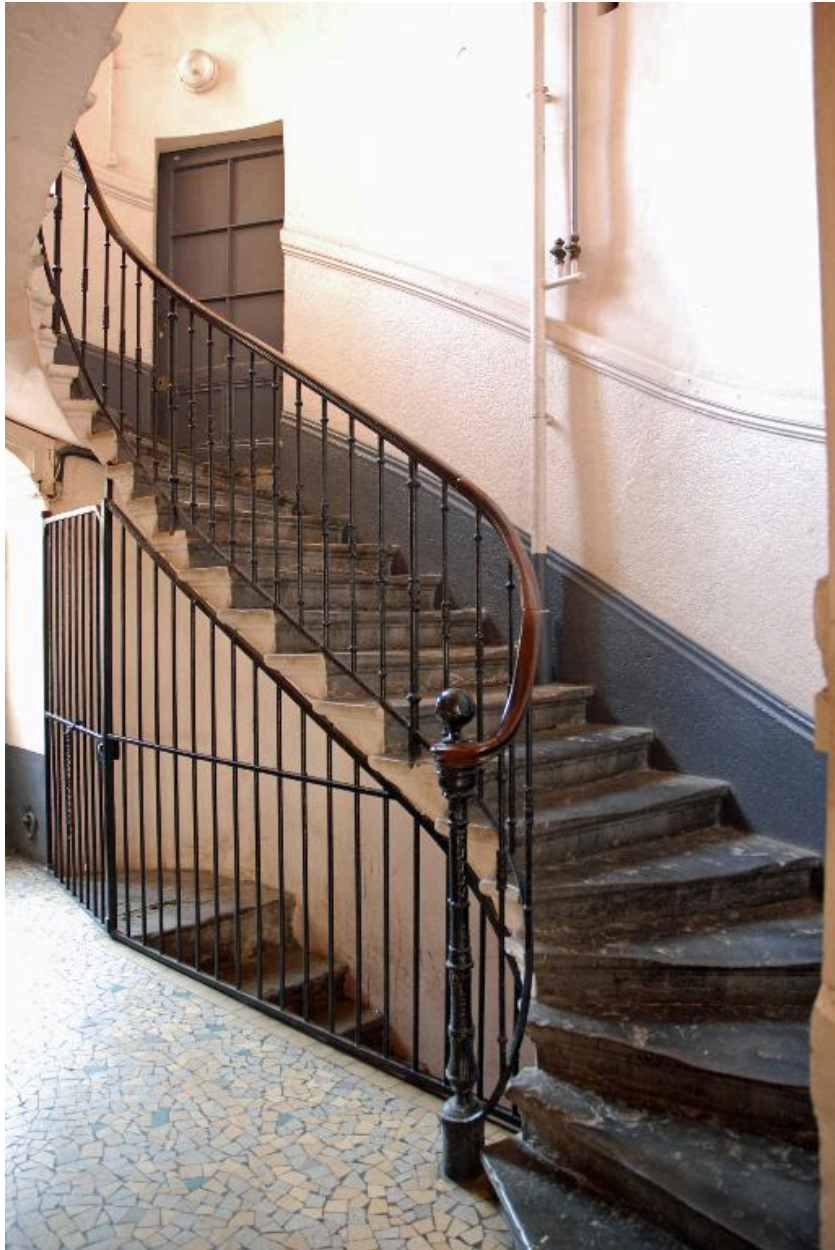
Vue intérieure : le départ de l'escalier