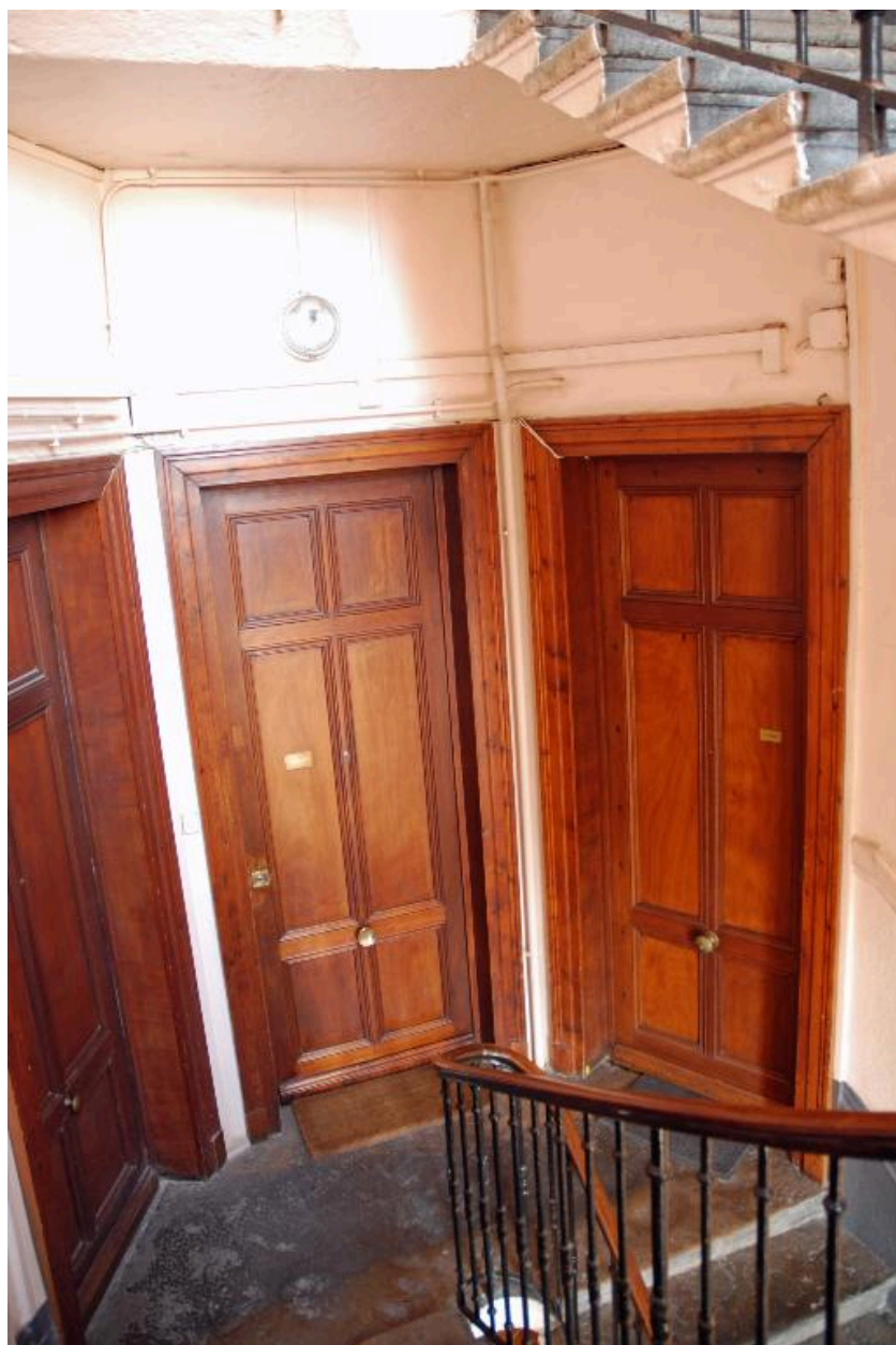
Vue intérieure : un palier de plan trapézoïdal