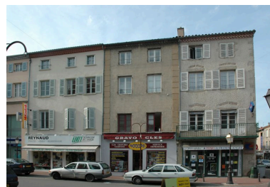
Vue générale, maison à deux travées (au centre). IVR82_20124202740NUCA