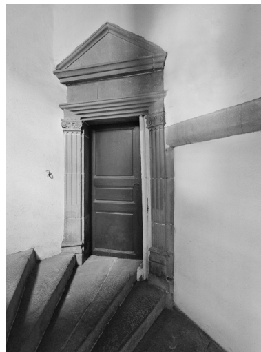
Porte palière de l'escalier en vis accessible par la rue Chevenotterie. IVR82_20064201983V