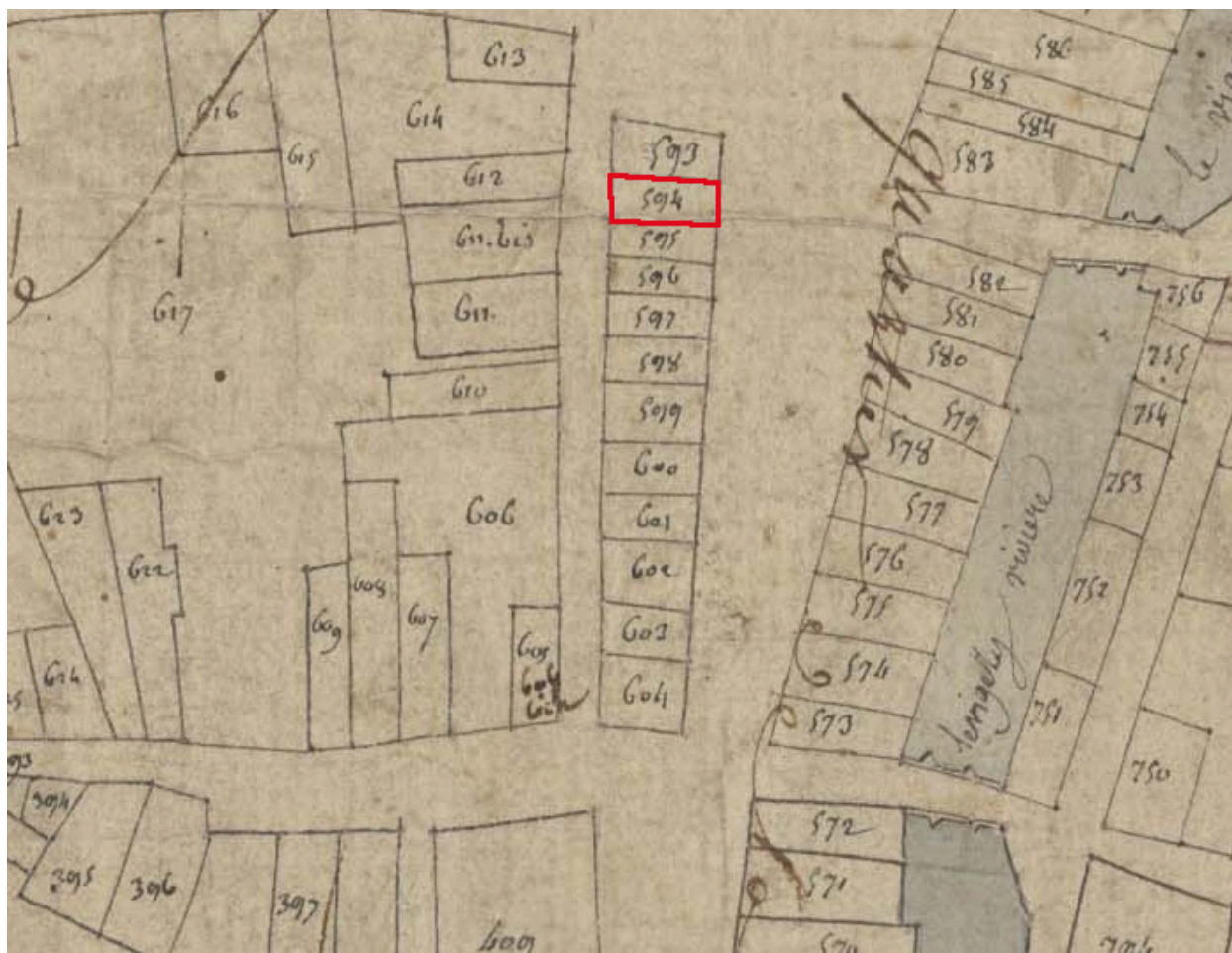
Extrait du plan cadastral de 1809, parcelle E 594.