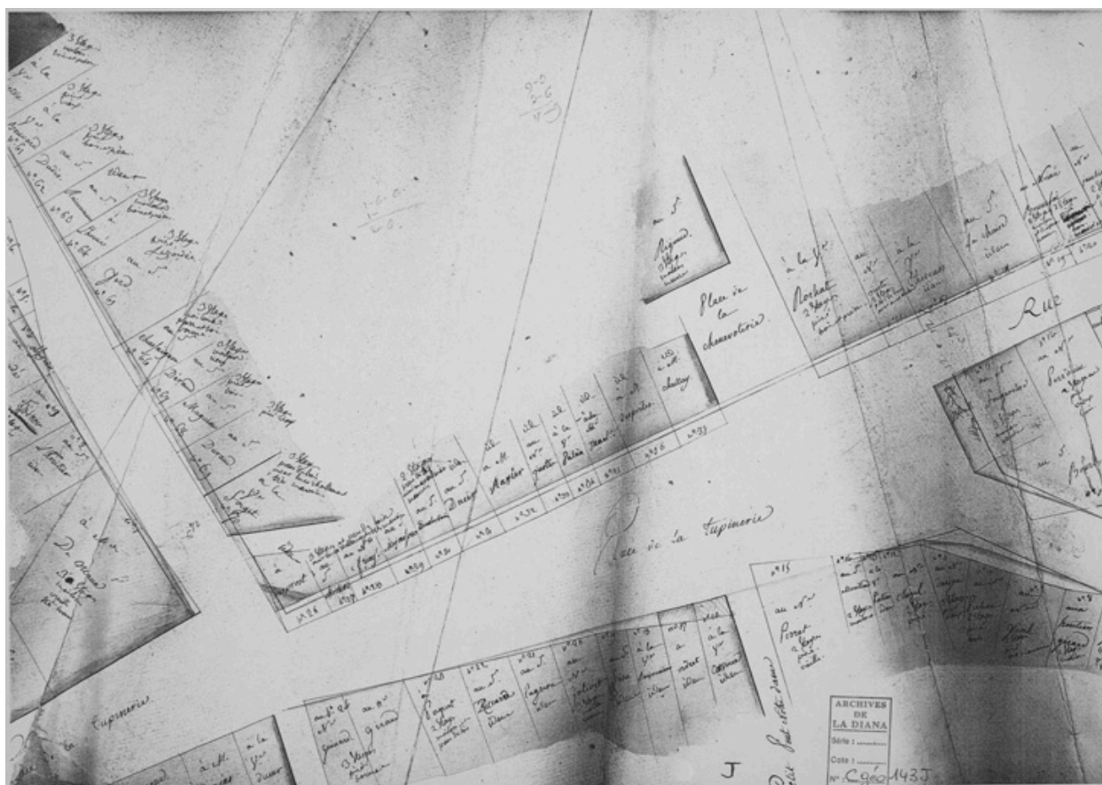
Extrait de la Traversée de Montbrison en 1780, maisons n° 36 place de la Tupinerie. plan de 1780, photocopie B Diana Montbrison. C Géo 143