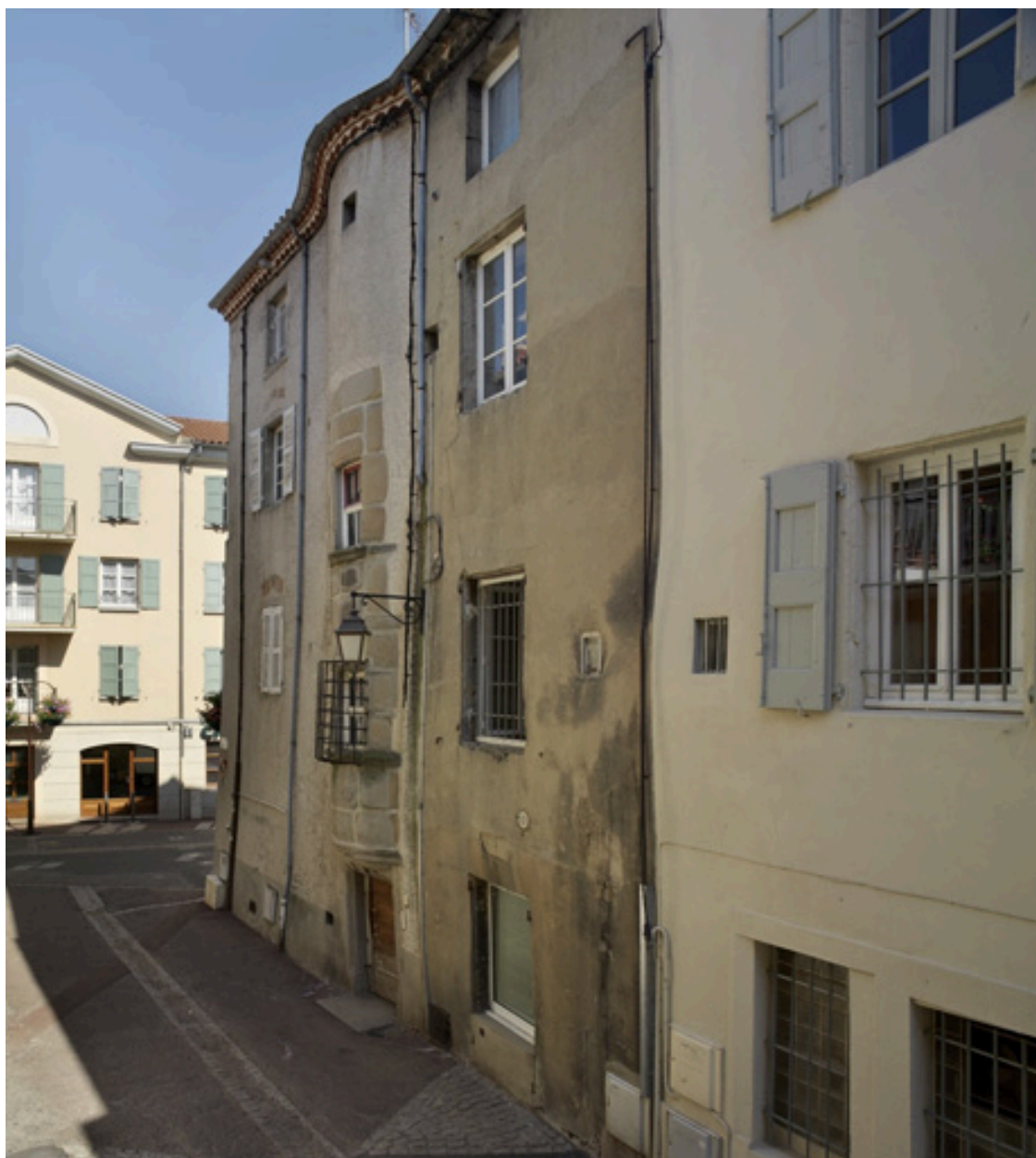
Elévation sur la rue Chenevotterie.