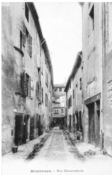
Montbrison - Rue Chenevotterie. Carte postale, début 20e siècle (?). Au 1er plan à gauche, l'escalier demi-hors-oeuvre. IVR82_20054201647NUCB