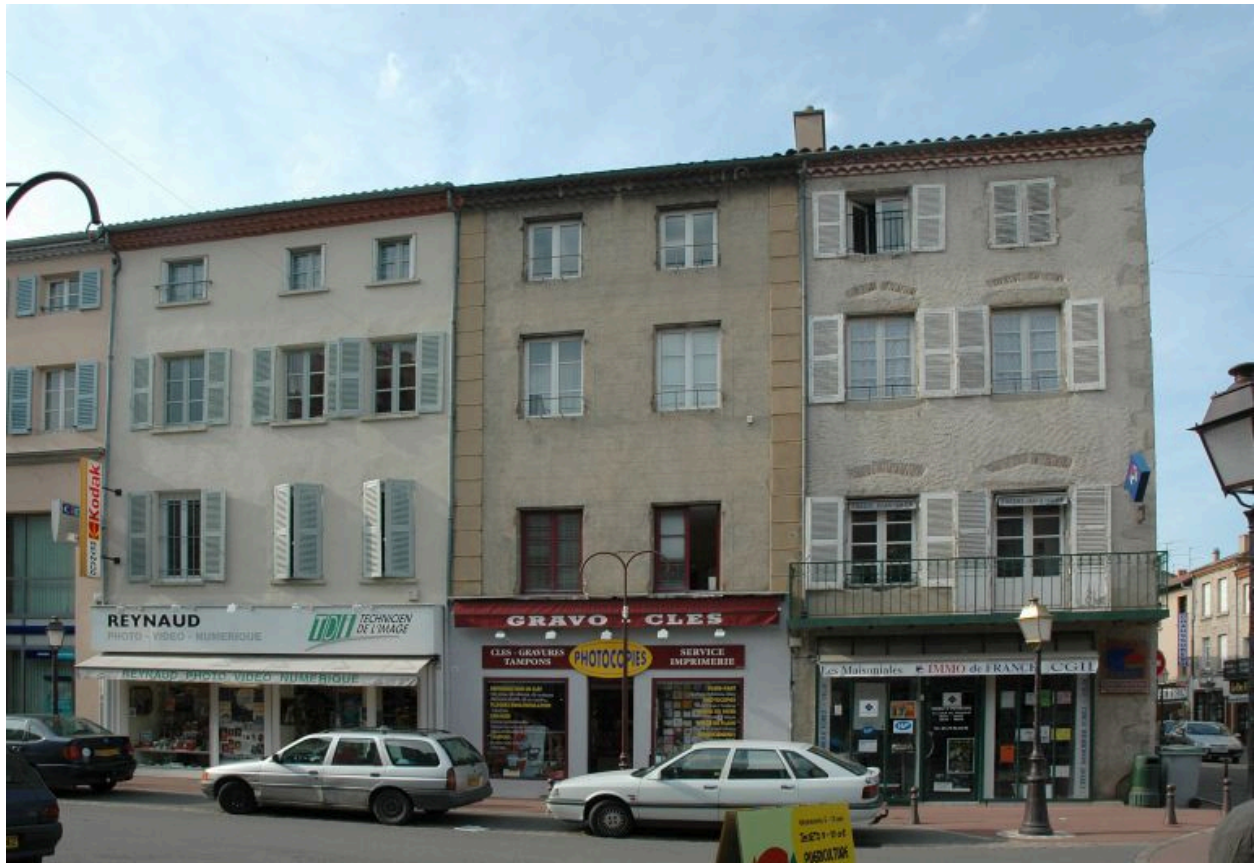
Vue générale, maison à deux travées (au centre).