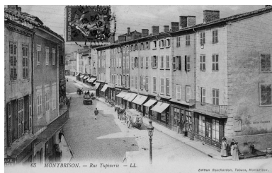
65 - MONTBRISON.- Rue Tupinerie - LL. ED. Bouchardon. Carte postale, vers 1912. Vue de situation. IVR82_20054201627NUCB