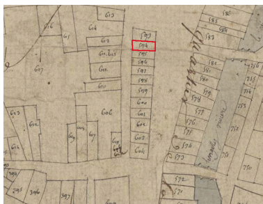
Extrait du plan cadastral de 1809, parcelle E 594. IVR82_20124202742NUD