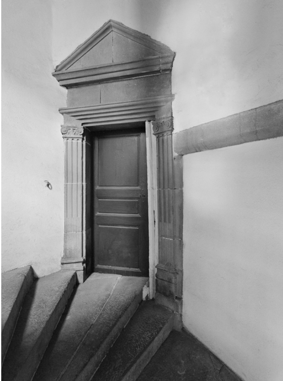
Porte palière de l'escalier en vis accessible par la rue Chevenotterie.