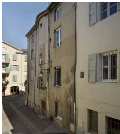
Elévation sur la rue Chenevotterie. IVR82_20064200690NUCA