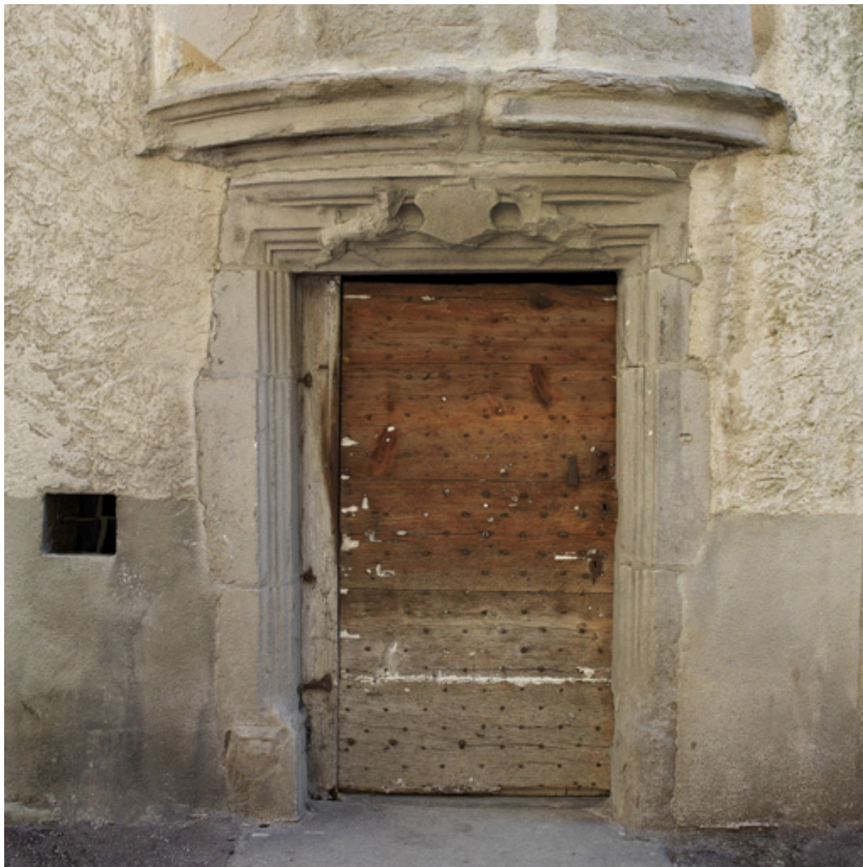
Porte piétonne de l'escalier en vis demi hors oeuvre, sur la rue Chenevotterie.