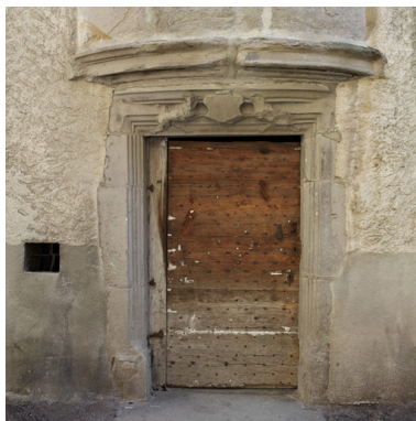
Porte piétonne de l'escalier en vis demi hors oeuvre, sur la rue Chenevotterie. IVR82_20064200688NUCA