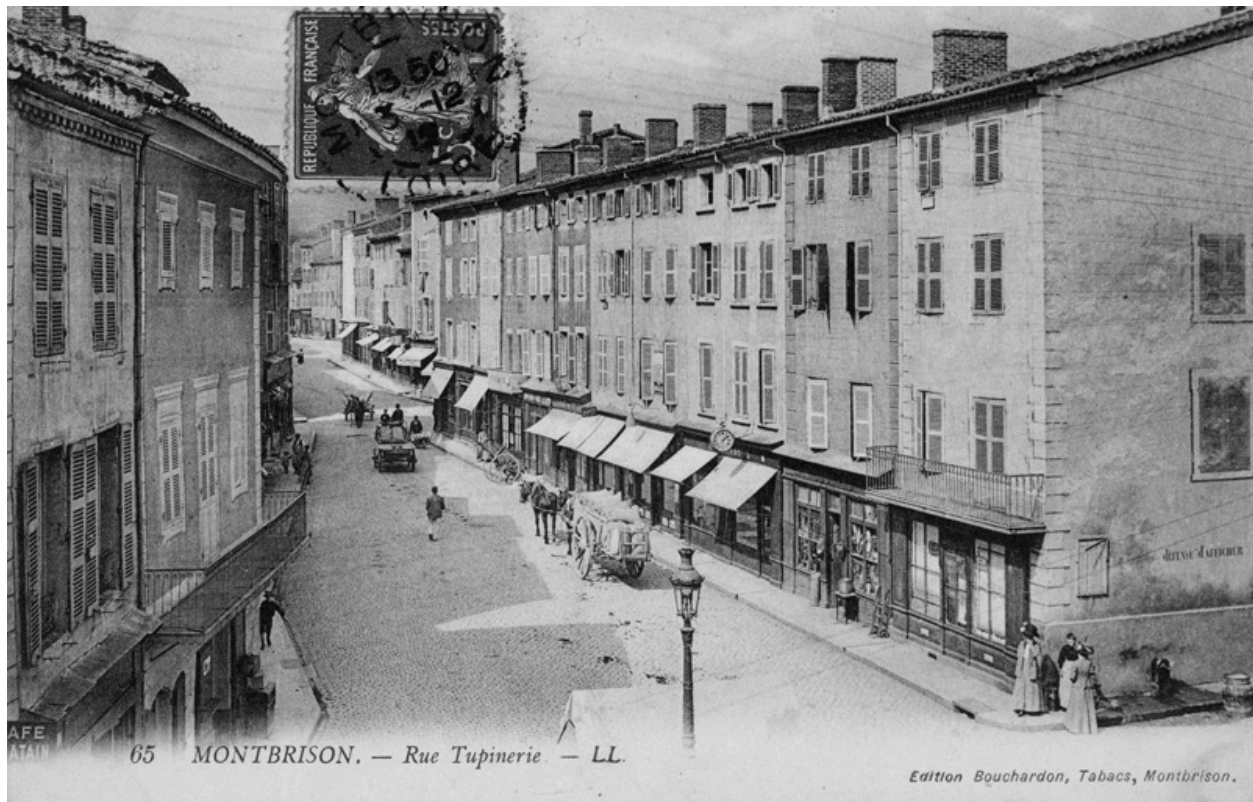
65 - MONTBRISON.- Rue Tupinerie - LL. ED. Bouchardon. Carte postale, vers 1912. Vue de situation.