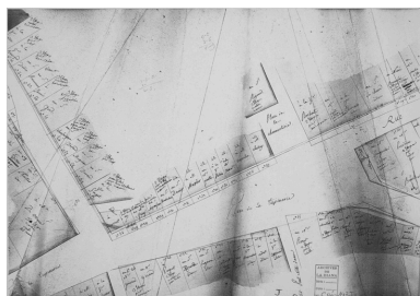
Extrait de la Traversée de Montbrison en 1780, maisons n° 36 place de la Tupinerie. plan de 1780, C Géo 143 IVR82_20084200306NUC