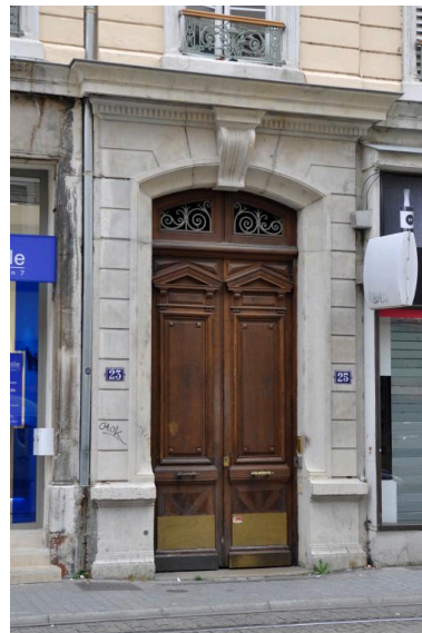
Elévation antérieure : porte bâtarde