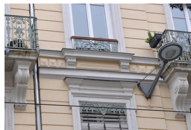
Détail : décor et encadrement des baies, élévation antérieure