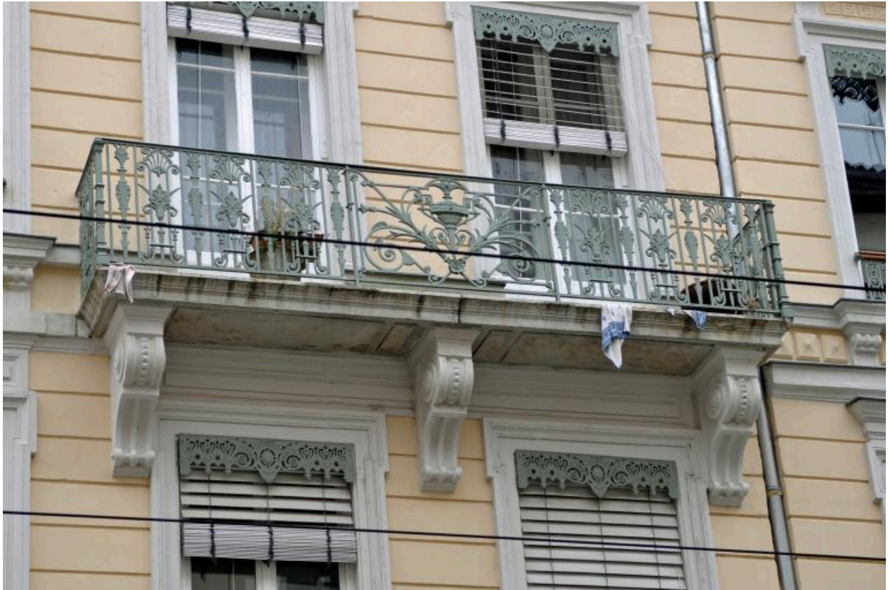
Détail : balcon au 2ème étage, élévation antérieure