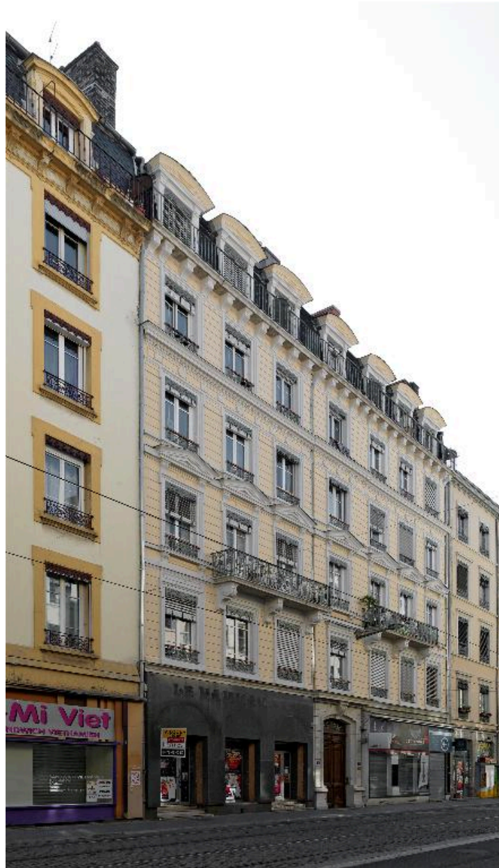
Elévation antérieure, rue de Marseille