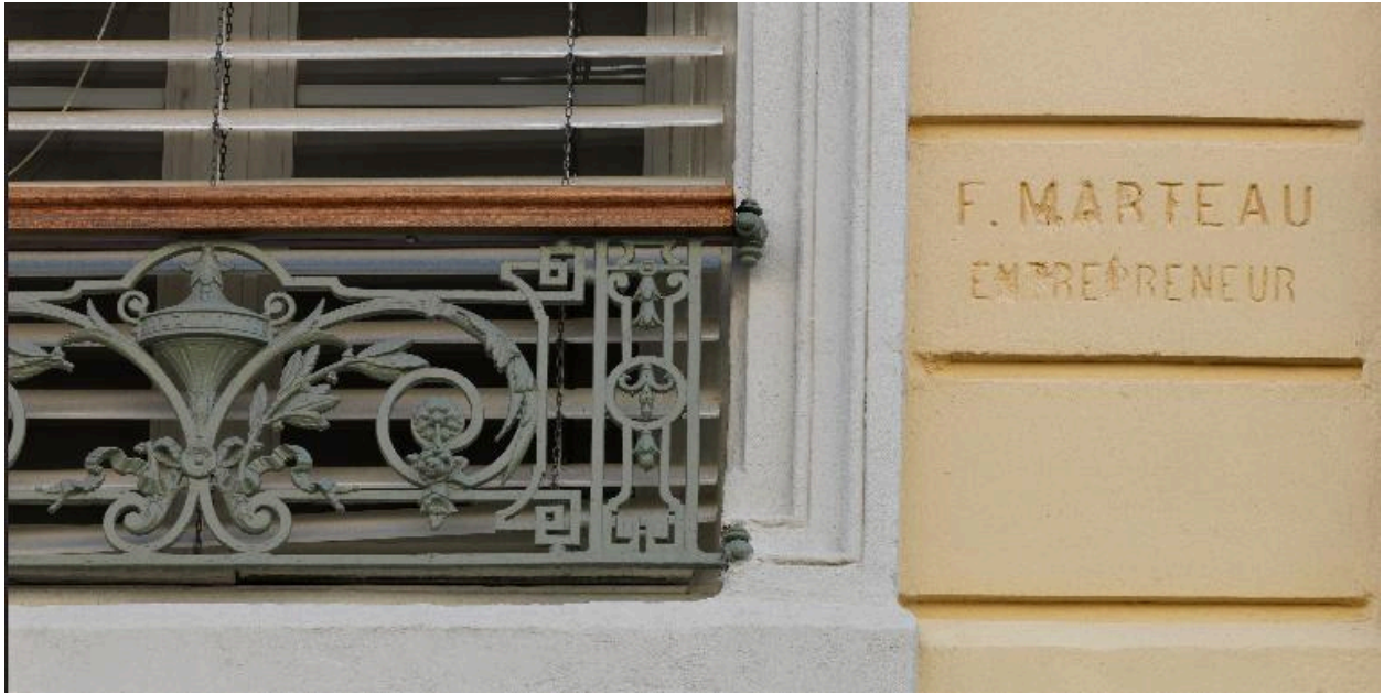
Détail : signature de l'entrepreneur, dans l'angle sud de la façade au premier étage