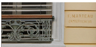
Détail : signature de l'entrepreneur, dans l'angle sud de la façade au premier étage IVR84_20176900457NUCA