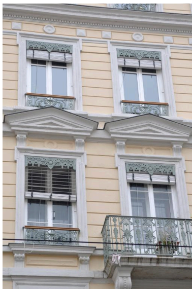
Détail : décor et encadrement des baies, élévation antérieure IVR84_20186900883NUCA