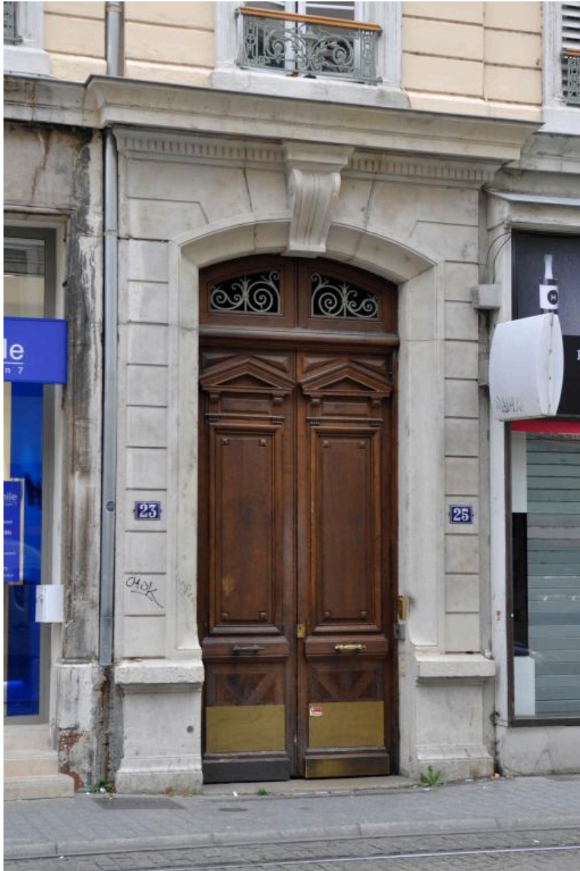
Elévation antérieure : porte bâtarde