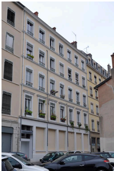
Elévation postérieure, rue Saint-André IVR84_20186900880NUCA