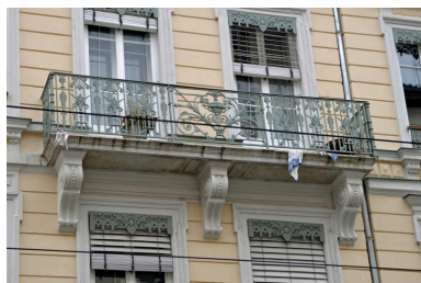
Détail : balcon au 2ème étage, élévation antérieure IVR84_20186900882NUCA