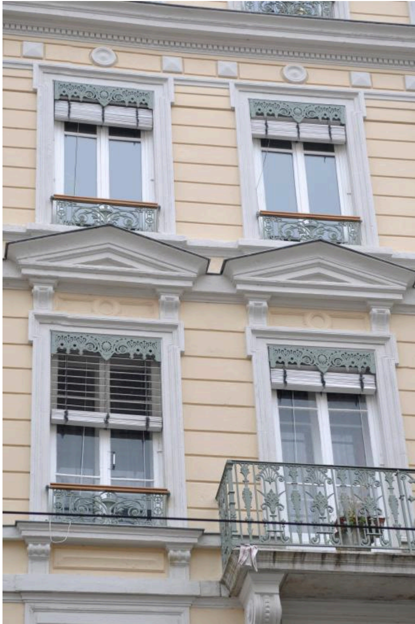
Détail : décor et encadrement des baies, élévation antérieure