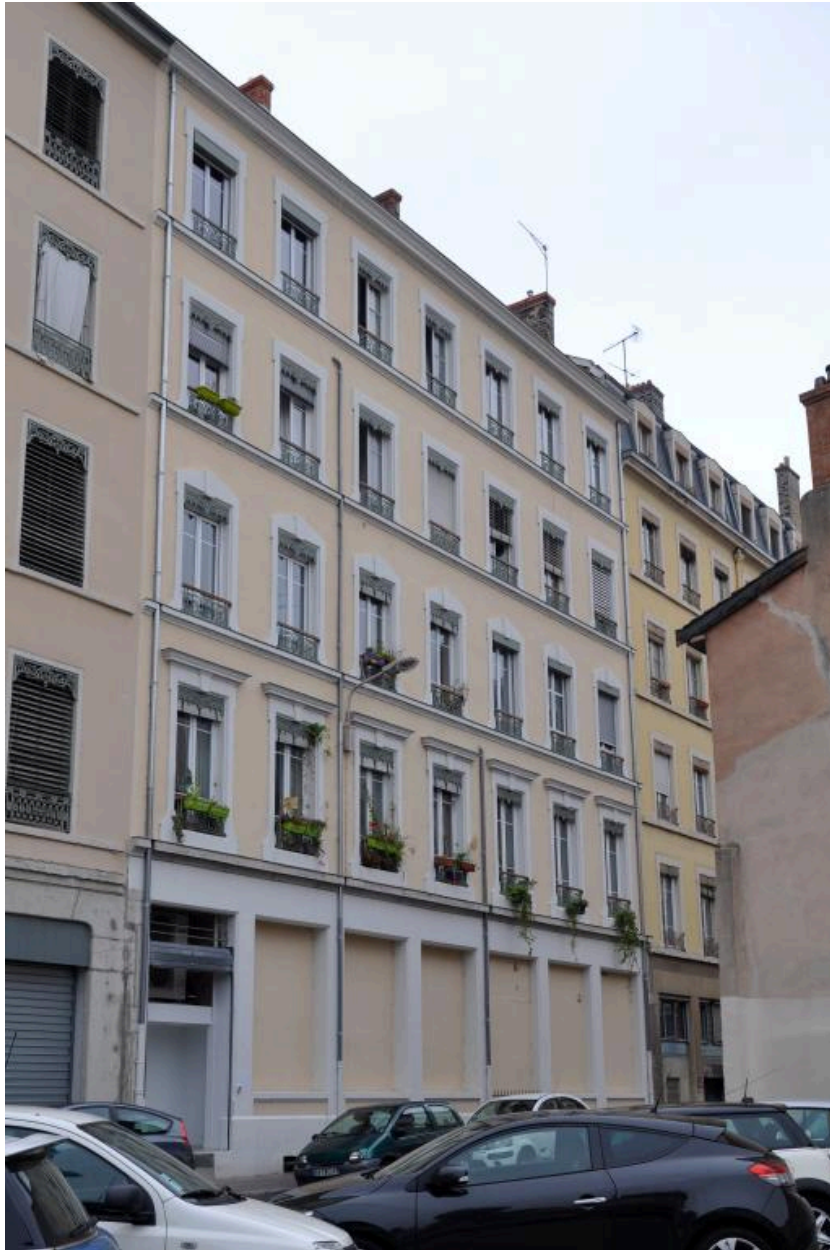
Elévation postérieure, rue Saint-André