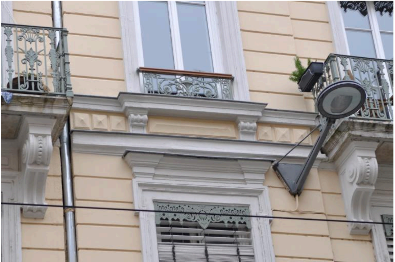
Détail : décor et encadrement des baies, élévation antérieure