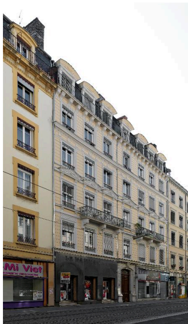
Elévation antérieure, rue de Marseille