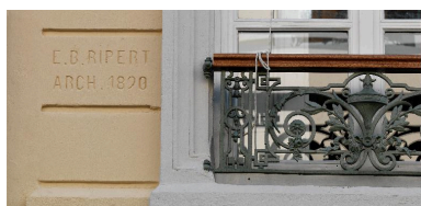
Détail : signature de l'architecte, dans l'angle nord de la façade, au premier étage