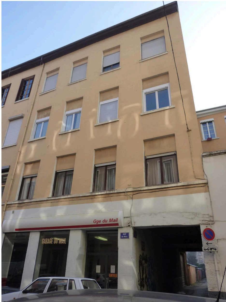
Vue d'ensemble de l'immeuble-atelier du 28 rue du mail