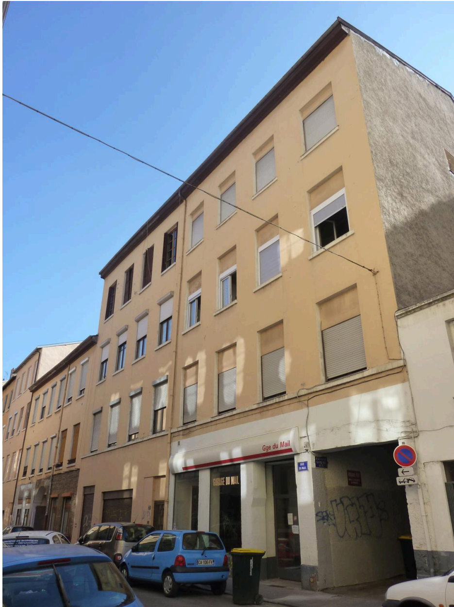
Vue d'ensemble façade principale