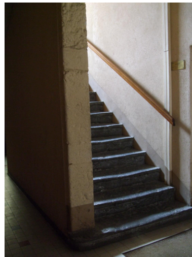
Départ emmarchement IVR84_20186901258NUCA