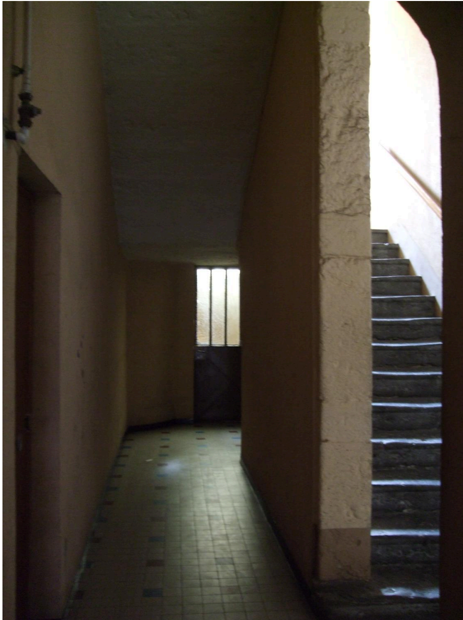
Vue des escaliers noyau plein