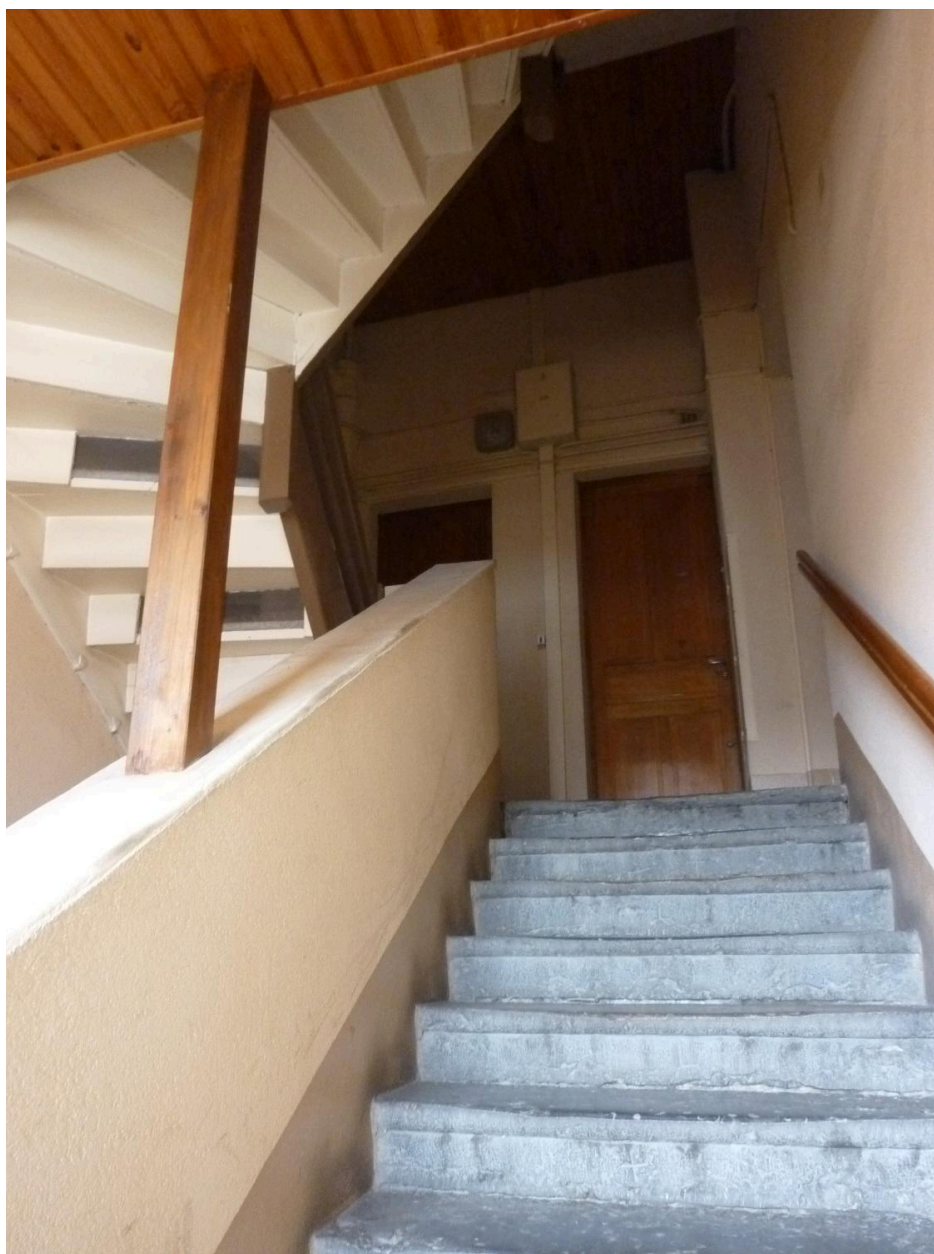
Escalier dernier niveau