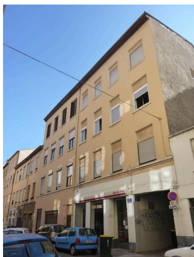
Vue d'ensemble façade principale