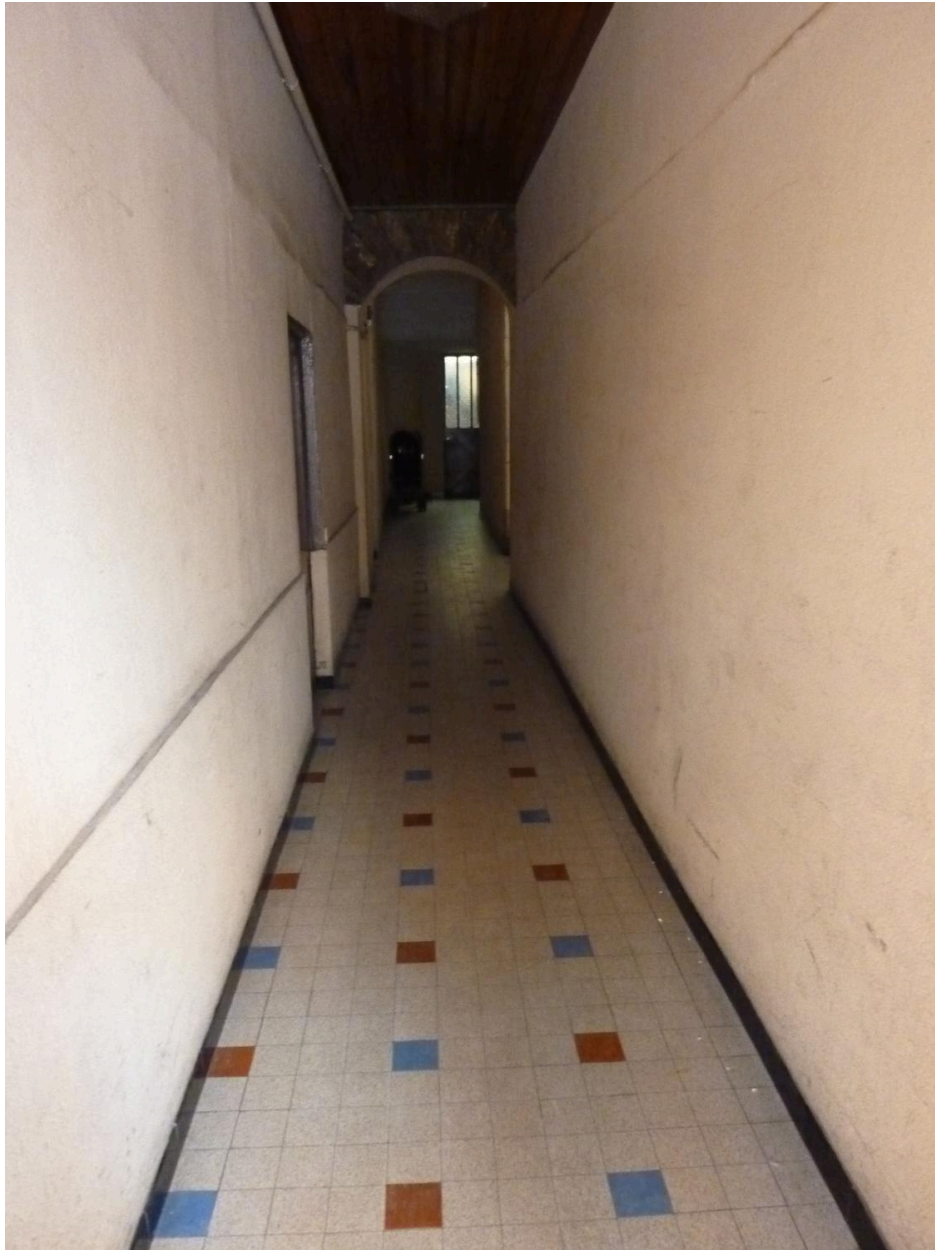
Vue de l'entrée principale