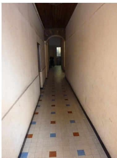
Vue de l'entrée principale