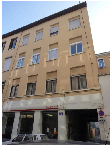
Vue d'ensemble de l'immeuble-atelier du 28 rue du mail IVR84_20186901256NUCA