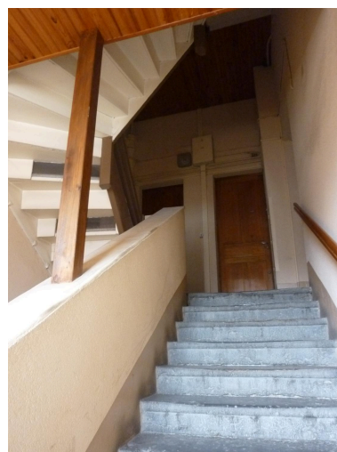
Escalier dernier niveau IVR84_20186901261NUCA